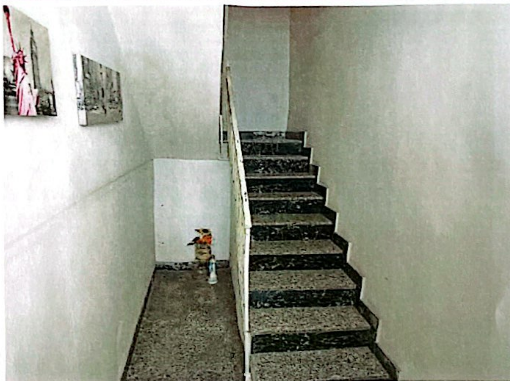
Foto 2: Vista del vano scala accessibile dal civico n. 37 della Via G. Carducci

Dott. Ing. Scarnato Francesco Viale Scala Greca n. 242 – Siracusa Tel. 0931/750514 e-mail: ing.scarnato@libero.it