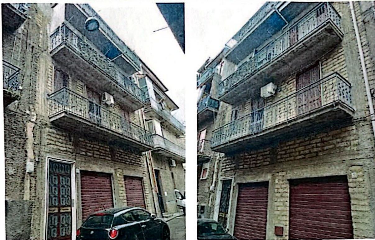
Foto 1: Vista della palazzina su quattro elevazioni sita nella Via G. Carducci n.37-39-41