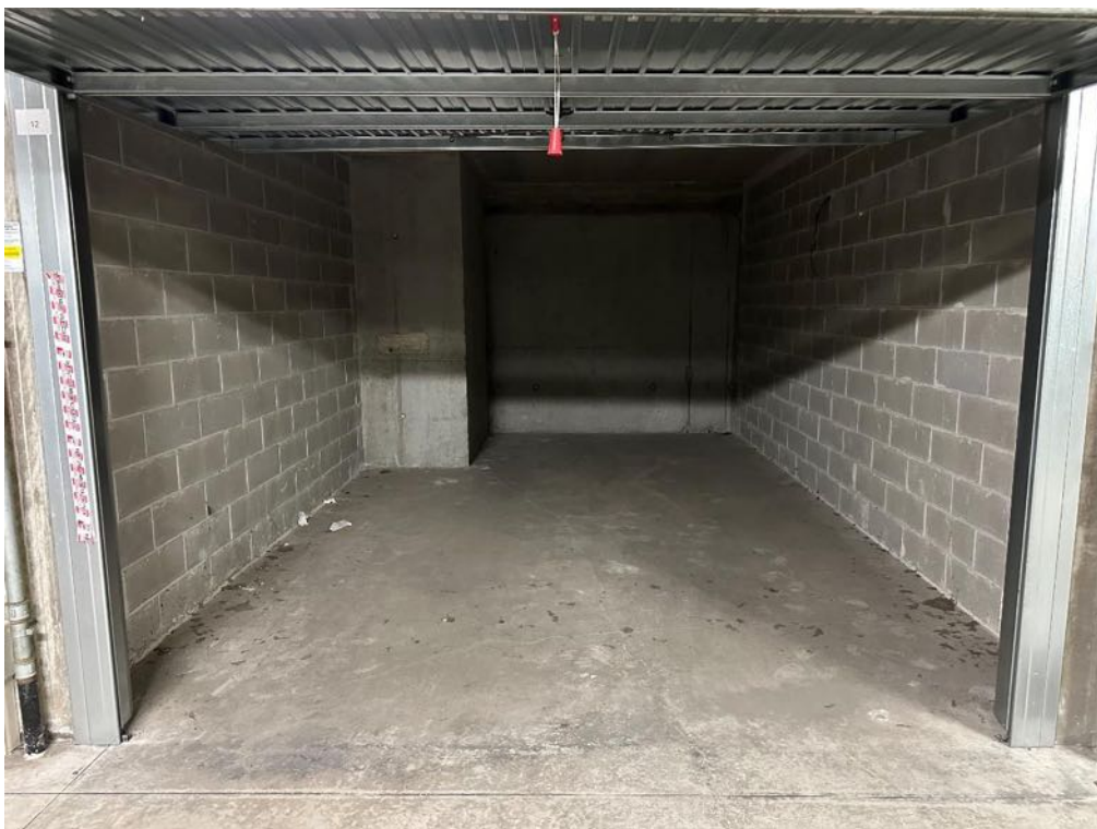
Box (foto 2)