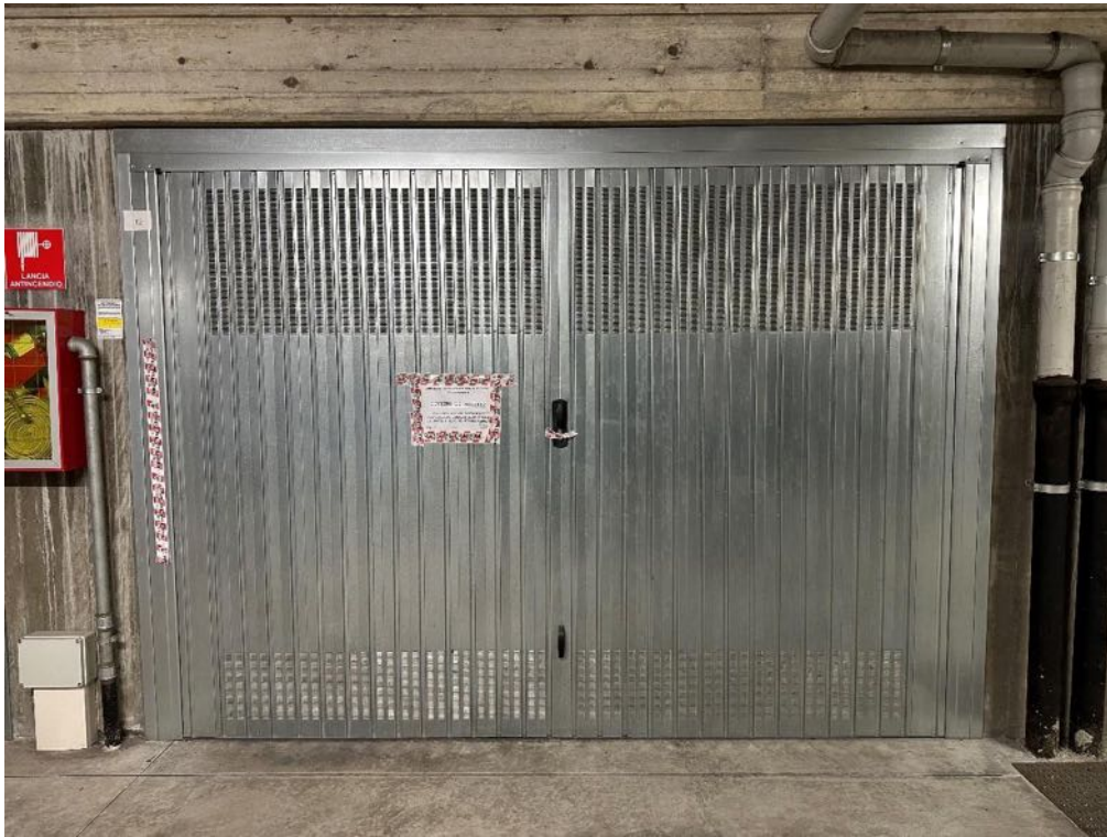
Box (foto 1)