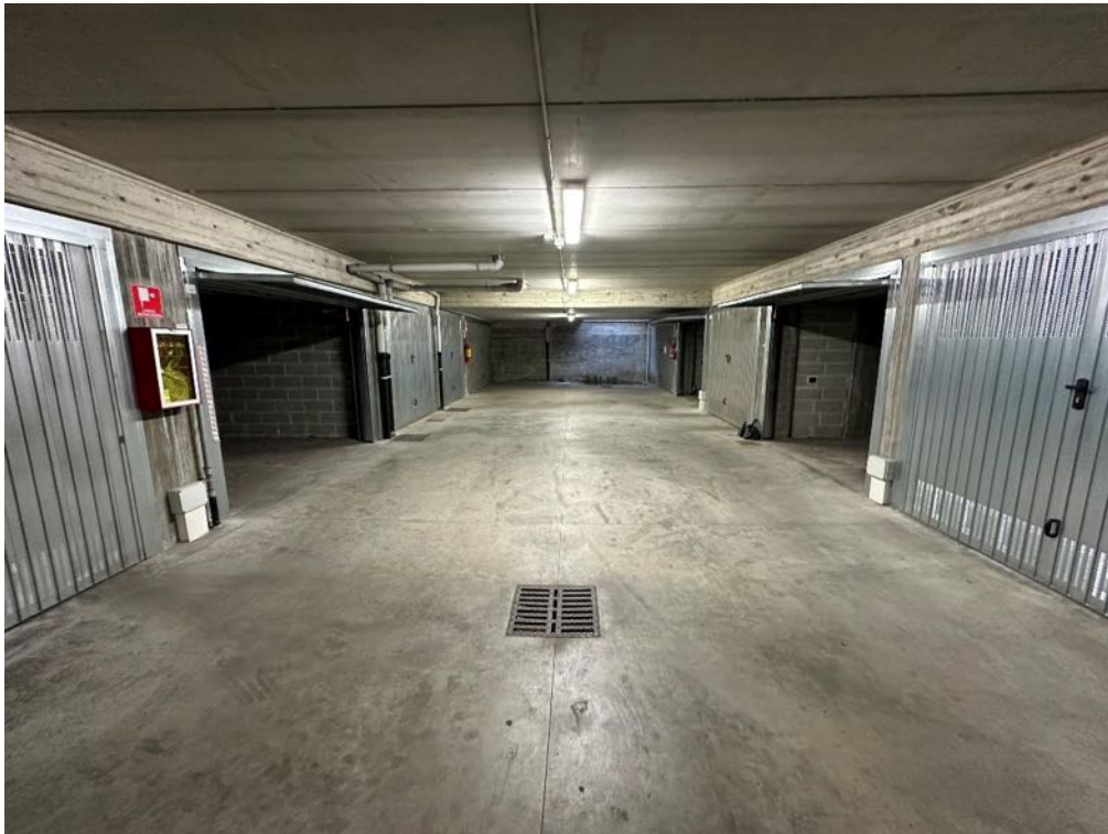
Corsello carraio condominiale (foto 1)