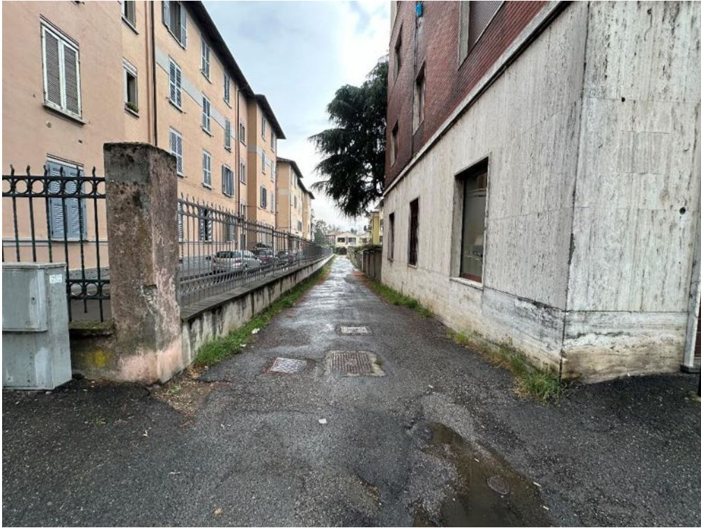
Viale Partigiani - Strada di accesso (foto 1)