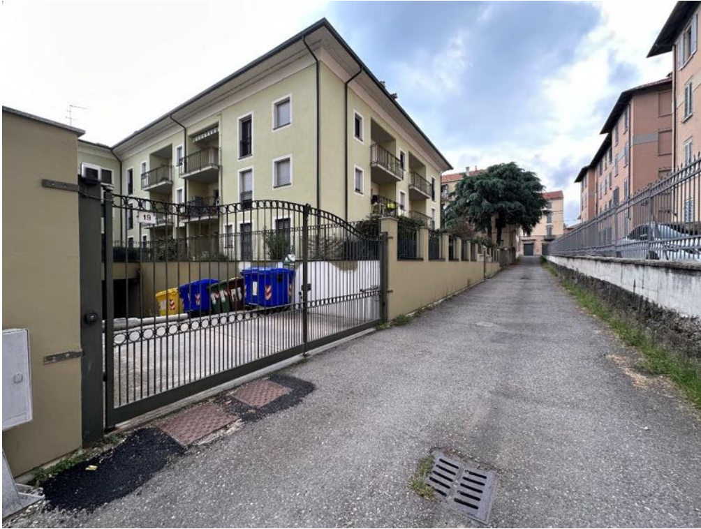
Viale Partigiani - Strada di accesso (foto 3)