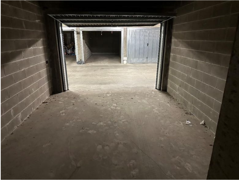
Box (foto 3)