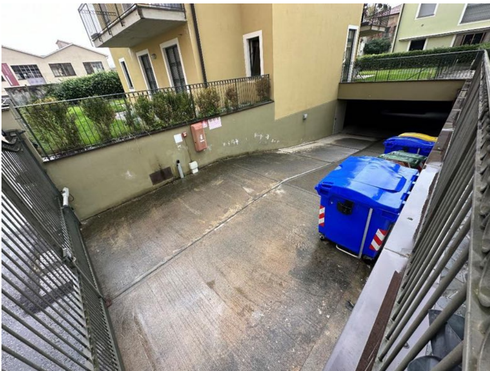
Rampa carrabile (foto 2)