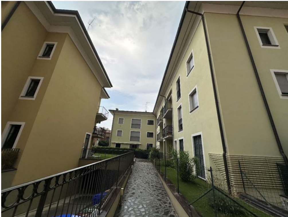
Fabbricato - Vista da parti comuni (foto 2)