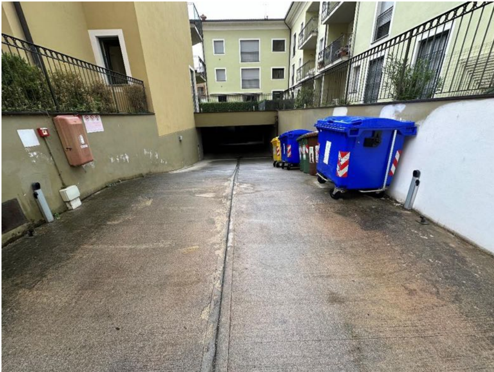
Rampa carrabile (foto 1)