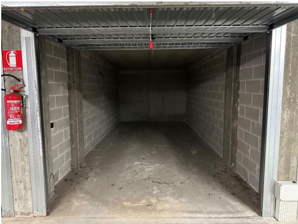
Box (foto 2)