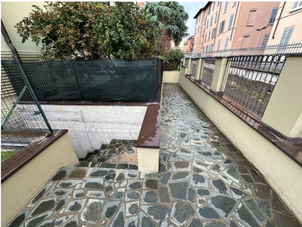
Passaggio pedonale (foto 2)