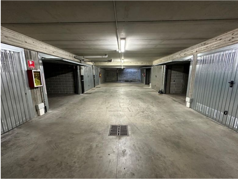
Corsello carraio condominiale (foto 1)