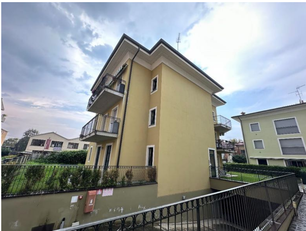
Fabbricato - Vista da parti comuni (foto 3)