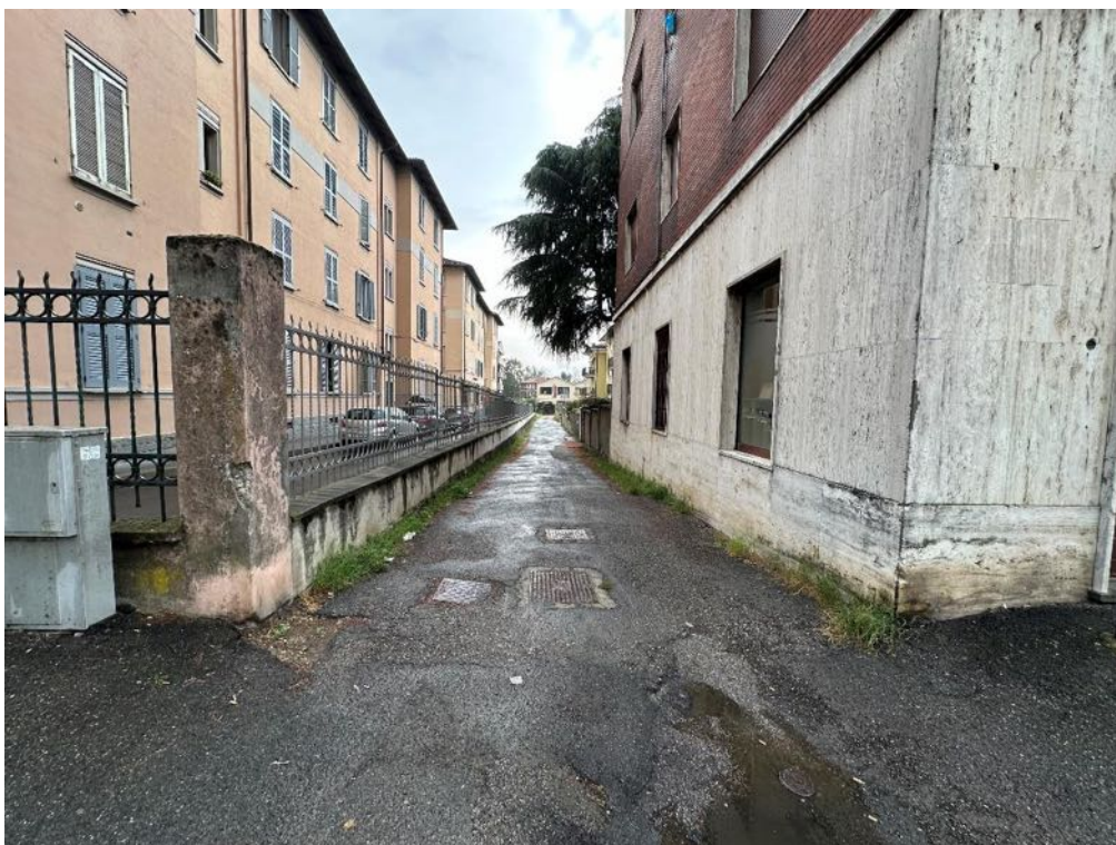
Viale Partigiani - Strada di accesso (foto 1)