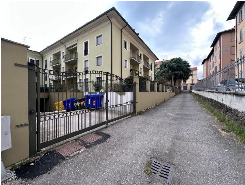
Viale Partigiani - Strada di accesso (foto 3)