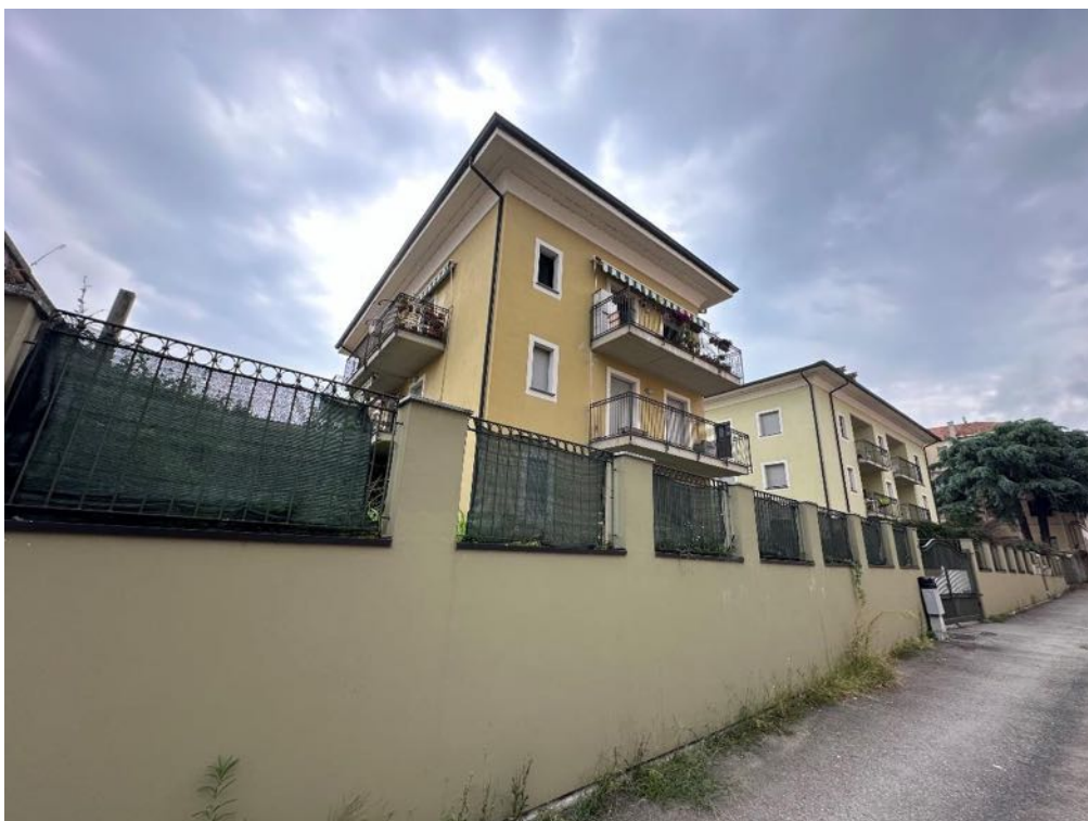
Fabbricato - Vista da strada (foto 1)