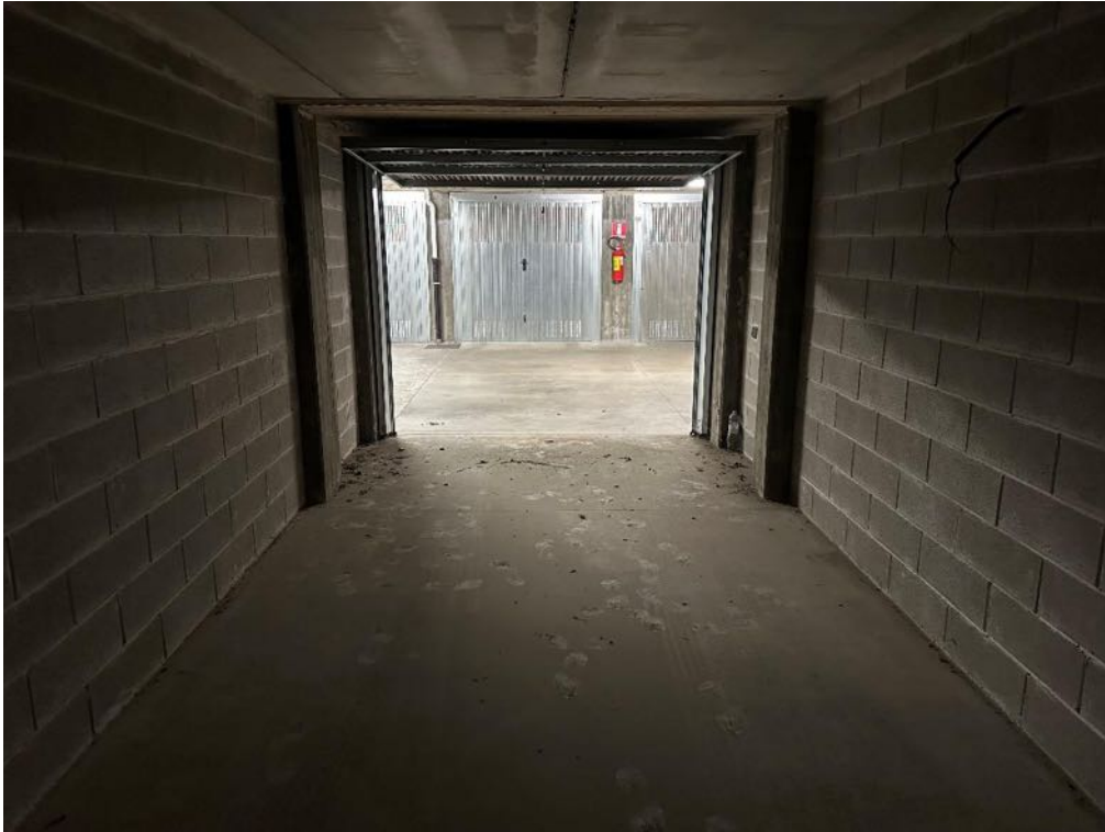
Box (foto 3)