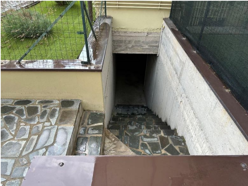
Passaggio pedonale (foto 3)