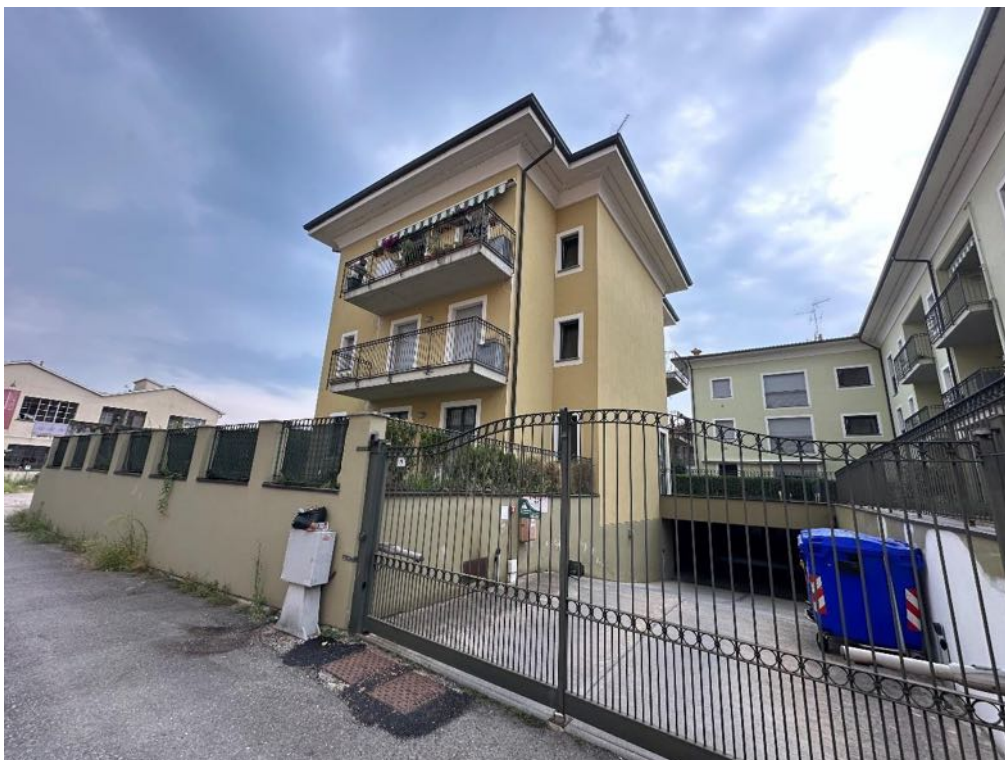
Fabbricato - Vista da strada (foto 3)