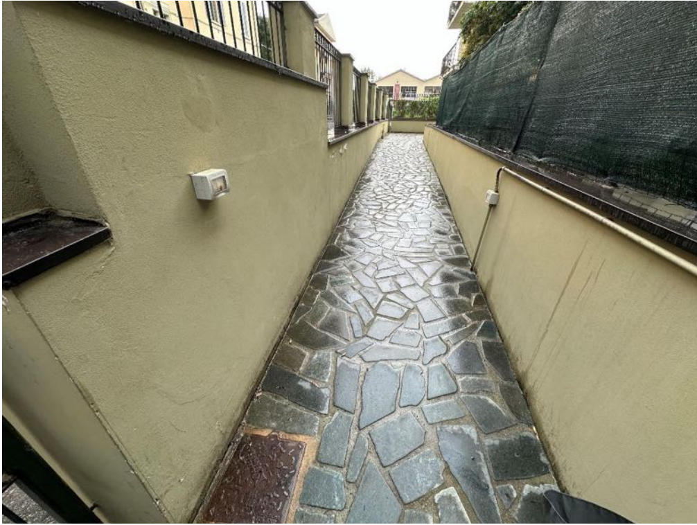
Passaggio pedonale (foto 1)