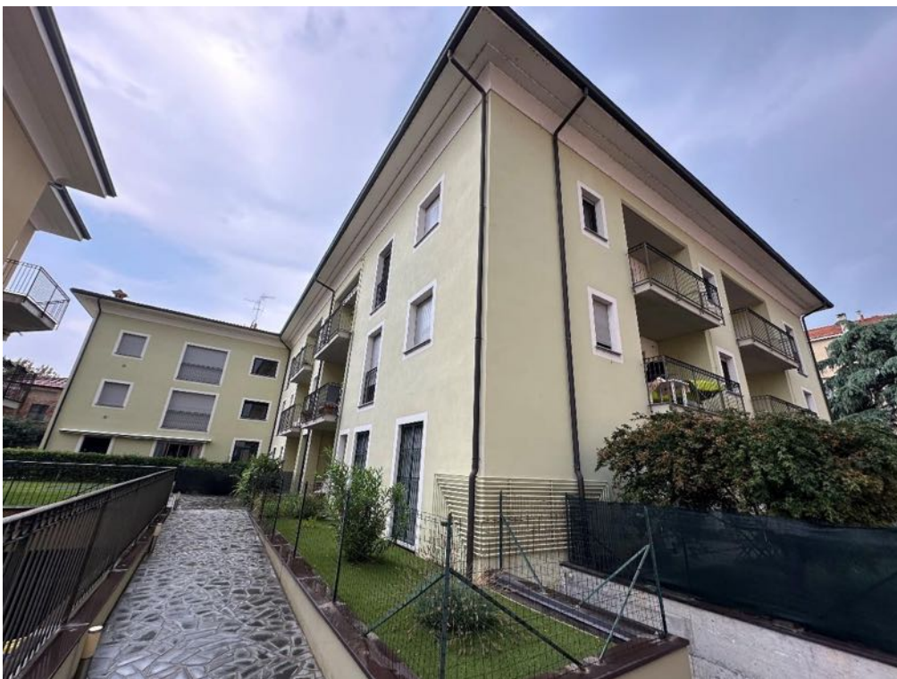
Fabbricato - Vista da parti comuni (foto 1)