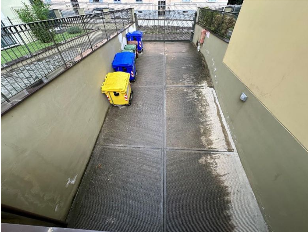
Rampa carrabile (foto 3)