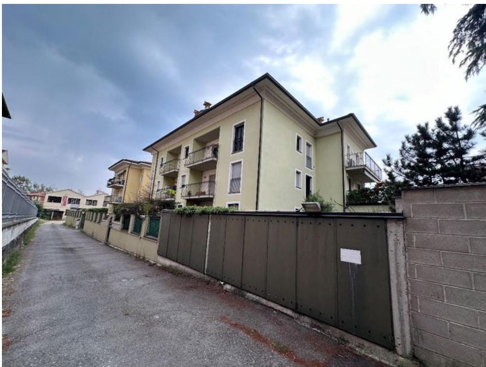
Viale Partigiani - Strada di accesso (foto 2)