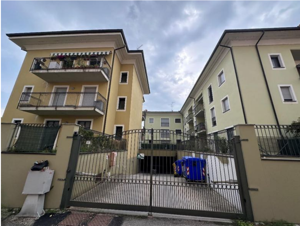
Fabbricato - Vista da strada (foto 4)