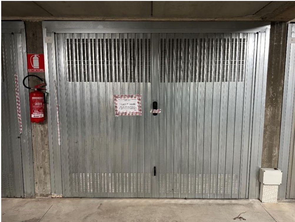
Box (foto 1)