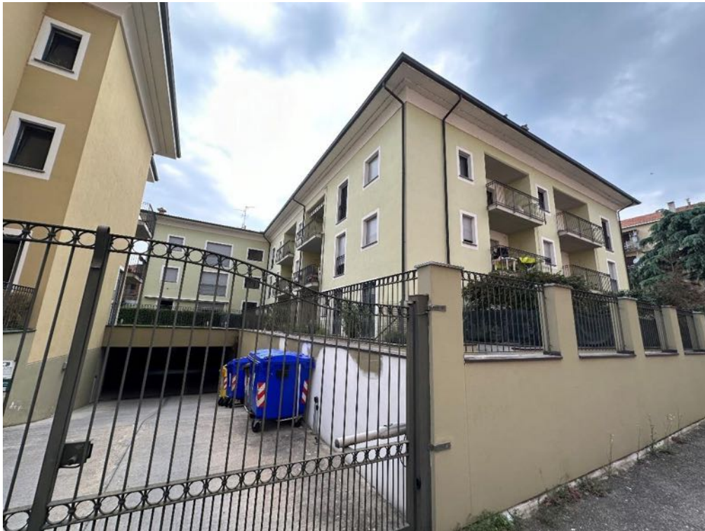
Fabbricato - Vista da strada (foto 2)