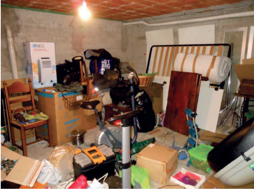
Foto 21 Cantina mapp.851 sub.1 p.S1