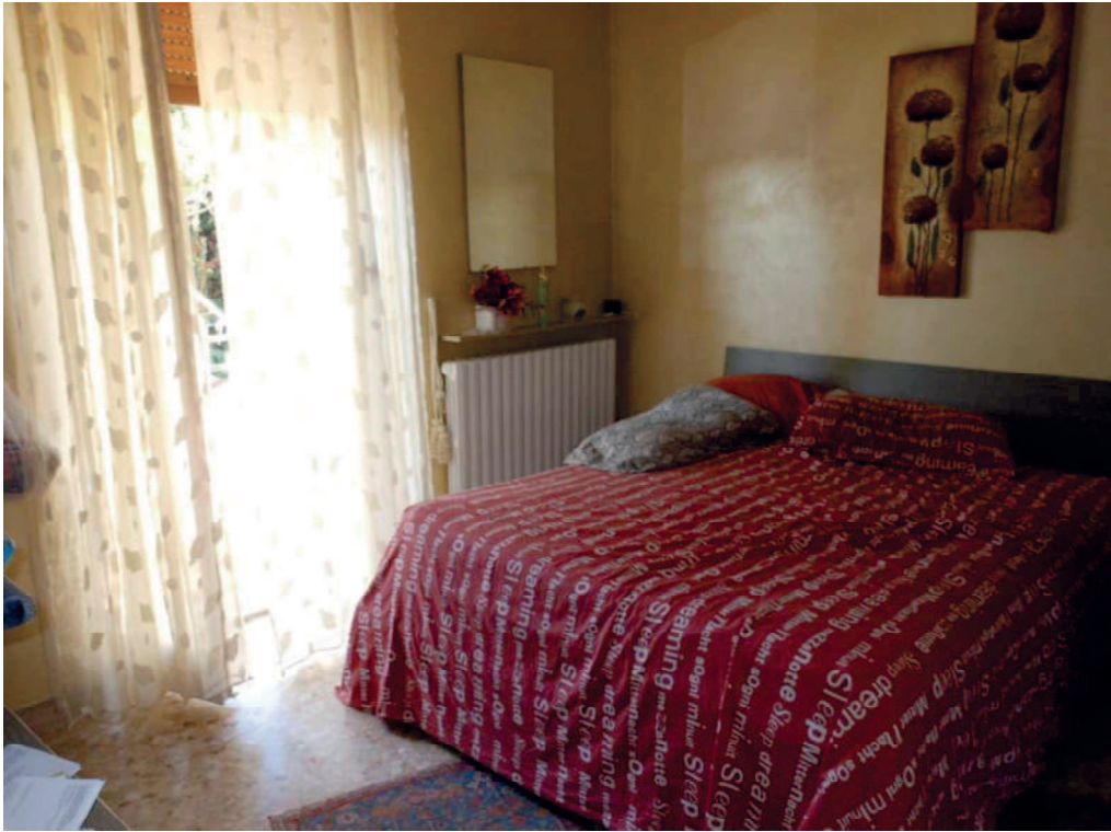
Foto 17 Camera alloggio mapp.851 sub.1 p.r.