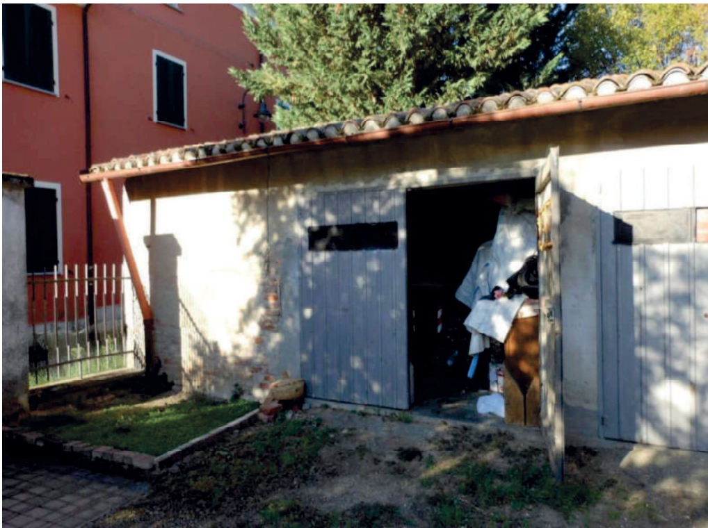
Foto 22 Ingresso box-loc.sgombero mapp.888 sub.1 da sedime interno mapp.851