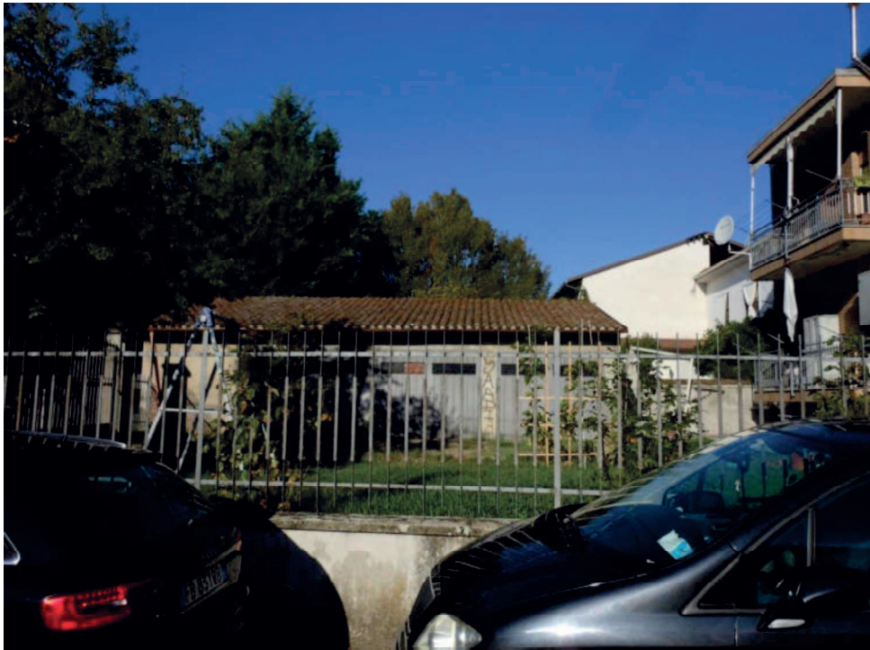
Foto 5 Prospetto frontale da Via Motta fabbricato box mapp.888 sub.1