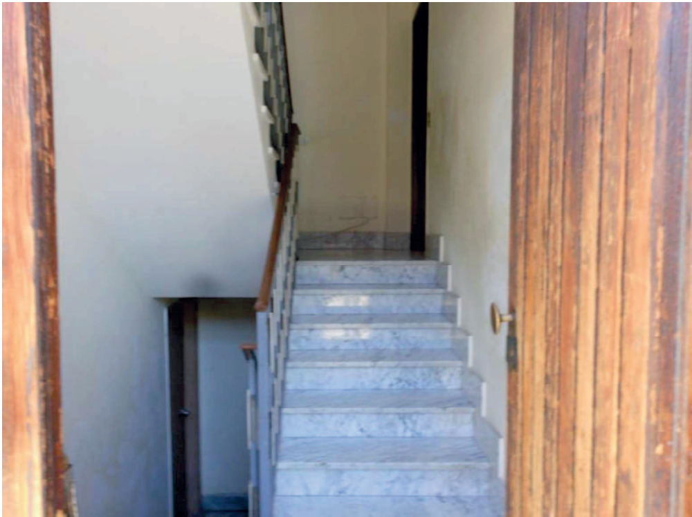
Foto 9 Vano scala comune accesso unità mapp.851 sub.1 p.r.