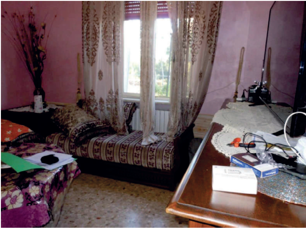
Foto 15 Camera alloggio mapp.851 sub.1 p.r.