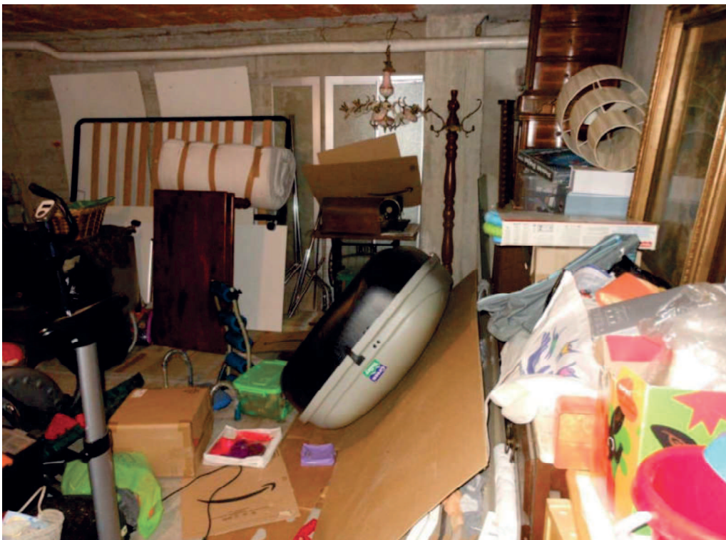
Foto 20 Cantina mapp.851 sub.1 p.S1