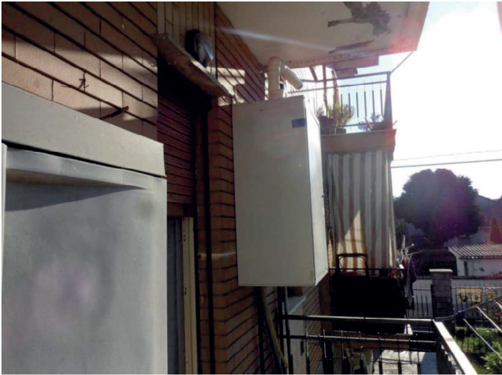
Foto 19 Caldaia su balcone alloggio mapp.851 sub.1 p.r.