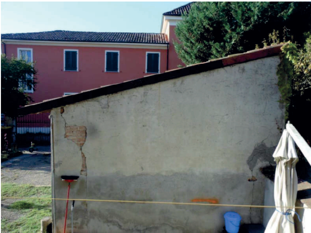
Foto 8 Prospetto laterale da sedime interno mapp.888 sub.1