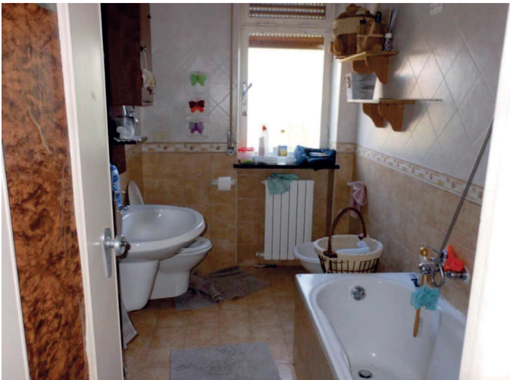
Foto 14 Bagno alloggio mapp.851 sub.1 p.r.