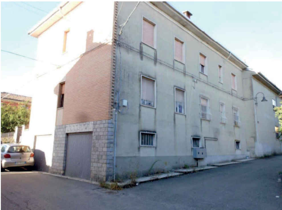
Foto 4 Prospetto retrostante fabbricato mapp.851