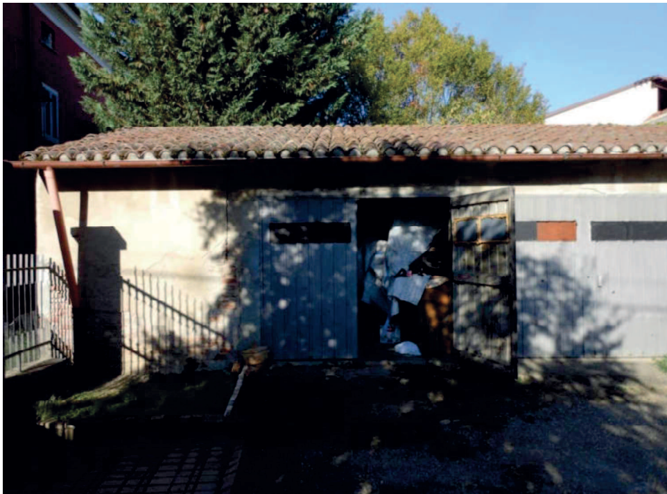
Foto 6 Prospetto frontale da sedime interno mapp.888 sub.1