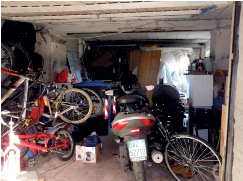
Foto 24 Interno box-loc.sgombero mapp.888 sub.1 da Vicolo privato