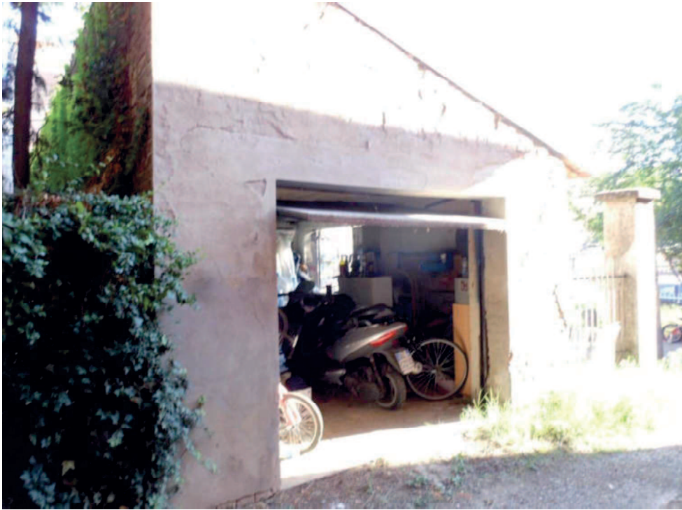
Foto 7 Prospetto laterale da vicolo privato mapp.888 sub.1