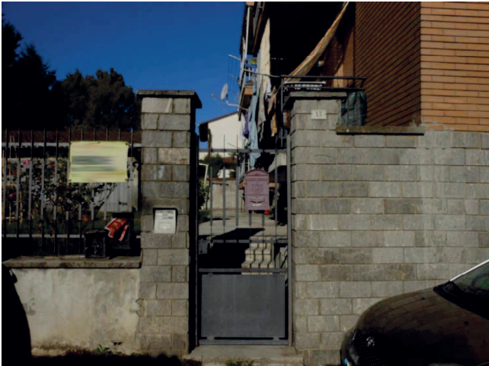
Foto 3 ingresso pedonale su Via Motta