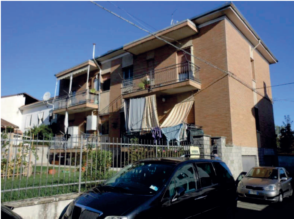
Foto 1 Prospetto frontale su Via Motta fabbricato mapp.851