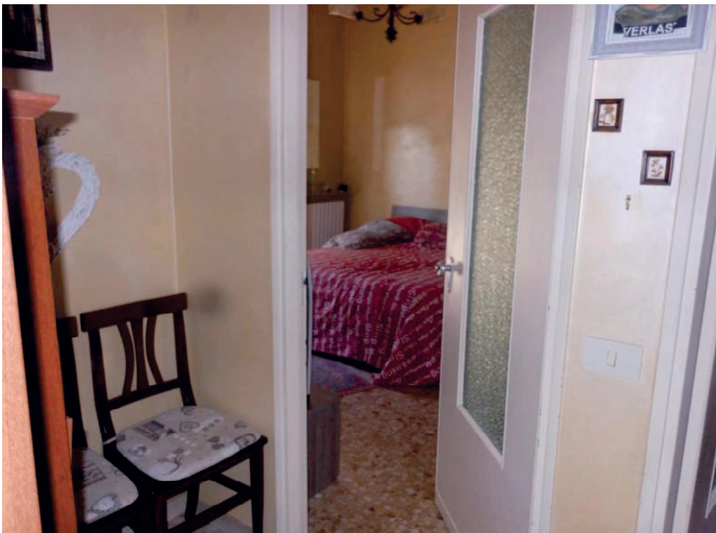
Foto 16 Disimpegno alloggio mapp.851 sub.1 p.r.