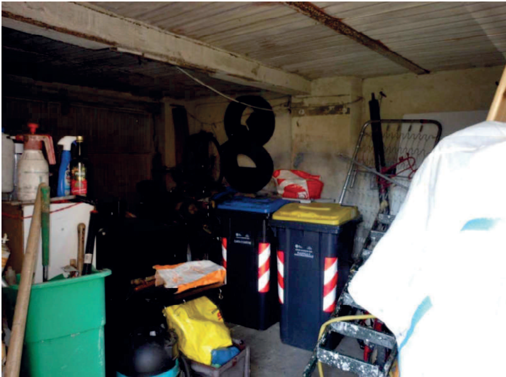
Foto 23 Interno box-loc.sgombero mapp.888 sub.1