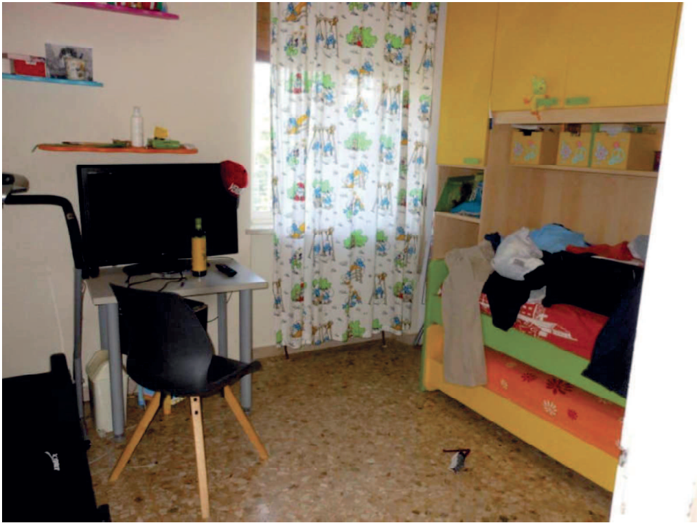
Foto 11 Camera alloggio mapp.851 sub.1 p.r.