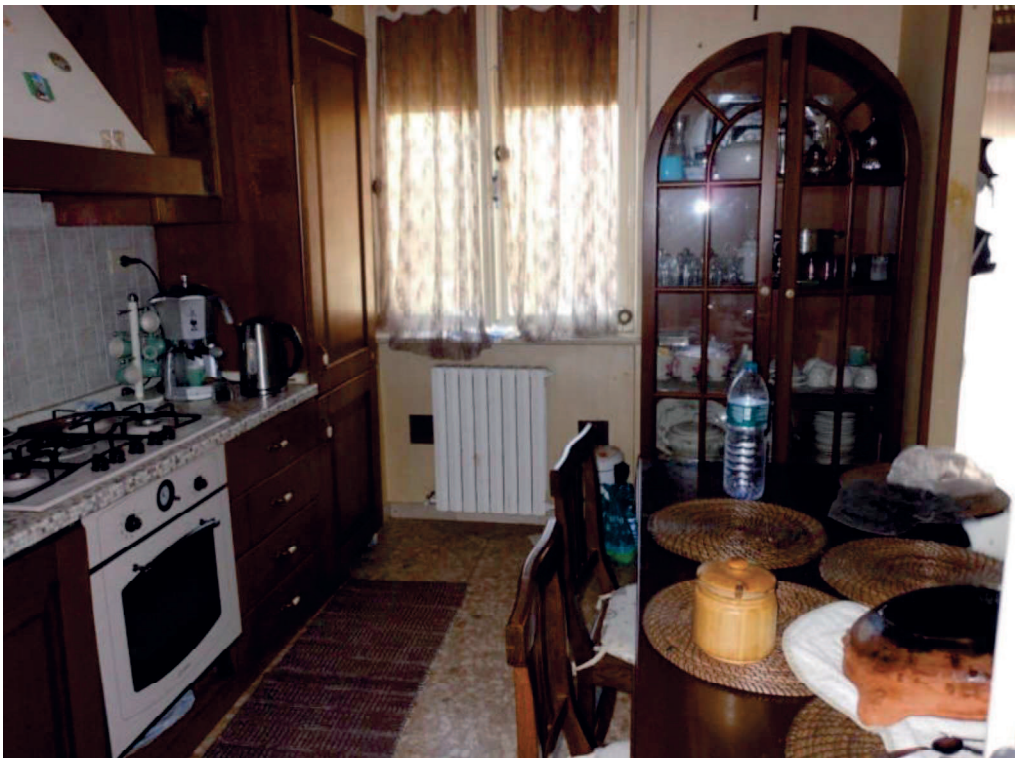
Foto 12 Cucina alloggio mapp.851 sub.1 p.r.