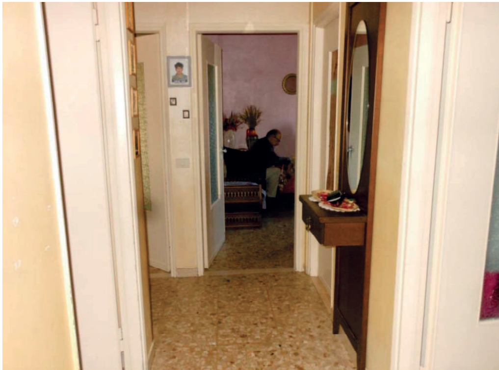
Foto 10 Ingresso alloggio mapp.851 sub.1 p.r.