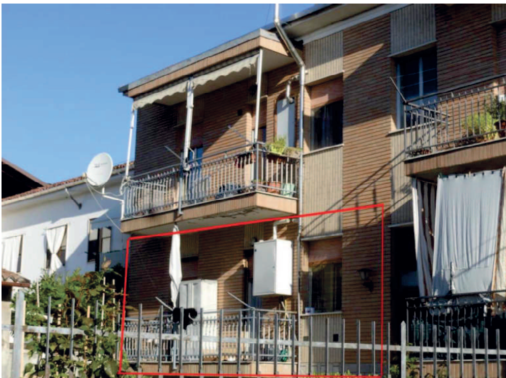
Foto 2 Prospetto alloggio mapp.851 sub.1