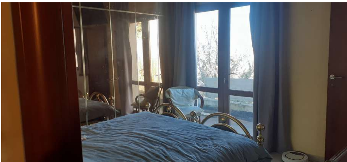
Foto n. 11: porzione piano primo non ancora interessata dalla ristrutturazione