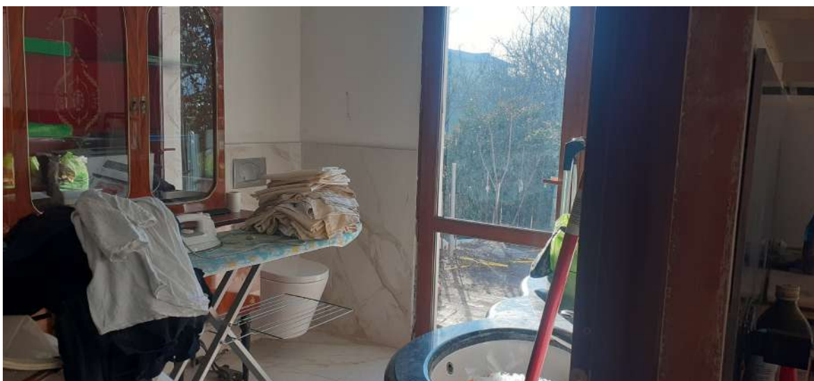
Foto n. 10: porzione piano primo non ancora interessata dalla ristrutturazione