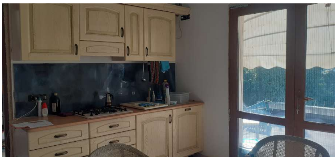
Foto n. 10: porzione piano primo non ancora interessata dalla ristrutturazione