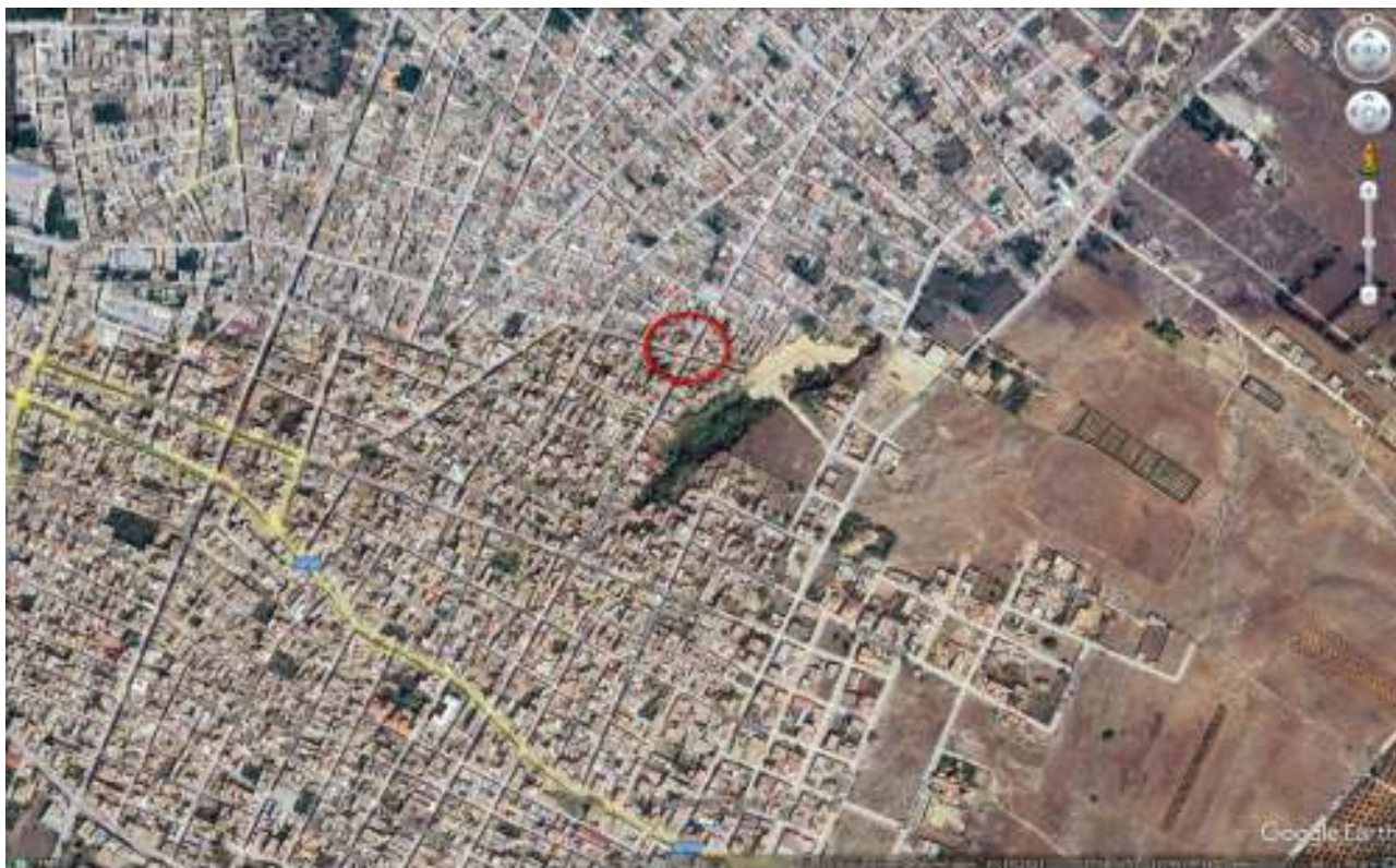
FOTO n° 1: Vista aerea con indicazione dell'ubicazione del fabbricato

Appartamento sito al piano primo di un fabbricato più ampio in Via dei Mille n. 121, ang. Via Regina Margherita, a Campobello di Mazara iscritto in catasto fabbricati al foglio 6 particella 410 sub 5