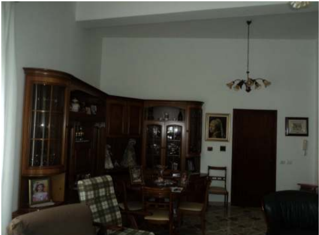
FOTO n° 8: Salone con vista della porta d'ingresso all'appartamento