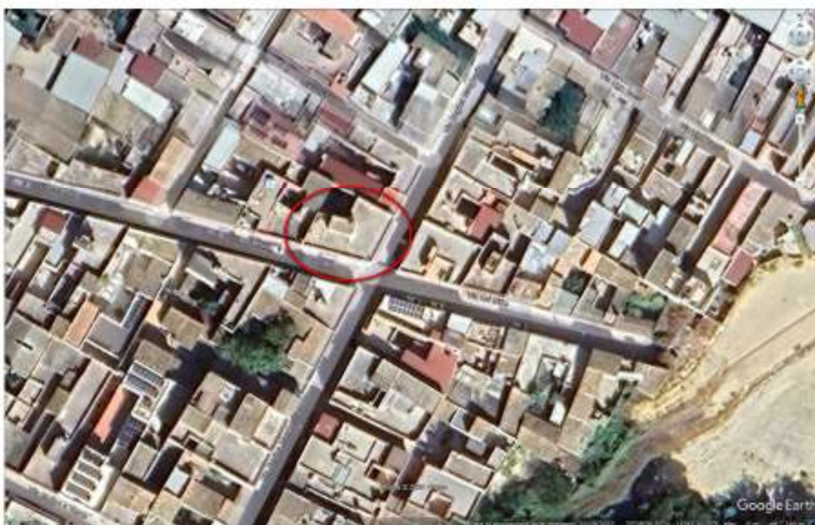
FOTO n° 2: Vista aerea con indicazione dell'ubicazione del fabbricato