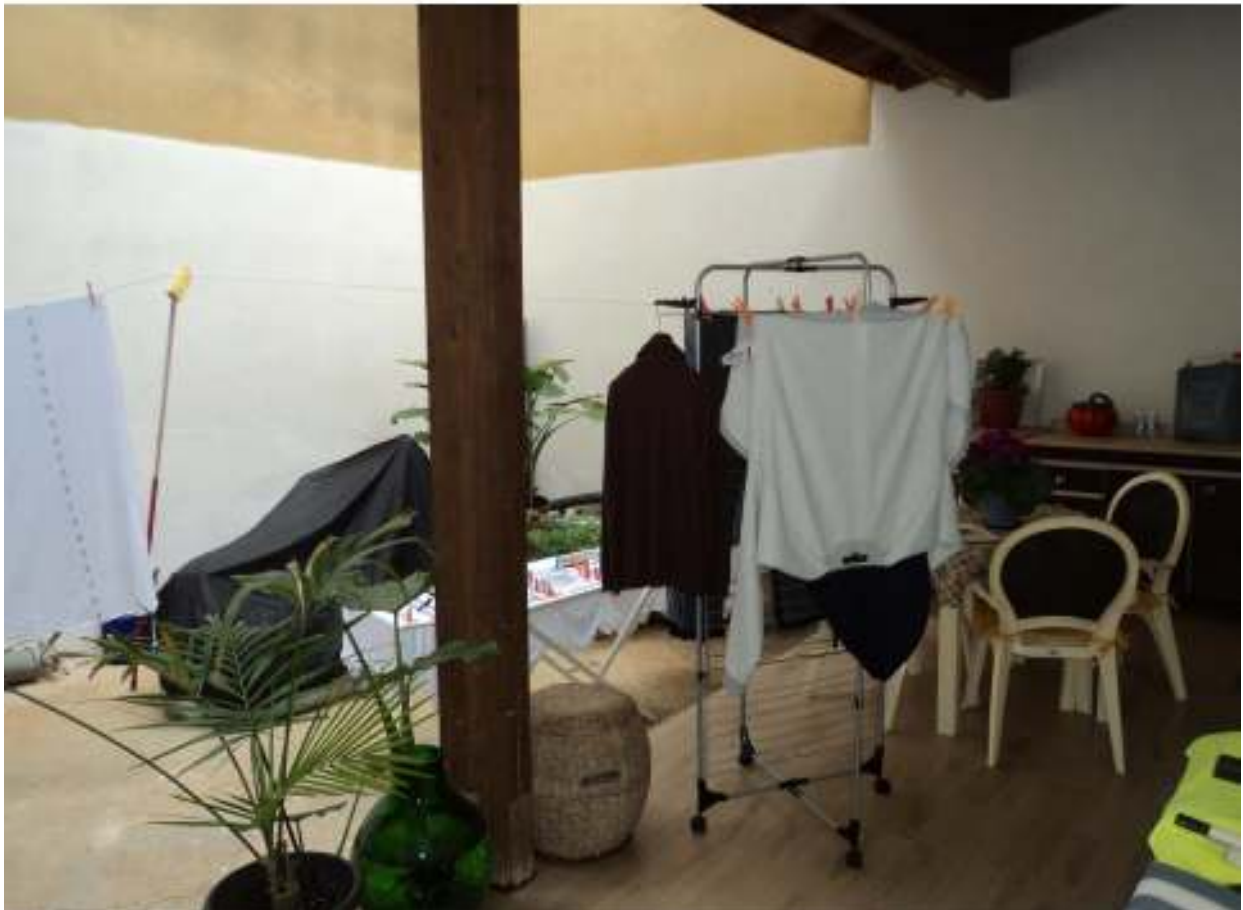
FOTO n° 17: Porzione dell'area interna a parcheggio scoperto comune