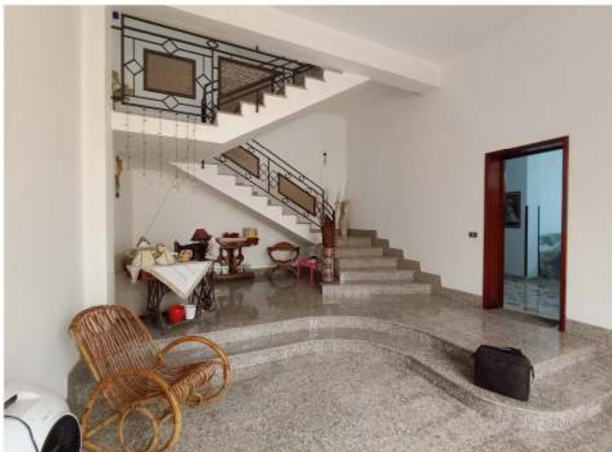
FOTO n° 7: Vano scala con vista del vano porta accesso all'appartamento