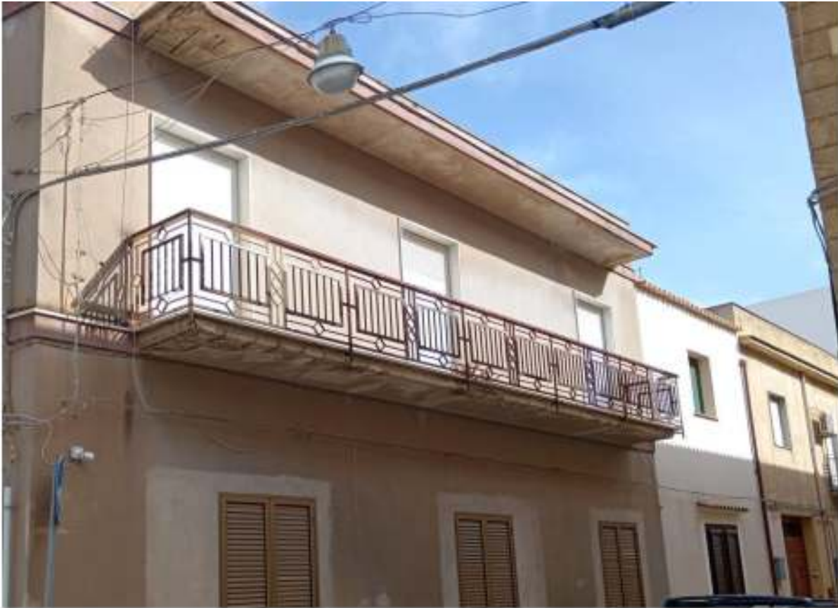
FOTO n° 25: Stato di manutenzione del balcone su Via Regina Margherita (difformità urbanistica e strutturale)