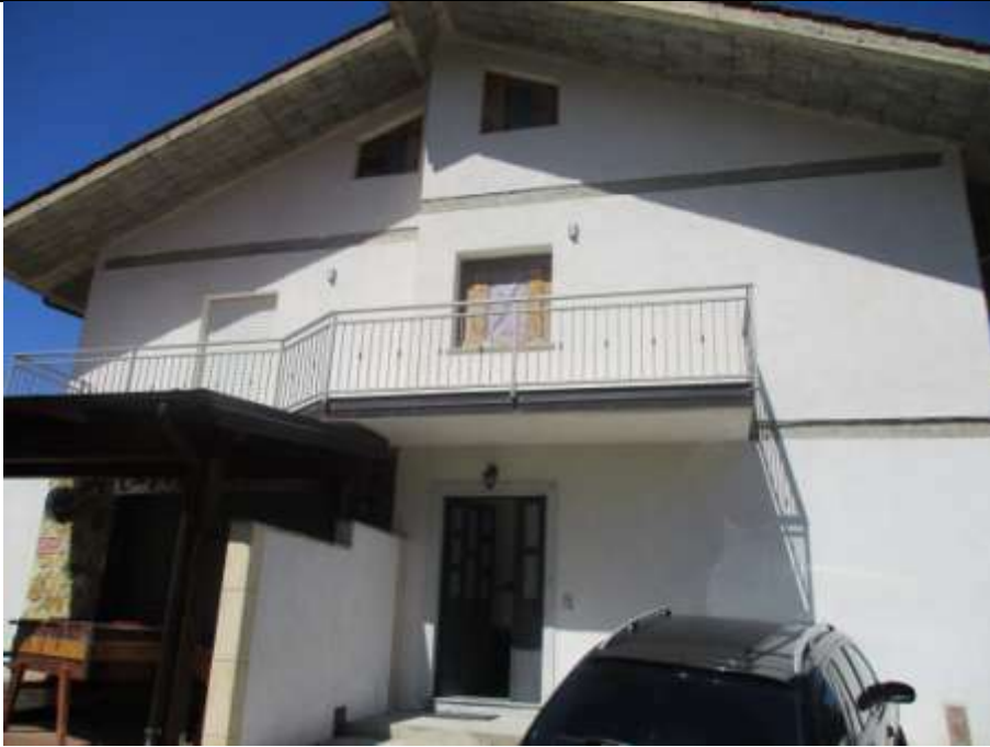
Foto n. 3. Prospetto Est