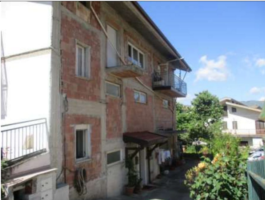
Foto n. 4. Prospetto Nord