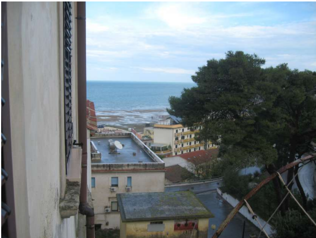
Foto n.16: vista panoramica godibile dal balcone della camera n.1