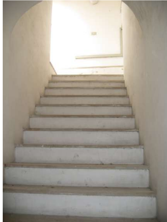
Foto n.1: Ingresso su Vicolo Galileo Galilei Foto n.2: rampa di accesso all'appartamento