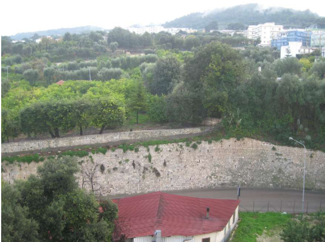
Foto n.14: veduta panoramica godibile dalla camera n.1 e dalla camera n.2