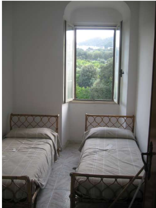
Foto n.12: vista della camera n.2, dotata di finestra con veduta panoramica a Sud-Est