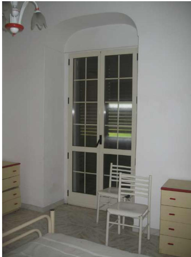
Foto n.11: vista della camera n.1 dotata di balcone con veduta panoramica