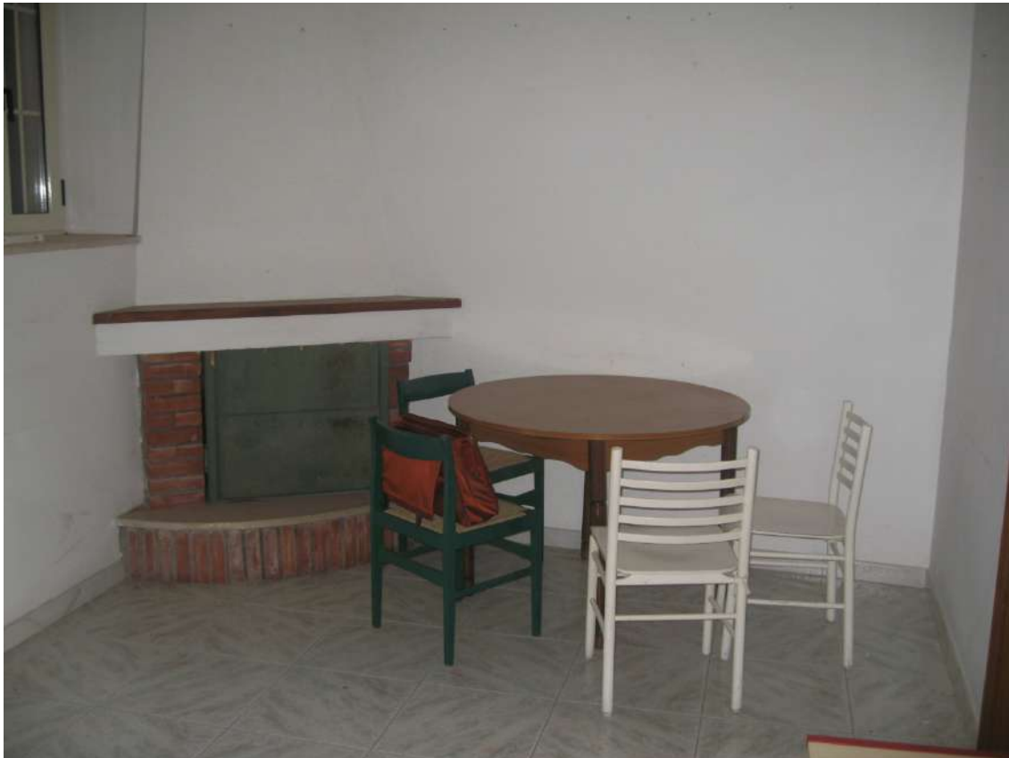
Foto n.7: vano soggiorno, dotato di una porta-finestra, una finestra ed un camino ad angolo