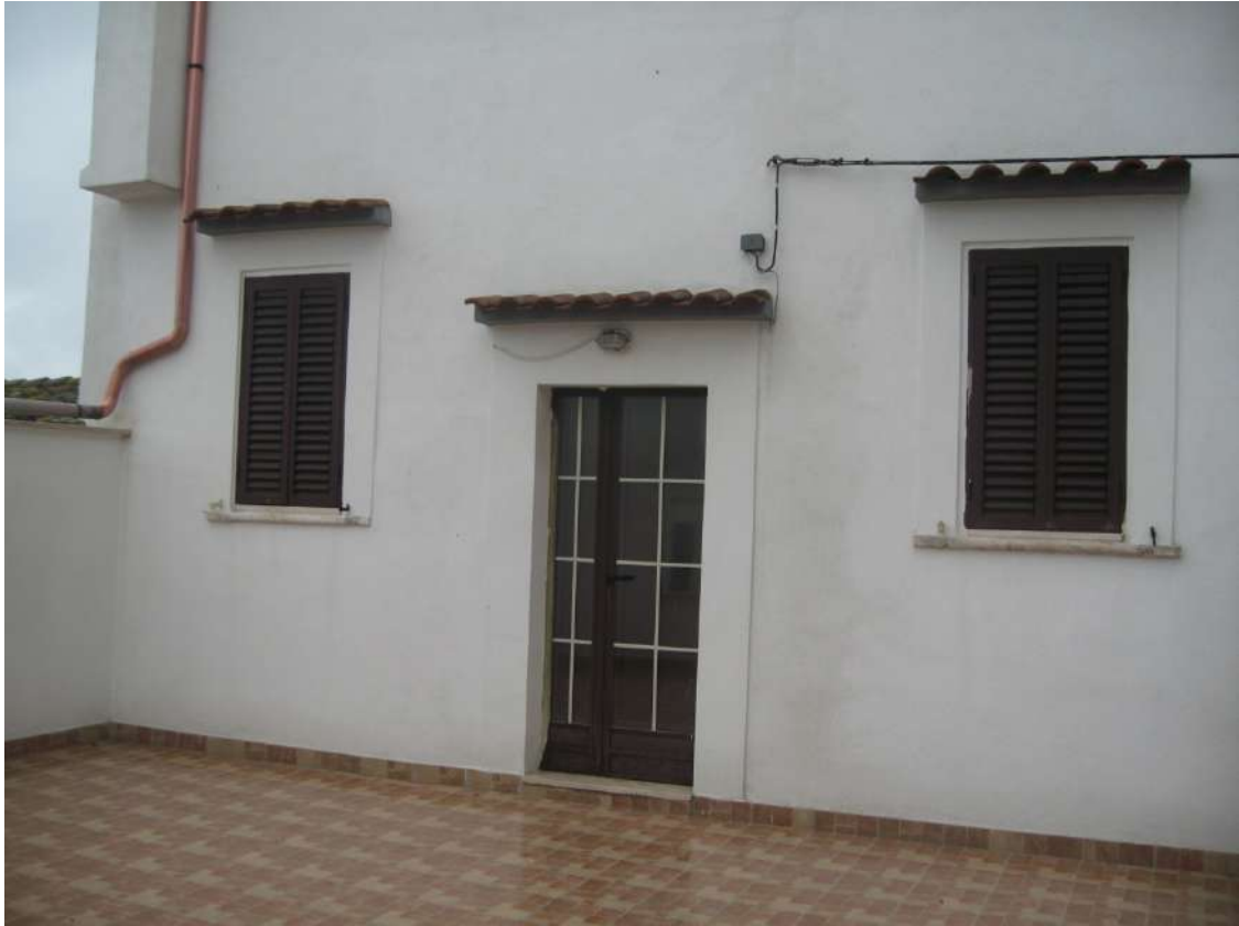
Foto n.4: prospetto lato Nord-Ovest con affaccio dei vani soggiorno e bagno