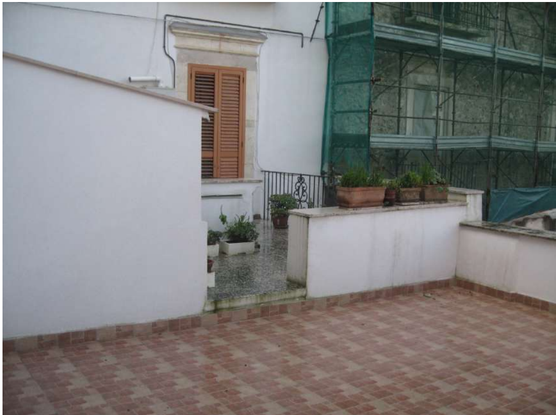
Foto n.5: servitù di comunicazione, con la rampa delle scale, tra il terrazzo del Lotto 12 ed il terrazzino di altra proprietà