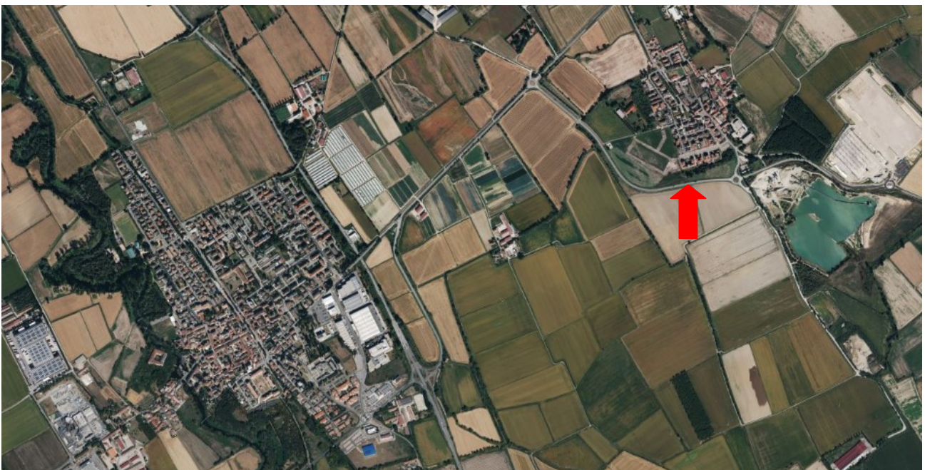
Inquadramento dell'immobile nel comune di Landriano loc. Pairana