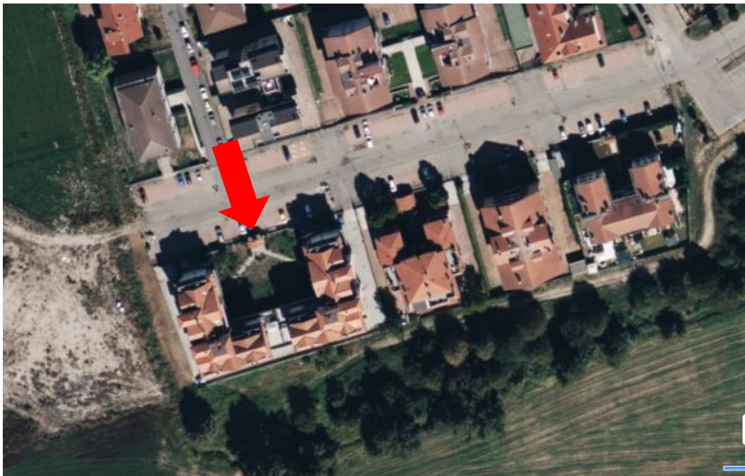
Vista dall'alto dell'edificio