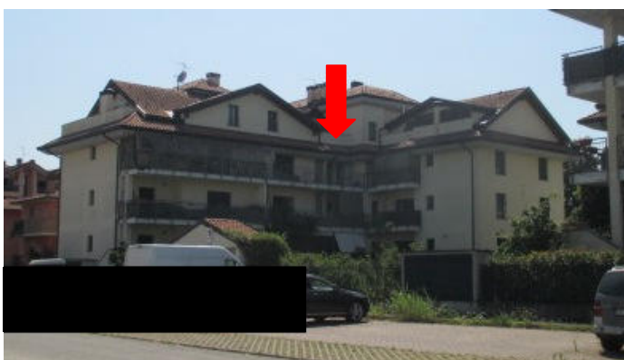
vista ovest - appartamento