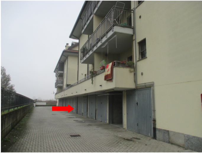
vista sud – box