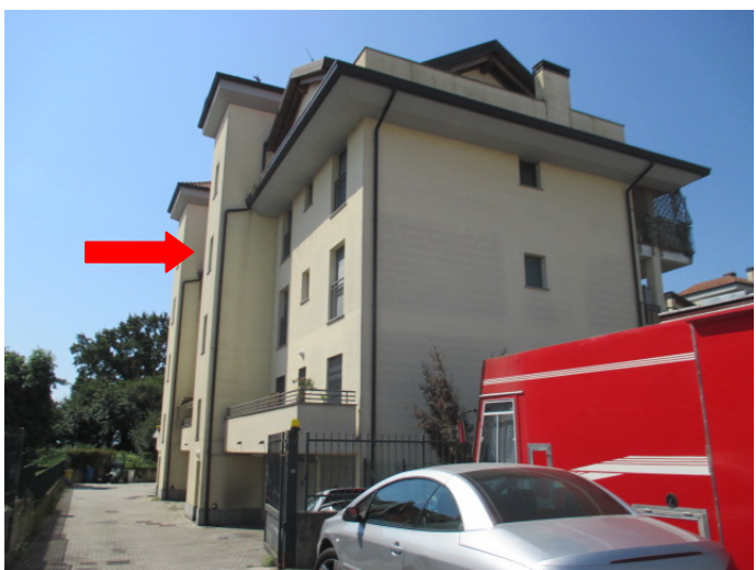
vista est - appartamento