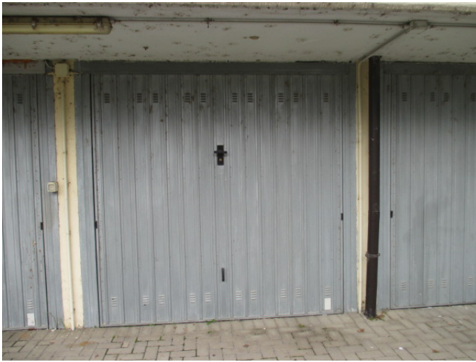
vista sud – box