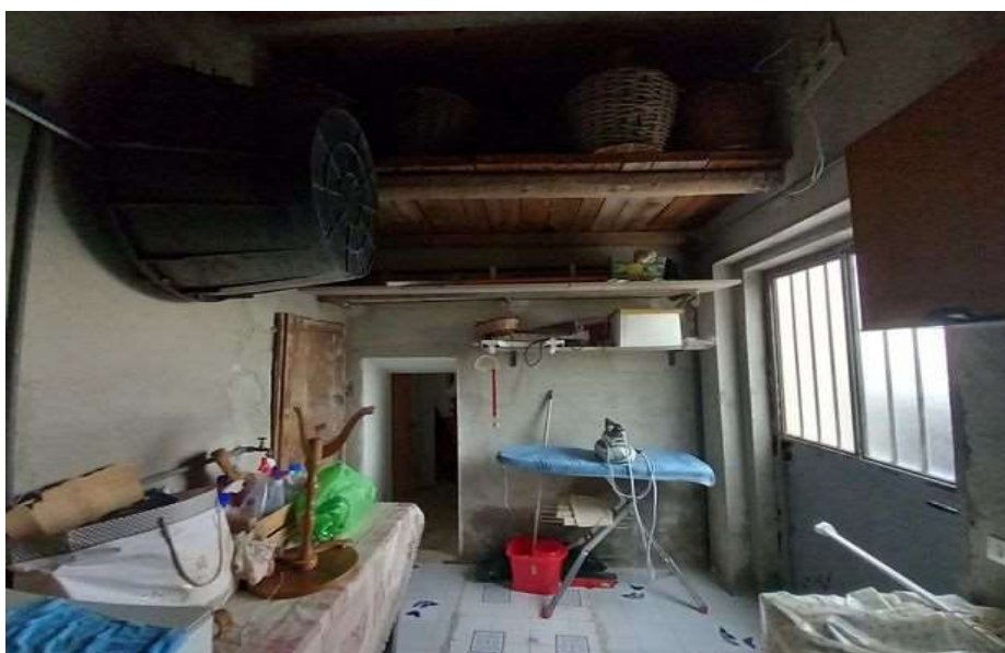
DISIMPEGNO PIANO TERRA