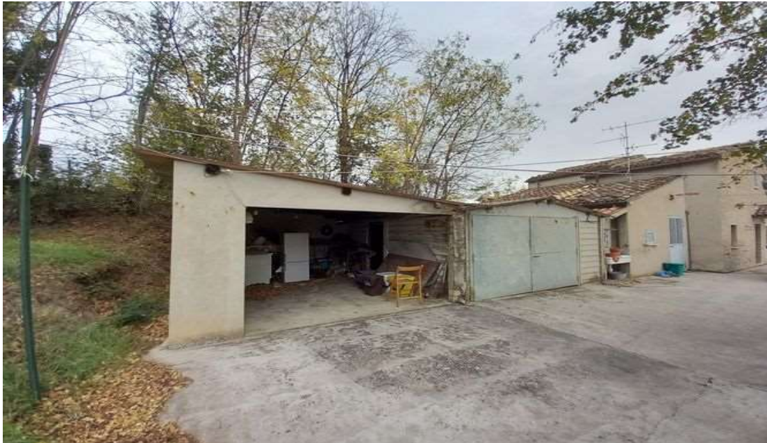
PROSPETTO SUD – ACCESSORIO ABUSIVO E GARAGE SUB 3