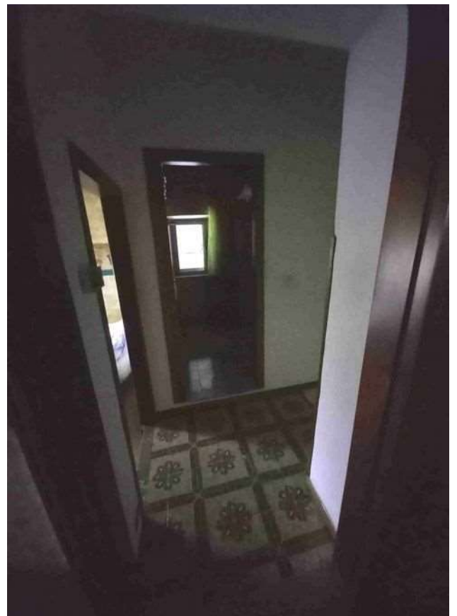
DISIMPEGNO PIANO PRIMO