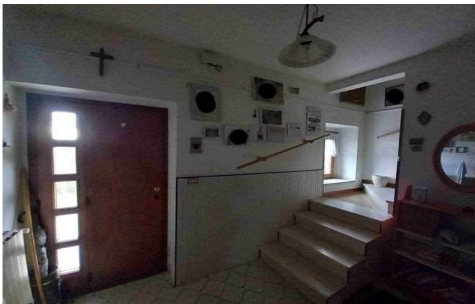
INGRESSO PIANO TERRA