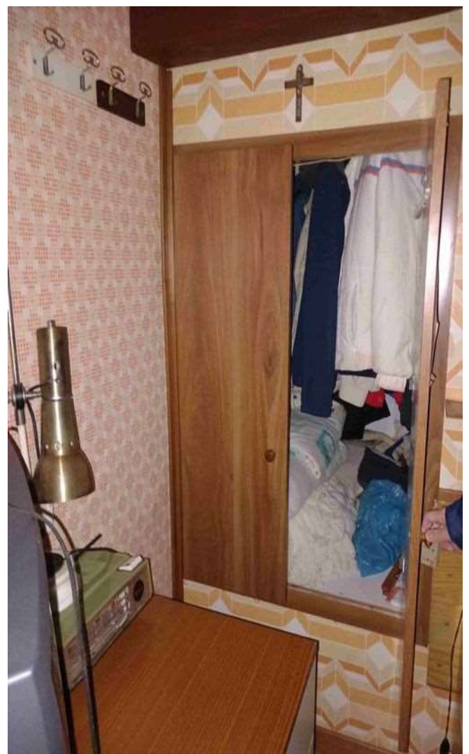
CAMERA LATO SUD