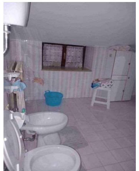
BAGNO LIVELLO INTERMEDIO