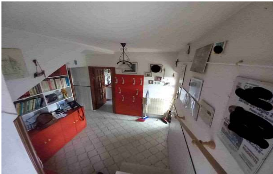
INGRESSO PIANO TERRA