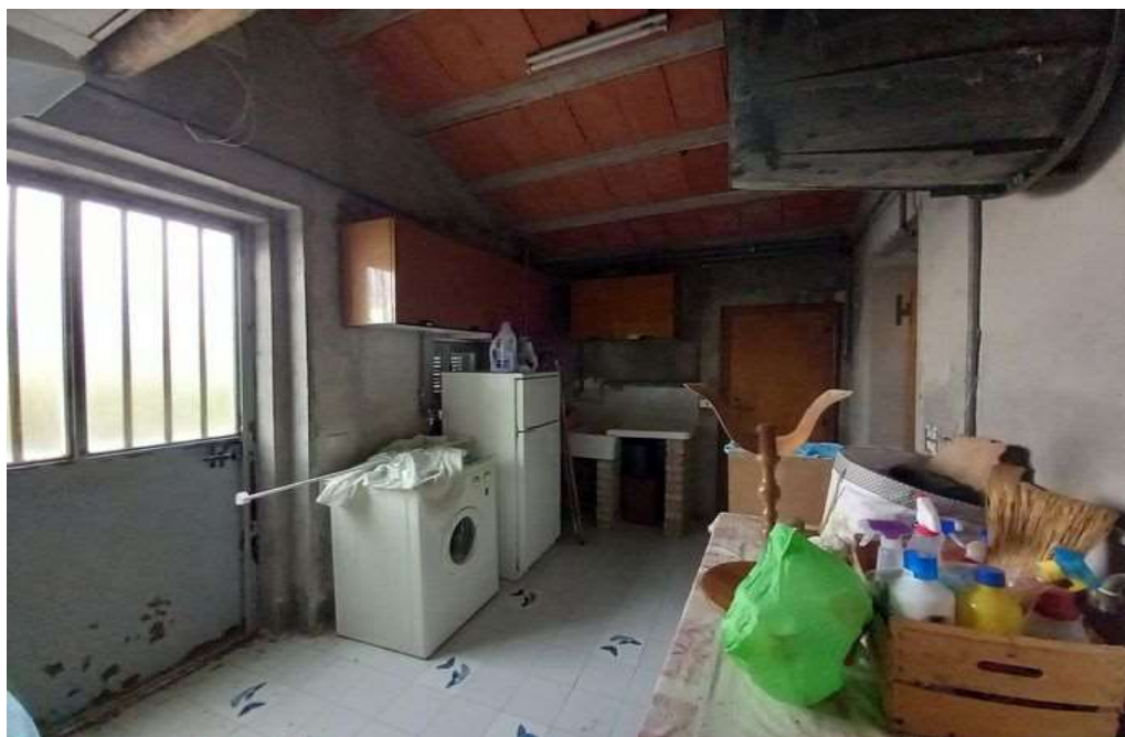
DISIMPEGNO PIANO TERRA