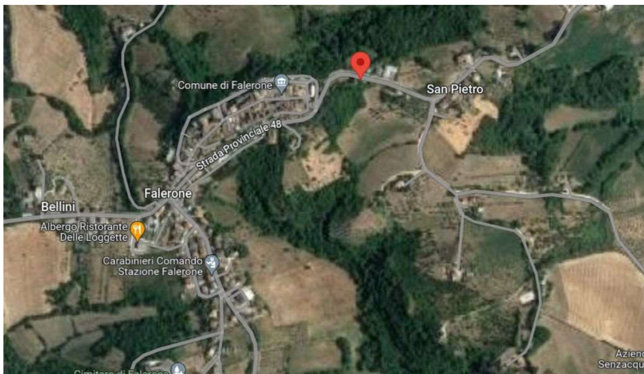
LOCALIZZAZIONE - FALERONE, STRADA MONTAPPONESE 1