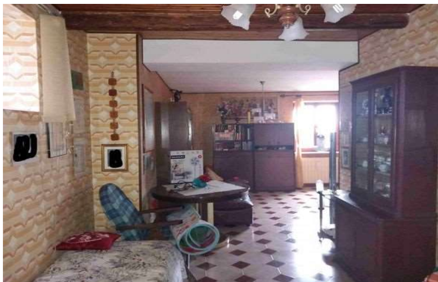
TINELLO PIANO TERRA