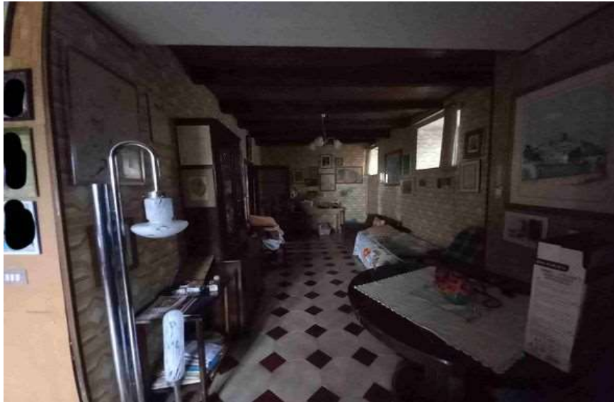
TINELLO PIANO TERRA