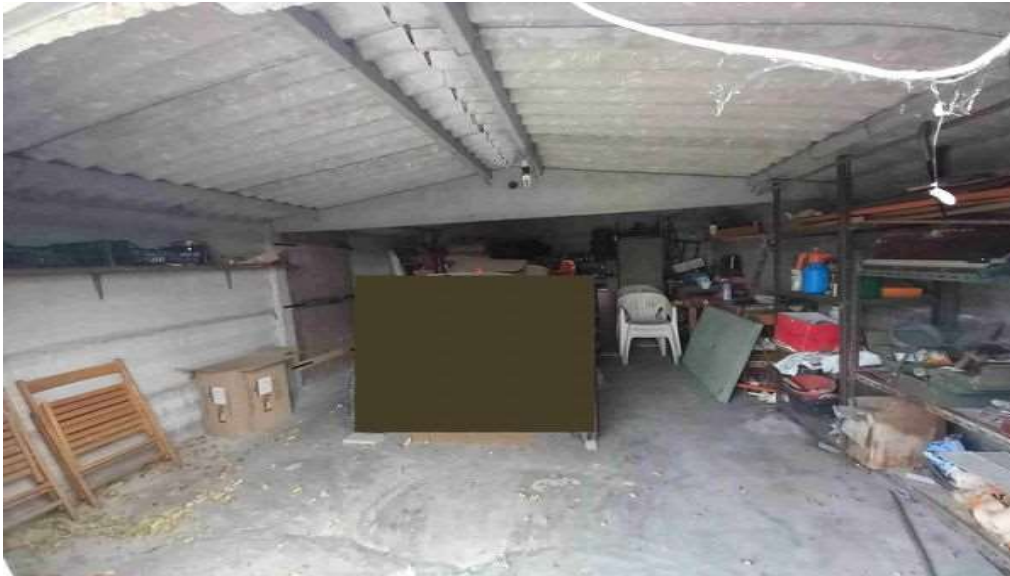
INTERNO GARAGE SUB 3