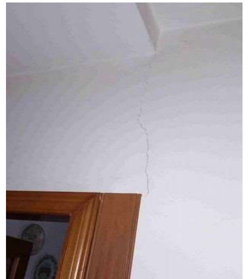
CREPE E AMMALORAMENTO PARTI STRUTTURALI E FINITURE