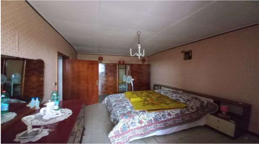
CAMERA LATO NORD