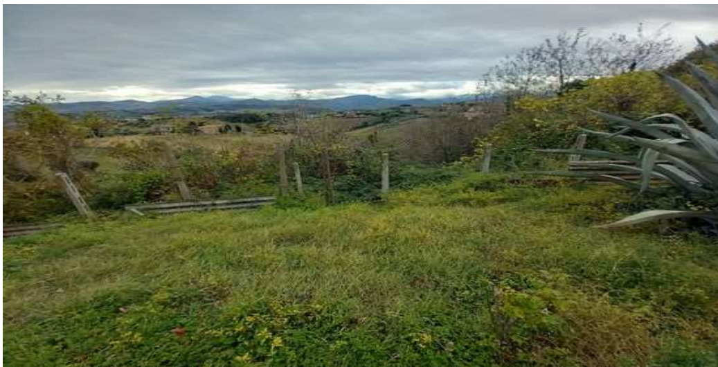
CORTE LATO SUD