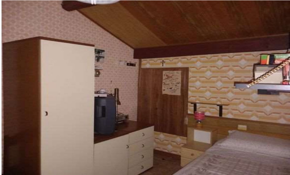
CAMERA LATO SUD