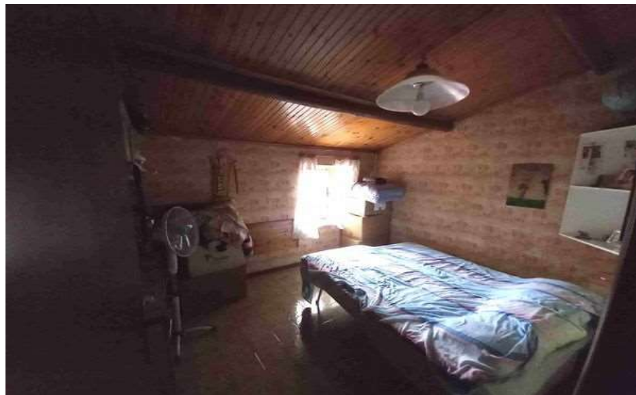
CAMERA LATO EST