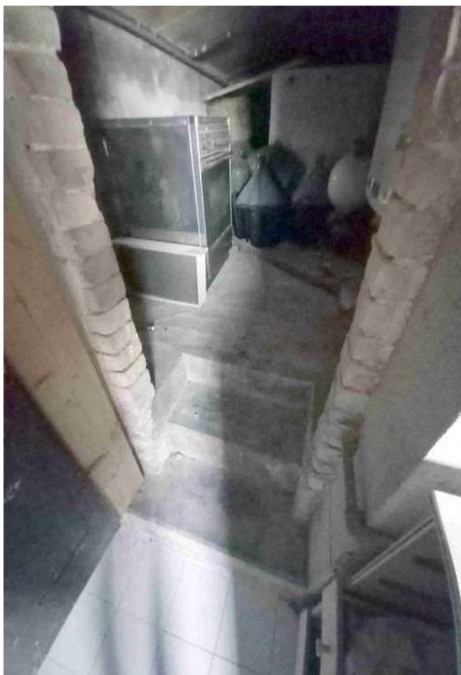
RIPOSTIGLIO – LOCALE CALDAIA