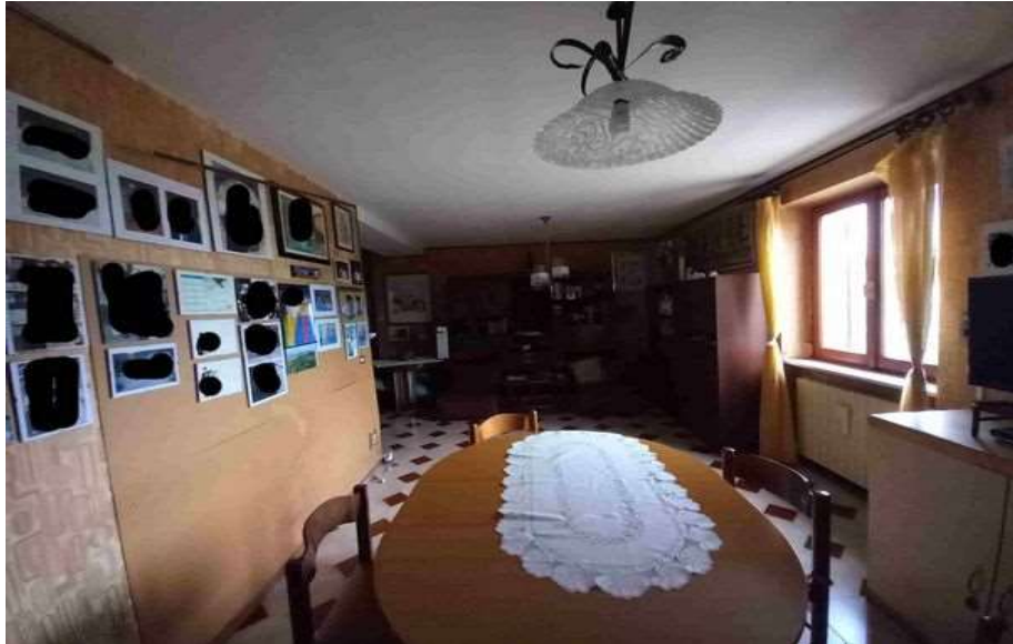
SOGGIORNO PIANO TERRA