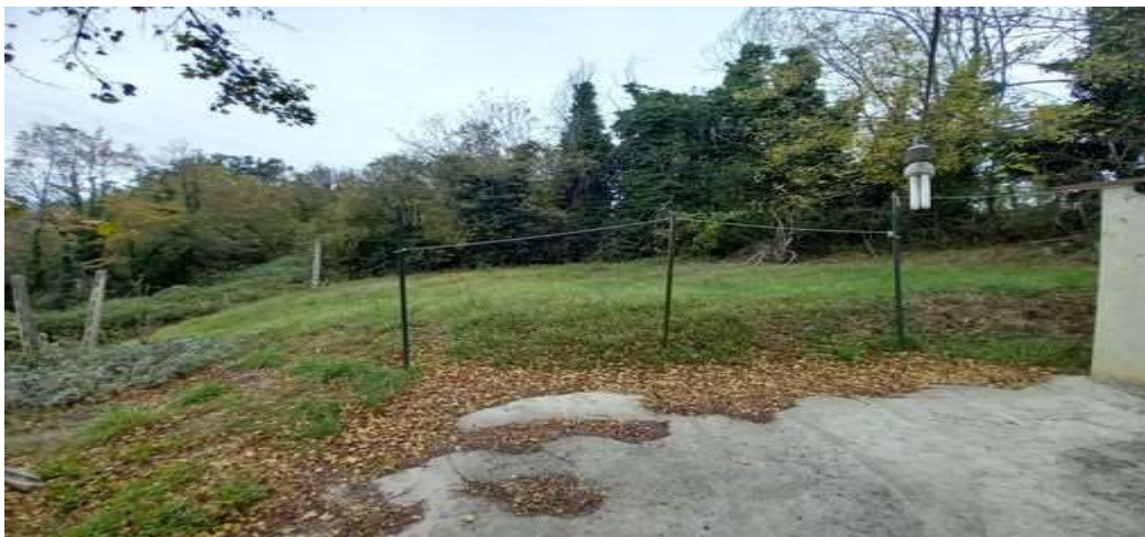
CORTE LATO OVEST