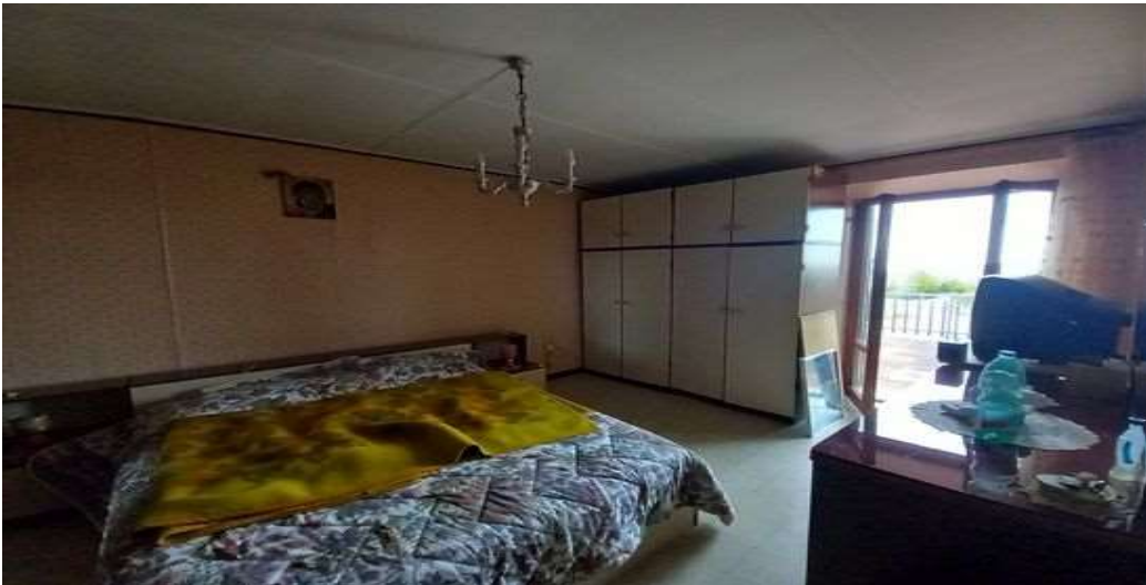
CAMERA LATO NORD