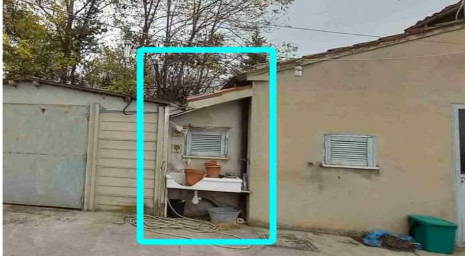
PORZIONE REALIZZATA ABUSIVAMENTE