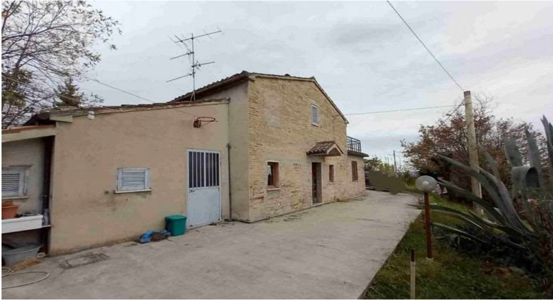
PROSPETTO SUD ABITAZIONE - SUB 2