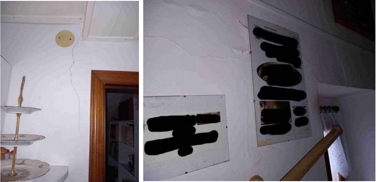
CREPE E AMMALORAMENTO PARTI STRUTTURALI E FINITURE