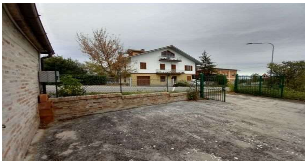
PIAZZALE DI ACCESSO LATO EST