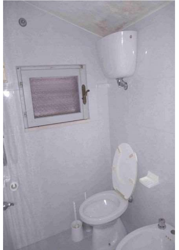
BAGNO PIANO TERRA