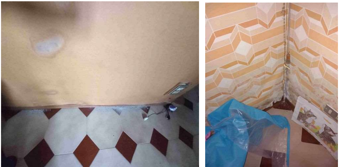
CREPE E AMMALORAMENTO PARTI STRUTTURALI E FINITURE