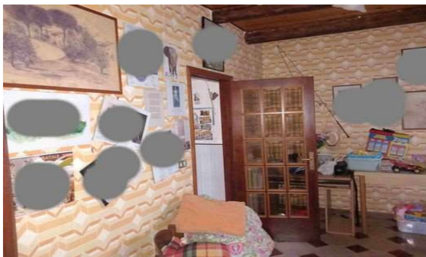
TINELLO PIANO TERRA