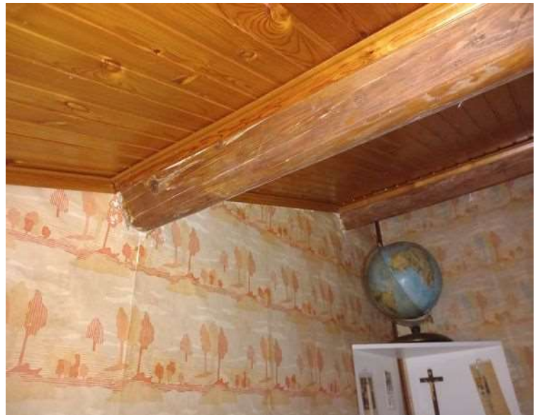
CREPE E AMMALORAMENTO PARTI STRUTTURALI E FINITURE