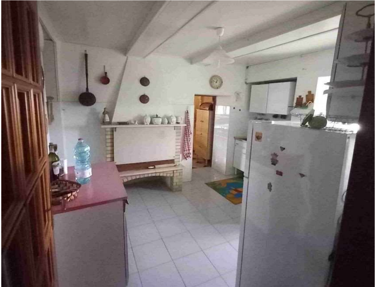
CUCINA PIANO TERRA