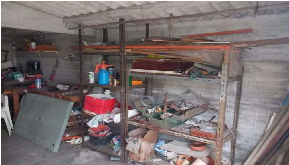
INTERNO GARAGE SUB 3