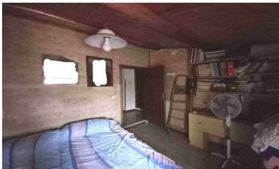
CAMERA LATO EST