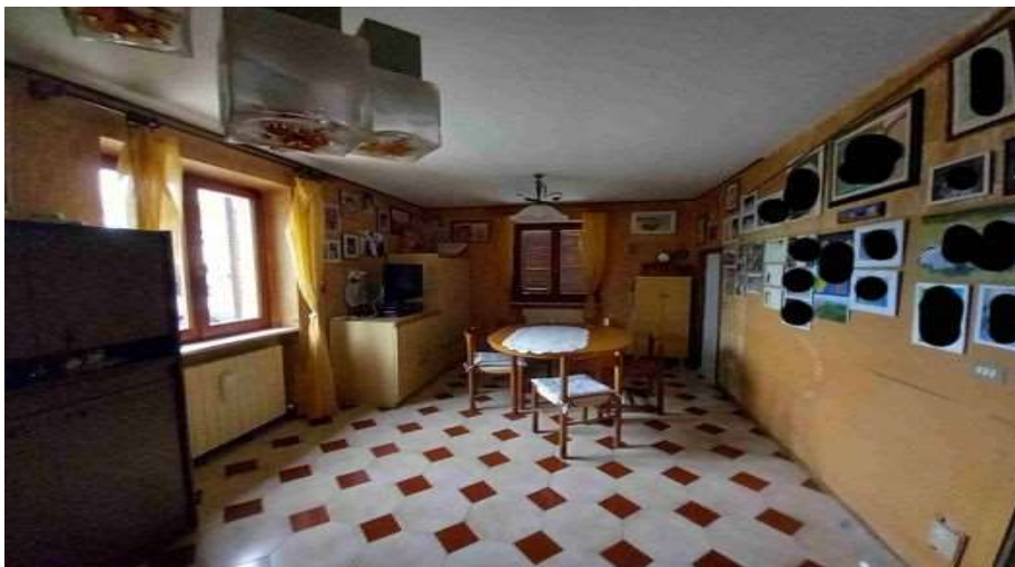
SOGGIORNO PIANO TERRA