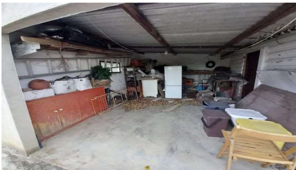
INTERNO ACCESSORIO ABUSIVO LATO OVEST