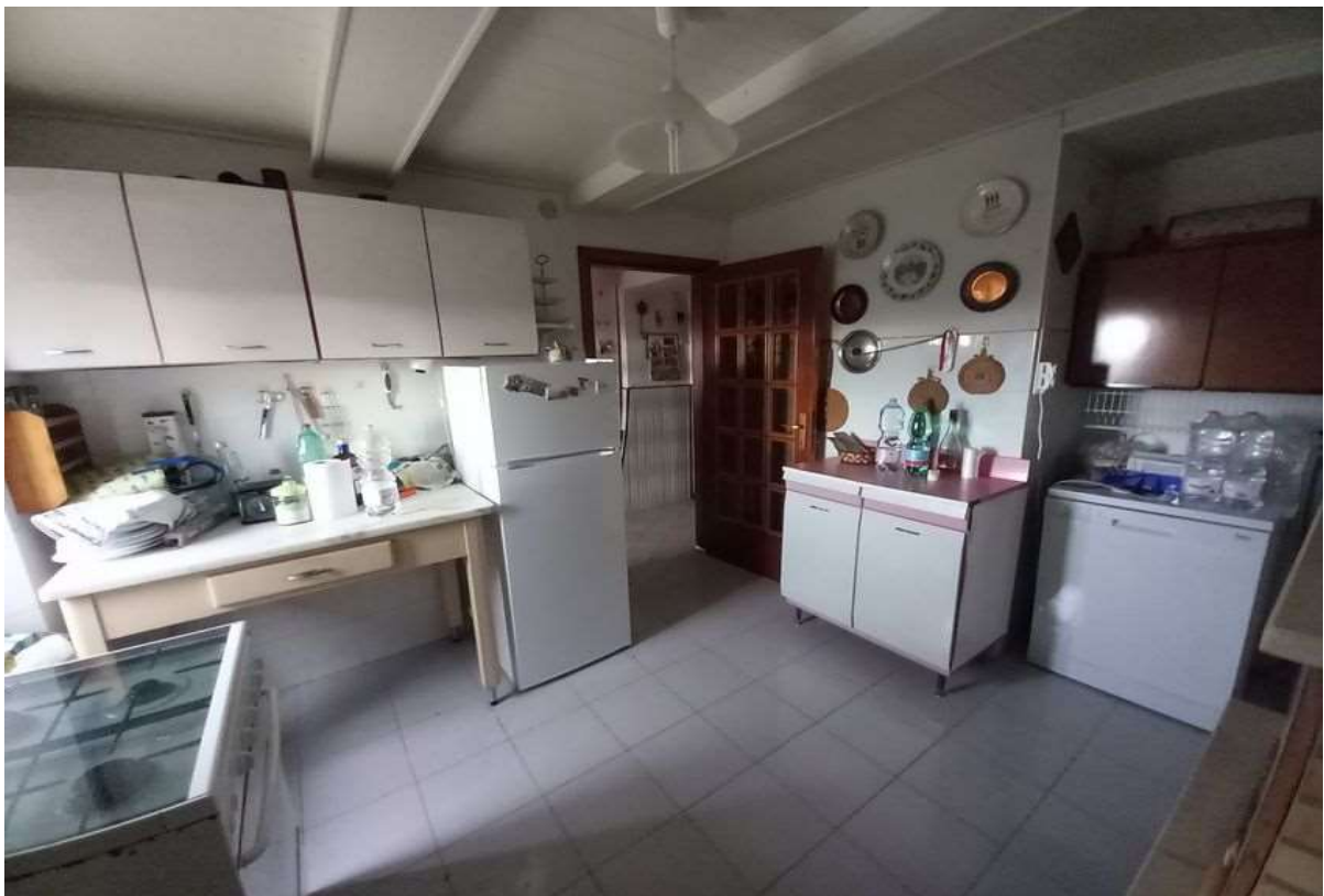
CUCINA PIANO TERRA