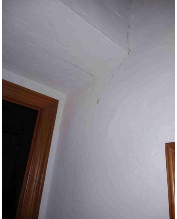
CREPE E AMMALORAMENTO PARTI STRUTTURALI E FINITURE