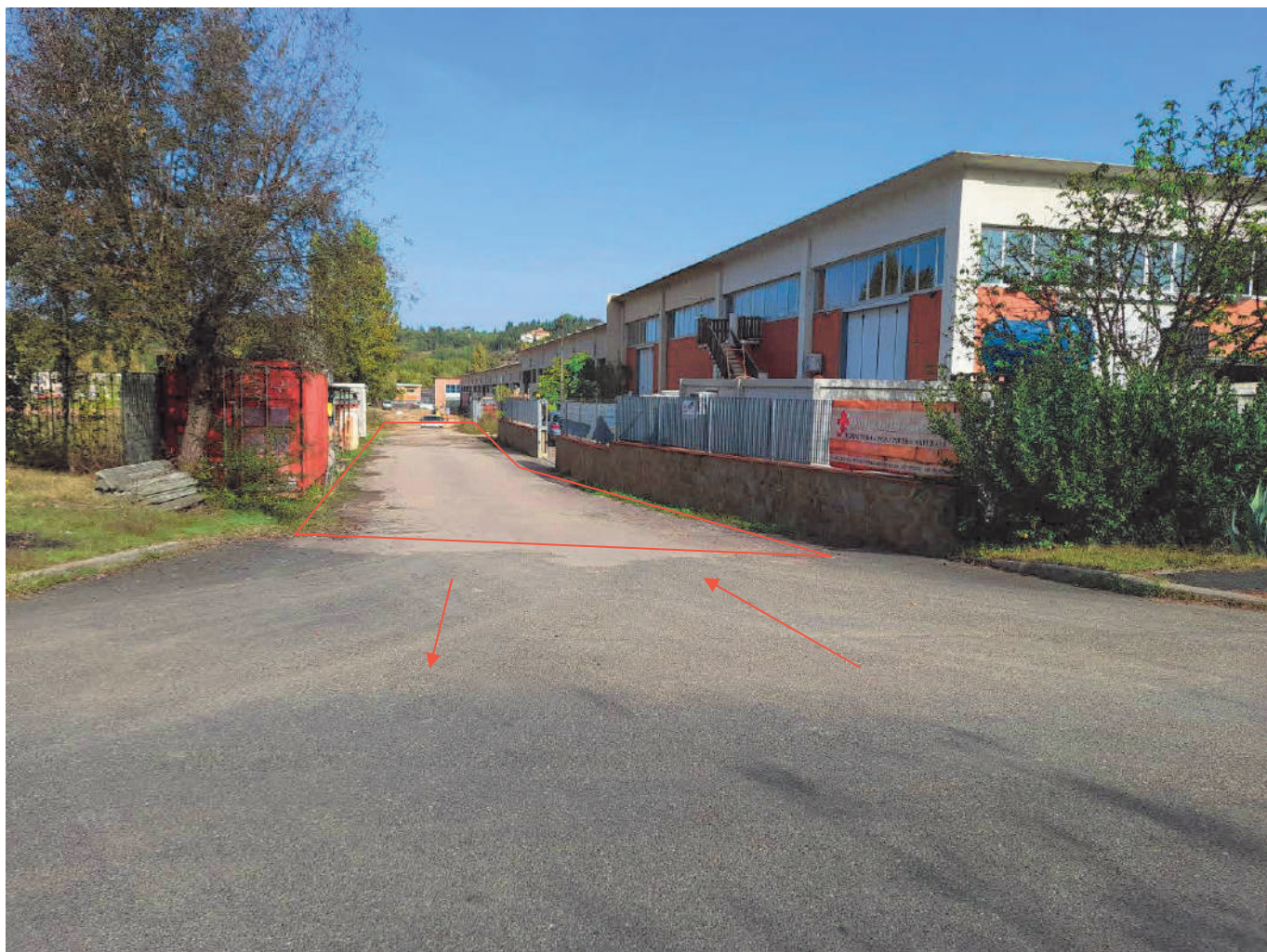
Area urbana (viabilità d'accesso) F°19 p.IIa 943 Sub.19