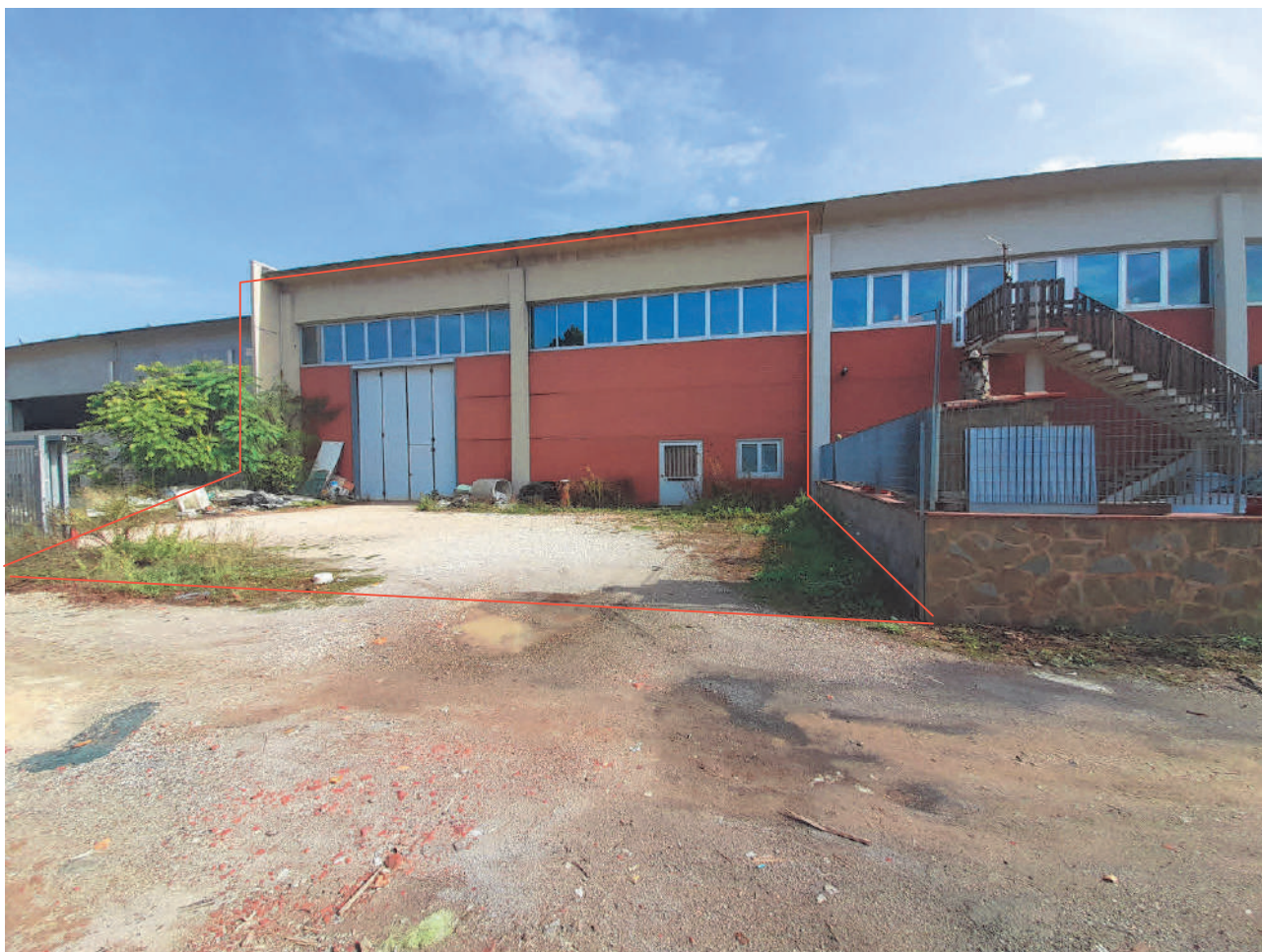
Prospetto ovest del fabbricato (P.Ila 943 Sub.6 e 13)