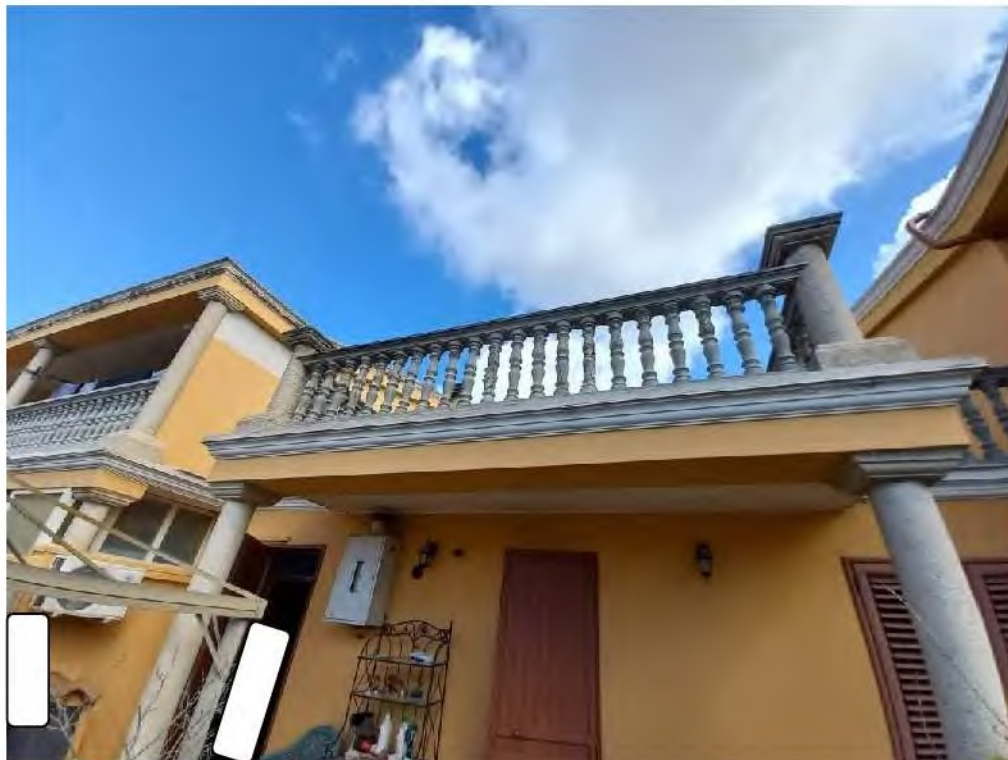
Foto 7.: parapetto su sovrastante lastrico solare (porzione non accatastata e non oggetto di pignoramento)