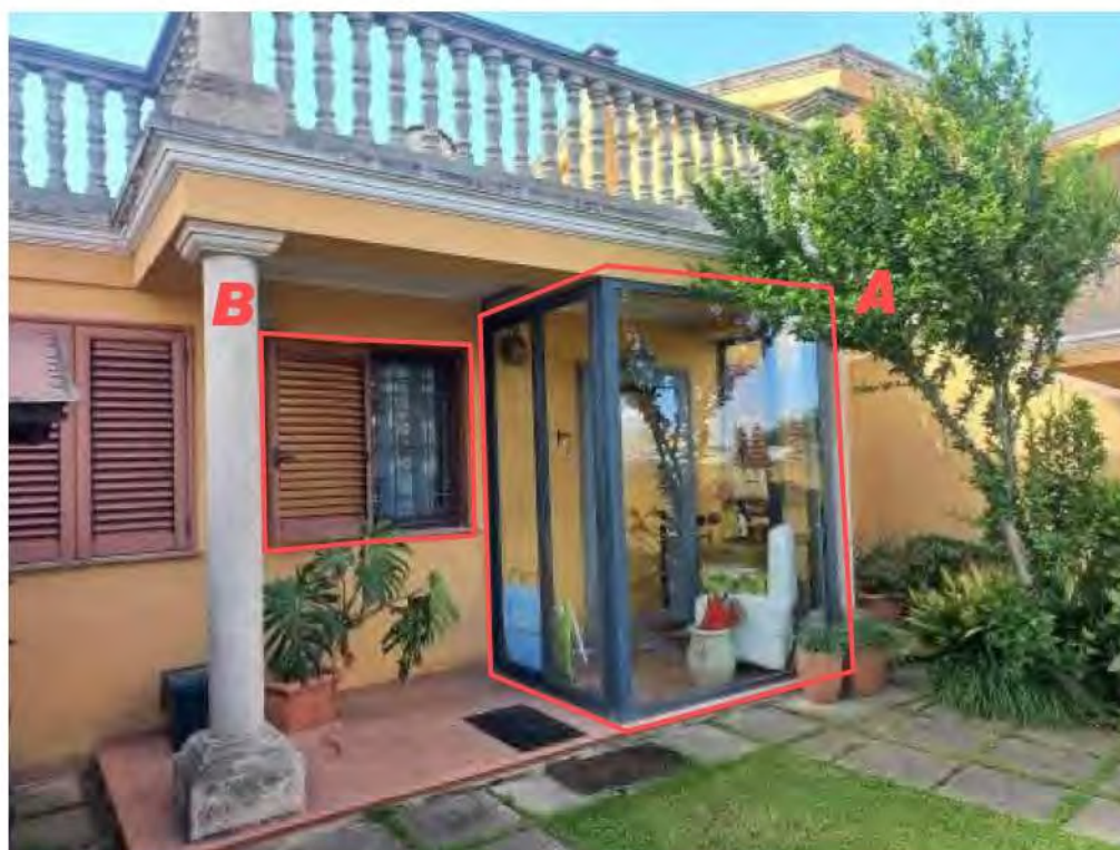
Foto 14. : chiusura non autorizzata (A) e finestra in posizione lievemente differente da quanto previsto in progetto (B)