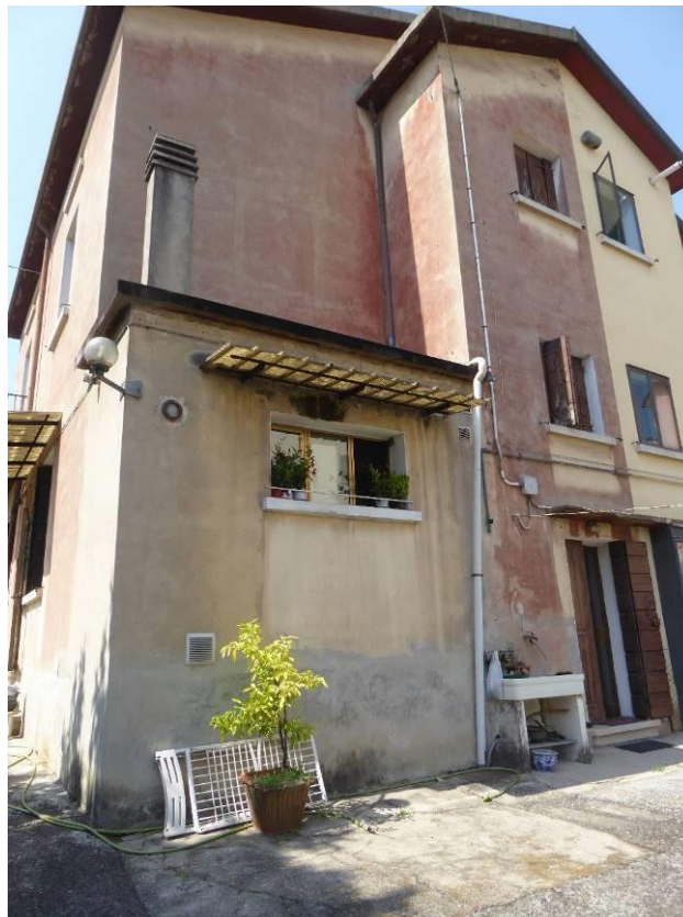
Foto 12 – vista da sud ovest (visibile ampliamento cucina piano terra)