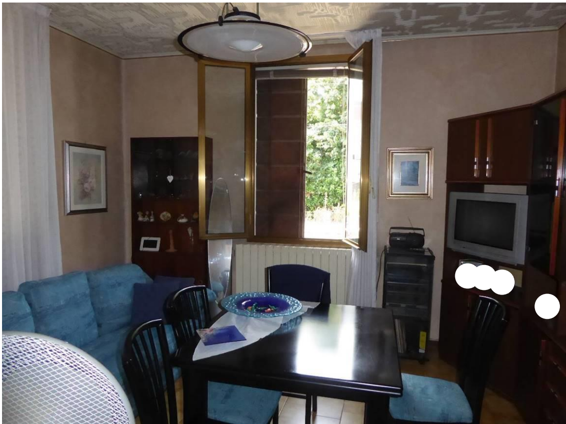
Foto 24 - soggiorno