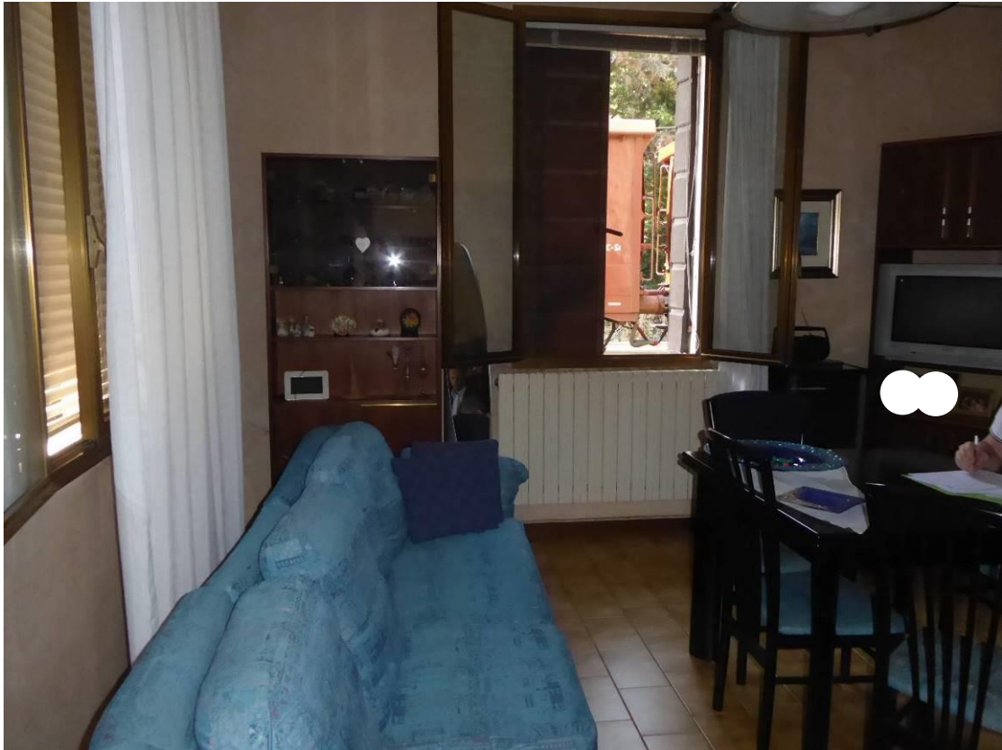
Foto 23 - soggiorno