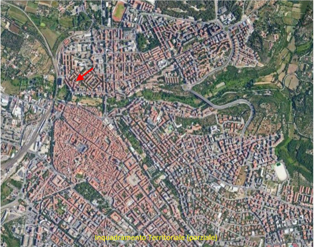
Inquadramento Territoriale (parziale)