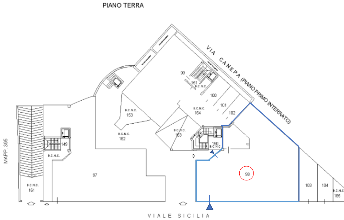
Planimetria P.T. e individuazione locale commerciale