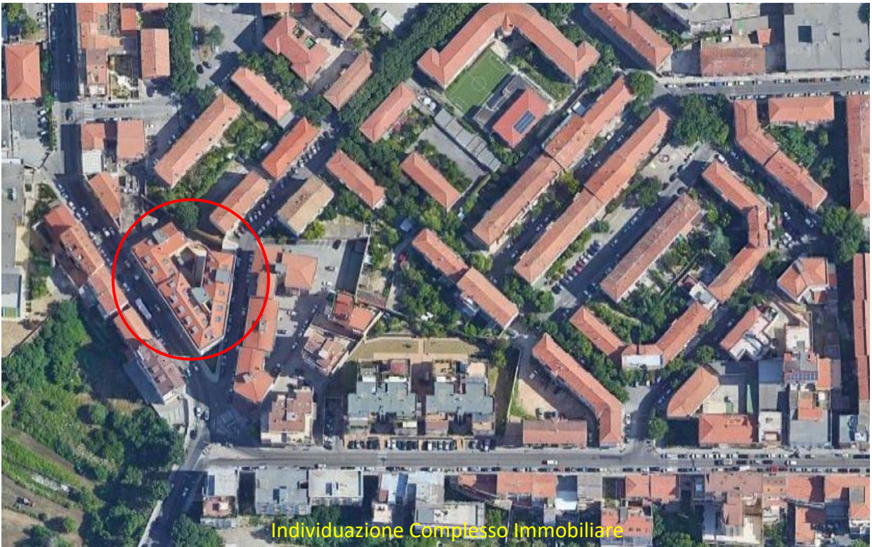
Individuazione Complesso Immobiliare