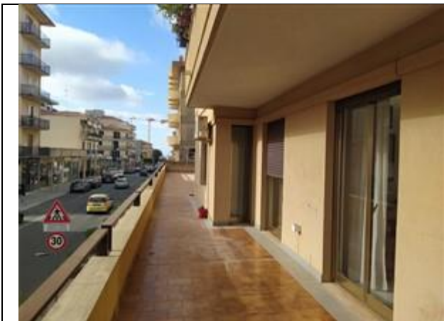
Foto n. 13: Balcone lato via Sacro Cuore (la porzione di pertinenza è quella fino alla prima finestra del corridoio, in corrispondenza della risega)

Piena proprietà di un locale ad uso ufficio ubicato al primo piano dell'edificio condominiale sito a Modica in via Sacro Cuore 12