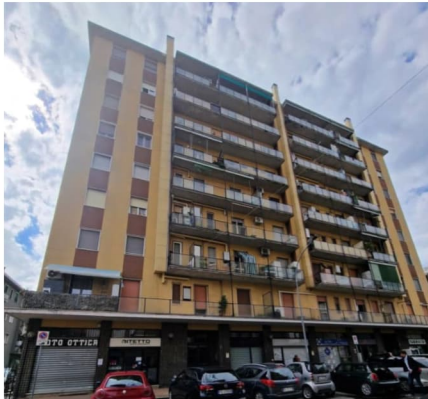
prospetto via San Remo