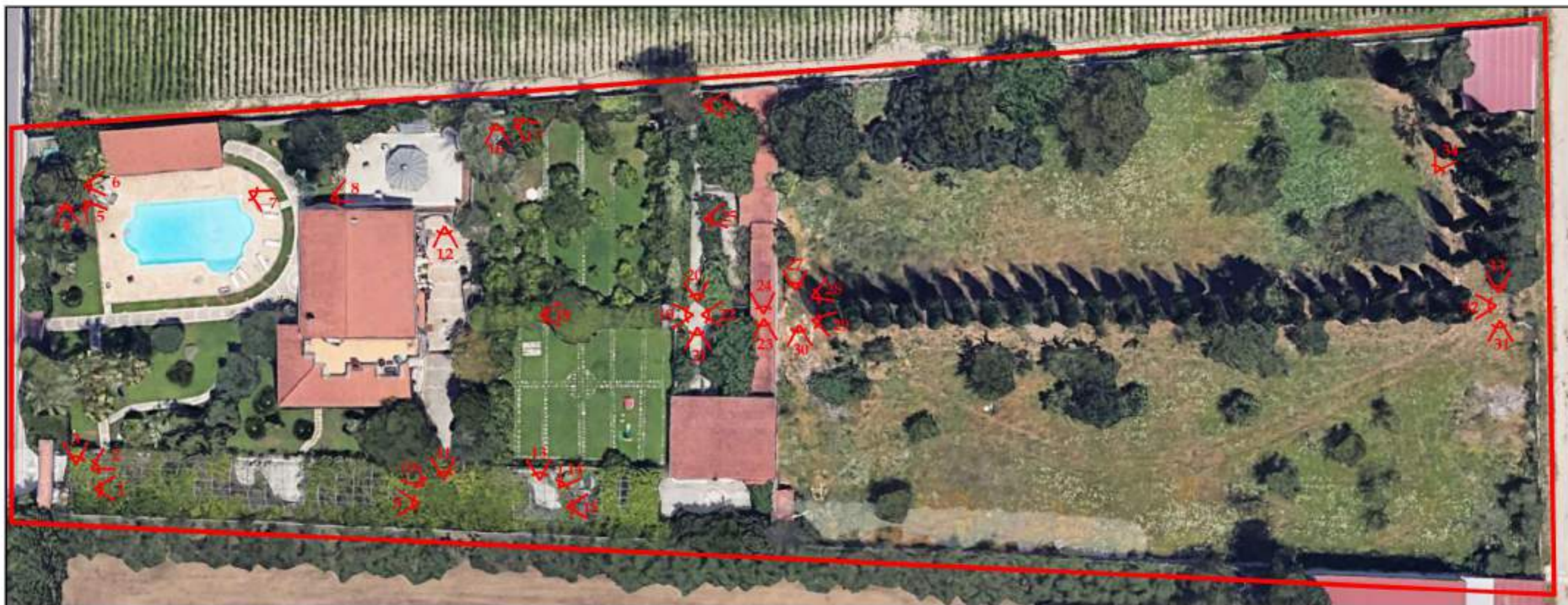
Figura 1: Vista di insieme con indicazione dei coni ottici