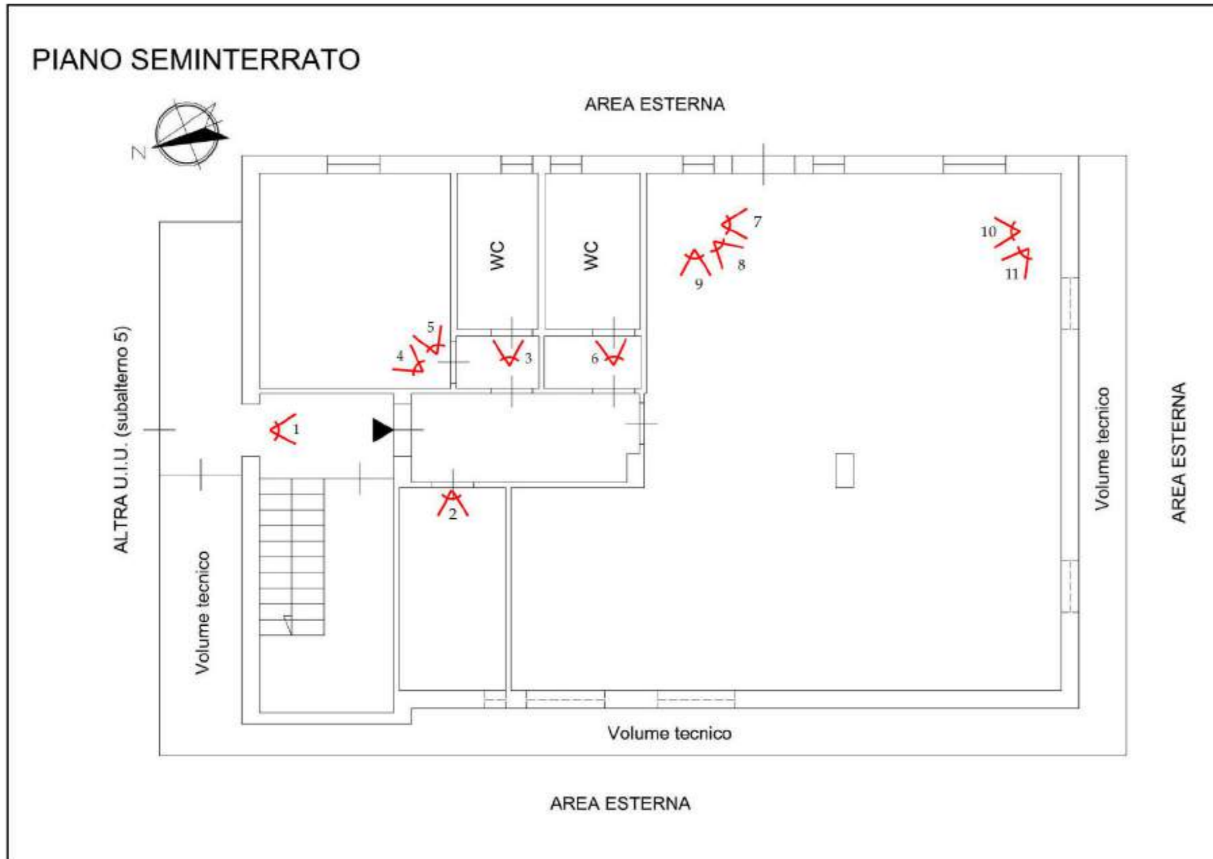
Figura 1: Planimetria di rilievo con indicazione dei coni ottici