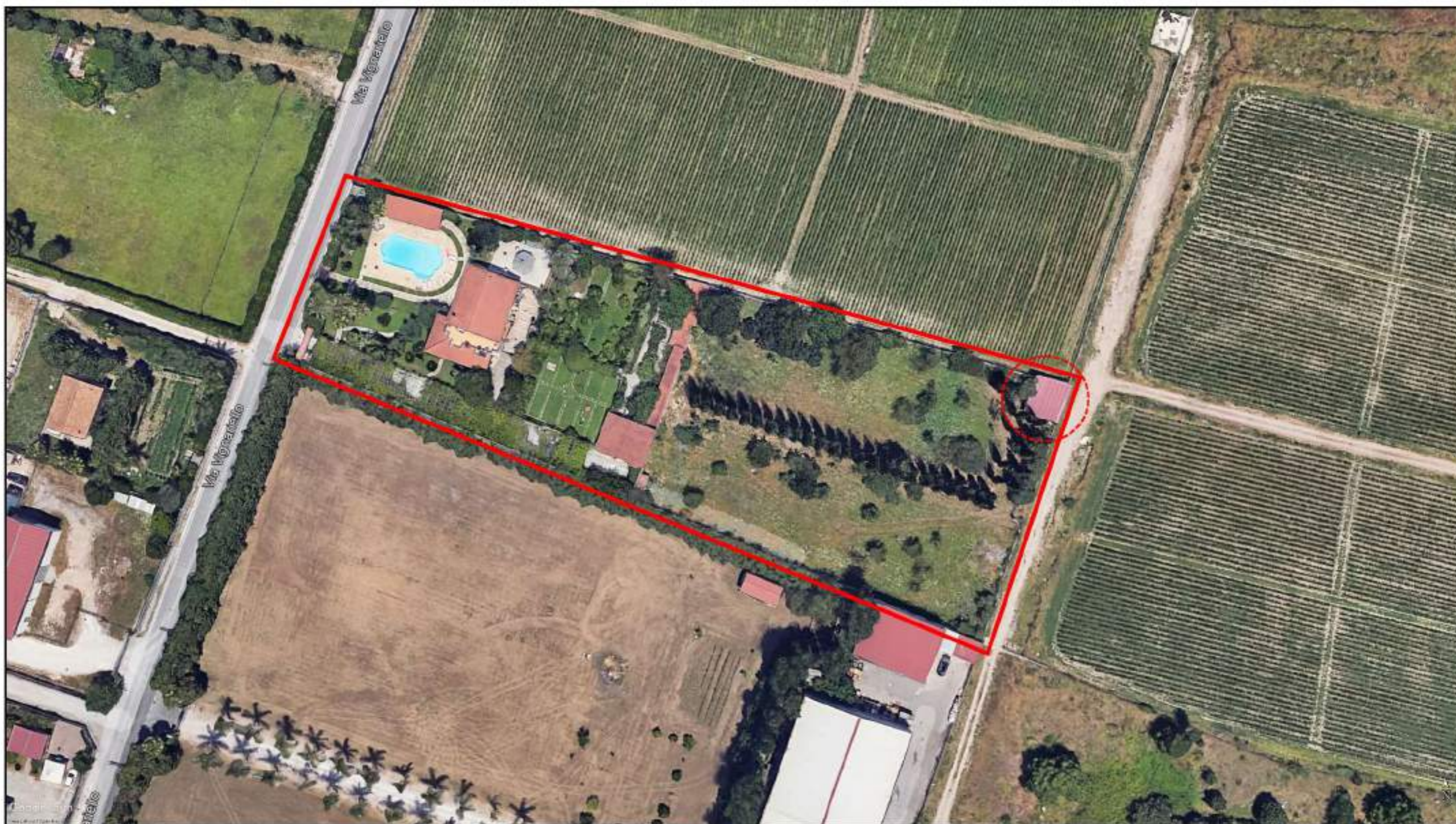
Ortofoto dei luoghi (in evidenza il compendio immobiliare pignorato e l'ubicazione dell'unità immobiliare in oggetto)