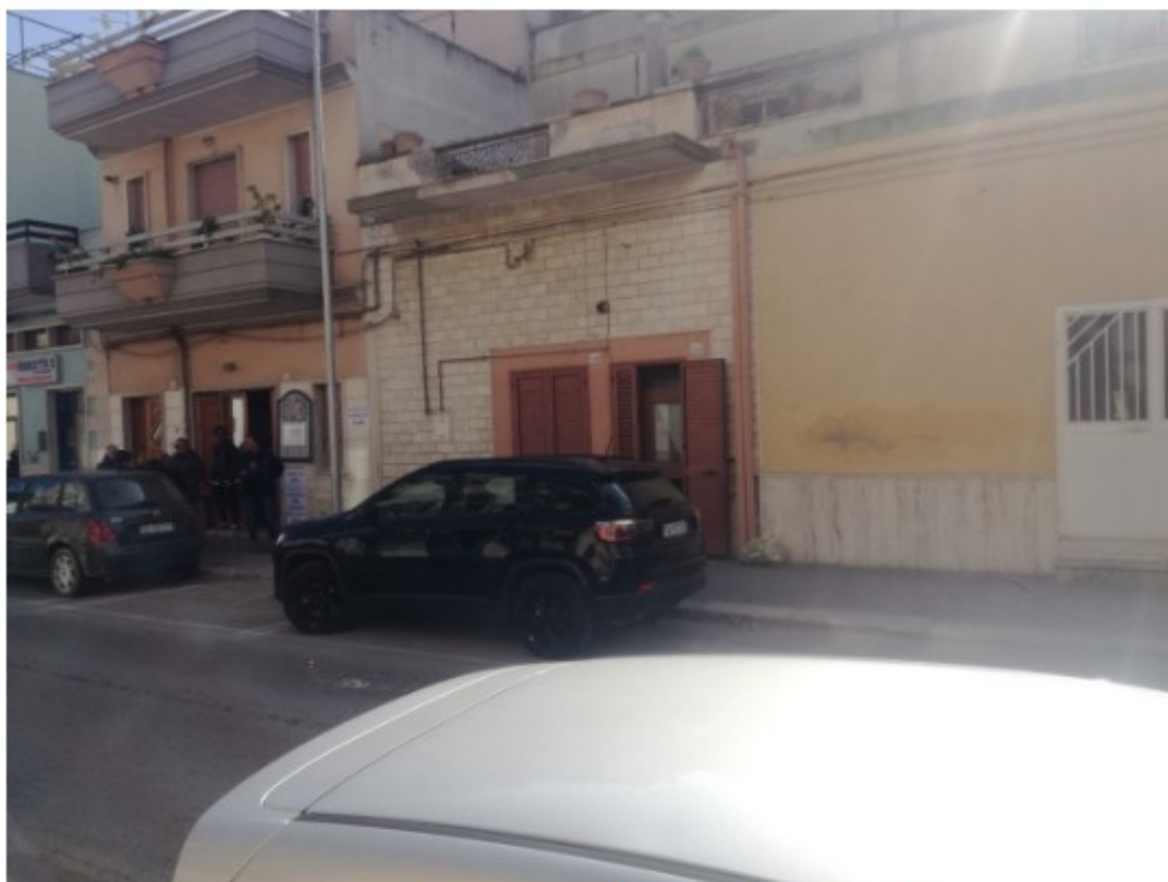
Ingresso immobile via Roma, 158