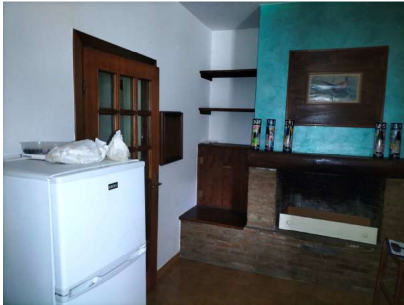
FOTOGRAMMA n° 15