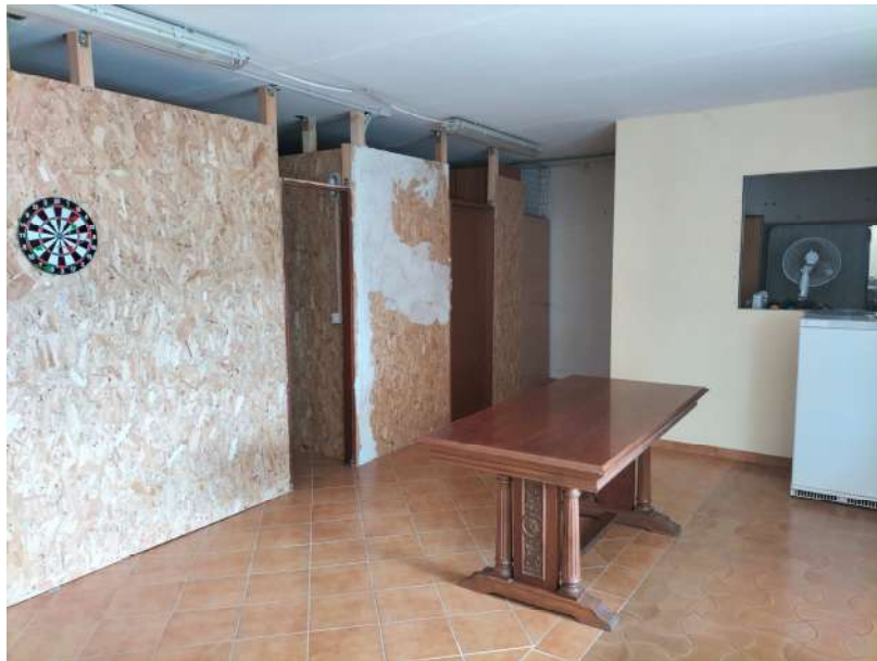
FOTOGRAMMA n° 13