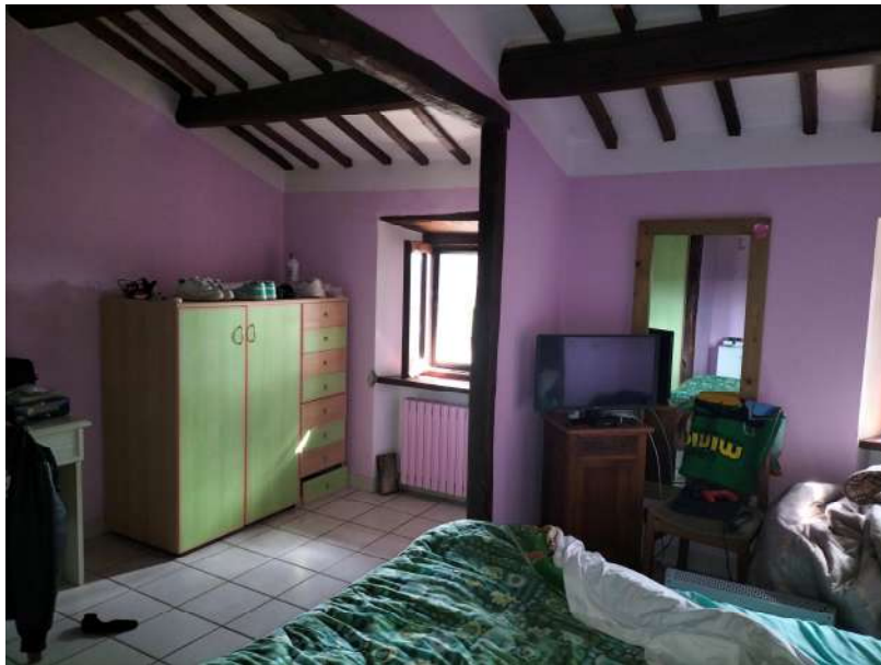
FOTOGRAMMA n° 34

TRIBUNALE DI TERNI - ES. IMM. N° 144/2022 CASSA DI RISPARMIO DI ORVIETO S.p.A. contro OMISSIS LOTTO UNICO