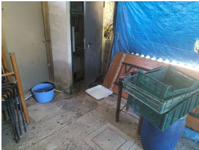
FOTOGRAMMA n° 10

TRIBUNALE DI TERNI - ES. IMM. N° 144/2022 CASSA DI RISPARMIO DI ORVIETO S.p.A. contro OMISSIS LOTTO UNICO