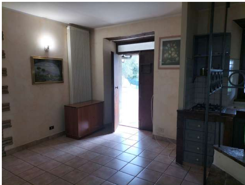
FOTOGRAMMA n° 20

TRIBUNALE DI TERNI - ES. IMM. N° 144/2022 CASSA DI RISPARMIO DI ORVIETO S.p.A. contro OMISSIS LOTTO UNICO