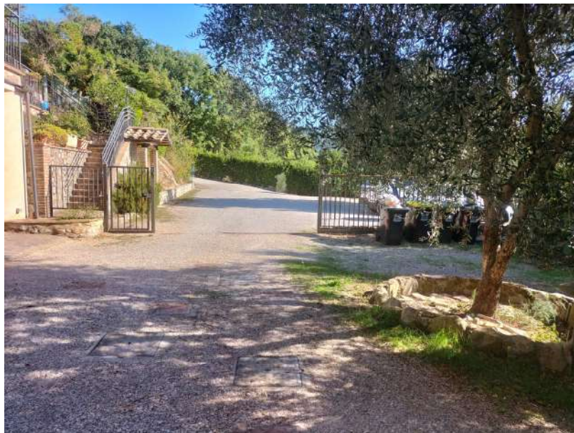
FOTOGRAMMA n° 6

TRIBUNALE DI TERNI - ES. IMM. N° 144/2022 CASSA DI RISPARMIO DI ORVIETO S.p.A. contro OMISSIS LOTTO UNICO