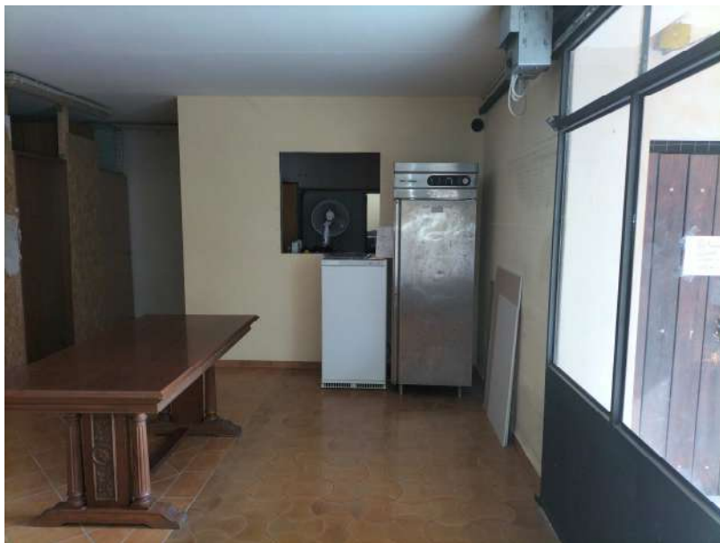
FOTOGRAMMA n° 12

TRIBUNALE DI TERNI - ES. IMM. N° 144/2022 CASSA DI RISPARMIO DI ORVIETO S.p.A. contro OMISSIS LOTTO UNICO