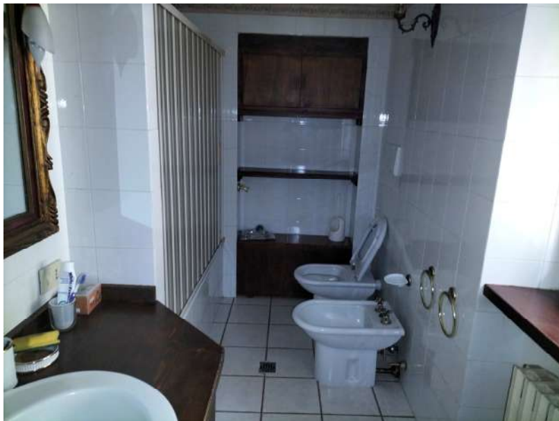
FOTOGRAMMA n° 38

TRIBUNALE DI TERNI - ES. IMM. N° 144/2022 CASSA DI RISPARMIO DI ORVIETO S.p.A. contro OMISSIS LOTTO UNICO