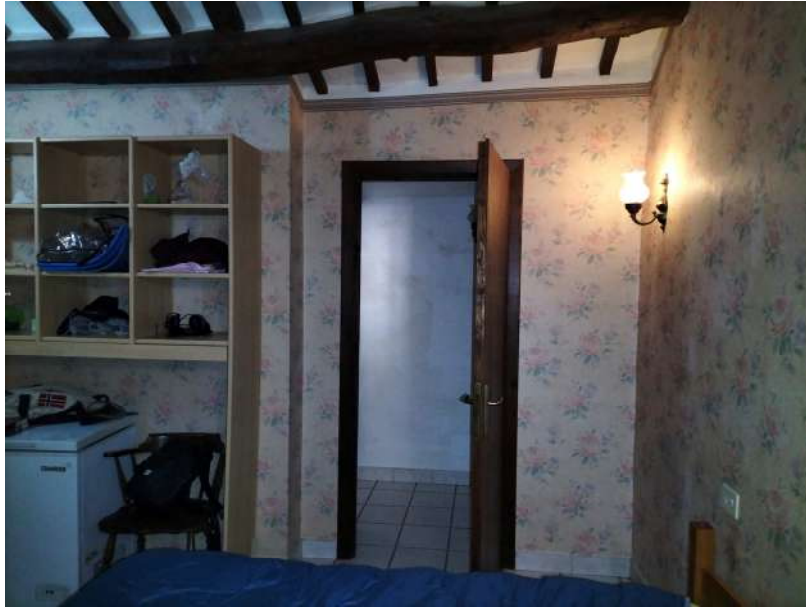
FOTOGRAMMA n° 35