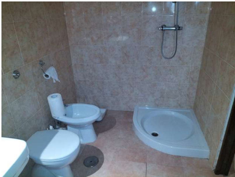
FOTOGRAMMA n° 26

TRIBUNALE DI TERNI - ES. IMM. N° 144/2022 CASSA DI RISPARMIO DI ORVIETO S.p.A. contro OMISSIS LOTTO UNICO