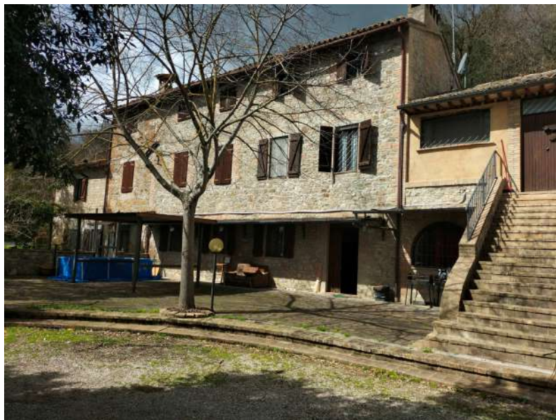
FOTOGRAMMA n° 4

TRIBUNALE DI TERNI - ES. IMM. N° 144/2022 CASSA DI RISPARMIO DI ORVIETO S.p.A. contro OMISSIS LOTTO UNICO