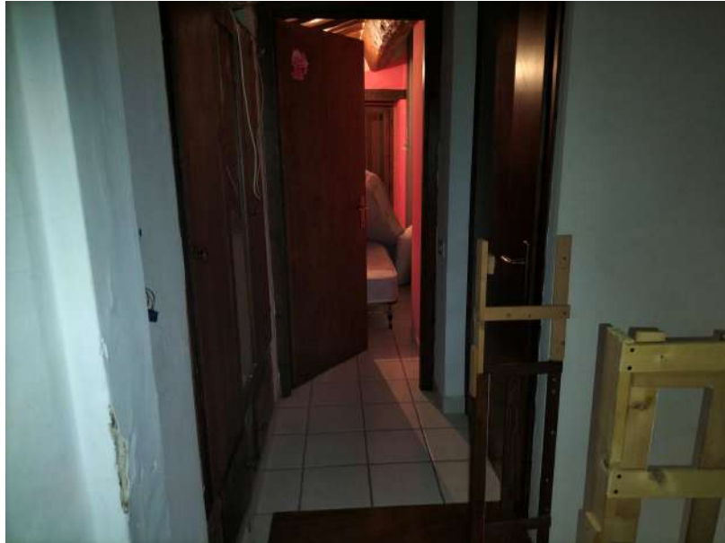
FOTOGRAMMA n° 31