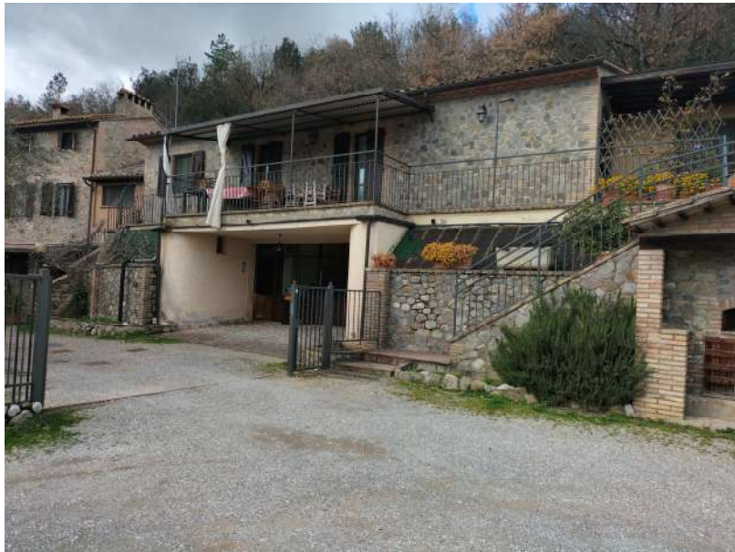
FOTOGRAMMA n° 2

TRIBUNALE DI TERNI - ES. IMM. N° 144/2022 CASSA DI RISPARMIO DI ORVIETO S.p.A. contro OMISSIS LOTTO UNICO