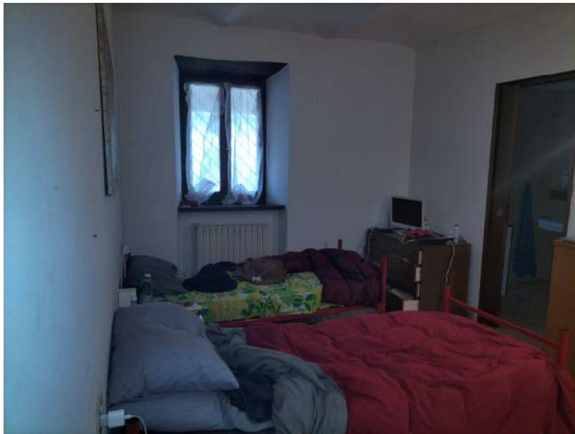
FOTOGRAMMA n° 24

TRIBUNALE DI TERNI - ES. IMM. N° 144/2022 CASSA DI RISPARMIO DI ORVIETO S.p.A. contro OMISSIS LOTTO UNICO