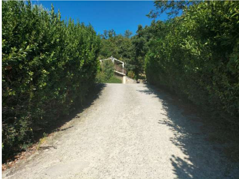
FOTOGRAMMA n° 9