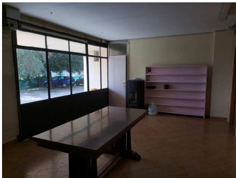
FOTOGRAMMA n° 14

TRIBUNALE DI TERNI - ES. IMM. N° 144/2022 CASSA DI RISPARMIO DI ORVIETO S.p.A. contro OMISSIS LOTTO UNICO