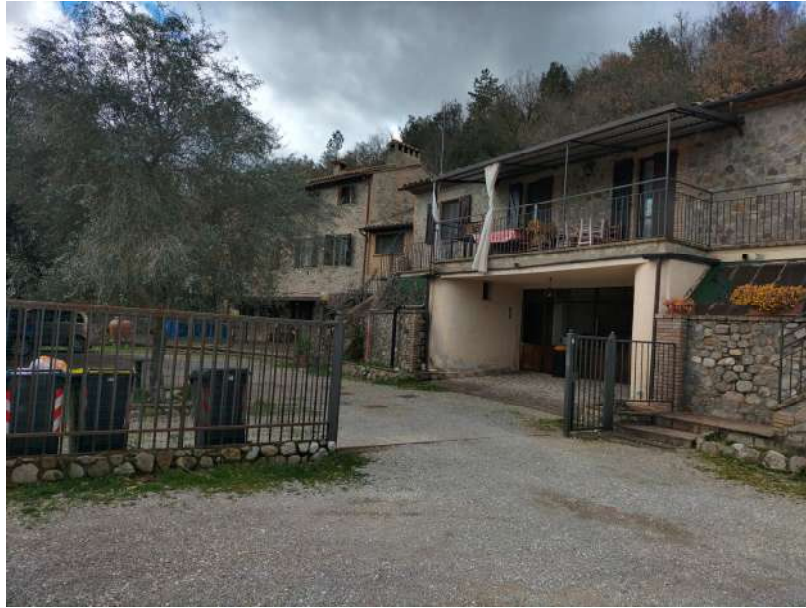
FOTOGRAMMA n° 1