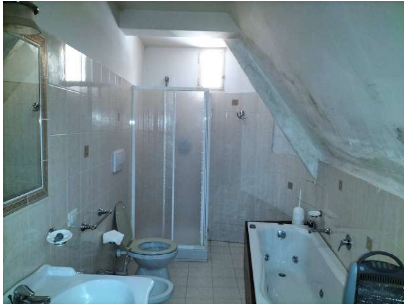
FOTOGRAMMA n° 19