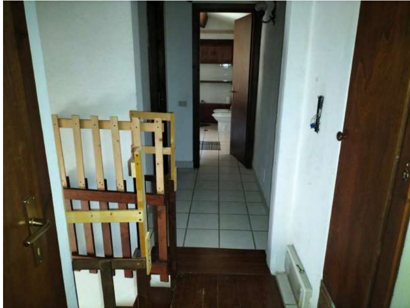
FOTOGRAMMA n° 37