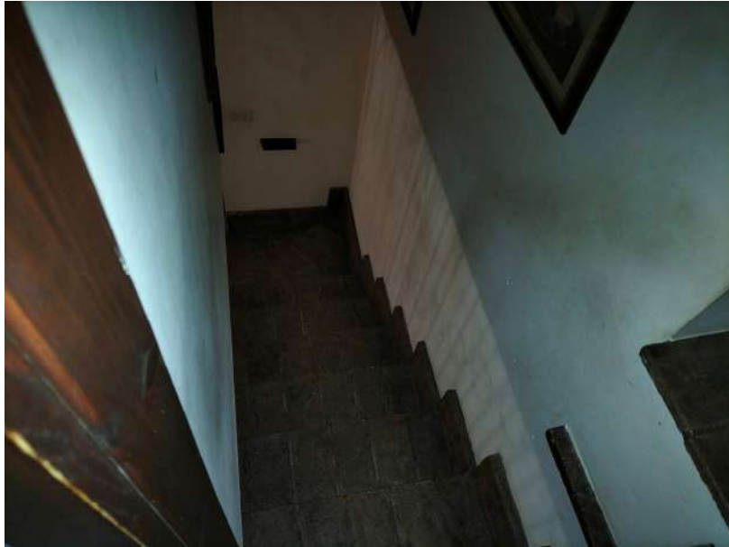
FOTOGRAMMA n° 27