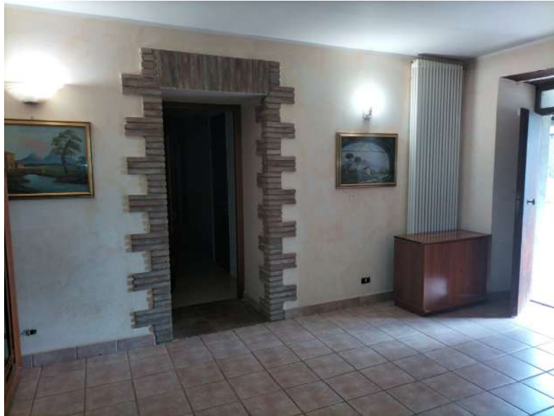
FOTOGRAMMA n° 21