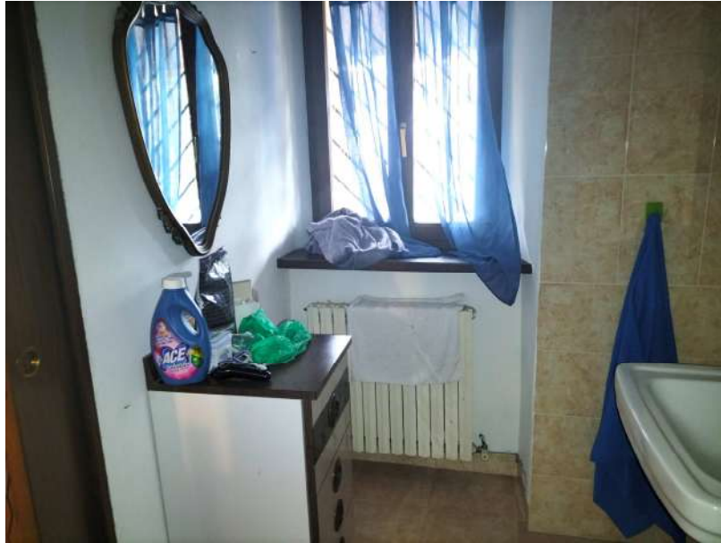
FOTOGRAMMA n° 25