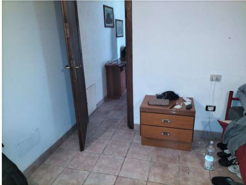
FOTOGRAMMA n° 23