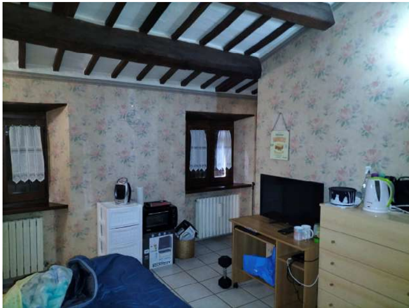
FOTOGRAMMA n° 36

TRIBUNALE DI TERNI - ES. IMM. N° 144/2022 CASSA DI RISPARMIO DI ORVIETO S.p.A. contro OMISSIS LOTTO UNICO