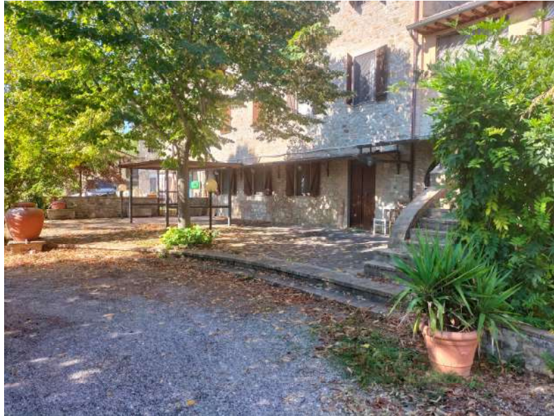
FOTOGRAMMA n° 5