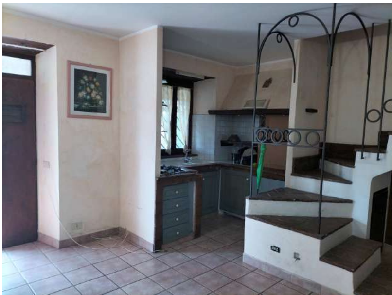
FOTOGRAMMA n° 22

TRIBUNALE DI TERNI - ES. IMM. N° 144/2022 CASSA DI RISPARMIO DI ORVIETO S.p.A. contro OMISSIS LOTTO UNICO