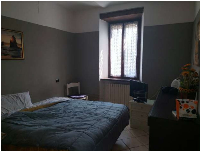
FOTOGRAMMA n° 28

TRIBUNALE DI TERNI - ES. IMM. N° 144/2022 CASSA DI RISPARMIO DI ORVIETO S.p.A. contro OMISSIS LOTTO UNICO