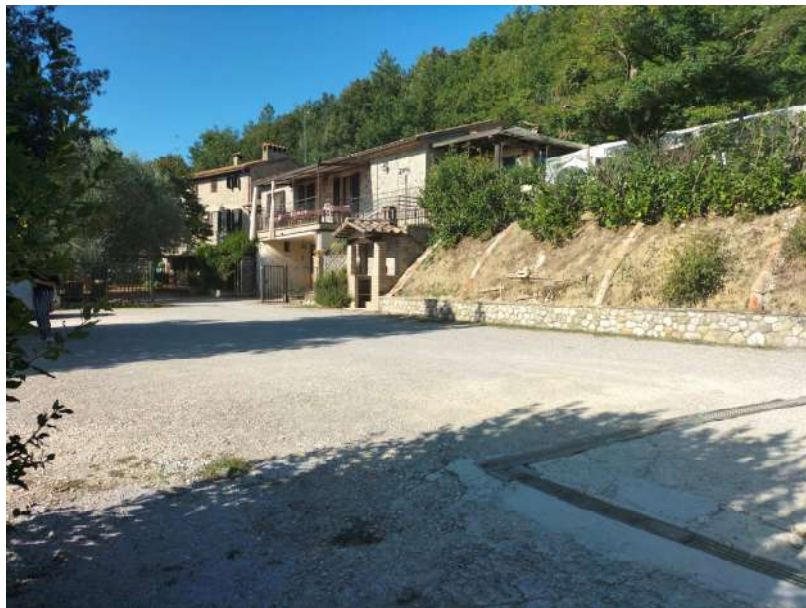
FOTOGRAMMA n° 8

TRIBUNALE DI TERNI - ES. IMM. N° 144/2022 CASSA DI RISPARMIO DI ORVIETO S.p.A. contro OMISSIS LOTTO UNICO