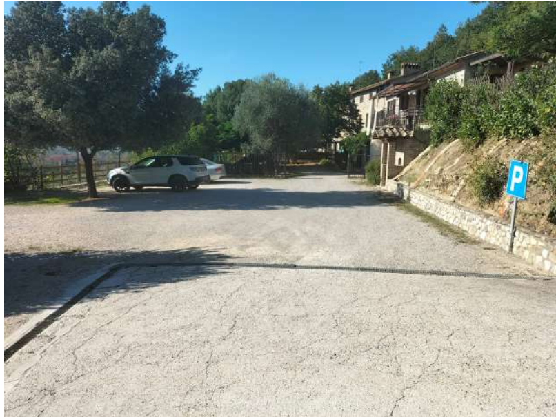
FOTOGRAMMA n° 7