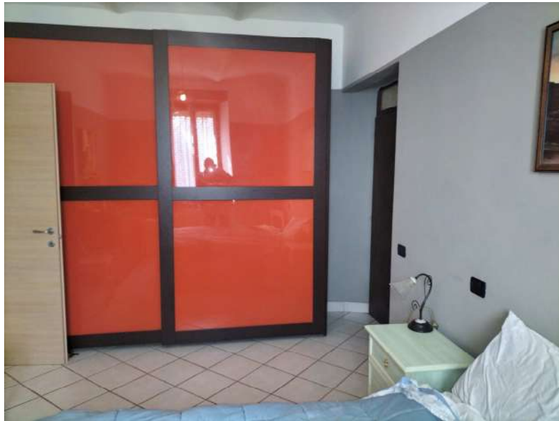
FOTOGRAMMA n° 29