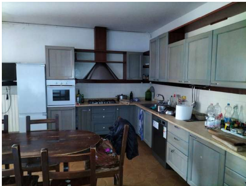
FOTOGRAMMA n° 16

TRIBUNALE DI TERNI - ES. IMM. N° 144/2022 CASSA DI RISPARMIO DI ORVIETO S.p.A. contro OMISSIS LOTTO UNICO