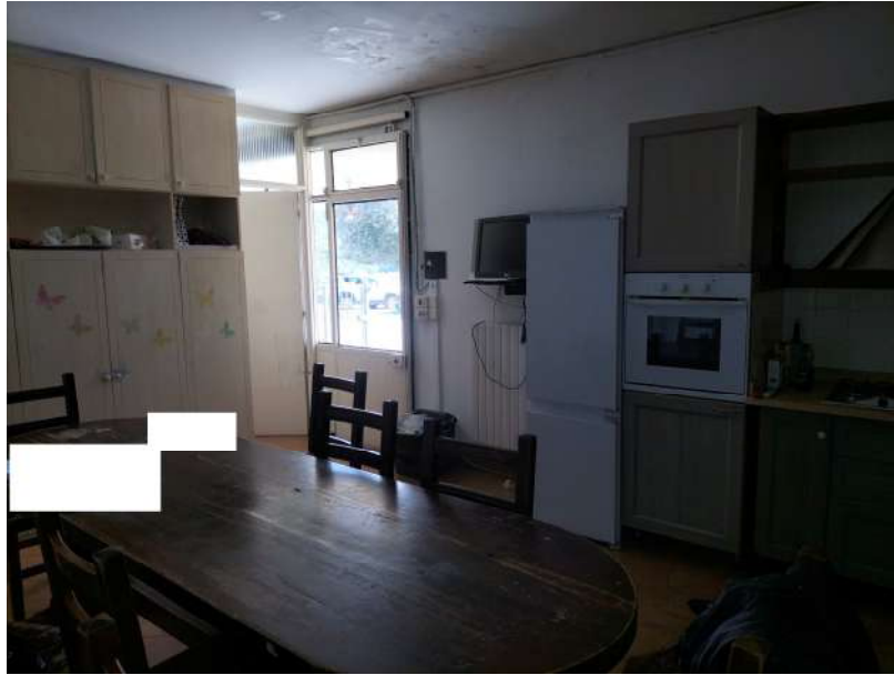
FOTOGRAMMA n° 17