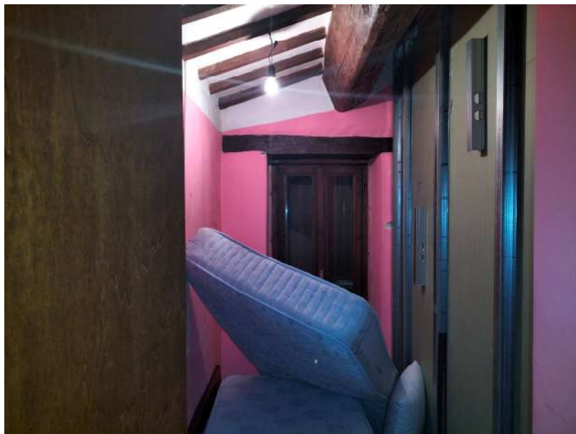
FOTOGRAMMA n° 32

TRIBUNALE DI TERNI - ES. IMM. N° 144/2022 CASSA DI RISPARMIO DI ORVIETO S.p.A. contro OMISSIS LOTTO UNICO