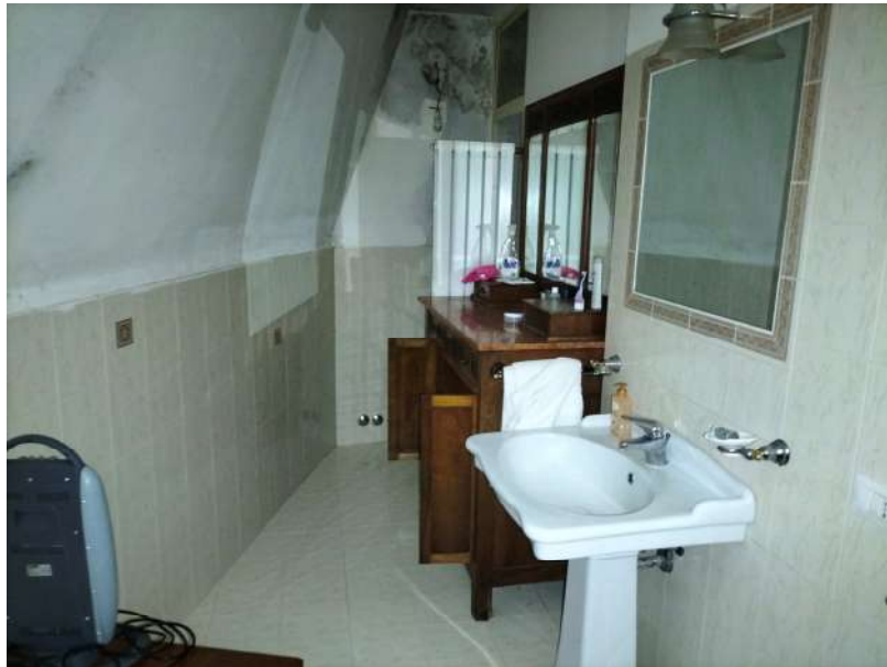
FOTOGRAMMA n° 18

TRIBUNALE DI TERNI - ES. IMM. N° 144/2022 CASSA DI RISPARMIO DI ORVIETO S.p.A. contro OMISSIS LOTTO UNICO