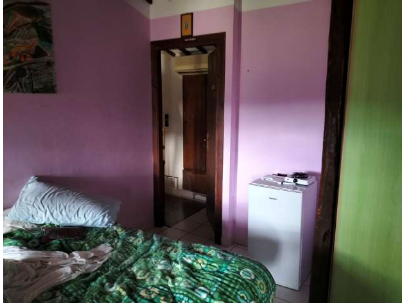
FOTOGRAMMA n° 33