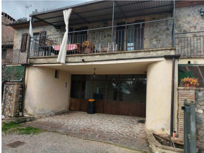
FOTOGRAMMA n° 11