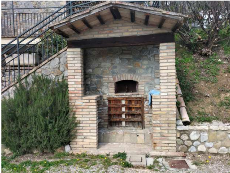
FOTOGRAMMA n° 3