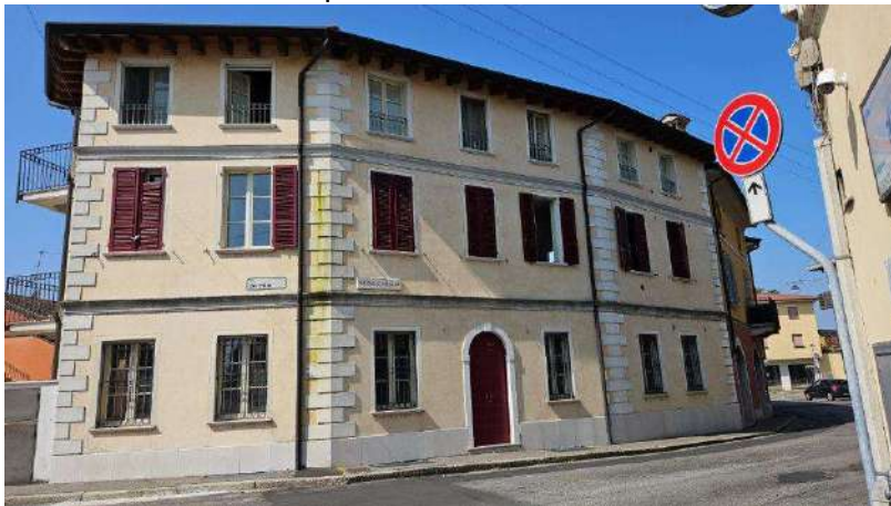
Dettaglio facciata prospiciente via Caldara