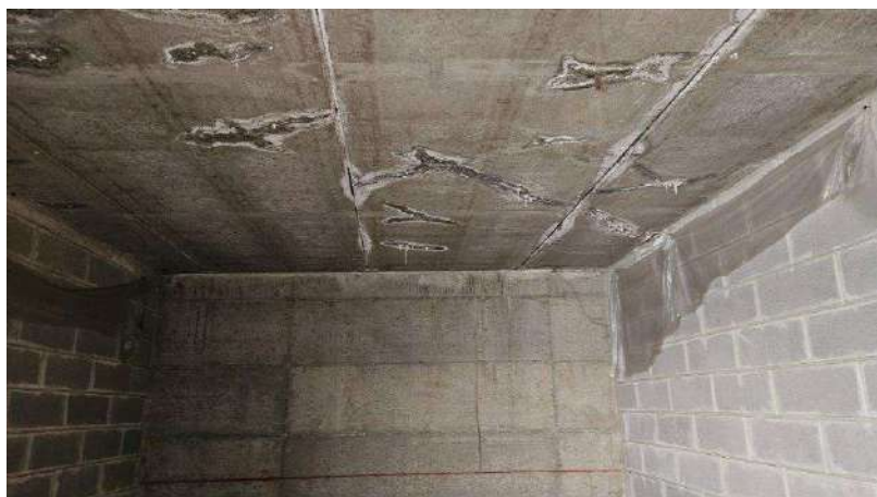
Dettaglio infiltrazioni soffitto