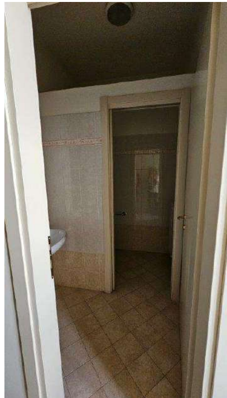
Antibagno del servizio interno