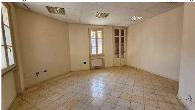
Locale lato via Dei Mille/cortile interno