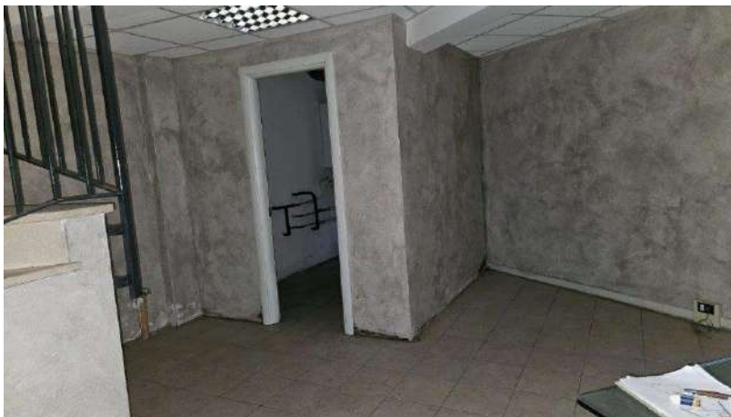
Ingresso centrale termica