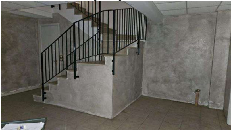
Scala interna all'interrato