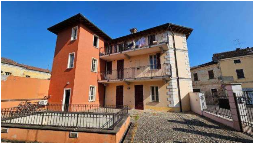
Prospetto interno lato Sud