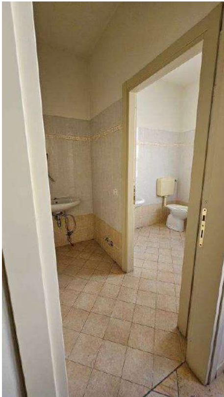
Bagno lato strada