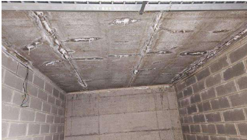
Dettaglio infiltrazioni dal soffitto