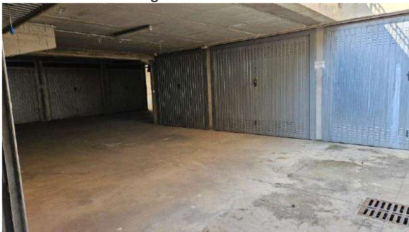
Spazio di manovra