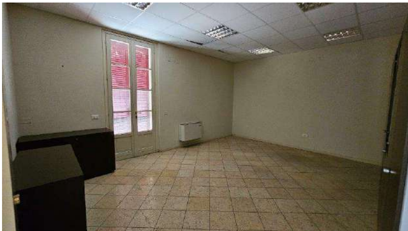
Locale lato cortile interno