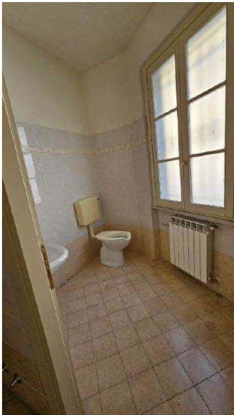
Bagno lato strada