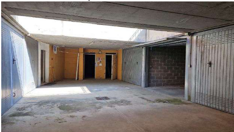
Zona caveau (ingresso da vano scala a sinistra e porte cantine di fronte)