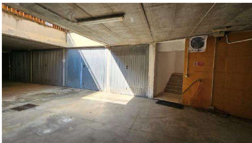
Dettaglio zona ingresso da vano scala