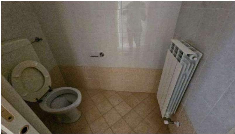
Dettaglio bagno interno