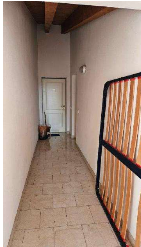
Corridoio piano secondo