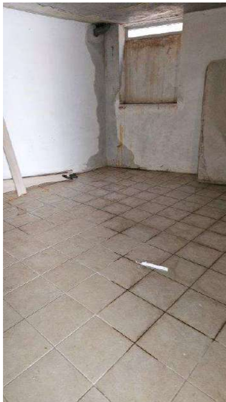
Dettaglio infiltrazione in angolo Nord-Est