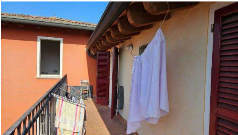
Balcone prospiciente il cortile interno