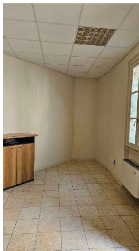
Locale di ingresso