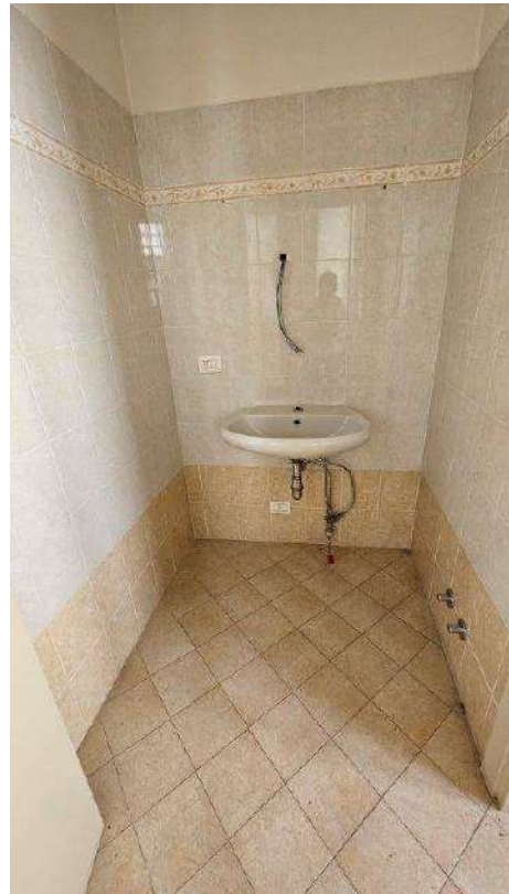
Antibagno del servizio lato strada