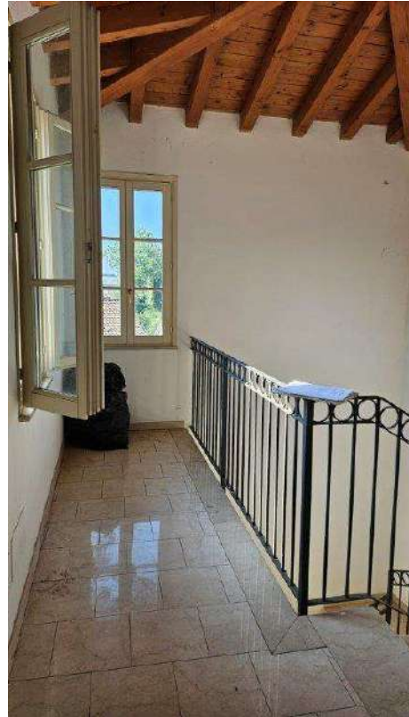
Sbarco scala a piano secondo