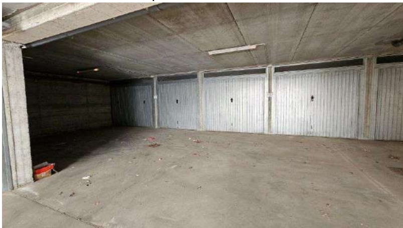
Spazio di manovra