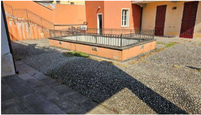
Pavimentazione cortile, cavedio centrale e ingresso a vano scala