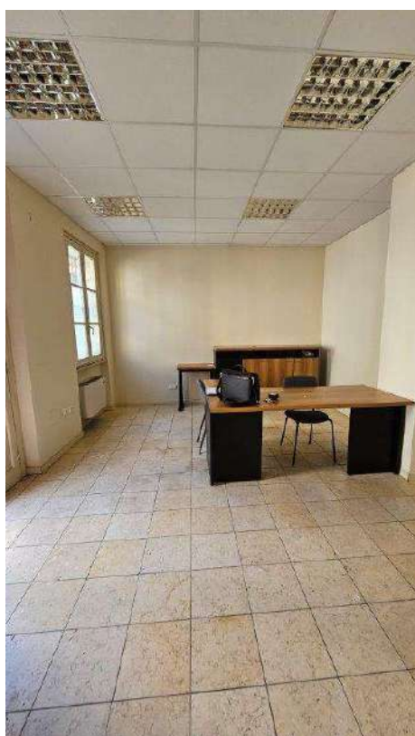
Locale di ingresso