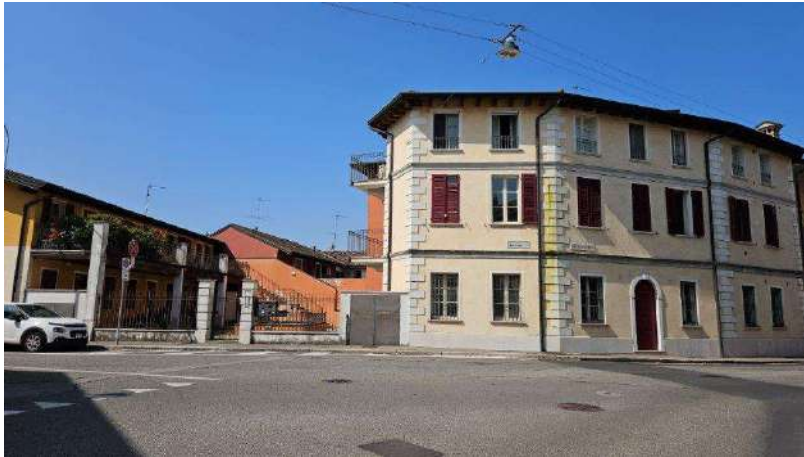
Prospetto via Dei Mille/via Caldara con cancello pedonale