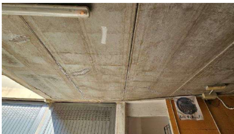
Dettaglio soffitto in lastre predalle