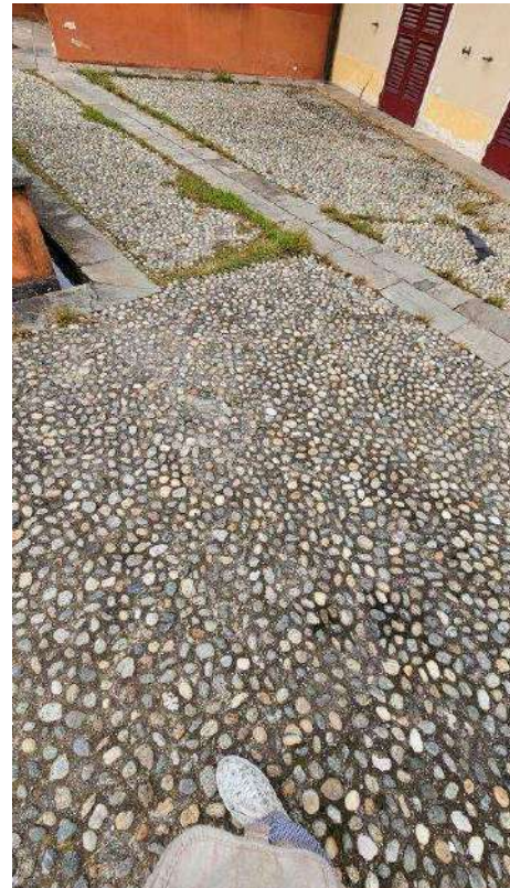
Dettaglio pavimentazione cortile