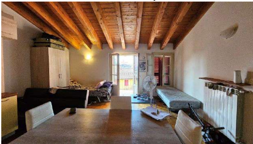
Zona giorno con accesso al balcone