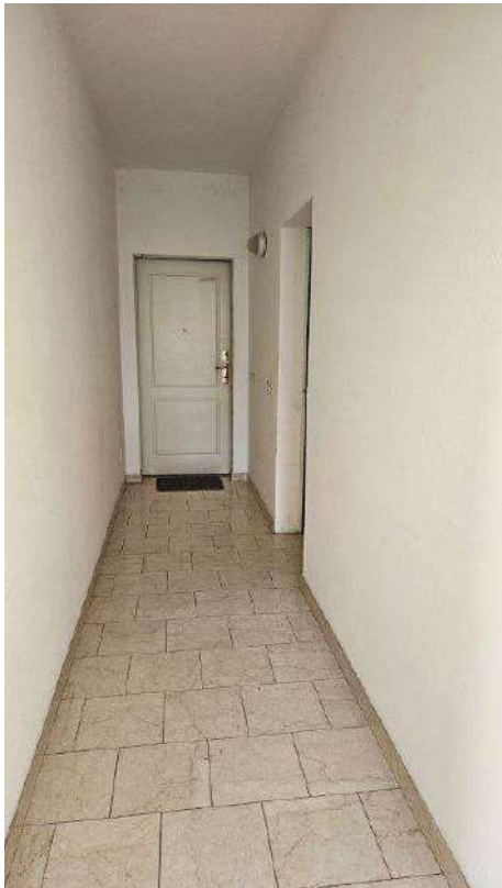
Corridoio piano primo