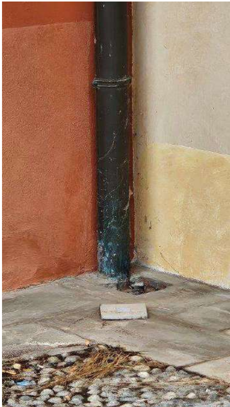
Dettaglio pluviale in rame