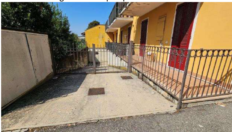
Accesso carraio da via Dei Mille