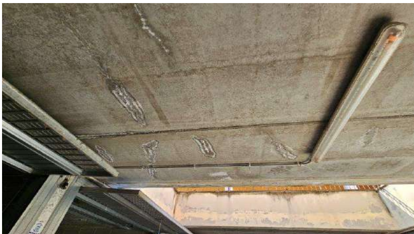
Dettaglio infiltrazioni dal soffitto