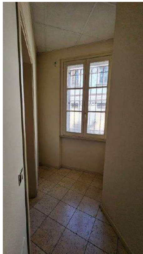
Corridoio zona bagni