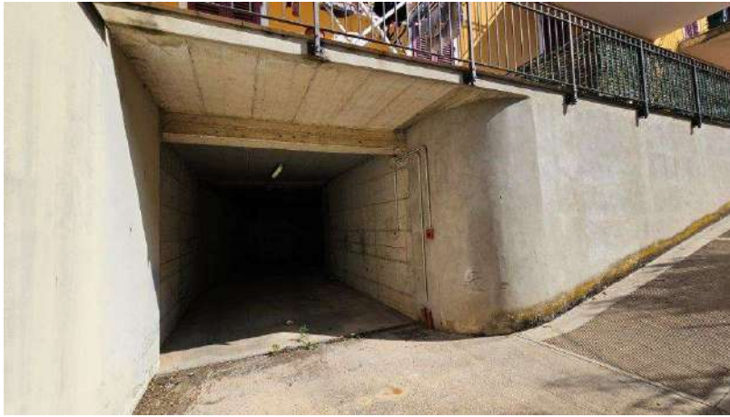
Accesso carrai all'interrato