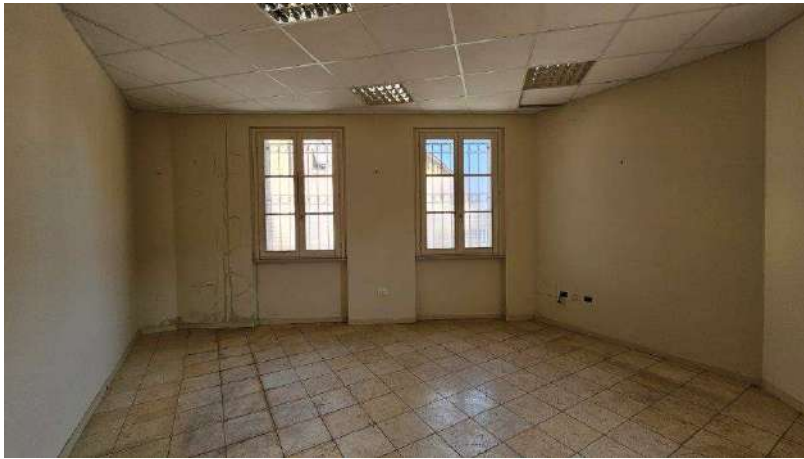
Locale lato via Dei Mille/cortile interno