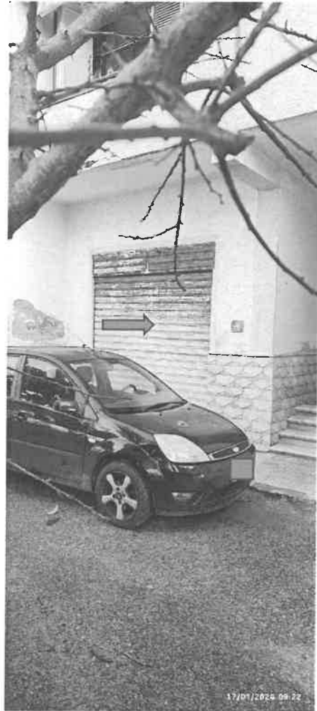
VISTA SUD OVEST