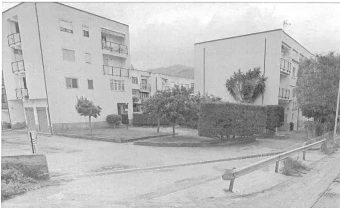
PROSPETTIVA NORS OVEST