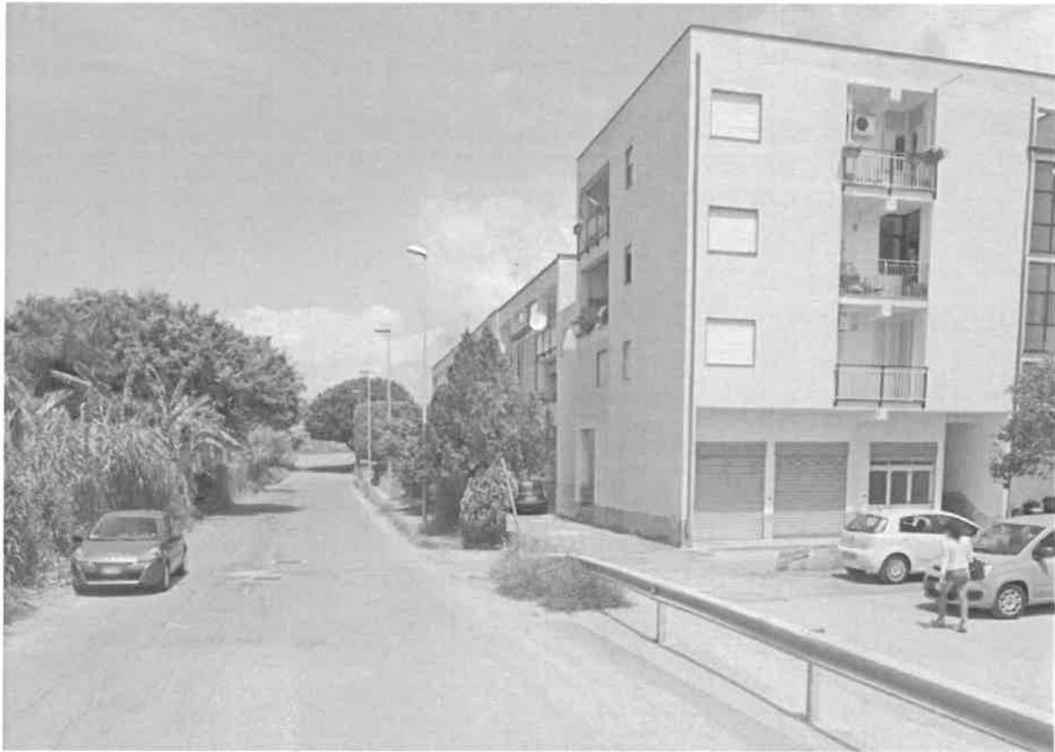
PROSPETTIVA SUD OVEST