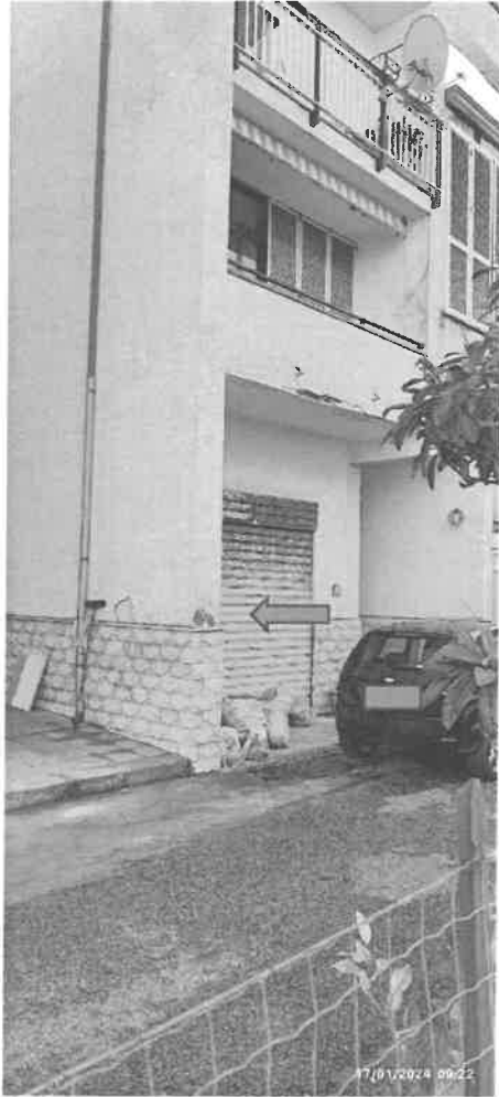
VISTA NORD OVEST