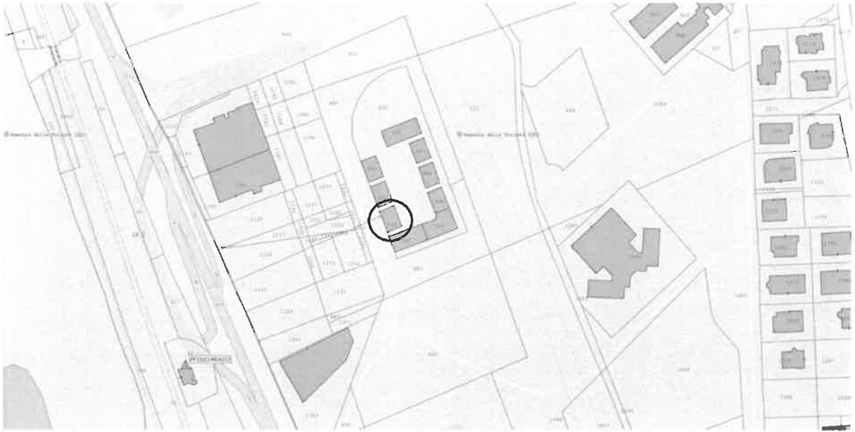
STRALCIO DELLA MAPPA CATASTALE