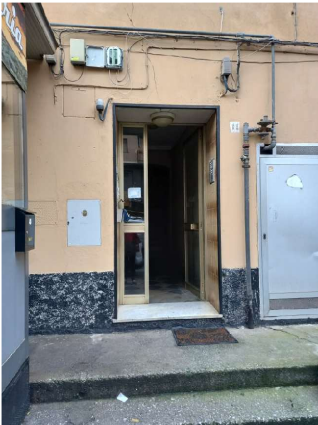
Portone d'ingresso – via Colano 11/7 - Genova