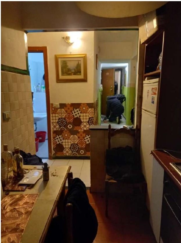
Vista dalla cucina verso l'ingresso