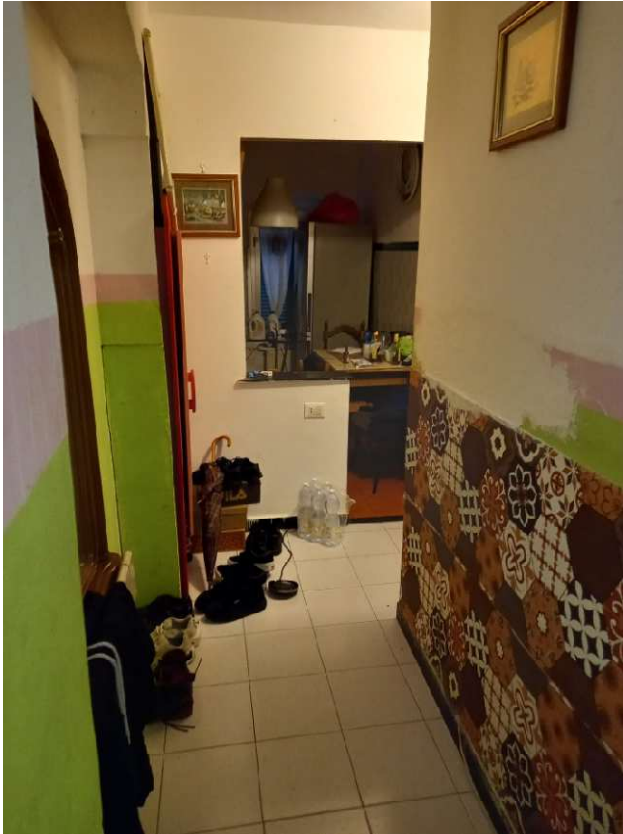
Vista dall'ingresso verso la cucina