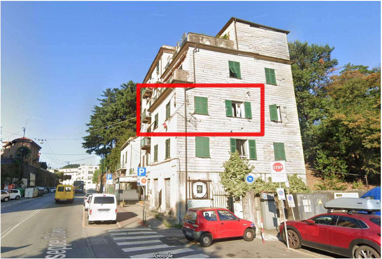
Indicato l'appartamento oggetto di perizia