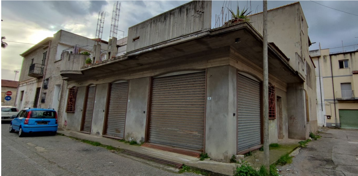
Via Salerno / Via Decima