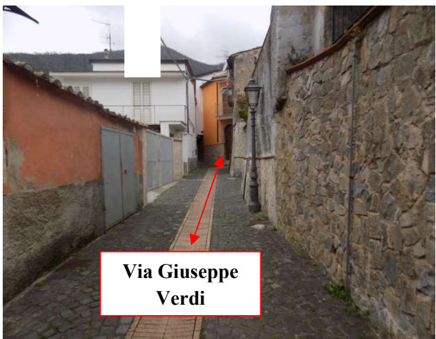
Via Giuseppe Verdi