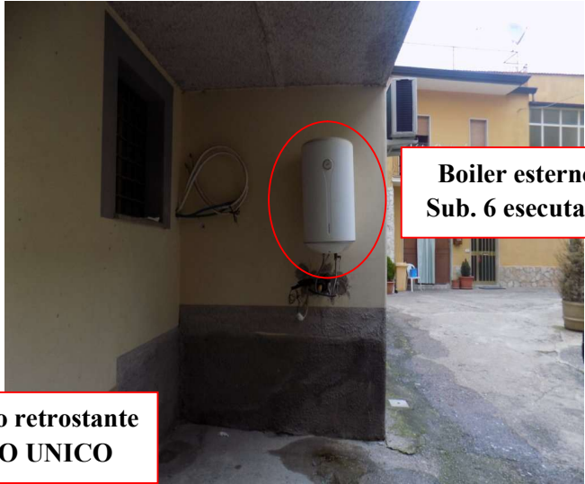
Boiler esterno Sub. 6 esecutato