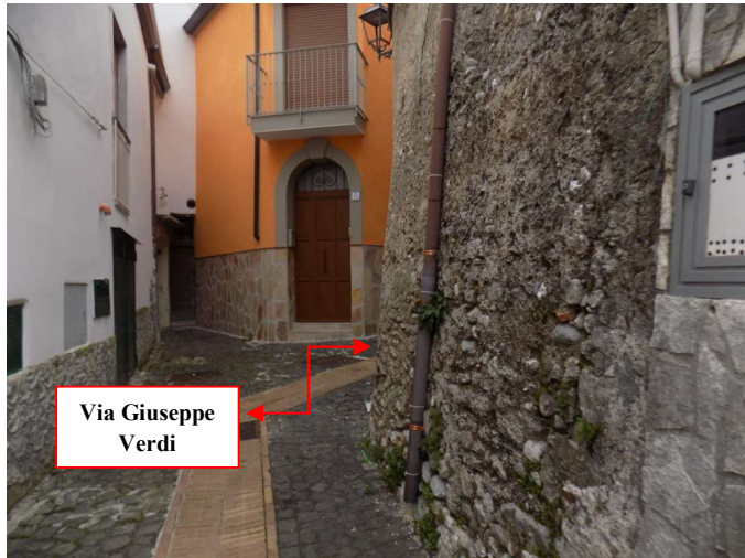
Via Giuseppe Verdi