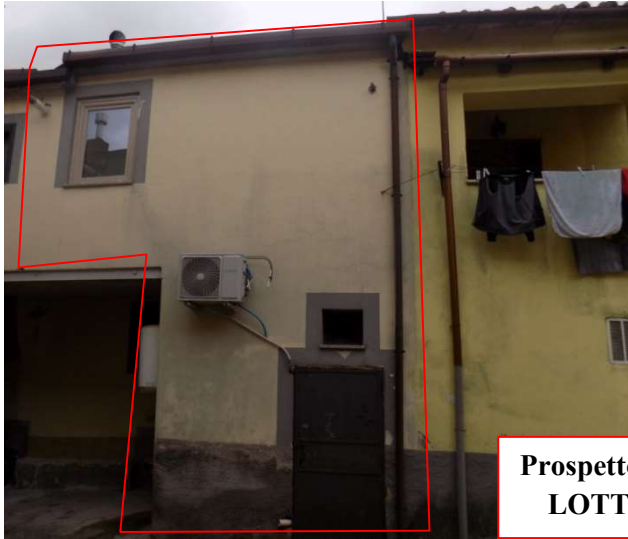
Prospetto retrostante LOTTO UNICO