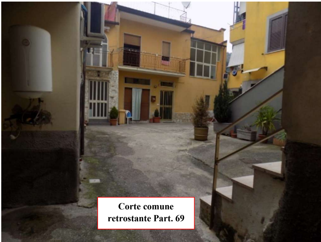
Corte comune retrostante Part. 69