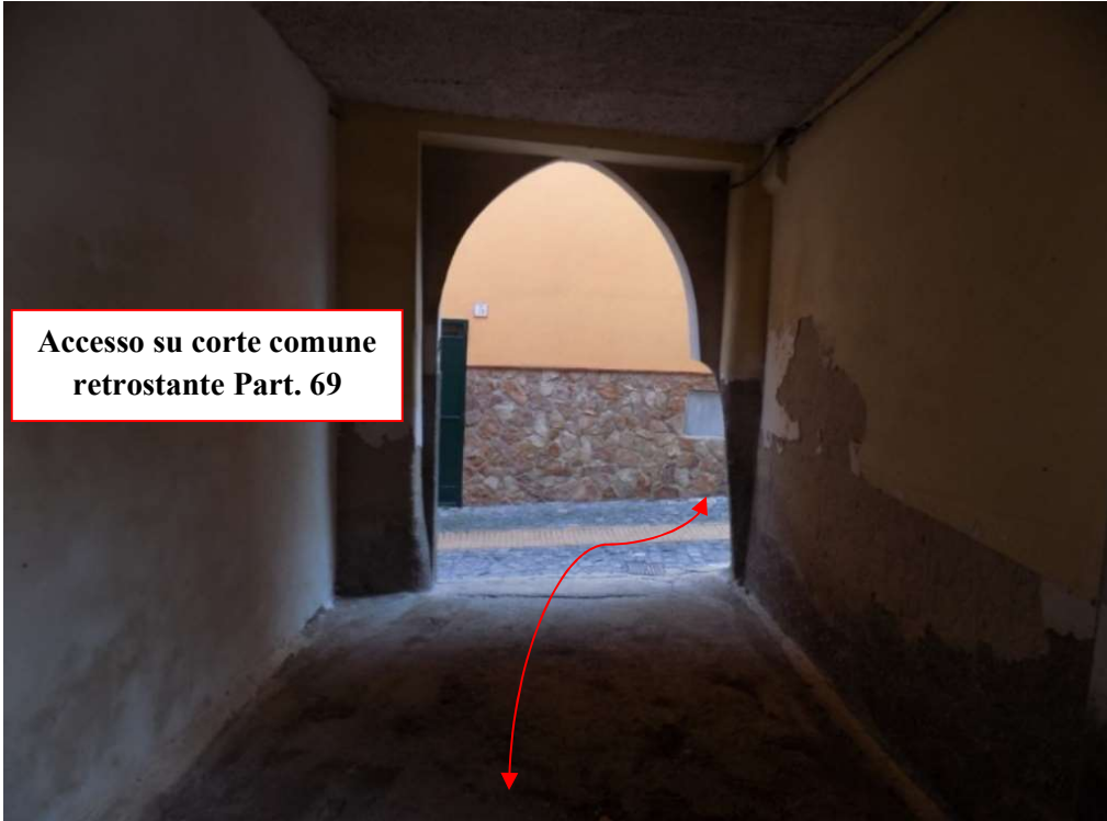
Accesso su corte comune retrostante Part. 69