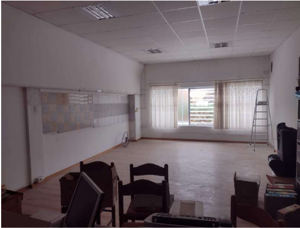
Ufficio soppalco p1