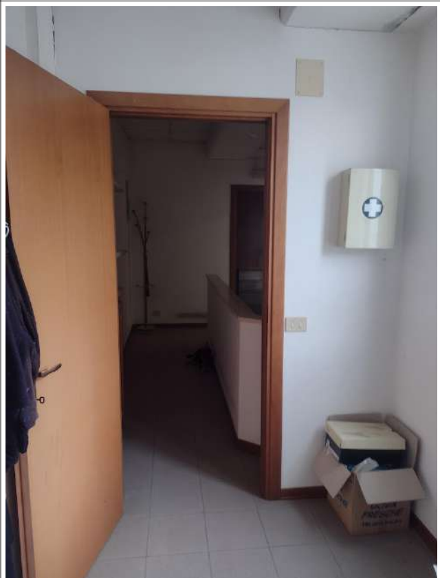
Disimpegno/spogliatoio wc p1