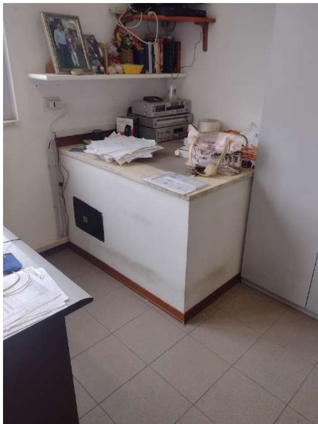
Part interno uff direzionale