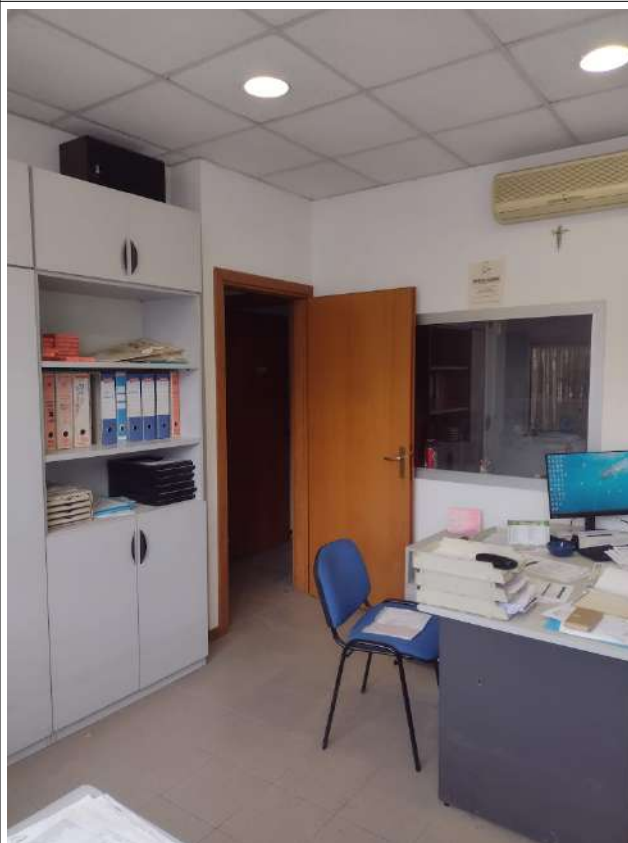
Ufficio direzionale p1