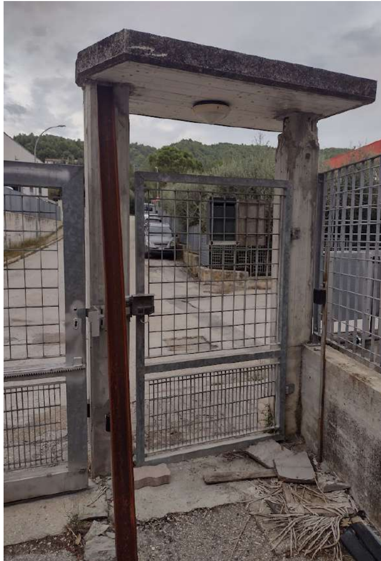
part ingresso nord pedonale danneggiato