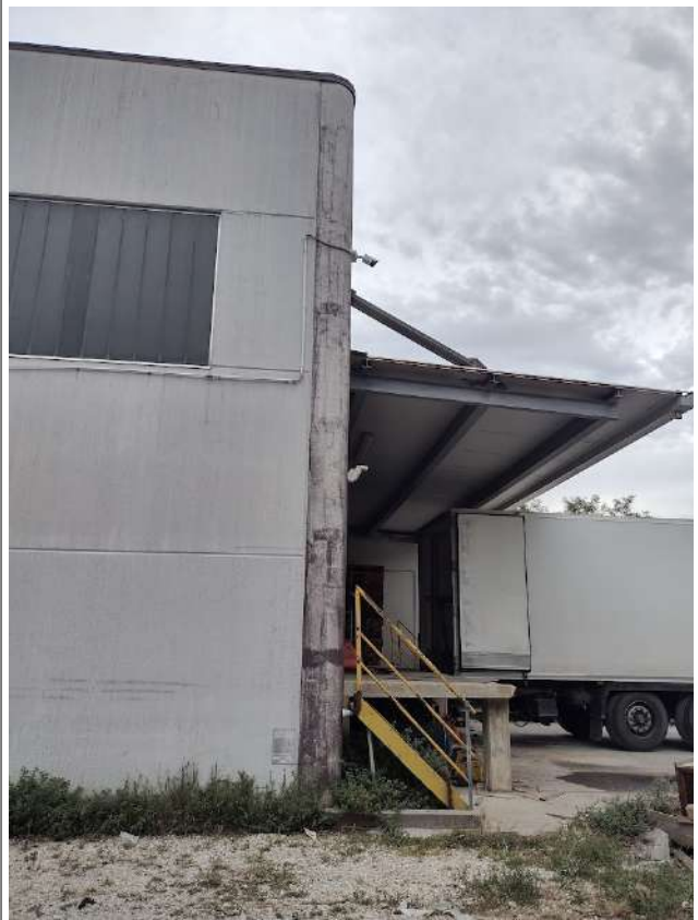
Aggetto tettoia e piano di carico