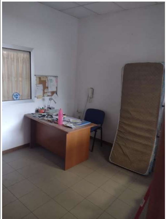
Part ufficio p1