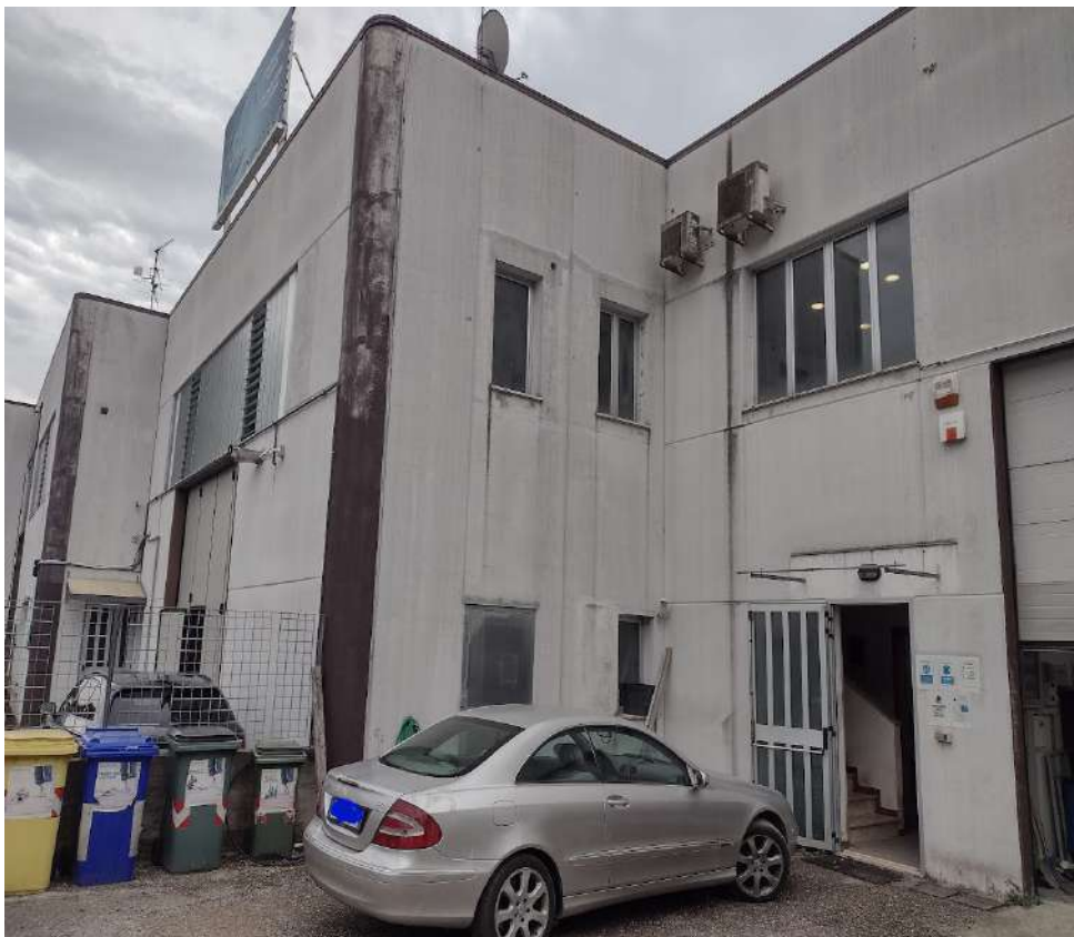
particolare angolo prospetto nord