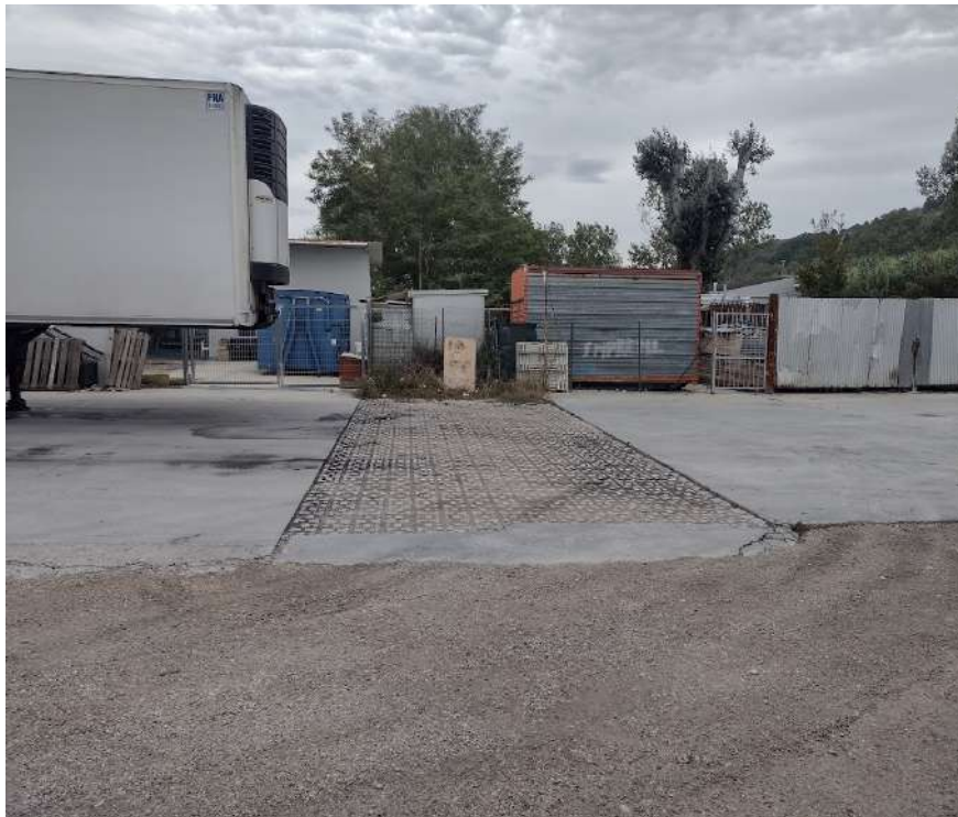
Area pavimentata con grigliato attraversamento sotto-servizio metanodotto