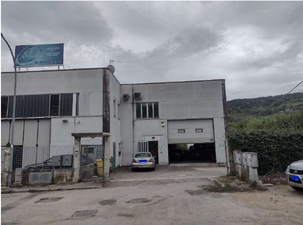
Esterno nord ingresso carrabile e pedonale