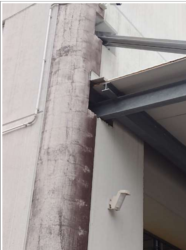
Part. Attacco tettoia