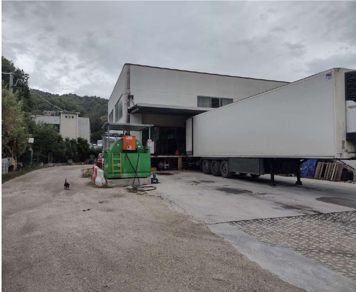
Stralcio prospetto sud