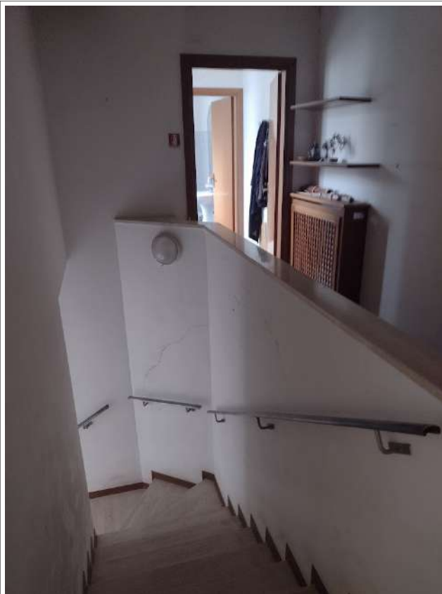
Scala zona uffici p1