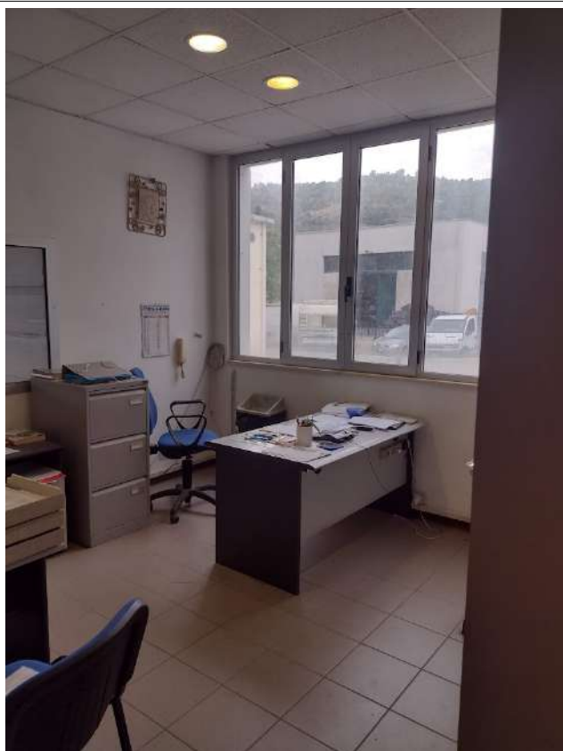
Ufficio direzionale p1