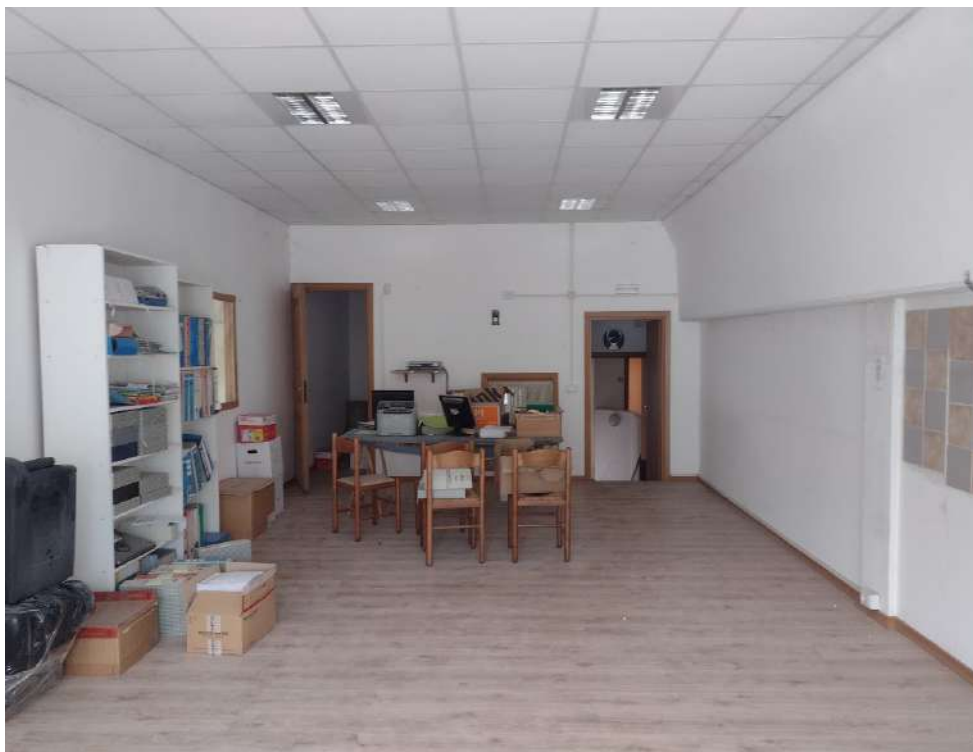
Ufficio soppalco p1