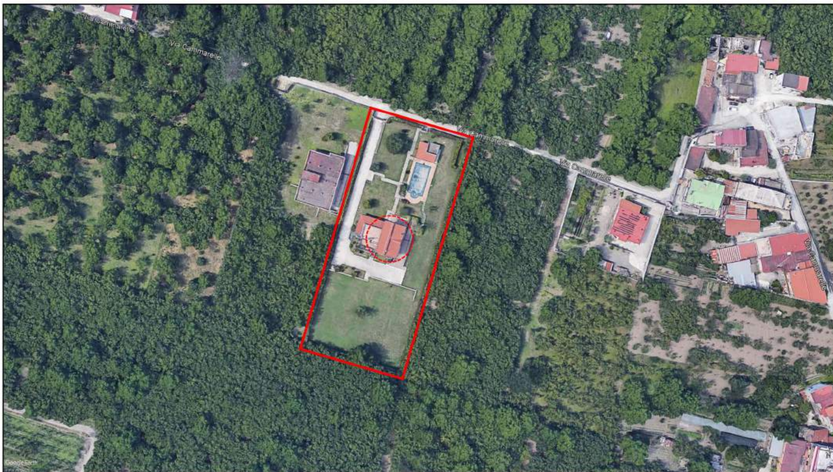
Ortofoto dei luoghi (in evidenza il compendio immobiliare pignorato e l'ubicazione dell'unità immobiliare in oggetto)