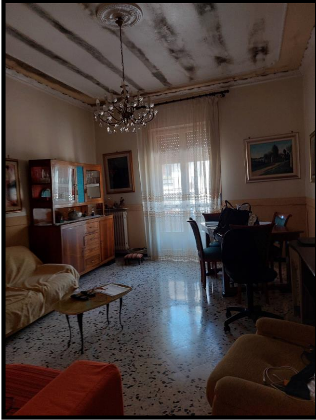
Figura 13 – CAMERA 4 (evidenti tracce di umidità al solaio)