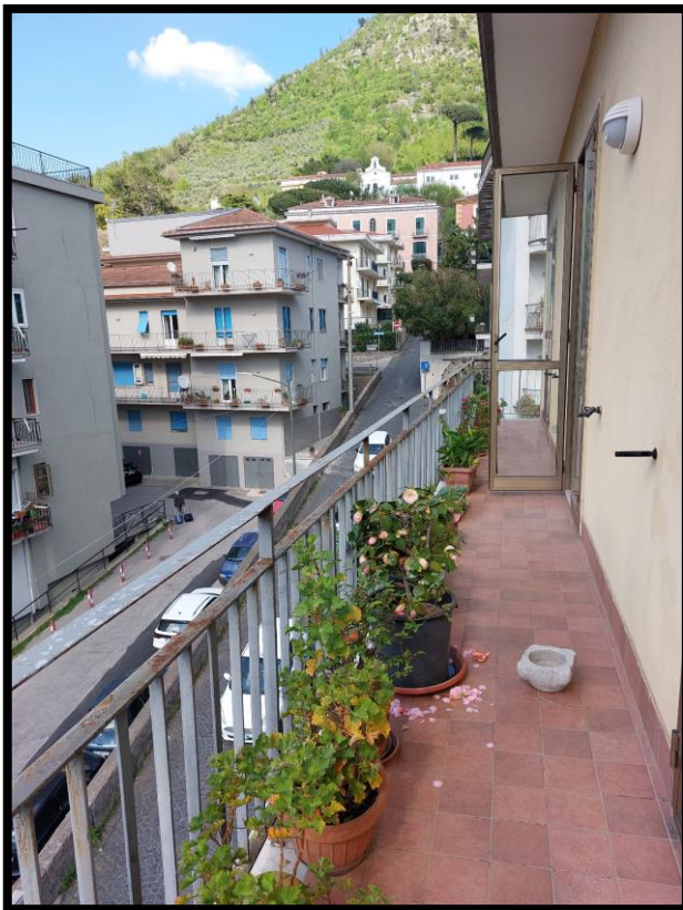
Figura 12 – BALCONE 2