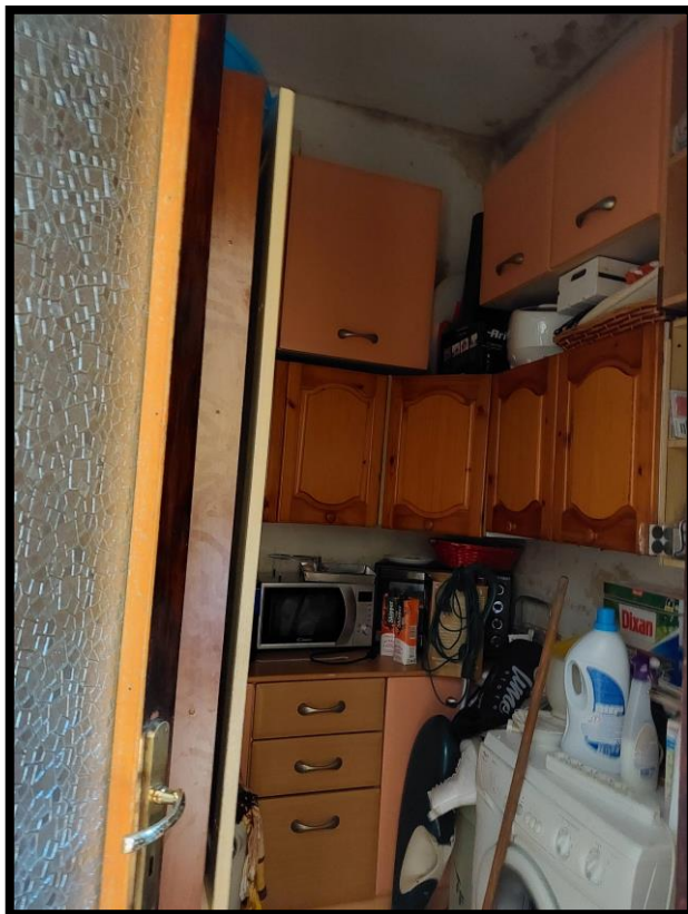
Figura 6 – RIPOSTIGLIO