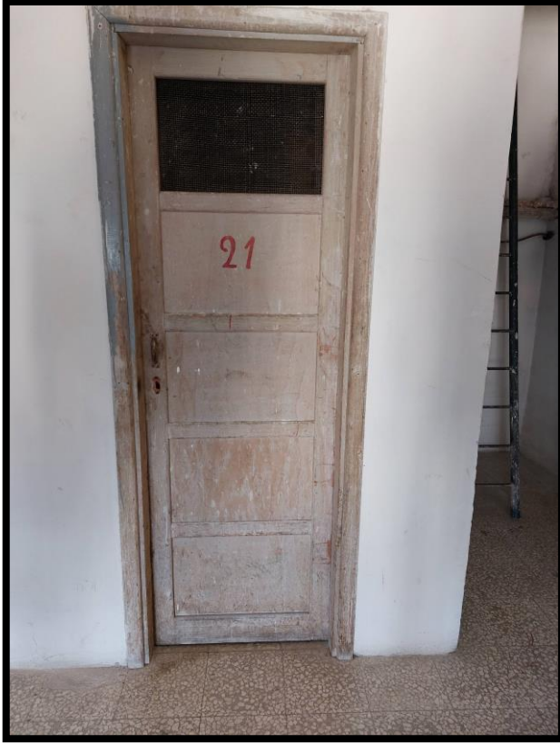
Figura 15 – INGRESSO RIPOSTIGLIO