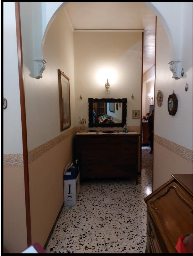
Figura 3 – DISIMPEGNO