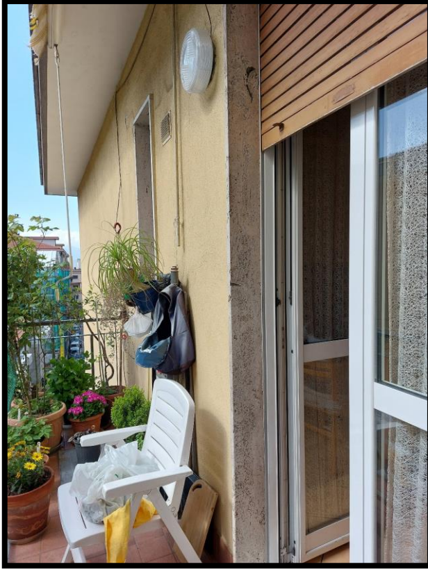
Figura 7 – BALCONE 3