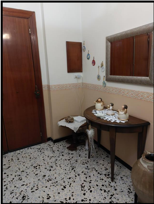
Figura 2 – INGRESSO