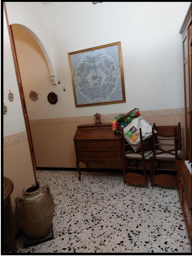
Figura 1 – INGRESSO