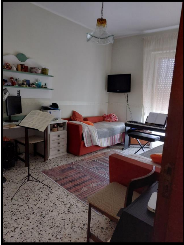
Figura 9 – CAMERA 1