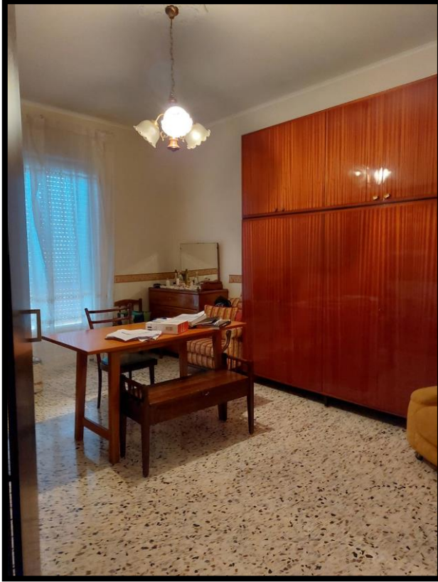
Figura 11 – CAMERA 3