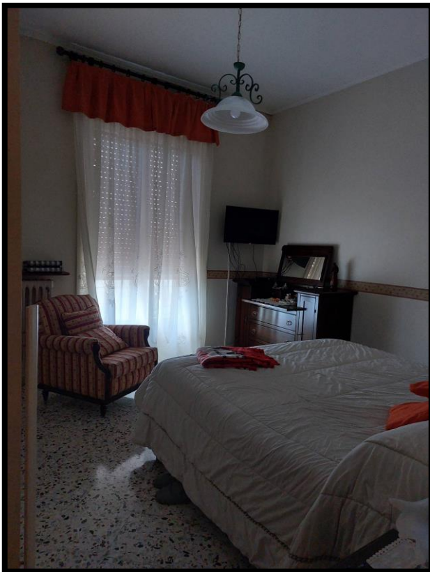
Figura 10 – CAMERA 2