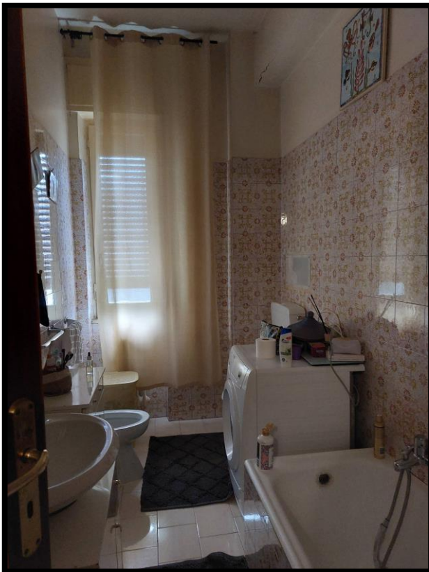
Figura 8 – BAGNO