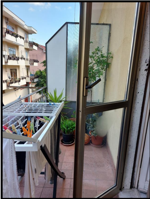
Figura 14 – BALCONE 1