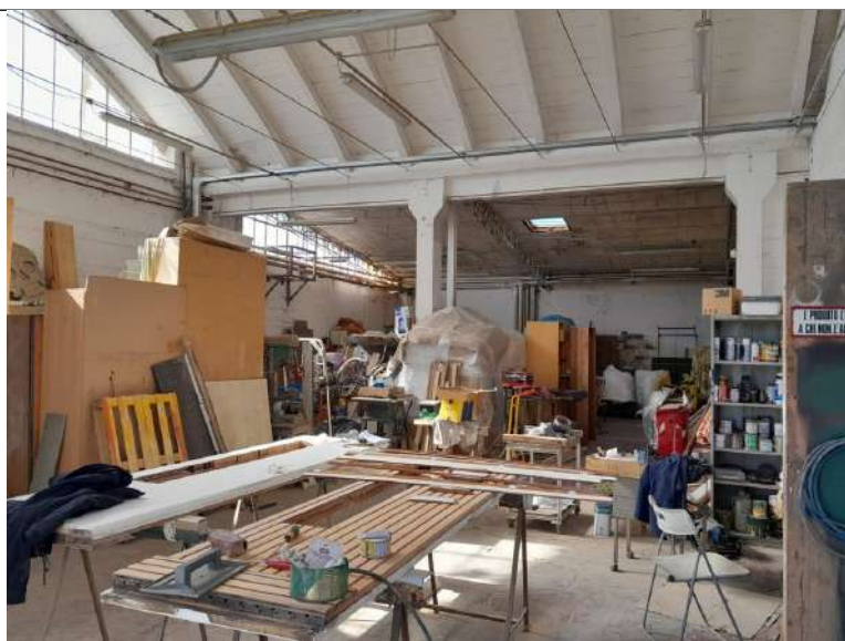
Foto 3.11. – Blocco H: Opificio. Sullo sfondo la parte definita "Blocco I"