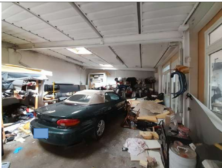
Foto 3.06. – Blocco E (parte esistente): Opificio (laboratorio artigianale)