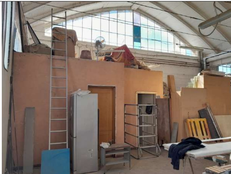
Foto 3.12. – Blocco H: Opificio. Dettaglio della zona servizio igienico