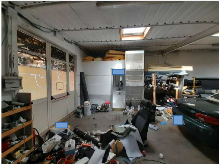
Foto 3.05. – Blocco E (parte esistente): Opificio (laboratorio artigianale)