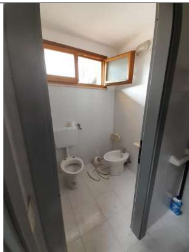
Foto 3.09. – Blocco E (parte esistente): Opificio (laboratorio artigianale) – servizio igienico