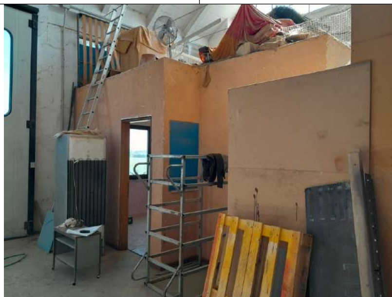
Foto 3.19. – Blocco H: Opificio. Blocco servizi con ufficio / ripostiglio e servizio igienico