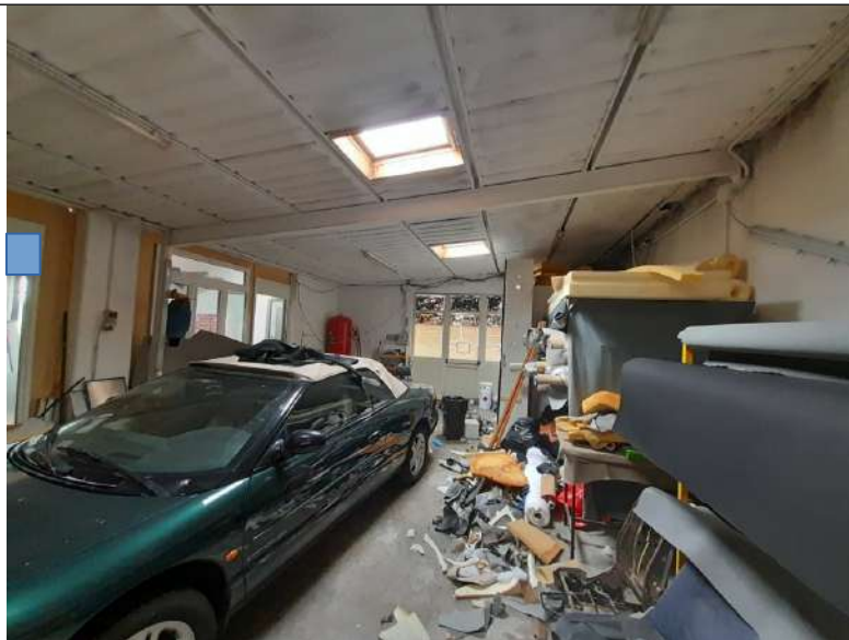
Foto 3.08. – Blocco E (parte esistente): Opificio (laboratorio artigianale)