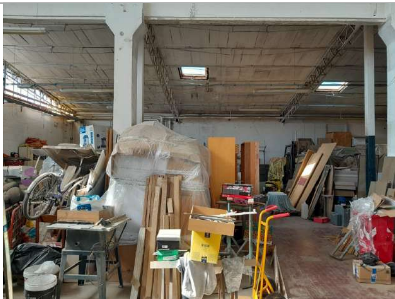
Foto 3.14. – Blocco I: Opificio. (Visto dalla parte del "blocco H").