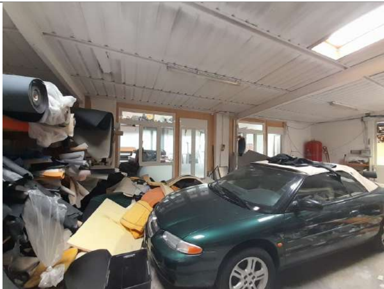
Foto 3.07. – Blocco E (parte esistente): Opificio (laboratorio artigianale)