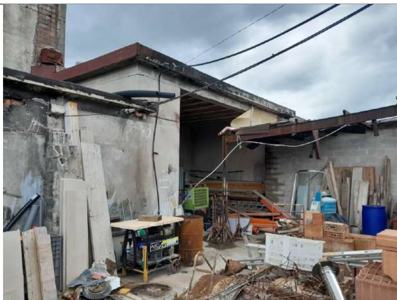
Foto 4.12. – Edificio D con, a sinistra, edificio E (parte demolita) e tettoia C non più esistente.