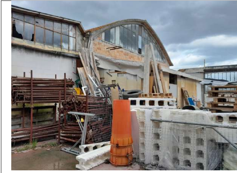
Foto 4.17. – Edificio B (privo di copertura): interno verso l'edificio H