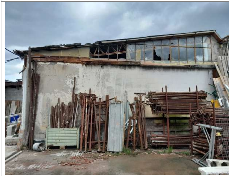
Foto 4.19. – Edificio B (privo di copertura): interno verso l'edificio I