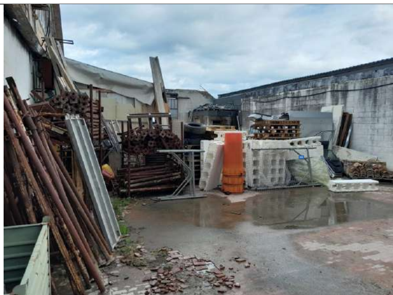
Foto 4.11. – Area esterna sul retro prossima agli edifici D, C, E, B. Al centro l'edificio E, parte demolita con antistante la tettoia C, anch'essa non più esistente. A destra l'edificio I visto dall'esterno.