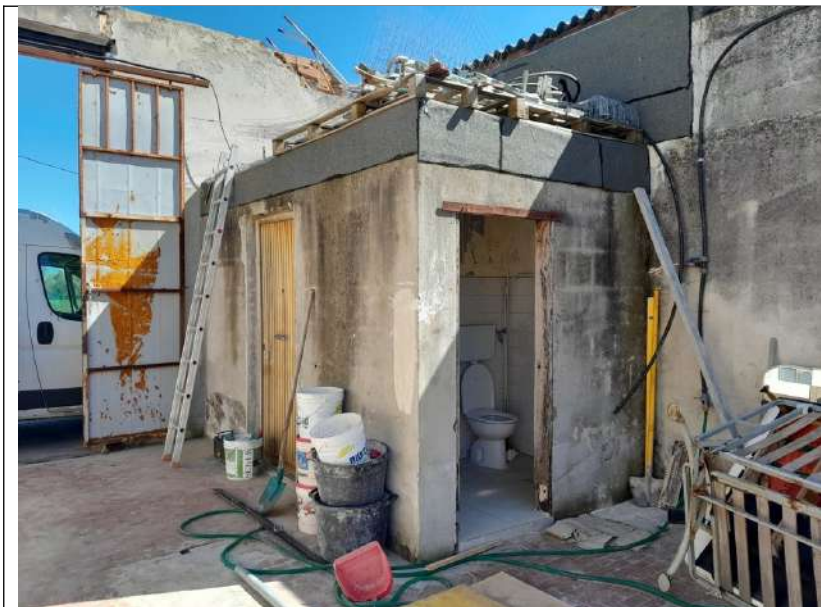
Foto 4.23. – Edificio B (privo di copertura): interno: zona servizi