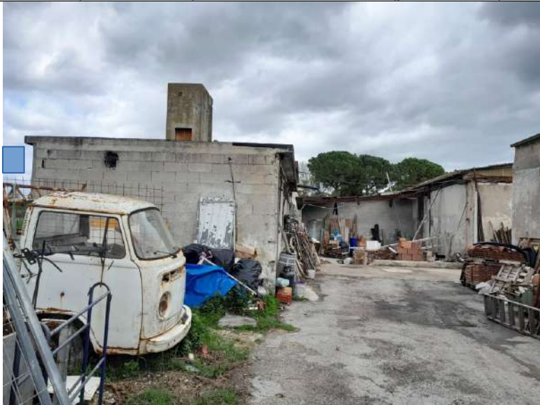
Foto 4.07. – Area esterna sul retro prossima agli edifici D, C, E, B. Sulla sinistra il blocco D. Sullo sfondo l'edificio E, parte demolita con antistante la tettoia C, anch'essa non più esistente. A destra l'edificio B: opificio privo di copertura.