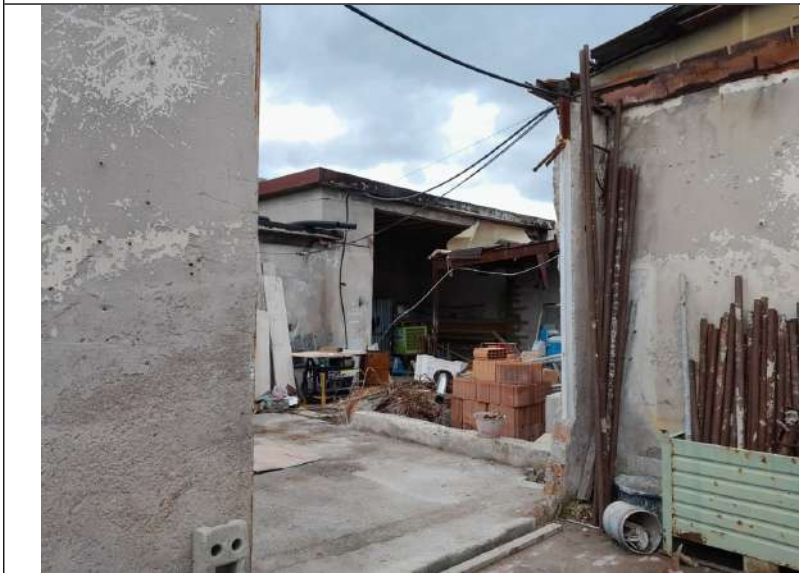
Foto 4.18. – Edificio B (privo di copertura): interno verso l'edificio D