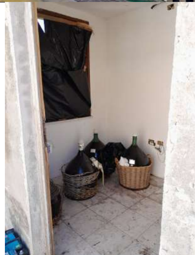
Foto 4.24. – (a sinistra). Edificio B (privo di copertura): interno zona servizi: bagno.