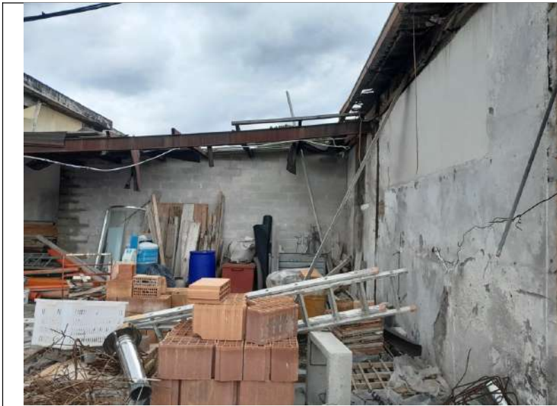
Foto 4.13. – Edificio E (parte demolita) e tettoia C non più esistente.