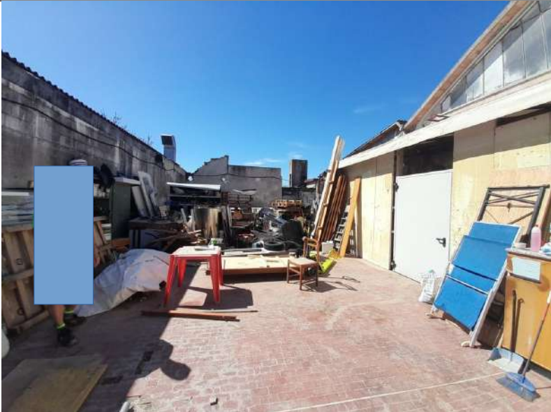
Foto 4.22. – Edificio B (privo di copertura): interno dal portone di ingresso di foto precedente