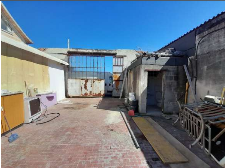
Foto 4.21. – Edificio B (privo di copertura): interno verso il portone di accesso lato particella catastale 159