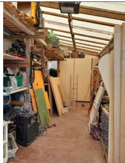
Foto 4.26. – (a sinistra) Edificio B (privo di copertura): interno tettoia deposito