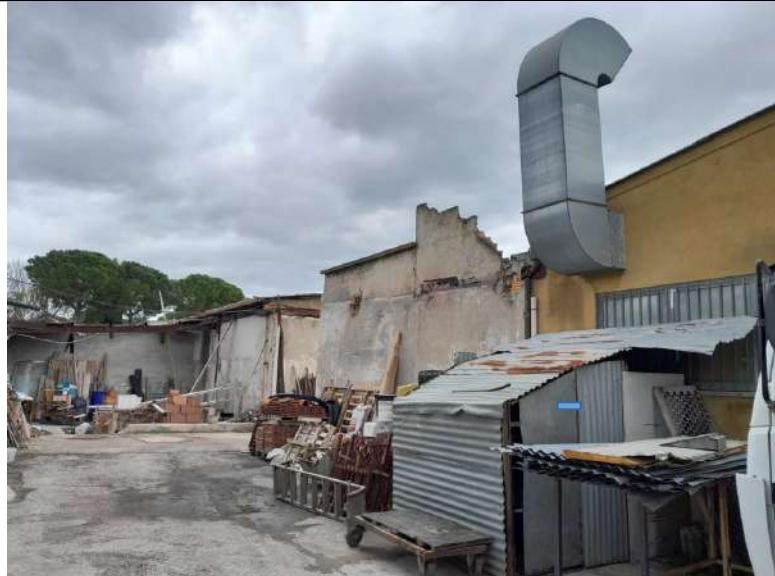
Foto 4.08. – Altra vista delle aree esterne di foto precedente. Maggiormente in evidenza l'edificio B privo di copertura compreso tra i blocchi A (a sinistra) e I (a destra) dello stesso.