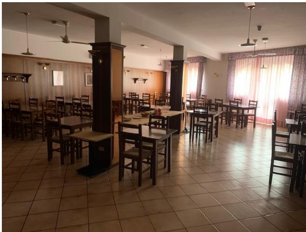
- Piano Terra – ristorante