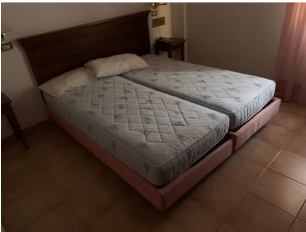
- Piano Primo – camera