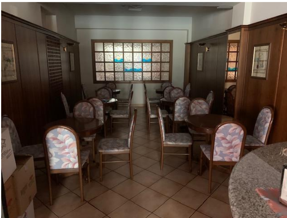
- Piano Terra – albergo