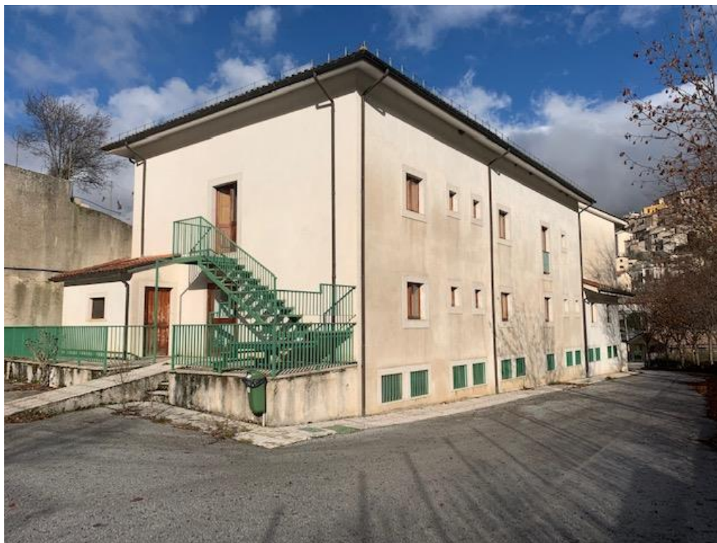
- vista posteriore dell'immobile (lato sud)