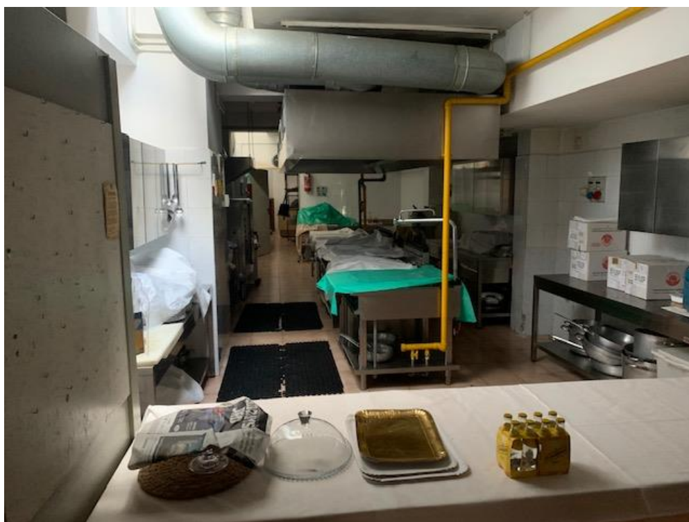
- Piano Terra – cucina ristorante