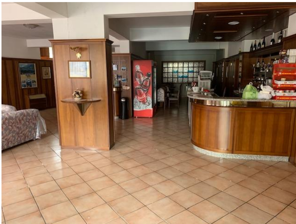
- Piano Terra – albergo