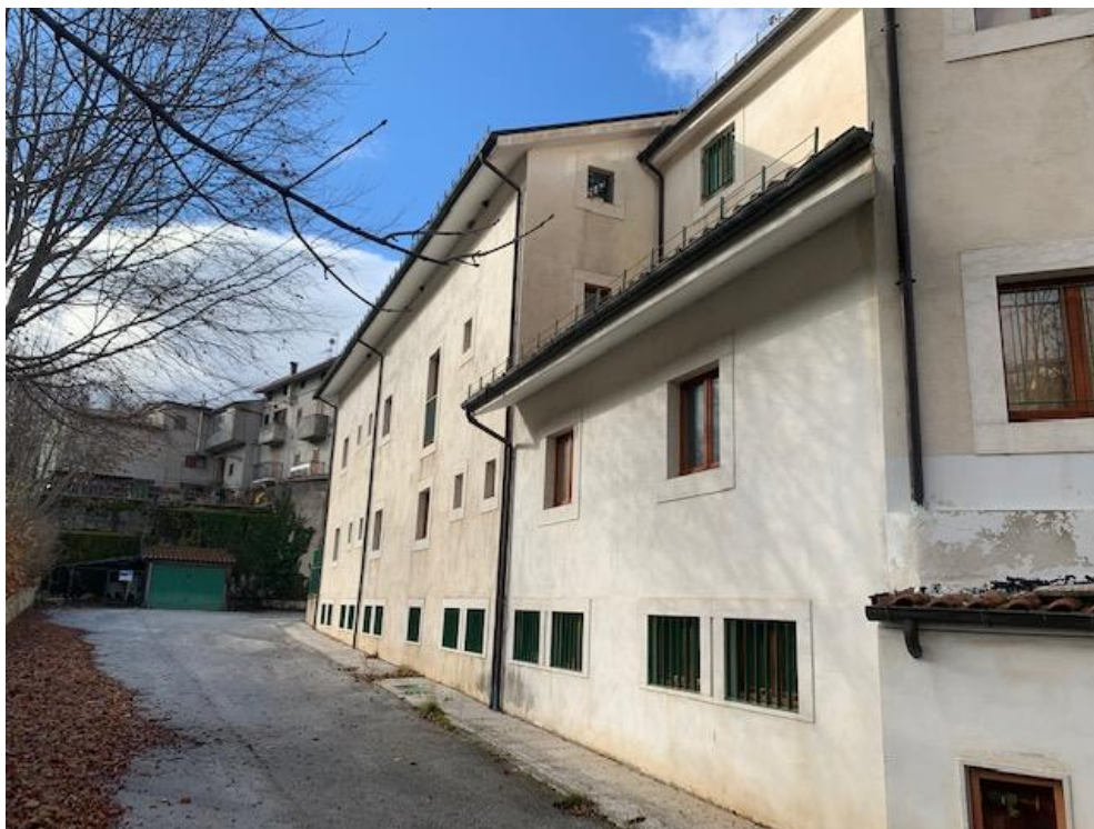
- vista laterale dell'immobile (lato est)