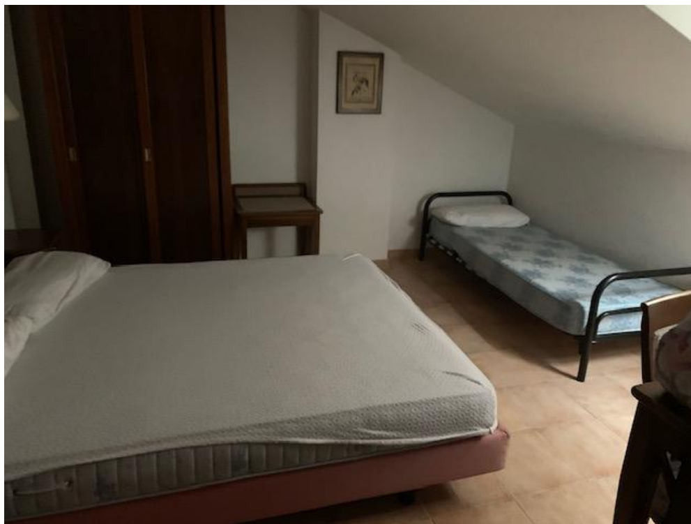
- Piano Terzo – camera

Esecuzione Immobiliare n.57/17 R.G.E. promossa da: Banca del Fucino Spa c/