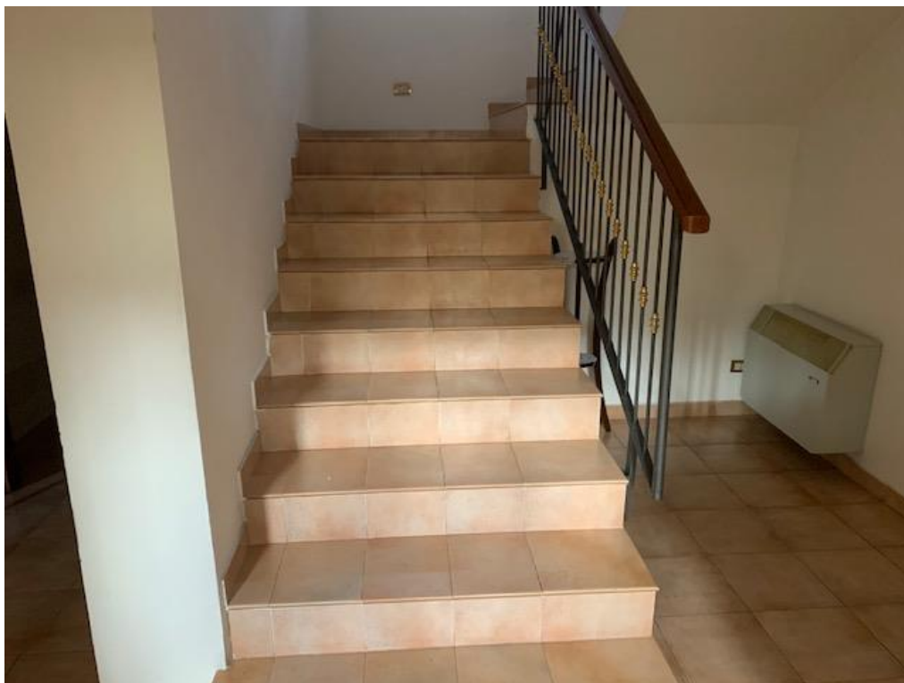
- Piano Terra – scala