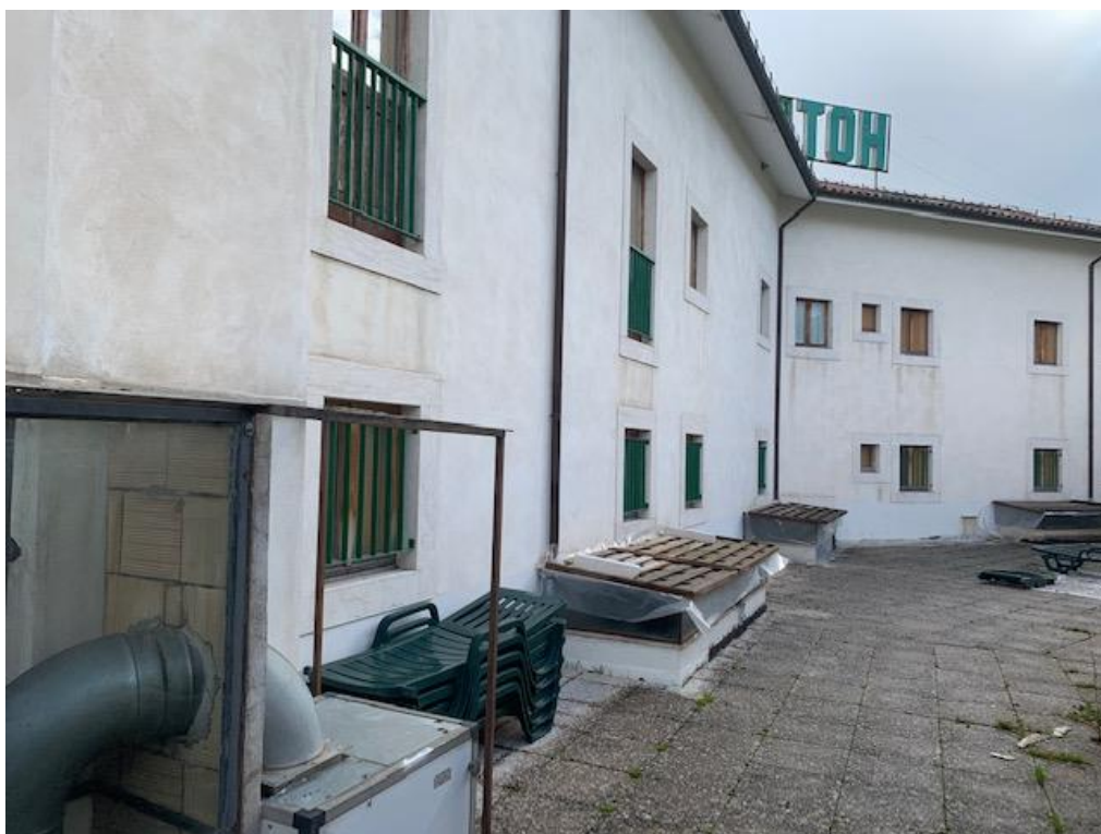
- vista laterale dell'immobile (lato ovest)