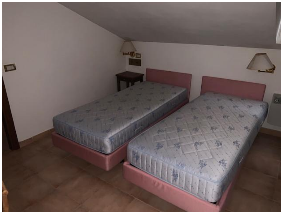
- Piano Terzo – camera