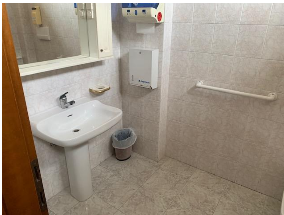
- Piano Terra – servizi igienici