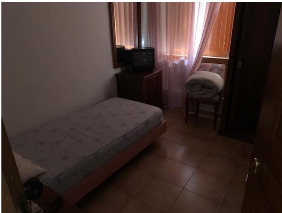
- Piano Primo – camera