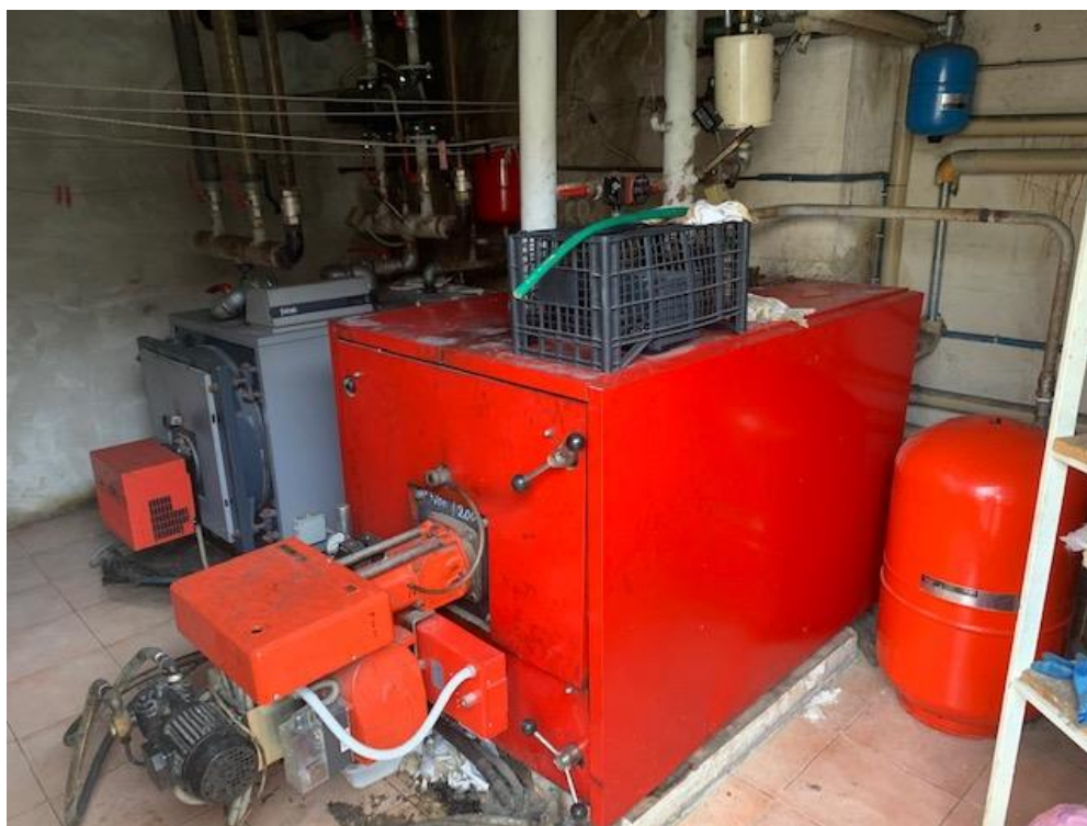
- Piano Terra – locale caldaia