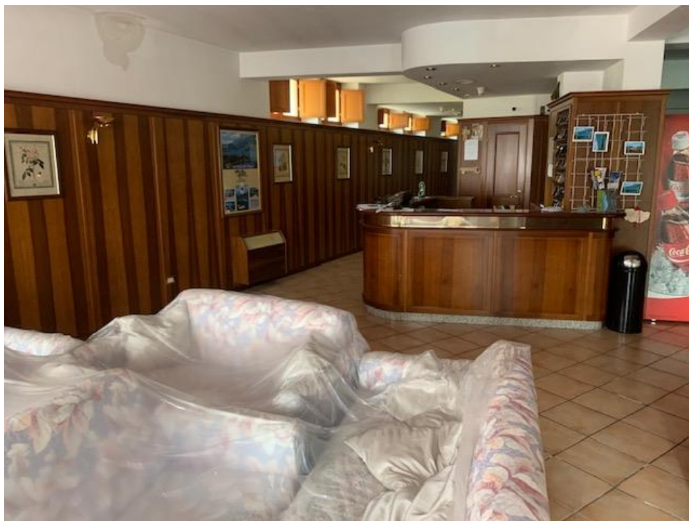
- Piano Terra – albergo