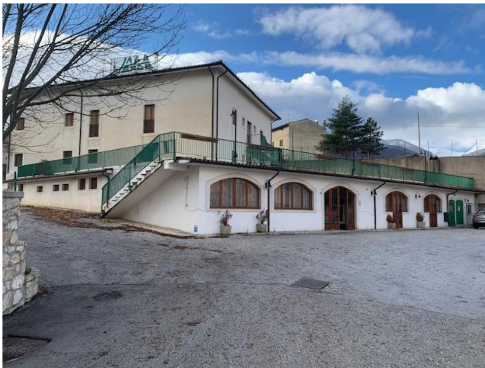
- vista dell'immobile fronte principale (lato nord-est)