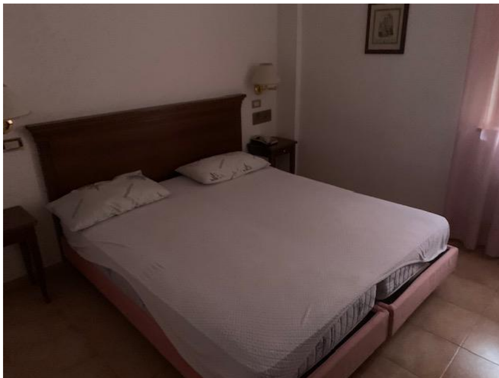
- Piano Secondo – camera