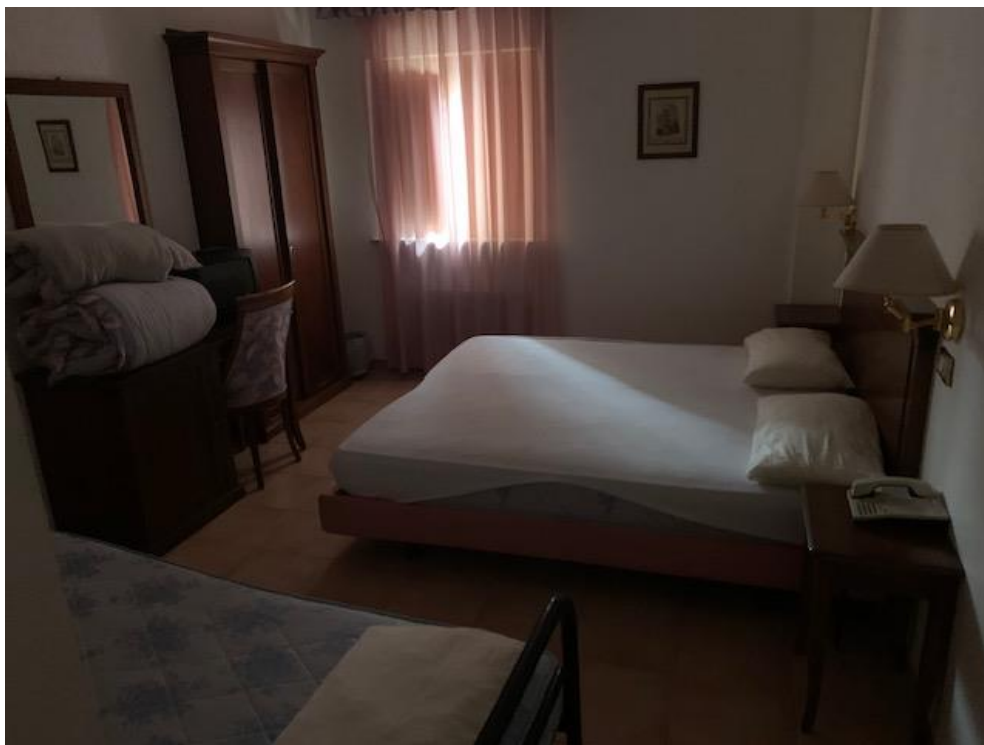
- Piano Secondo – camera