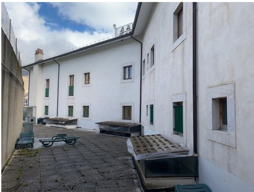
- vista laterale dell'immobile (lato ovest)