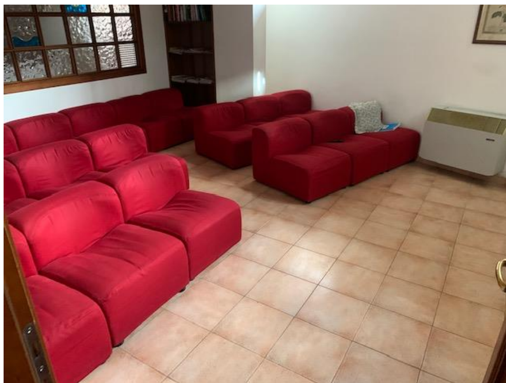
- Piano Terra – albergo