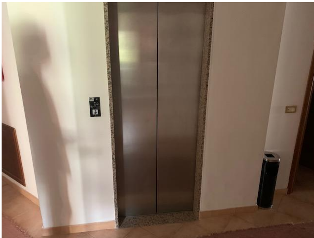
- Piano Primo – ascensore