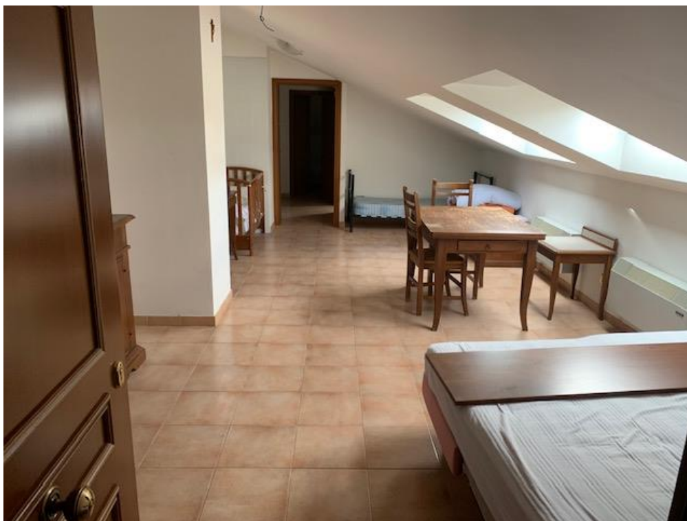
- Piano Terzo – appartamento