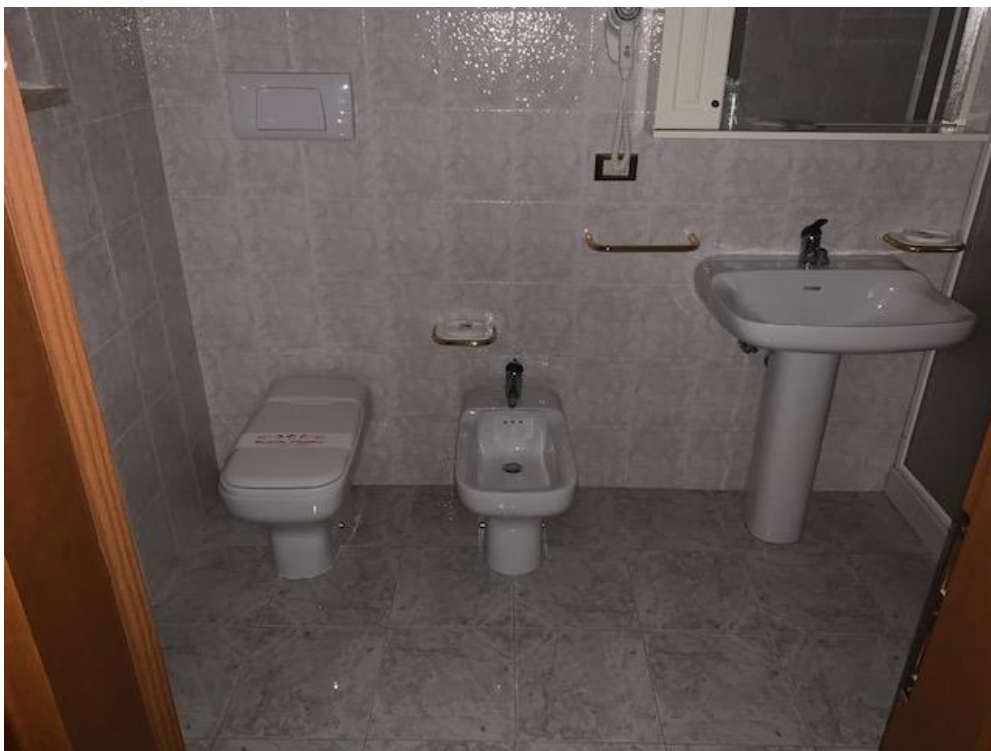
- Piano Primo – bagno camera