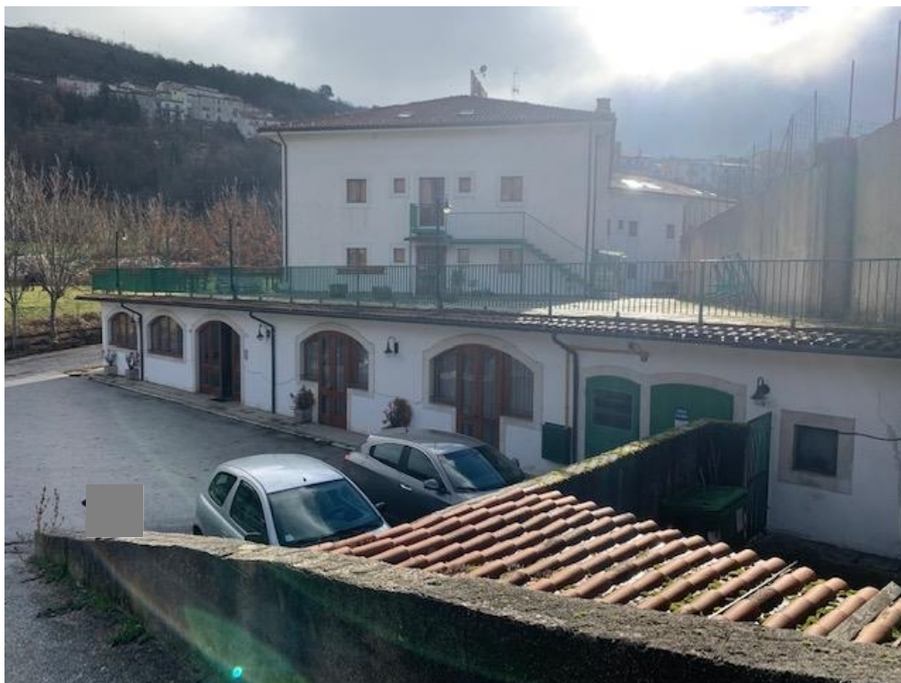
- vista dell'immobile fronte principale (lato nord)