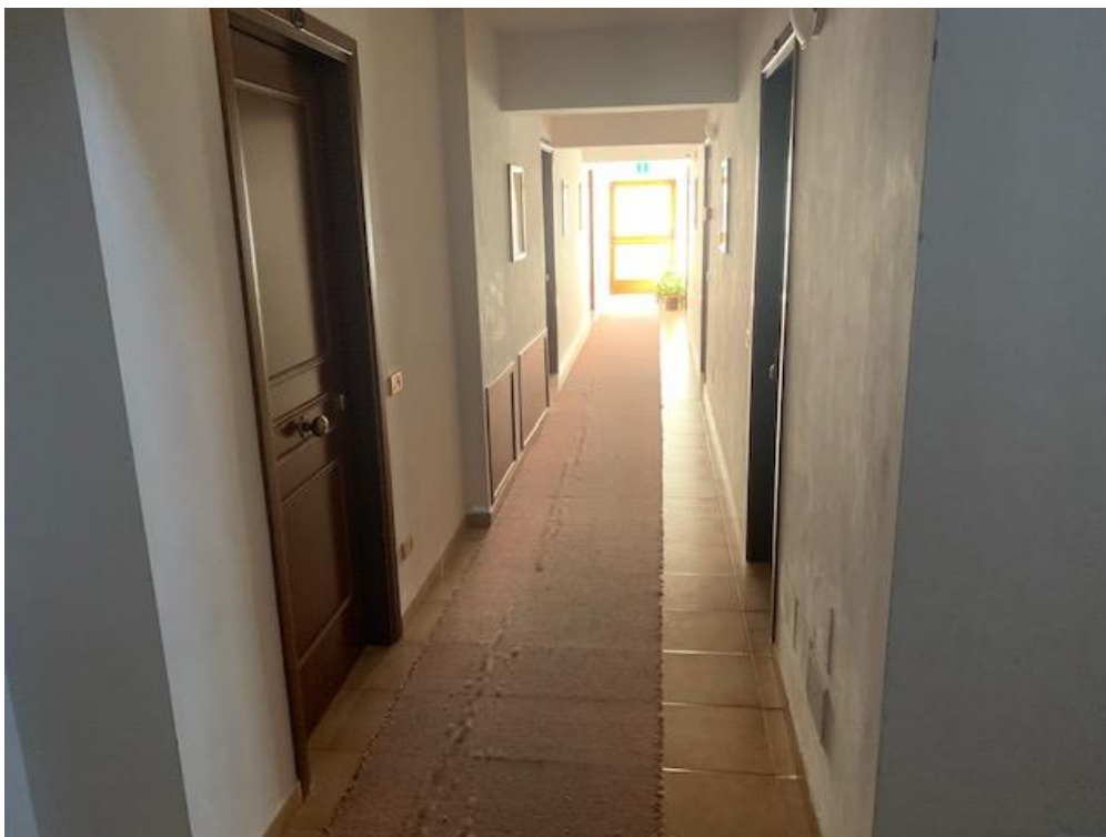
- Piano Primo – corridoio alle camere