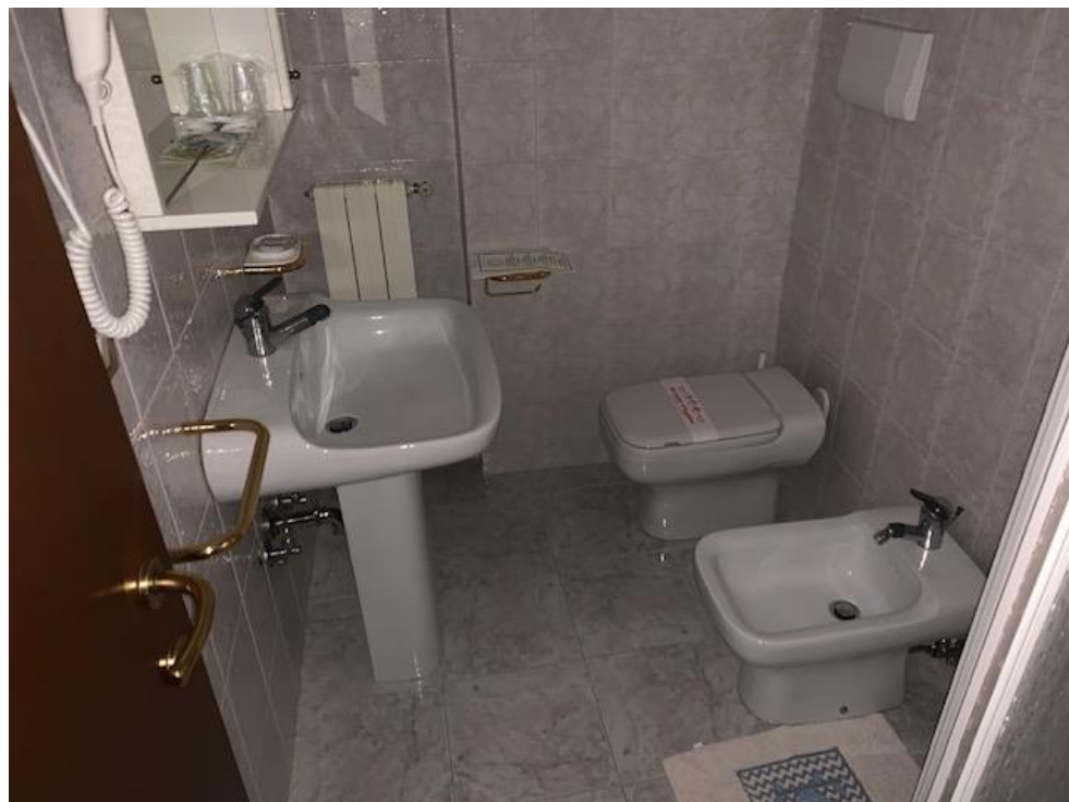
- Piano Secondo – bagno camera