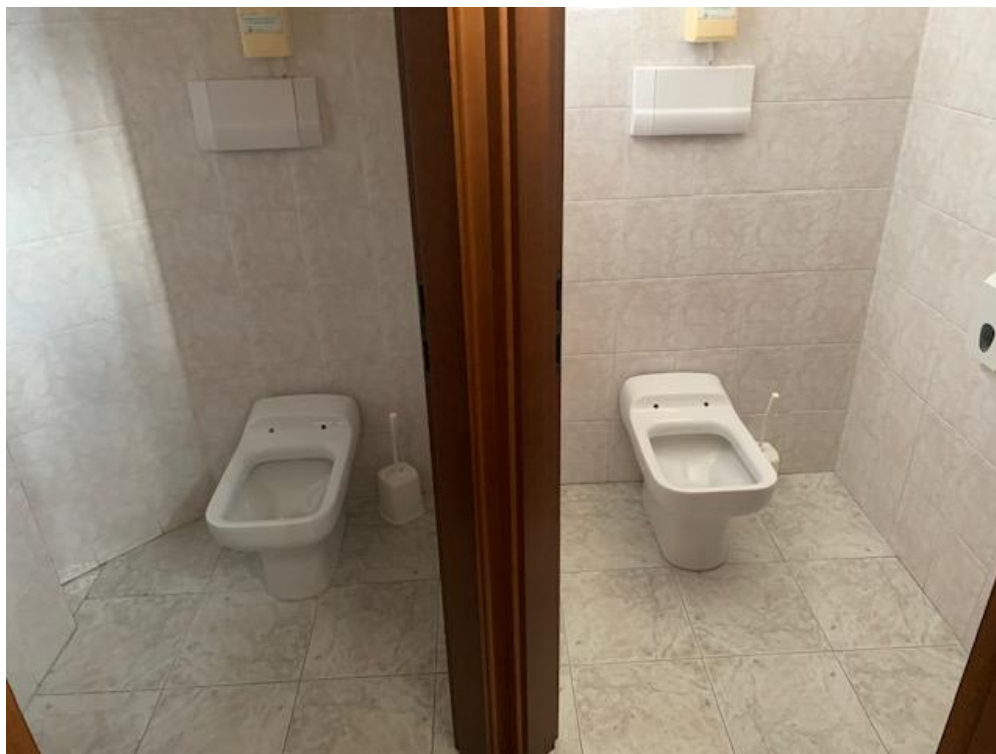
- Piano Terra – servizi igienici