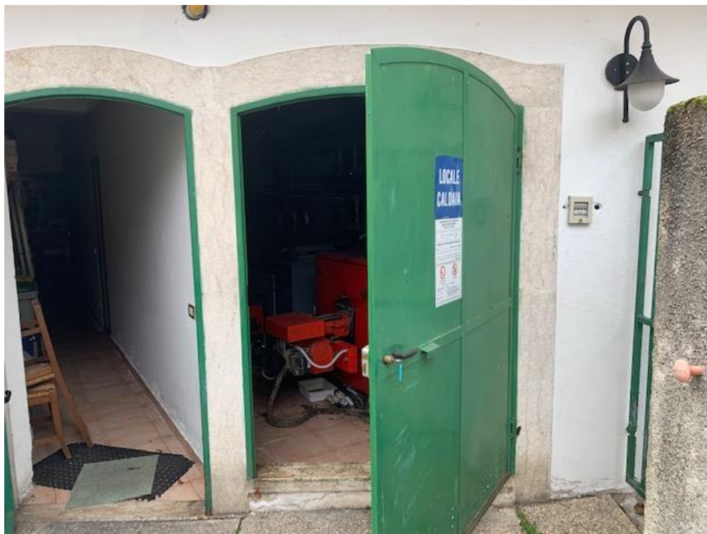
- Piano Terra – locali tecnici