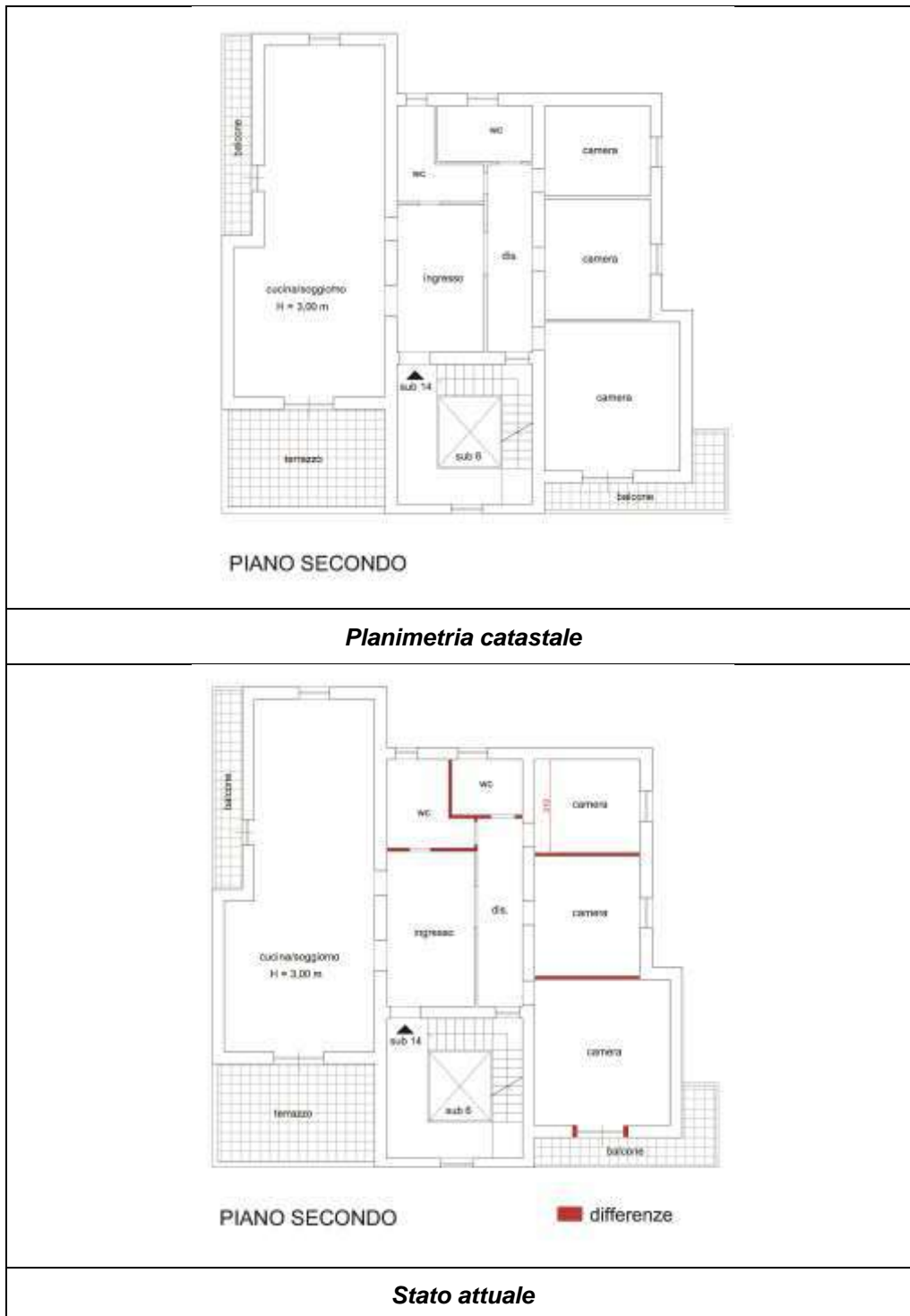
Immagine n. 3

Nei locali destinati all'abitazione (sub 14) le principali differenze riguardano ( immagine 3 ):