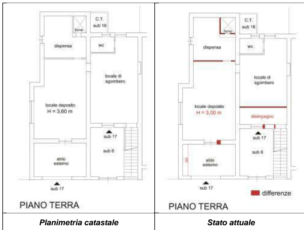
Immagine n. 2

dell'atrio/portico antistante all'ingresso dell'unità che presenta una dimensione leggermente più piccola rispetto alla planimetria catastale in atti; una diversa dimensione dell'altezza interna dei locali che allo stato attuale è pari a 3,00 m mentre sulla planimetria catastale è di 3,60 m (immagine 2).