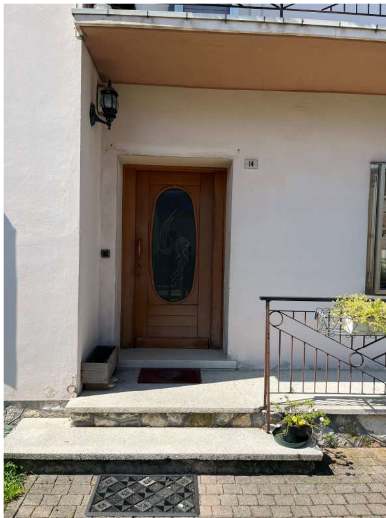
N.6 – Ingresso abitazione al piano terra