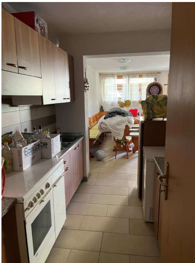
N.28 – Sgombero (4 di 4)