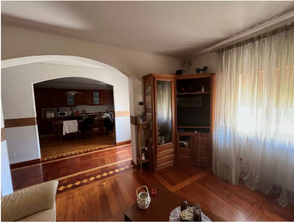
N.11 – Soggiorno (2 di 2)