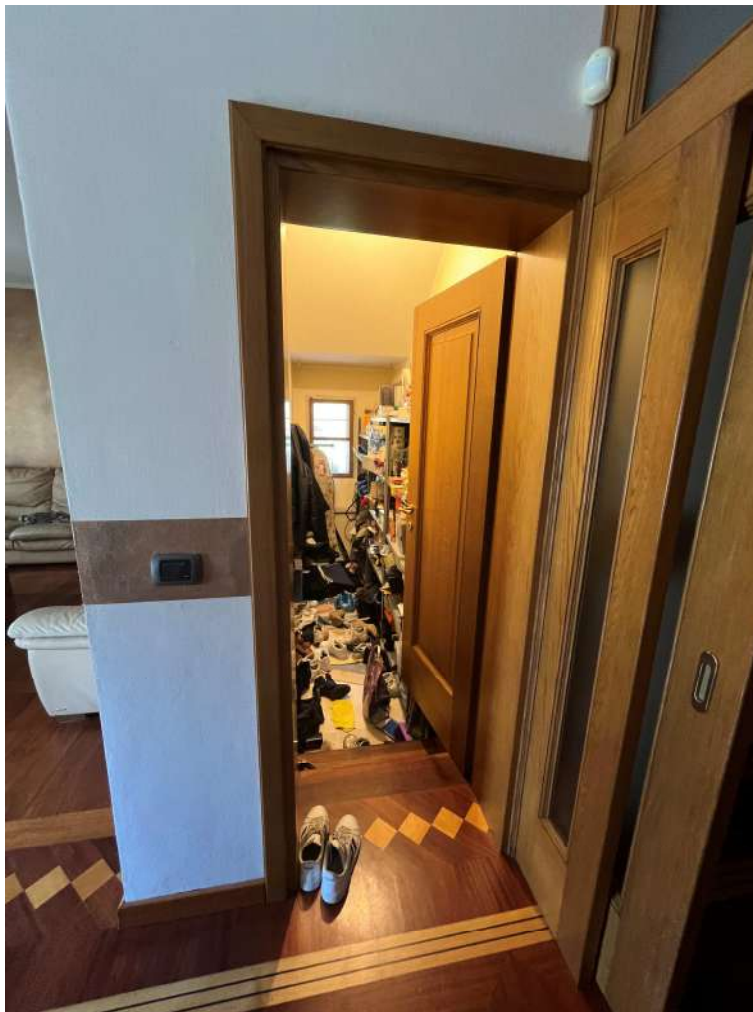
N.12 – Ripostiglio (1 di 2)