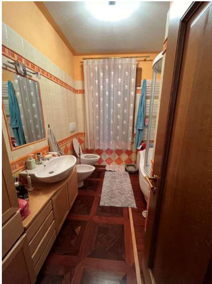
N.17 – Bagno (1 di 2)