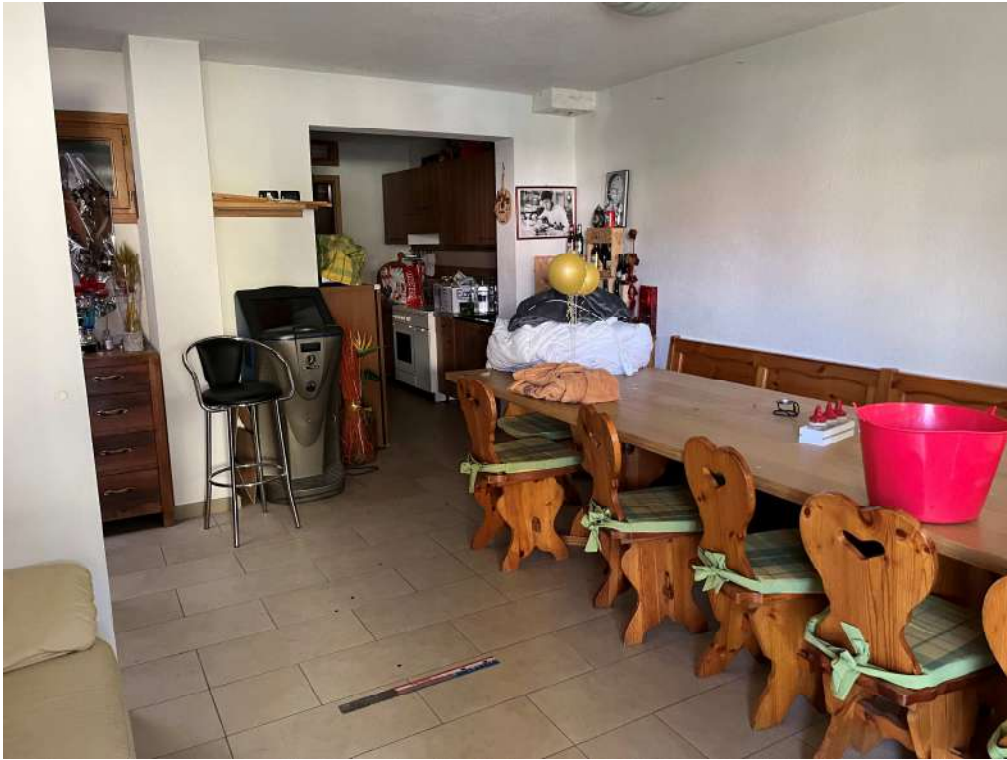
N.25 – Sgombero (1 di 4)