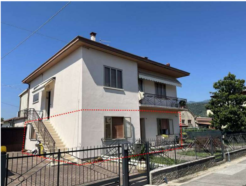
N.2 – Vista est