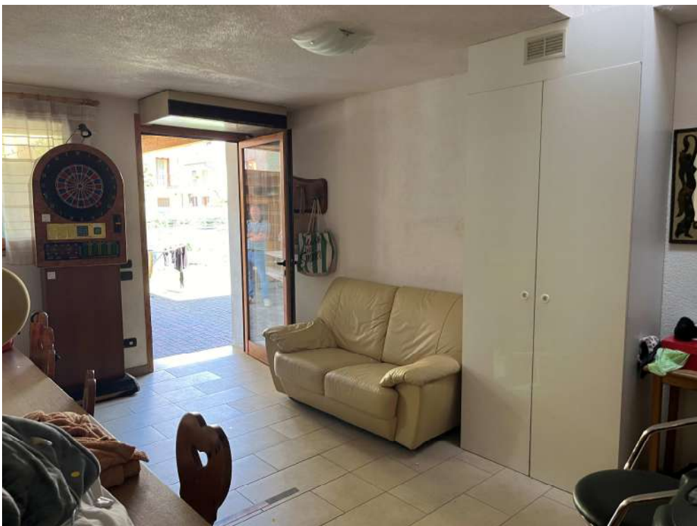
N.26 – Sgombero (2 di 4)