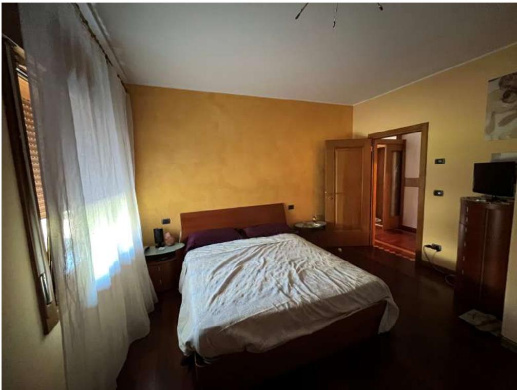
N.20 – Camera nord (2 di 2)