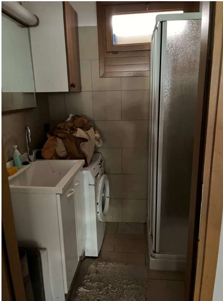
N.29 – Ripostiglio