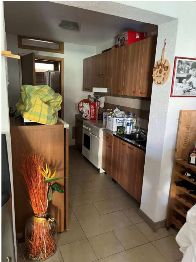
N.27 – Sgombero (3 di 4)