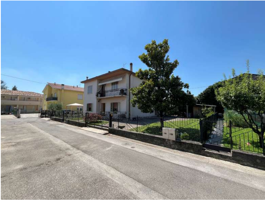
N.1 – Ingresso da via Arnaldo Fusinato