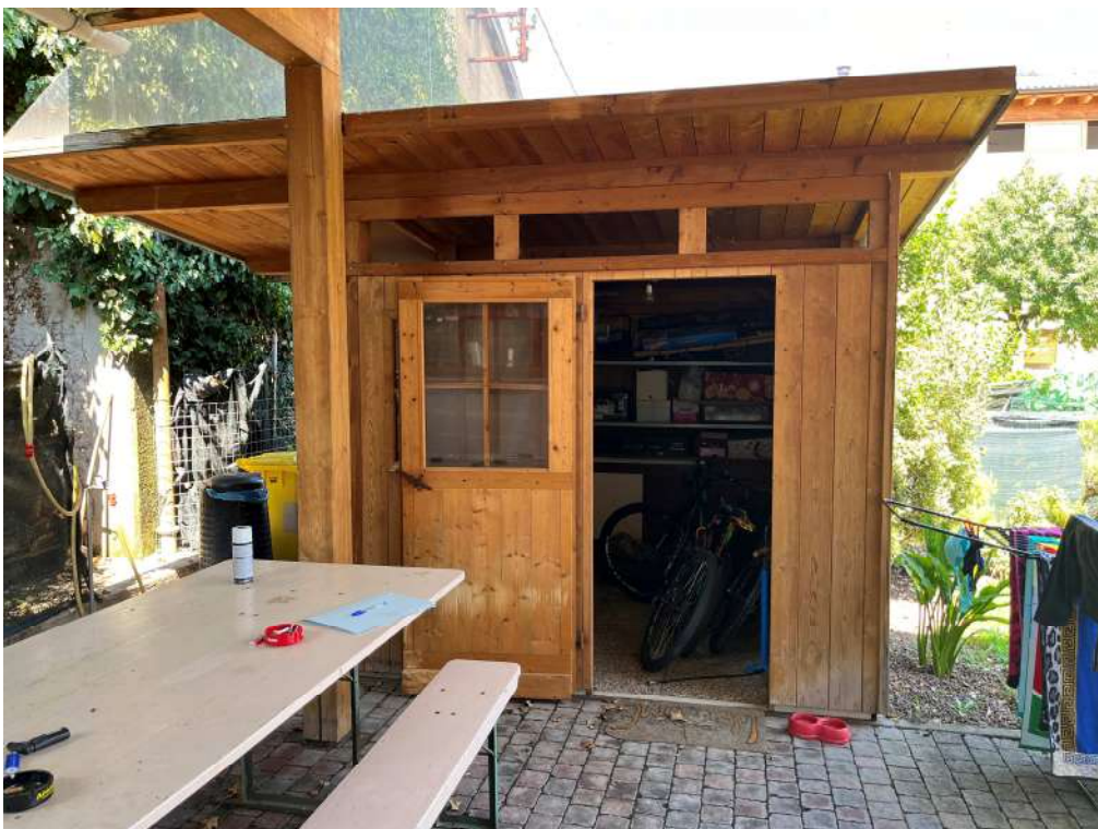
N.22 – Casetta in legno (1 di 2)