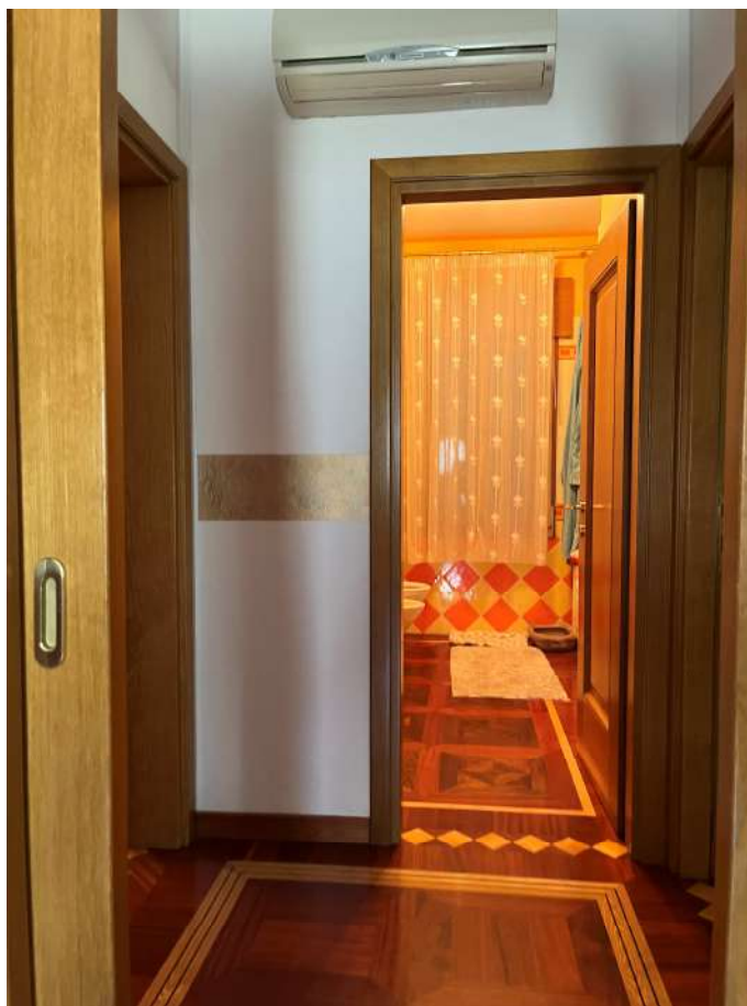
N.14 – Disimpegno