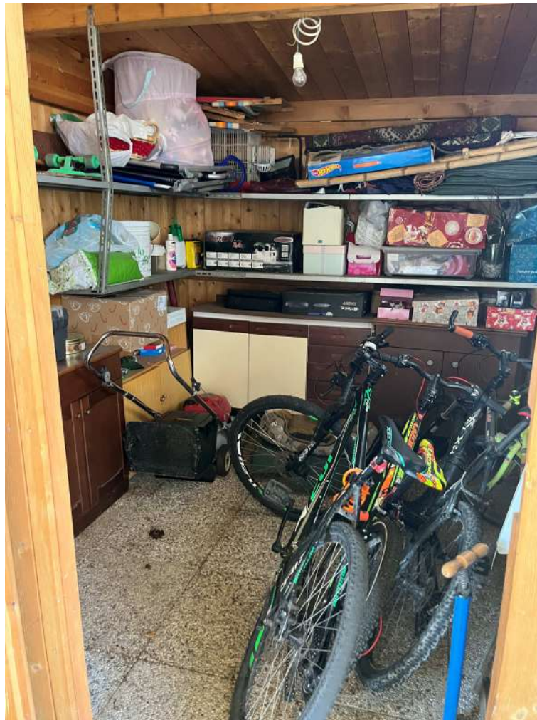
N.23 – Casetta in legno (2 di 2)