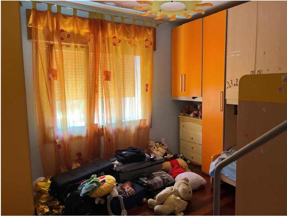
N.15 – Camera sud (1 di 2)