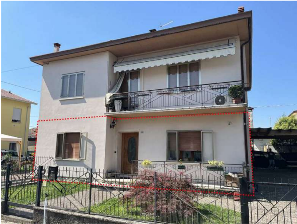
N.3 – Vista nord-est