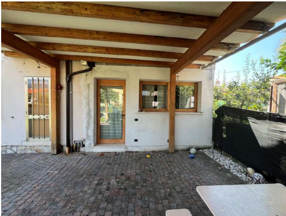
N.24 – Pompeiana