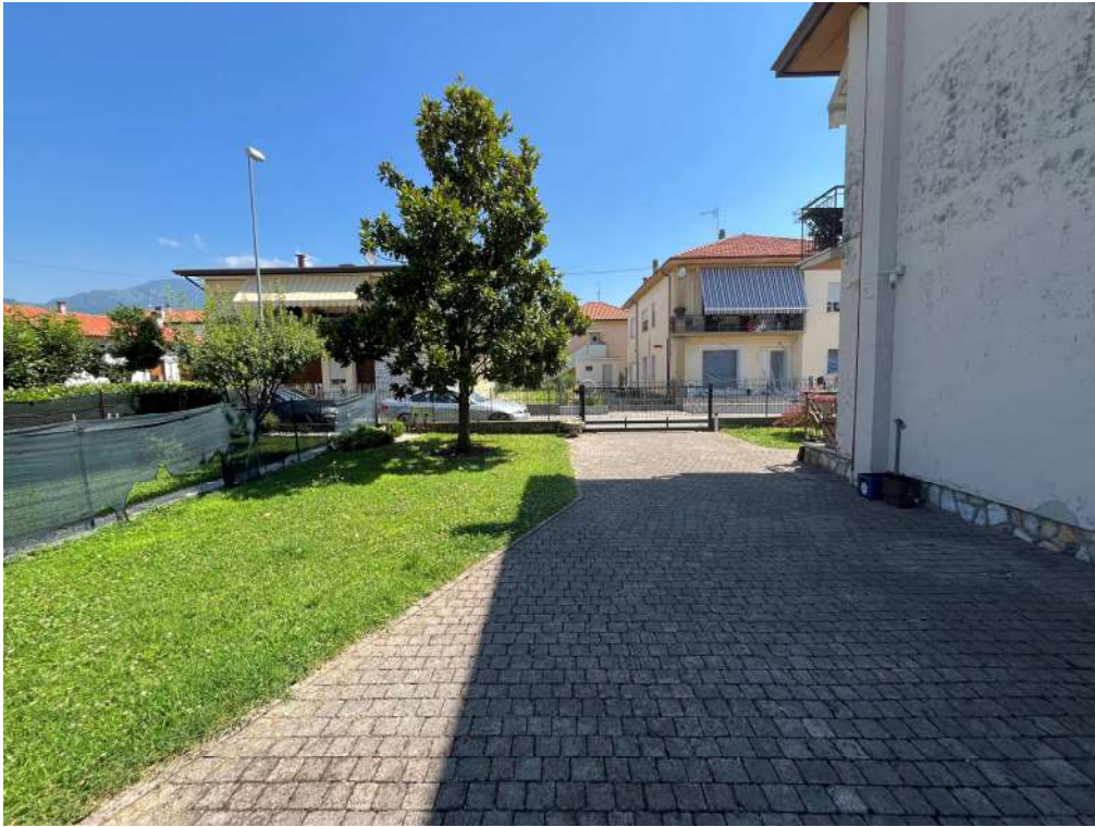
N.5 – Vista area scoperta