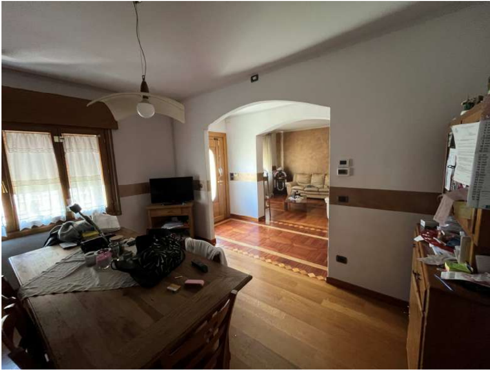
N.9 – Cucina (3 di 3)