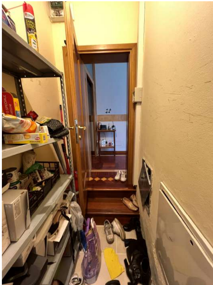
N.13 – Ripostiglio (2 di 2)