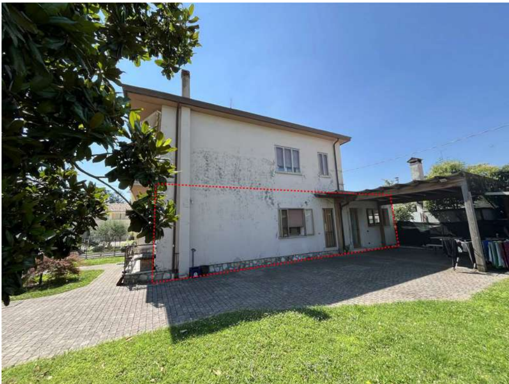
N.4 – Vista nord-ovest