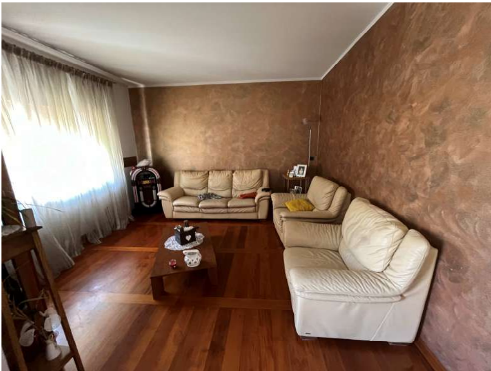
N.10 – Soggiorno (1 di 2)