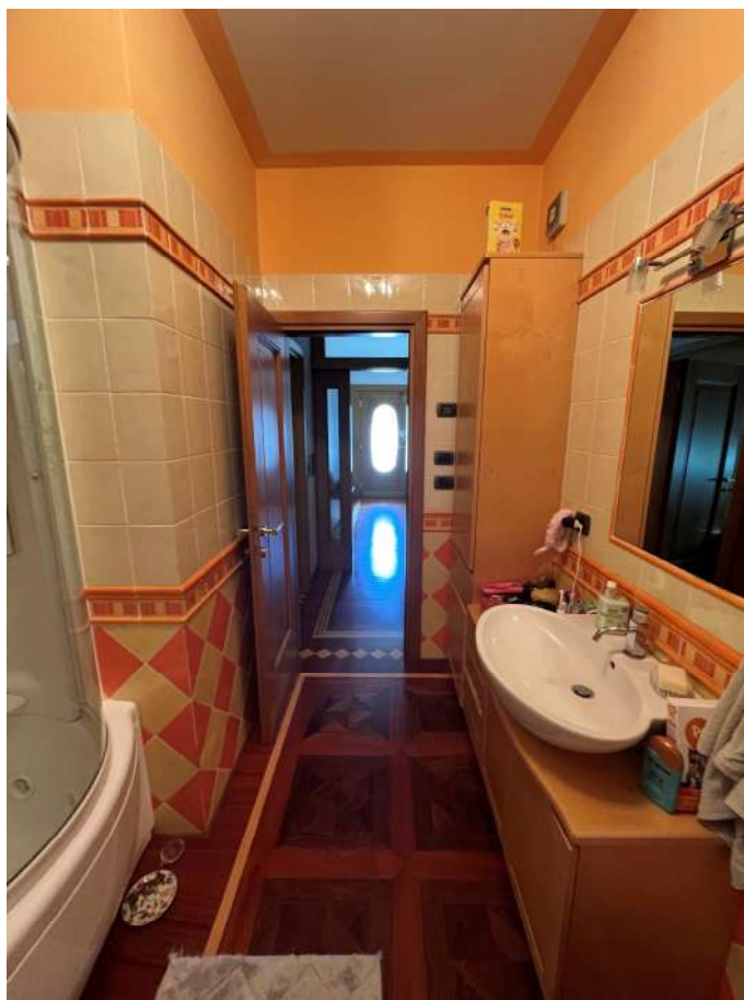
N.18 – Bagno (2 di 2)