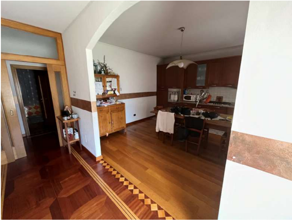
N.7 – Cucina (1 di 3)