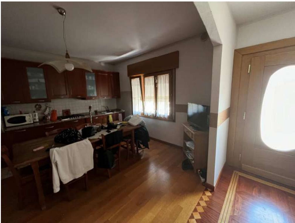
N.8 – Cucina (2 di 3)