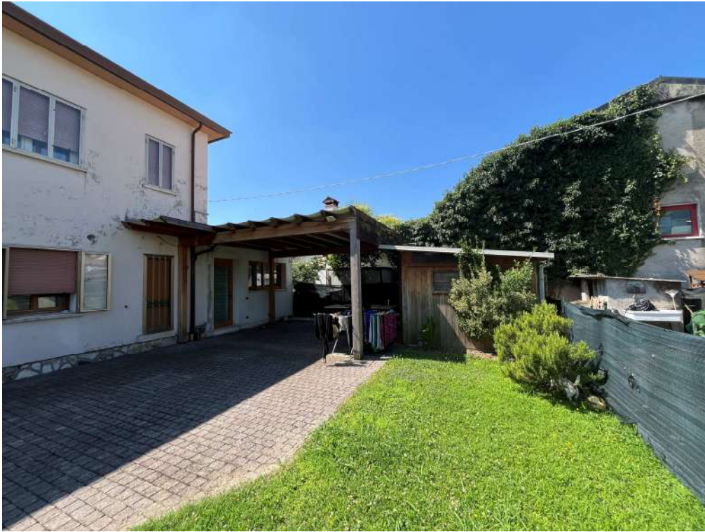
N.21 – Casetta in legno e pompeiana