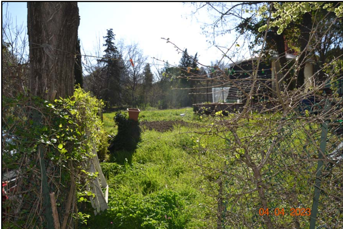
Fotografia n. 5 P.lla 461, F. 123