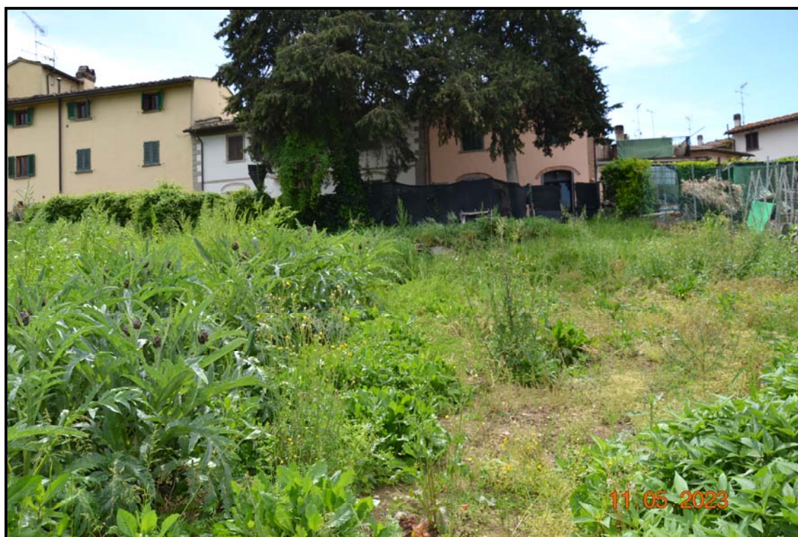
Fotografia n. 13 P.lle 450, 451, 452, 453, F. 123