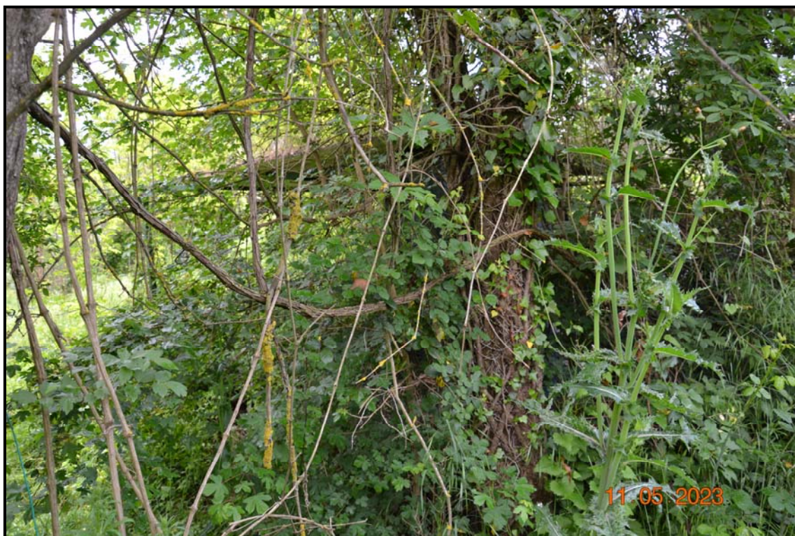
Fotografia n. 15 Tettoia