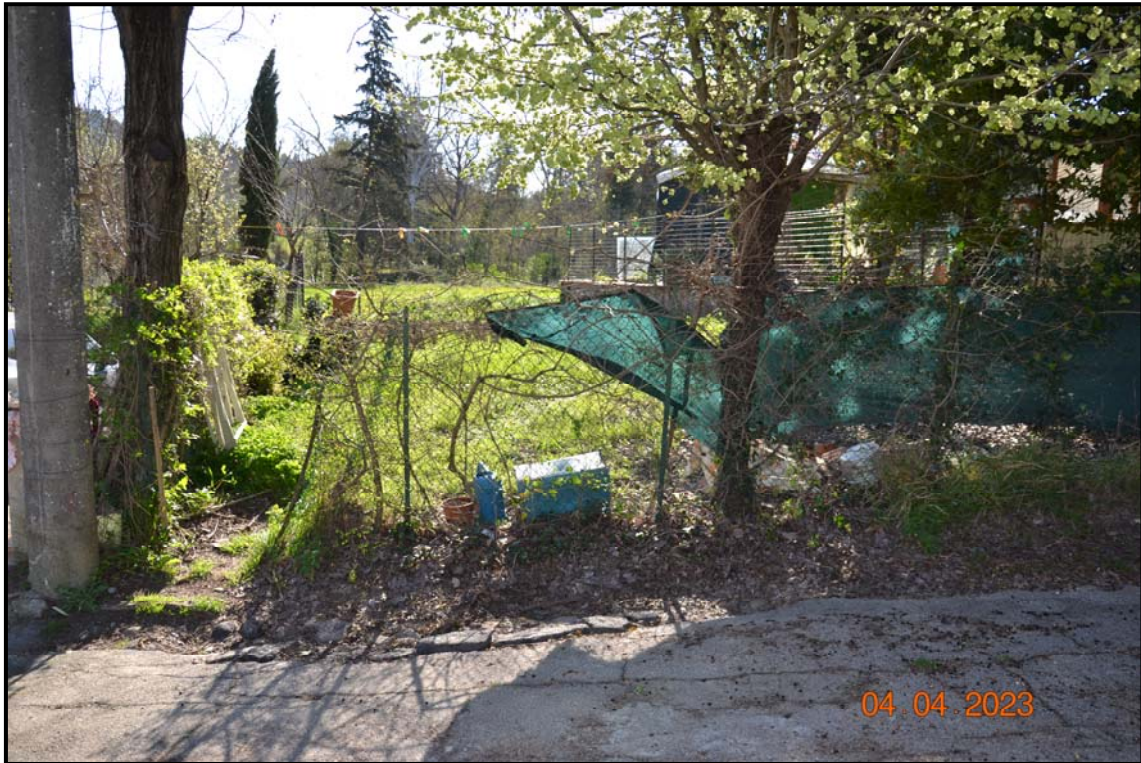
Fotografia n. 4 Accesso dalla SP93 alla p.lla 461, F. 123