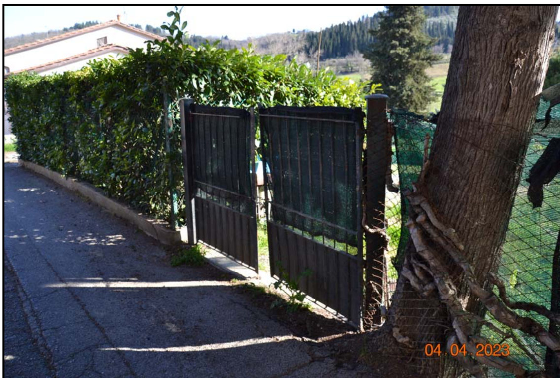
Fotografia n. 6 Accesso da via Polvereto alla p.lla 450, F. 123