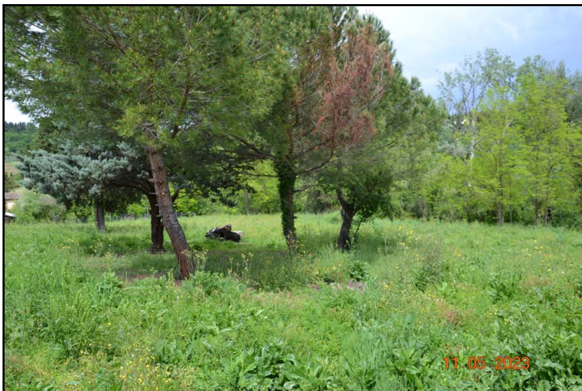
Fotografia n. 10 P.lle 447, 451, F. 123