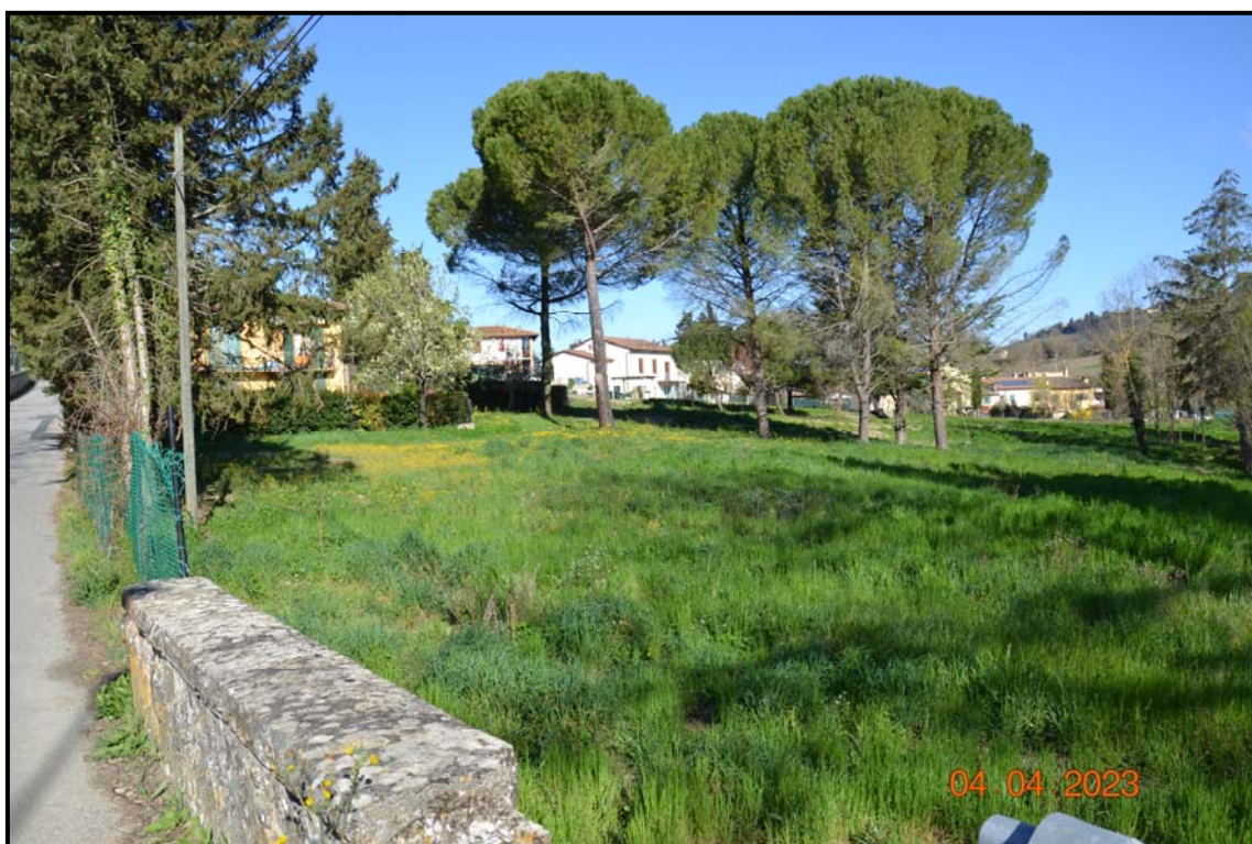
Fotografia n. 17 P.lle 459, 457, 456 F. 123