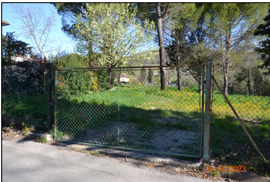
Fotografia n. 19 Altro accesso da via Polvereto alla p.lla 457, F. 123