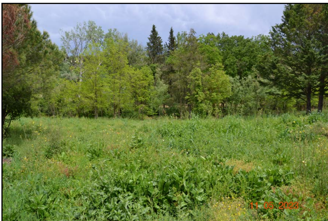
Fotografia n. 11 P.lle 451, 455, F. 123