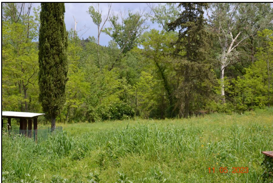
Fotografia n. 14 P.lla 451, F. 123