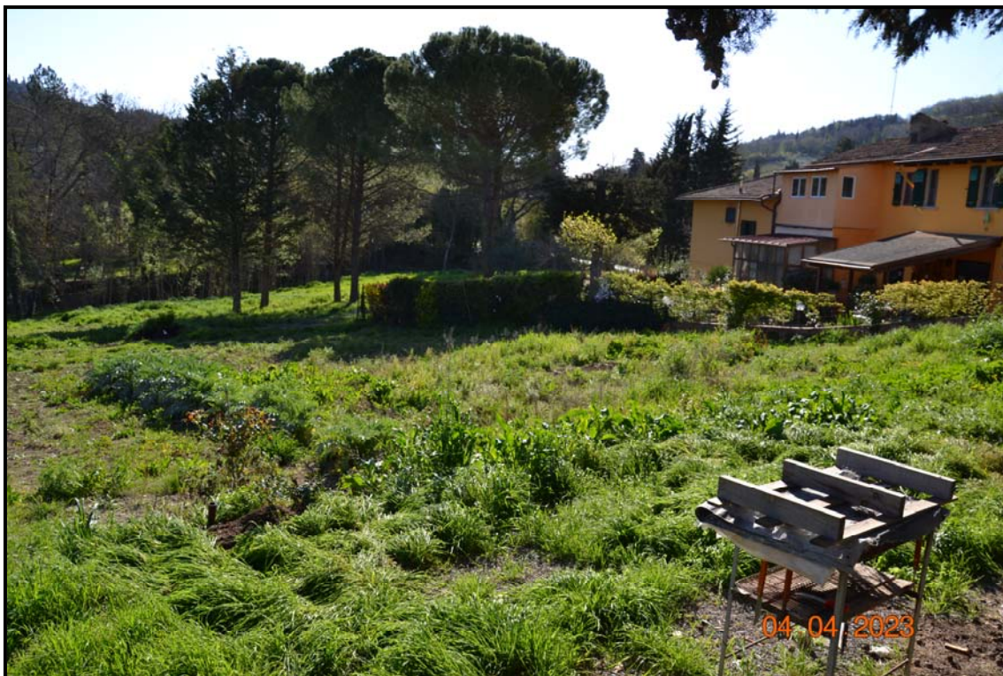
Fotografia n. 8 P.lle 451, 452, F. 123