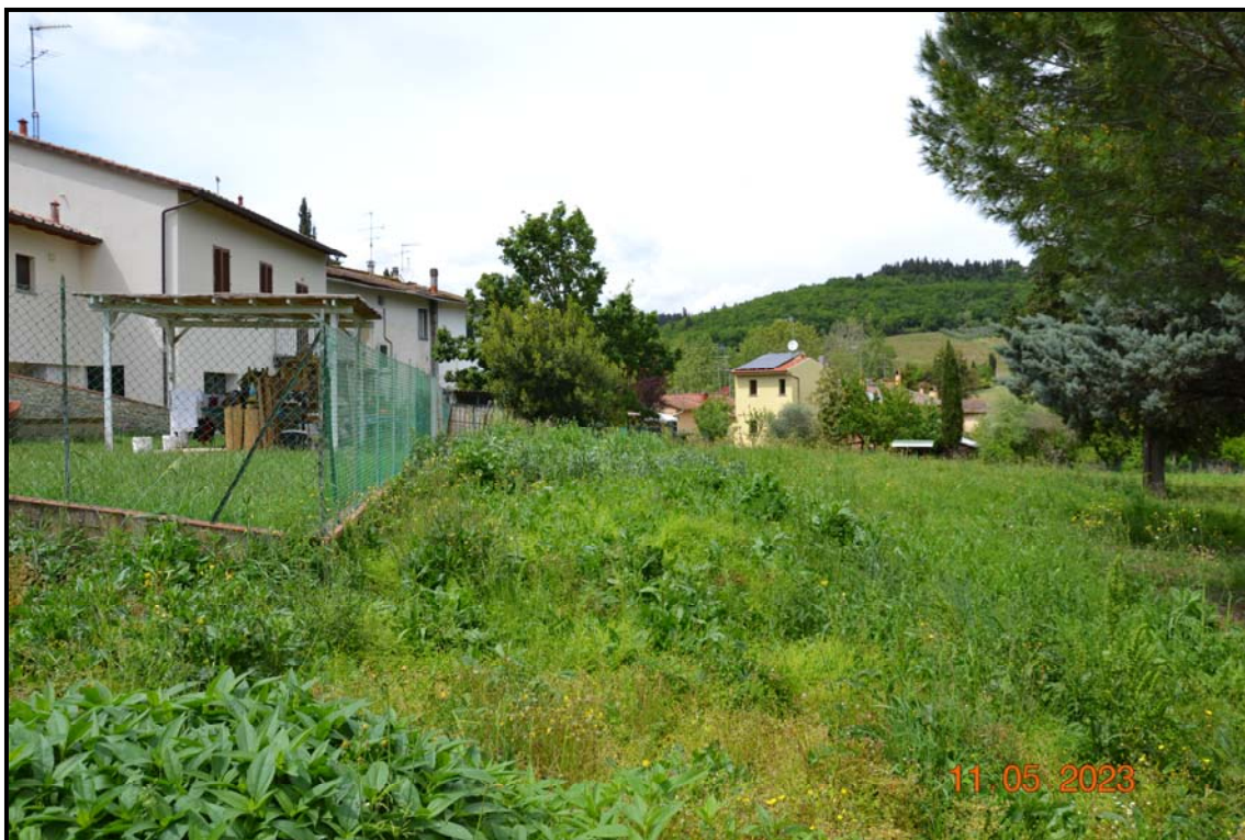
Fotografia n. 9 P.lle 453, 448, F. 123