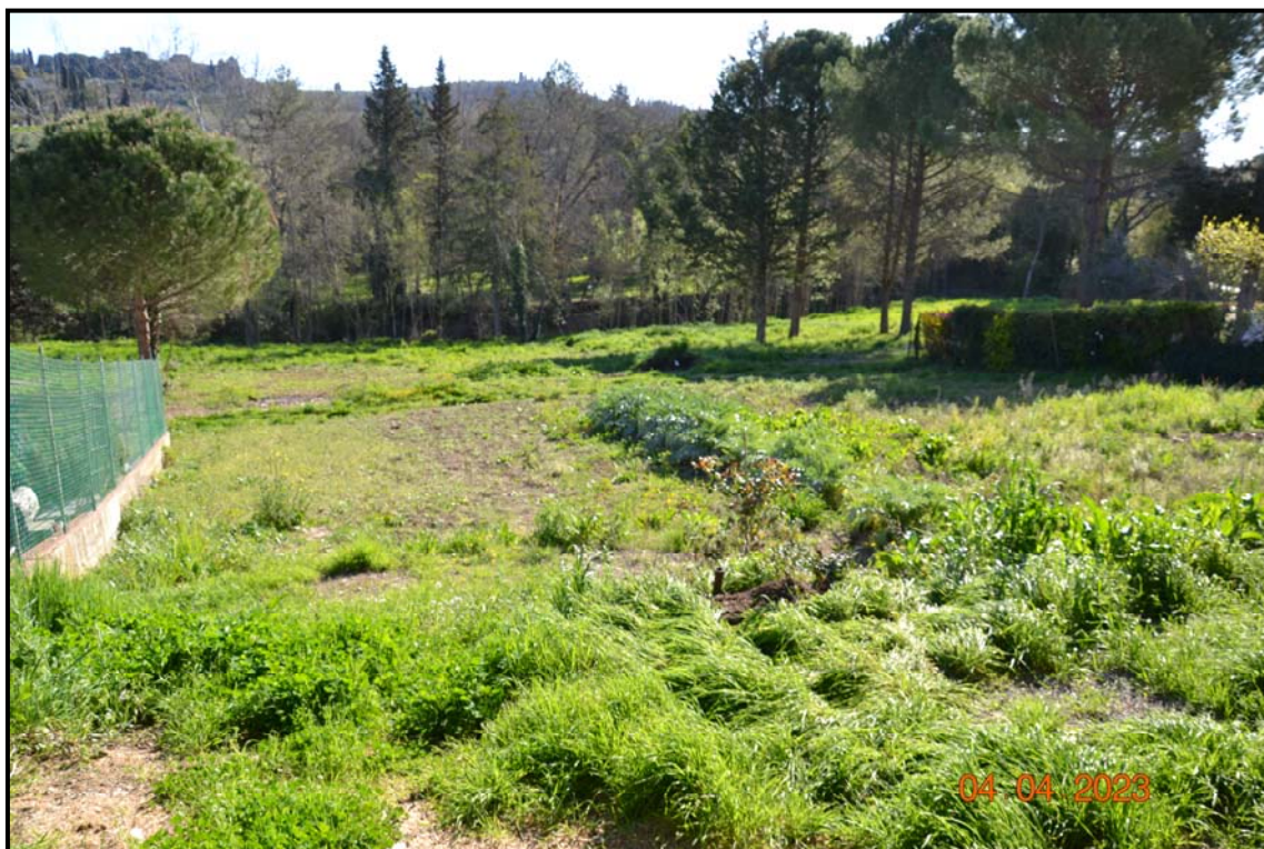
Fotografia n. 7 P.lle 450, 451, F. 123