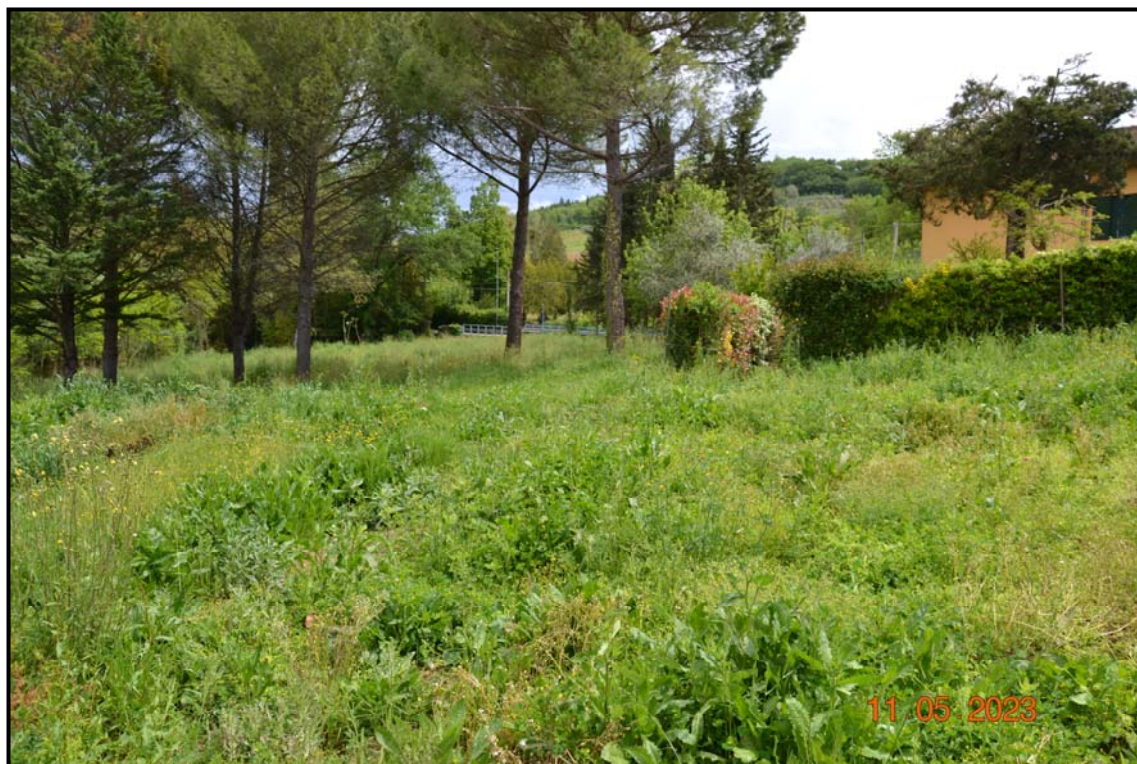
Fotografia n. 12 P.lle 452, 454, 456, F. 123