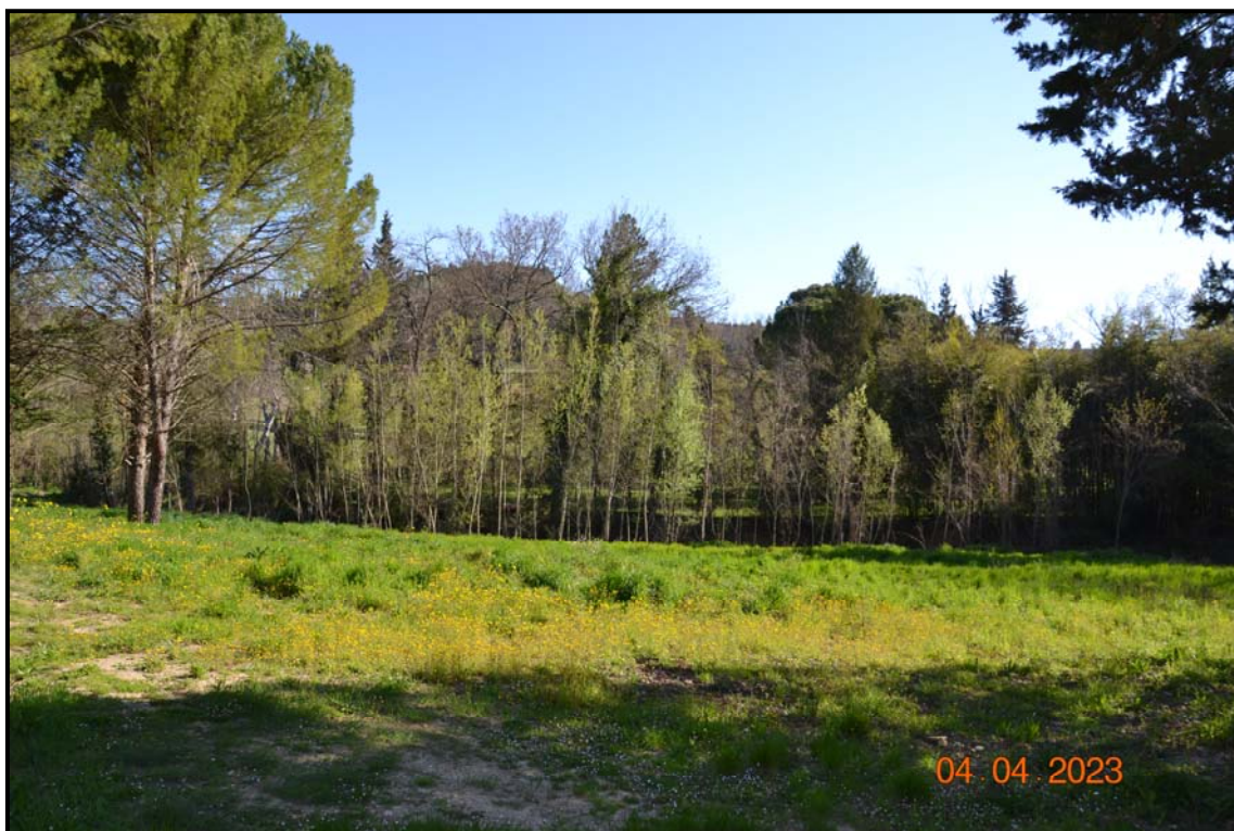
Fotografia n. 18 P.lle 459, 457, 456 F. 123