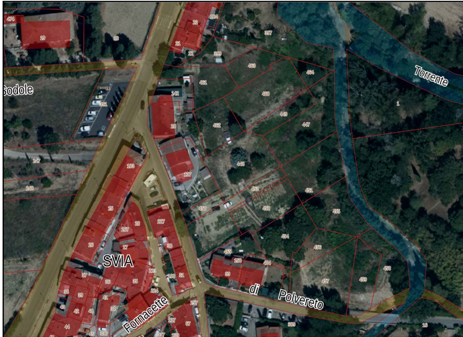
Fotografia n. 2 Ortofoto Regione Toscana – anno 2021