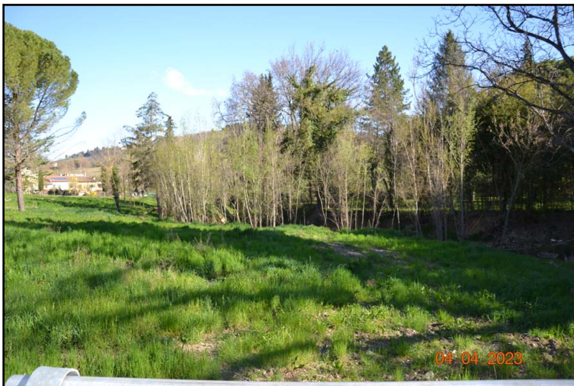
Fotografia n. 16 P.lle 457, 459, 458 F. 123