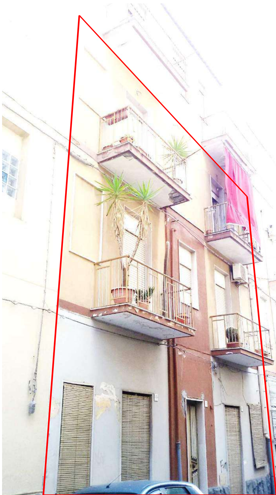
Fono n.1: Prospetto edificio, in rosso l'unità abitativa pignorata.