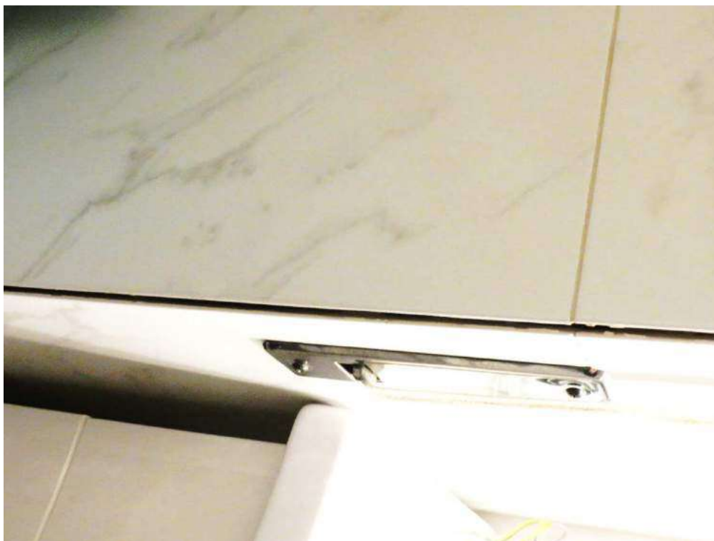
Foto n. 15: Particolare del rigonfiamento delle piastrelle del bagno a piano secondo a causa dell'umidità.