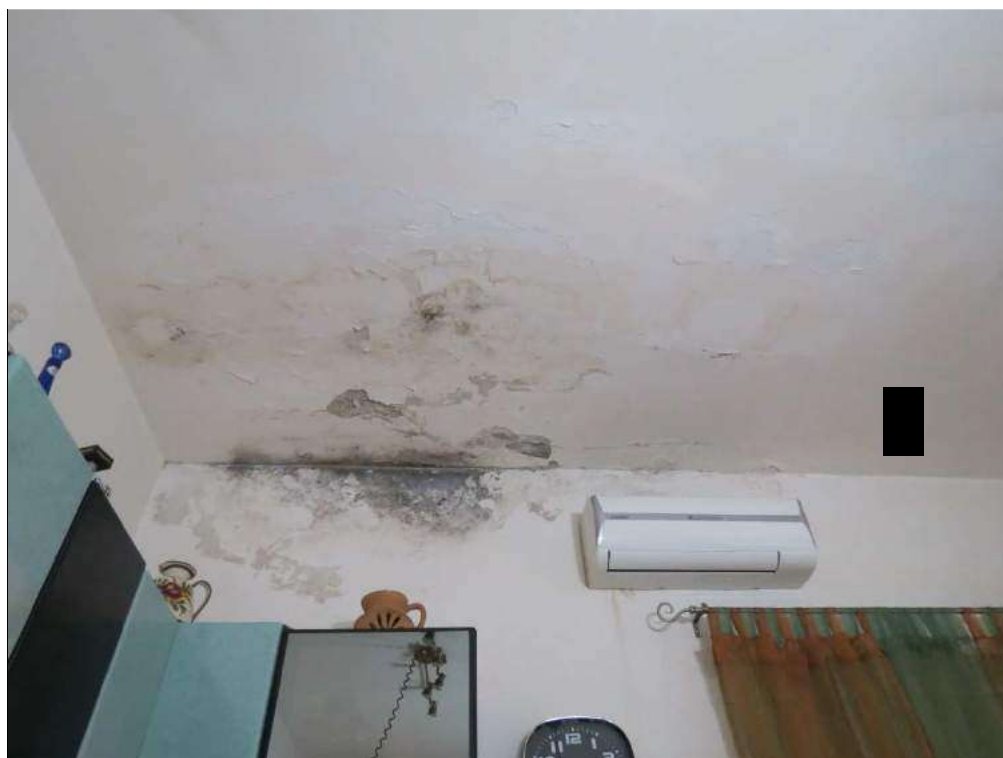
Foto n. 12: Particolare tracce di umidità e muffa presenti nella cucina.