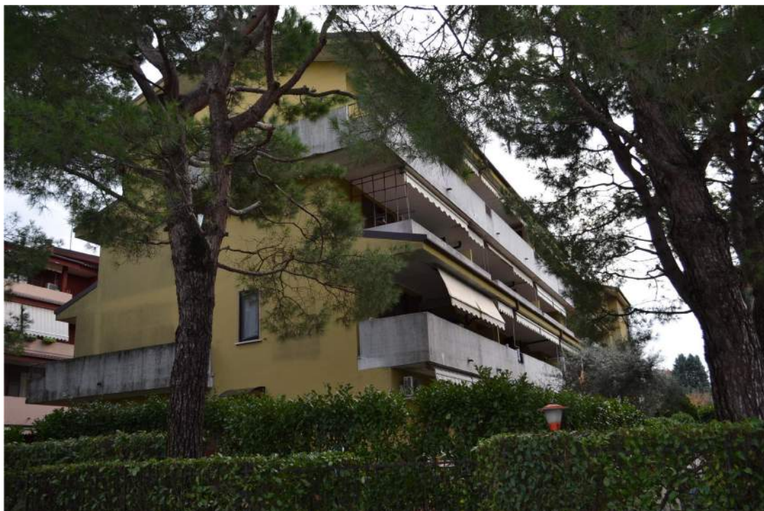
FOTO N. 1 – ESTERNO: Complesso condominiale di Via Don Albeni 3, scala C