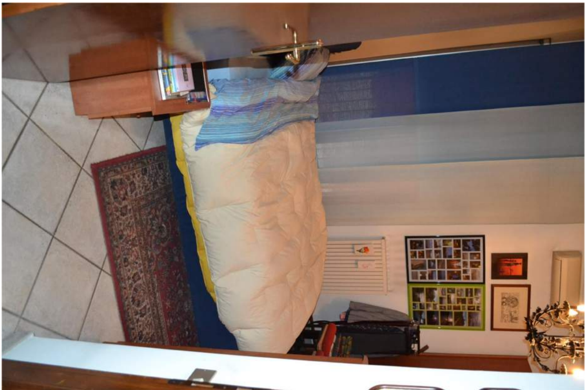
FOTO N. 15 - Camera da letto