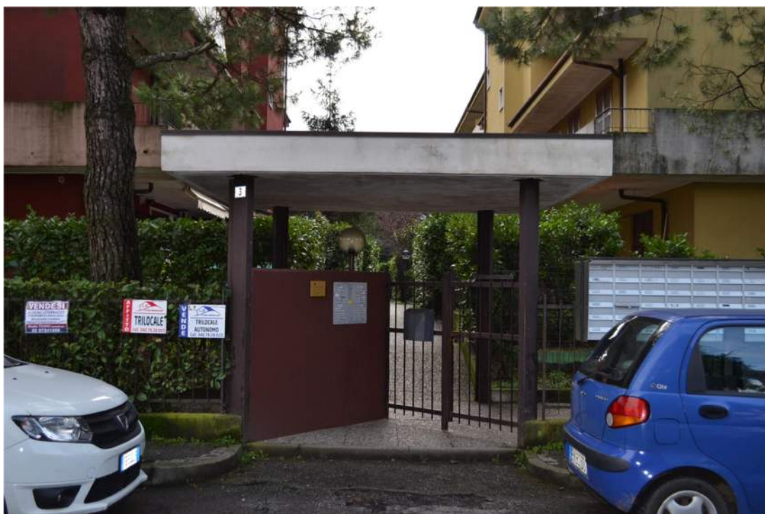
FOTO N. 2 – ESTERNO: Ingresso al complesso condominiale di Via Don Albeni 3