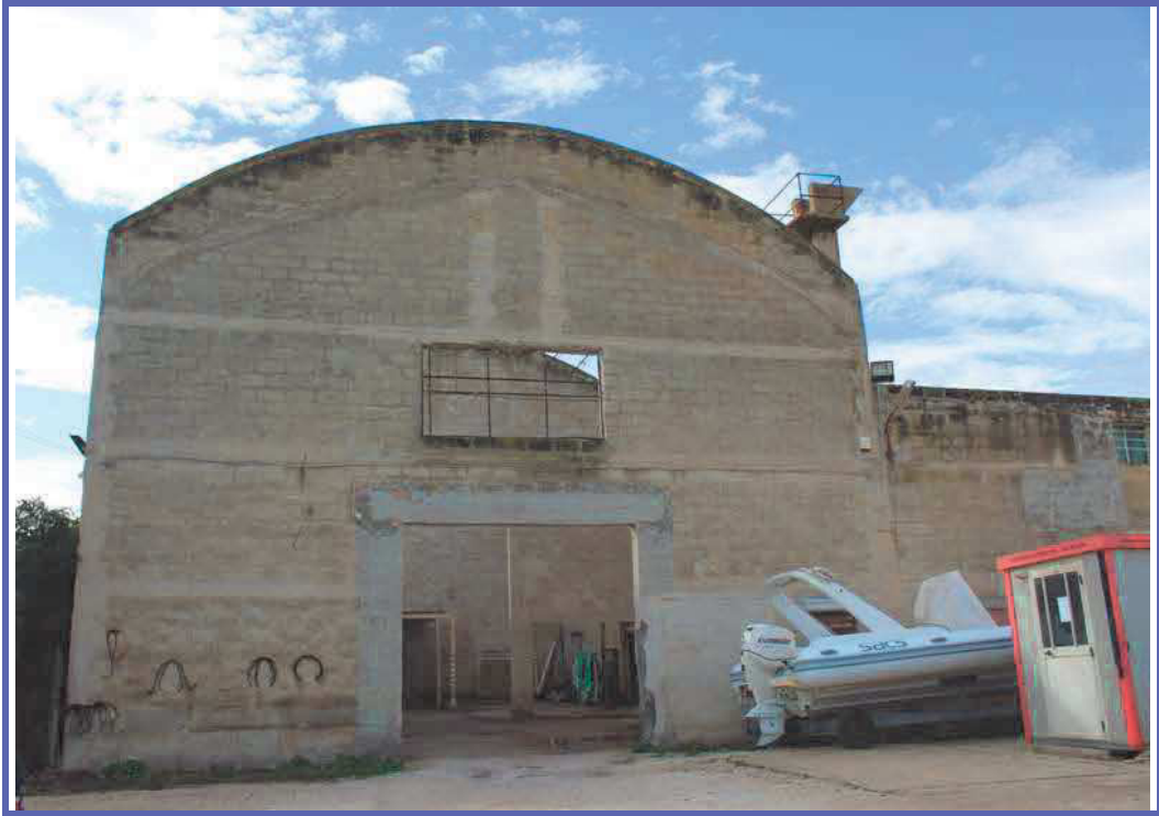
Foto 37 – prospetto nord capannone (prospiciente terreno di altra ditta)