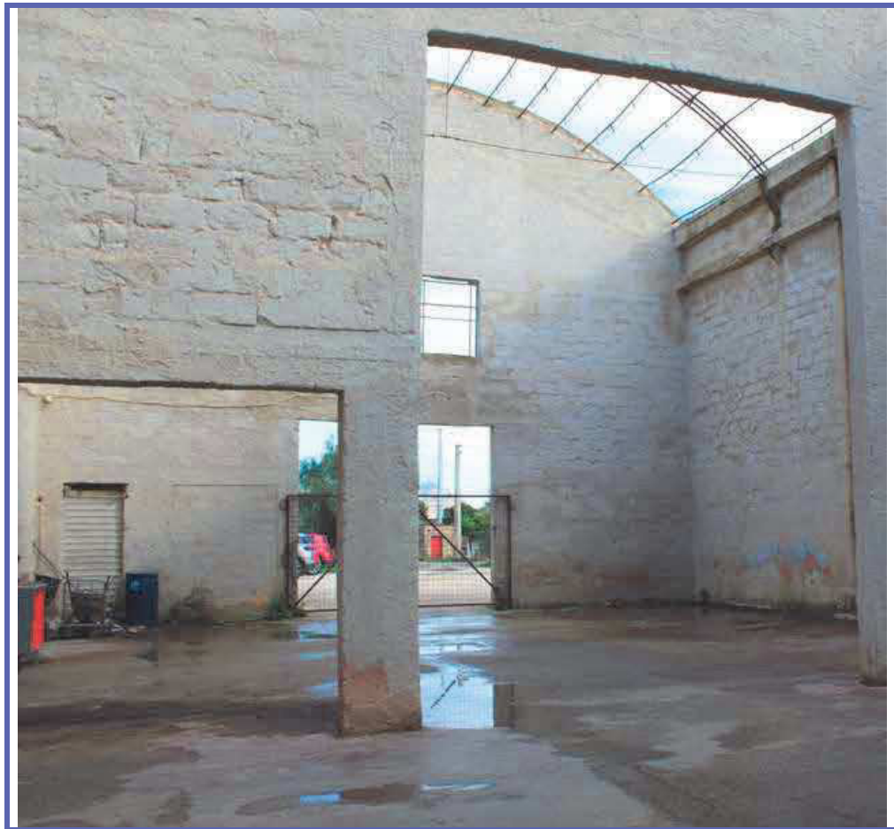
Foto 36 - interno capannone