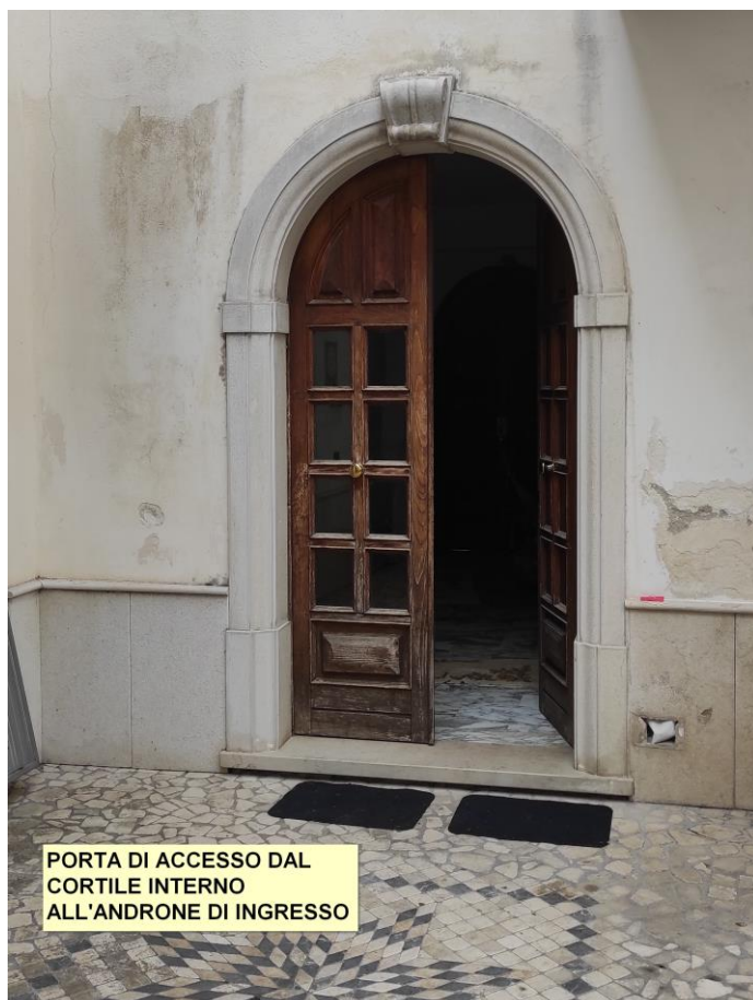
PORTA DI ACCESSO DAL CORTILE INTERNO ALL'ANDRONE DI INGRESSO