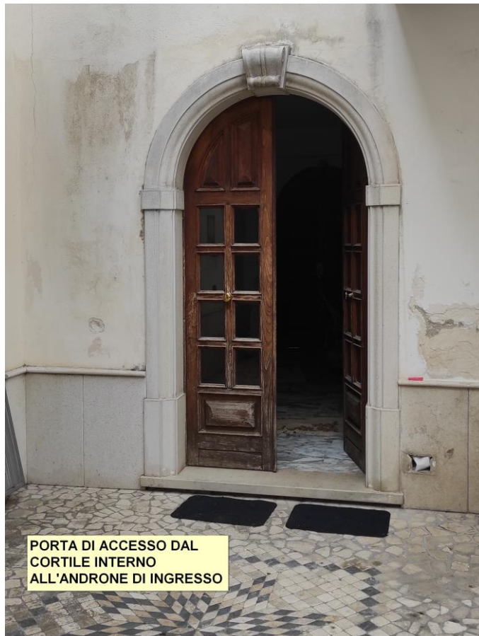
PORTA DI ACCESSO DAL CORTILE INTERNO ALL'ANDRONE DI INGRESSO