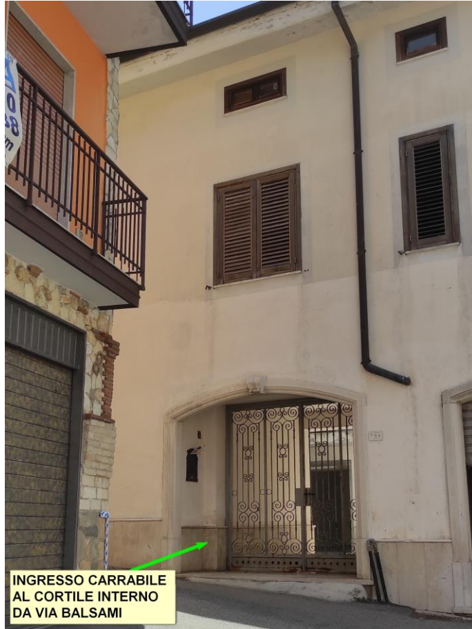
INGRESSO CARRABILE AL CORTILE INTERNO DA VIA BALSAMI