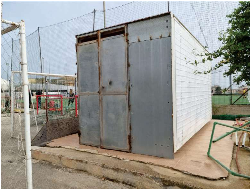
FOTO 32 - Container adibito a deposito attrezzi.