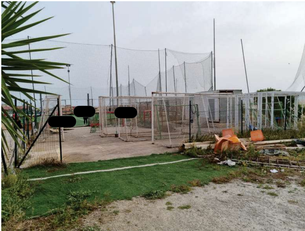
FOTO 33 - Area esterna per il deposito delle attrezzature (ad ovest del fabbricato).