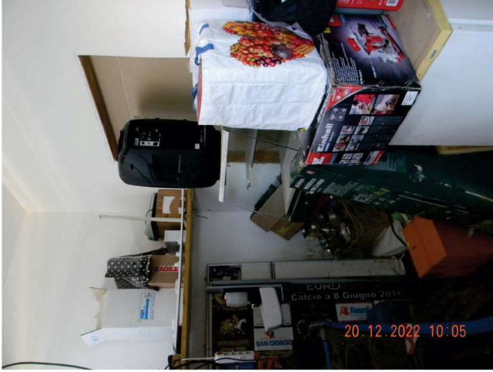
FOTO 18 - Altro scorcio del ripostiglio.