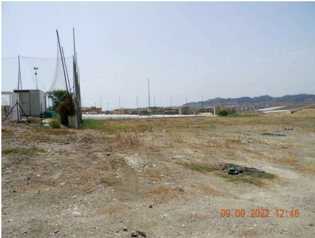
FOTO 29 - Porzione ovest del lotto (laddove era previsto originariamente il campo di calcio a 7 in terra battuta poi non realizzato).