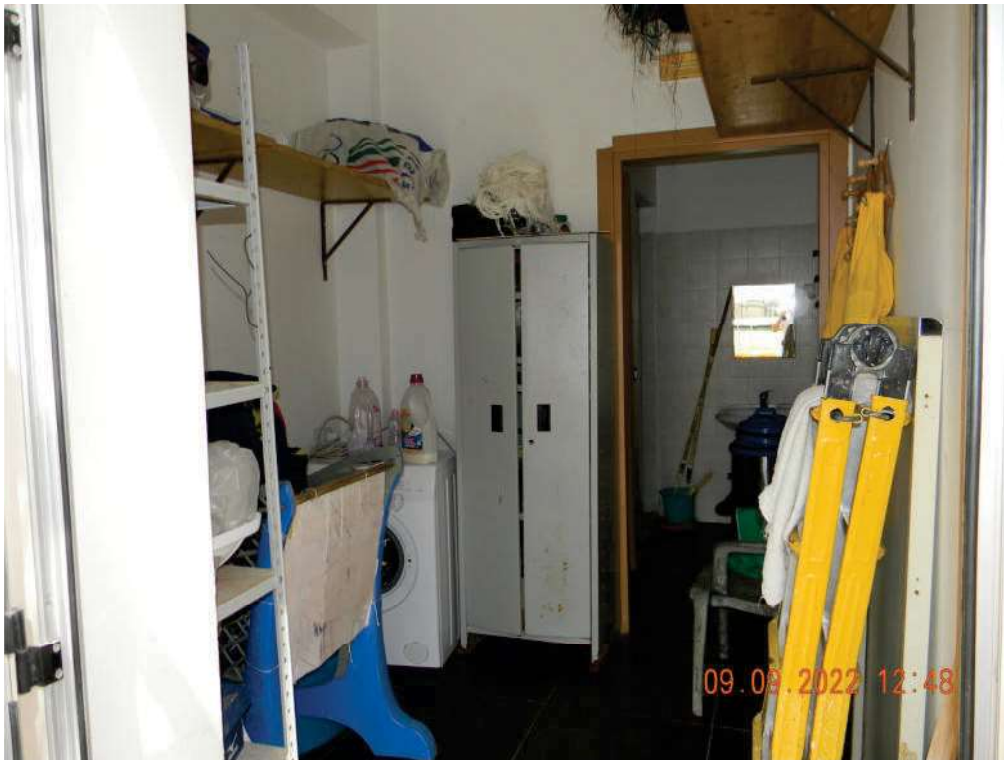
FOTO 21 - Spogliatoio arbitri.