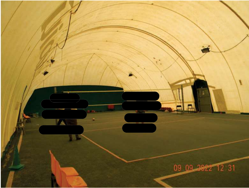
FOTO 13 - Interno della struttura pressostatica (palestra polifunzionale).