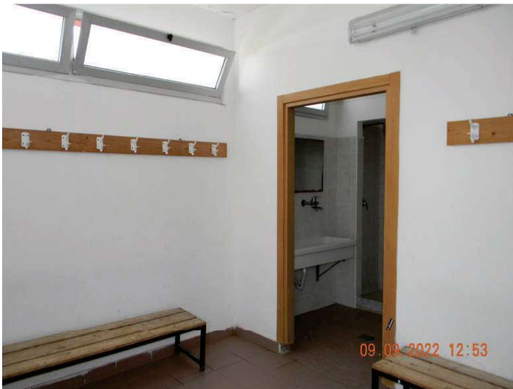
FOTO 26 - Spogliatoio.