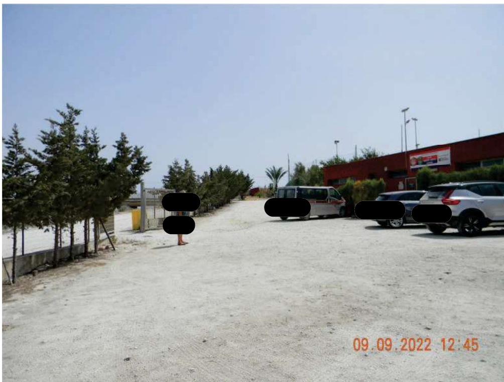
FOTO 34 - Vista dell'area di ingresso e parcheggio da ovest verso est.