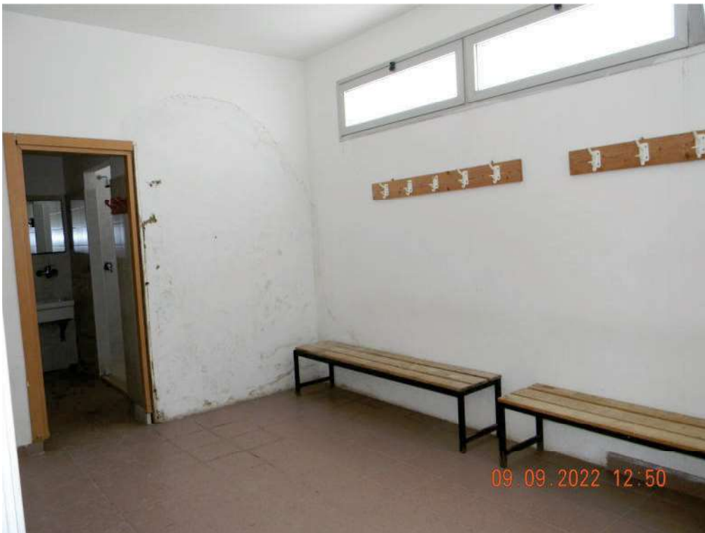
FOTO 24 - Spogliatoio.