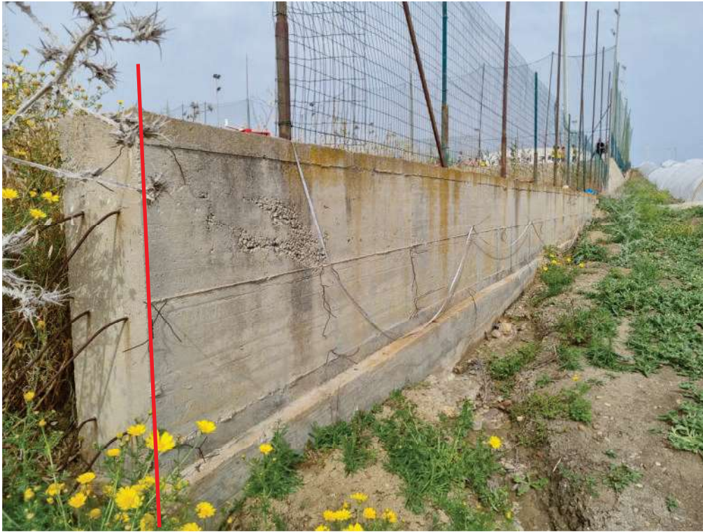
FOTO 31 - Altra immagine del muro di confine di cui sopra, ritratto dalla particella 58. La linea rossa indica il vertice di sud-ovest del lotto oggetto di perizia (mappale 975) al confine con la particella 109.