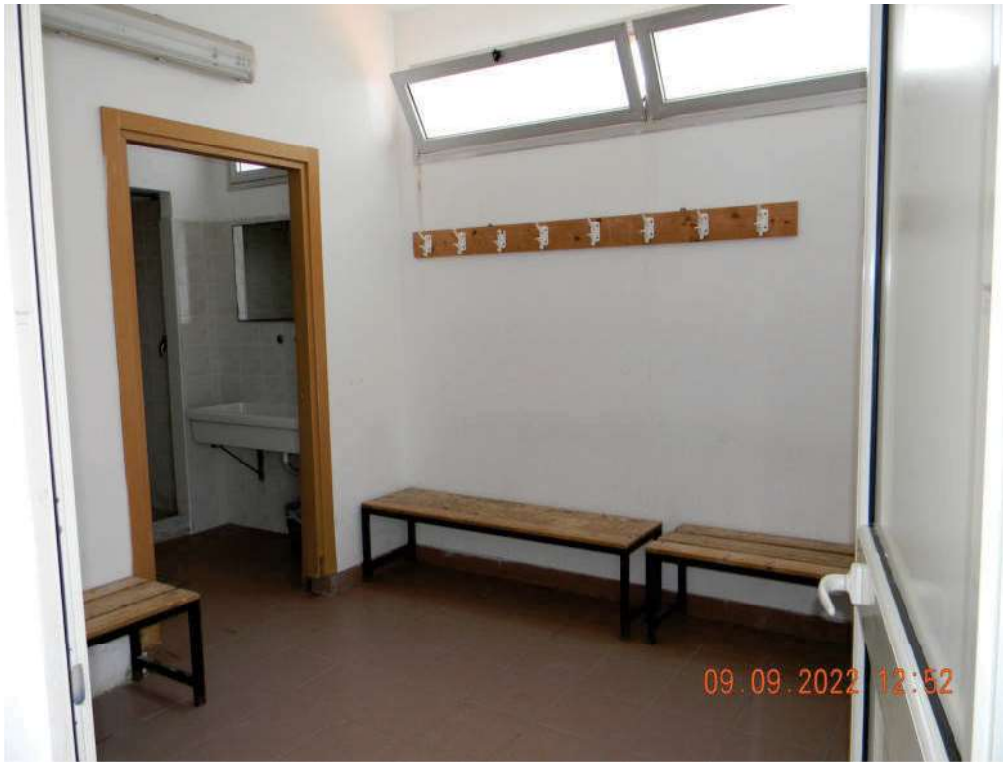
FOTO 25 - Spogliatoio.