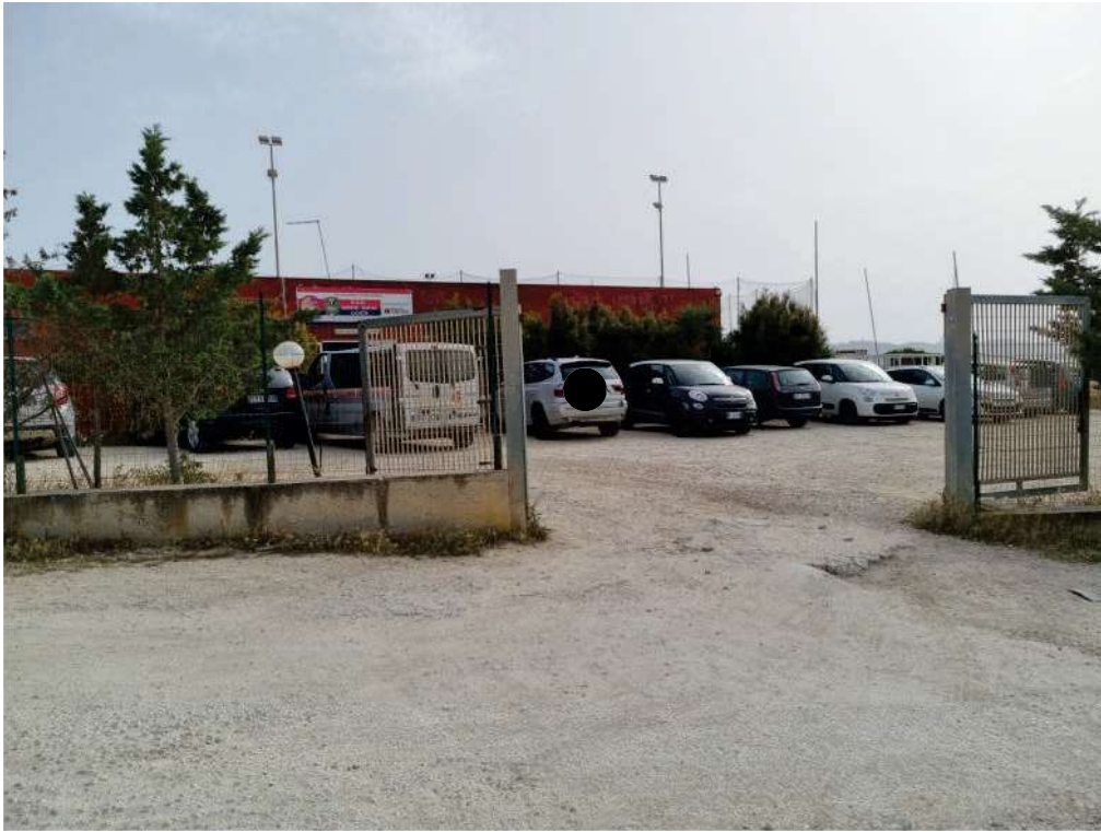
FOTO 01 - Accesso al lotto.