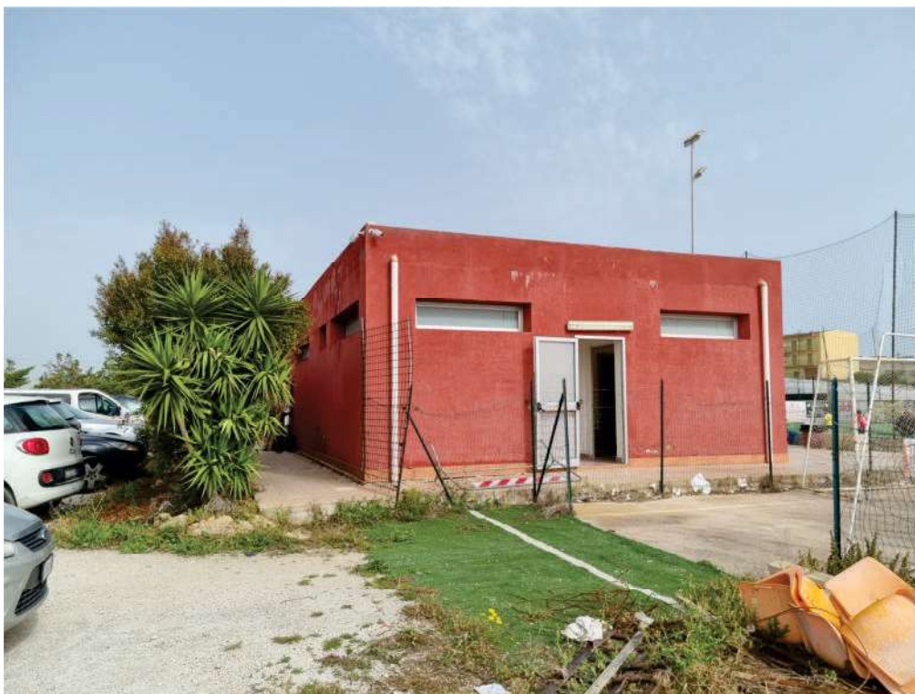
FOTO 22 - Accesso agli spogliatoi atleti lato ovest.