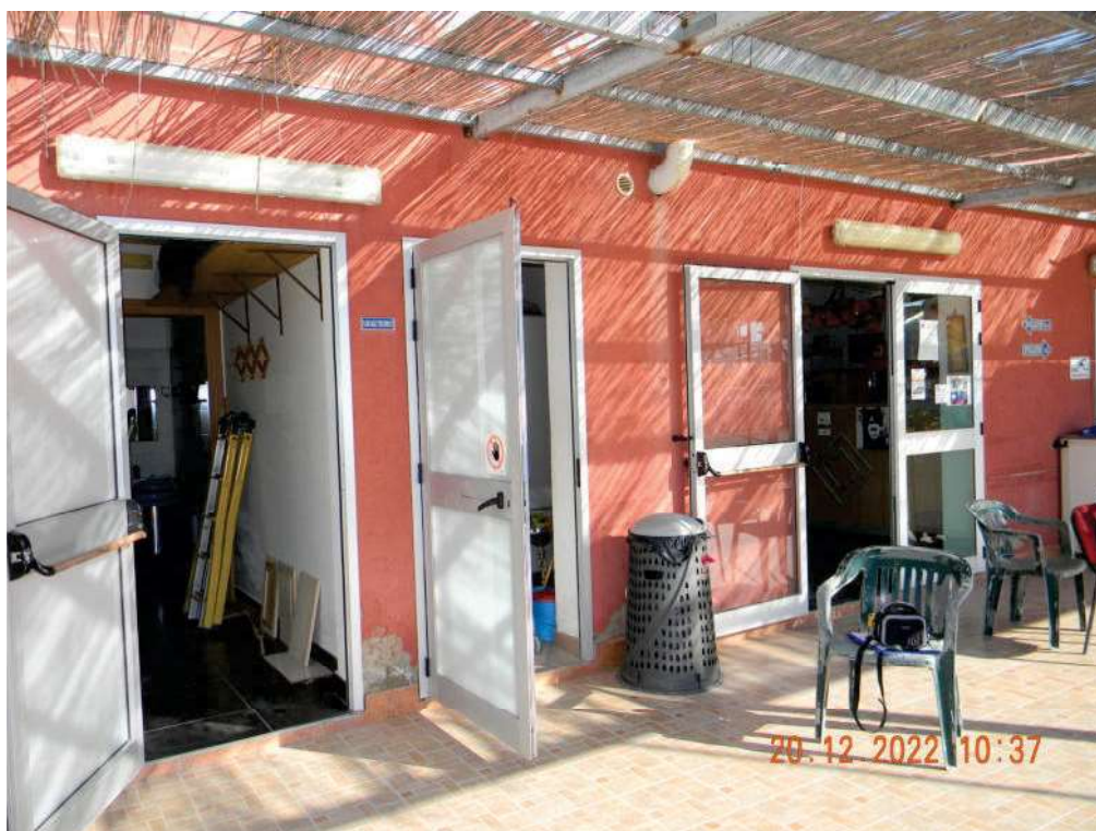
FOTO 05 - Scorcio del prospetto sud e della struttura ombreggiante in alluminio con incannucciato.