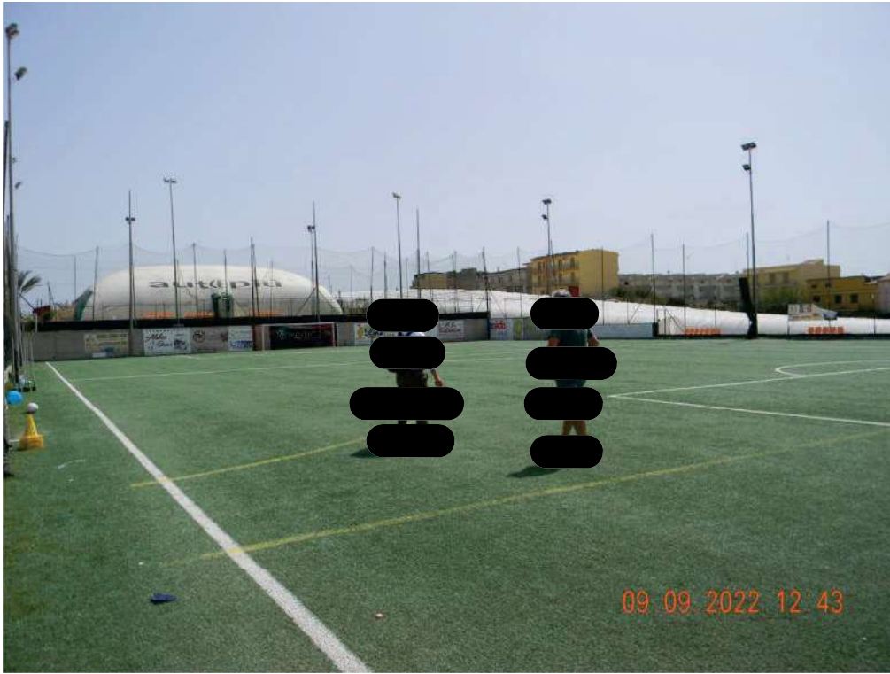
FOTO 07 - Campo di calcio a 7 (sullo sfondo la struttura pressostatica).