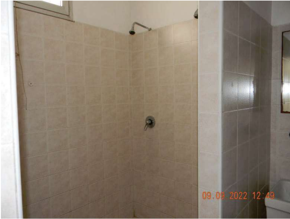
FOTO 27 - Docce.