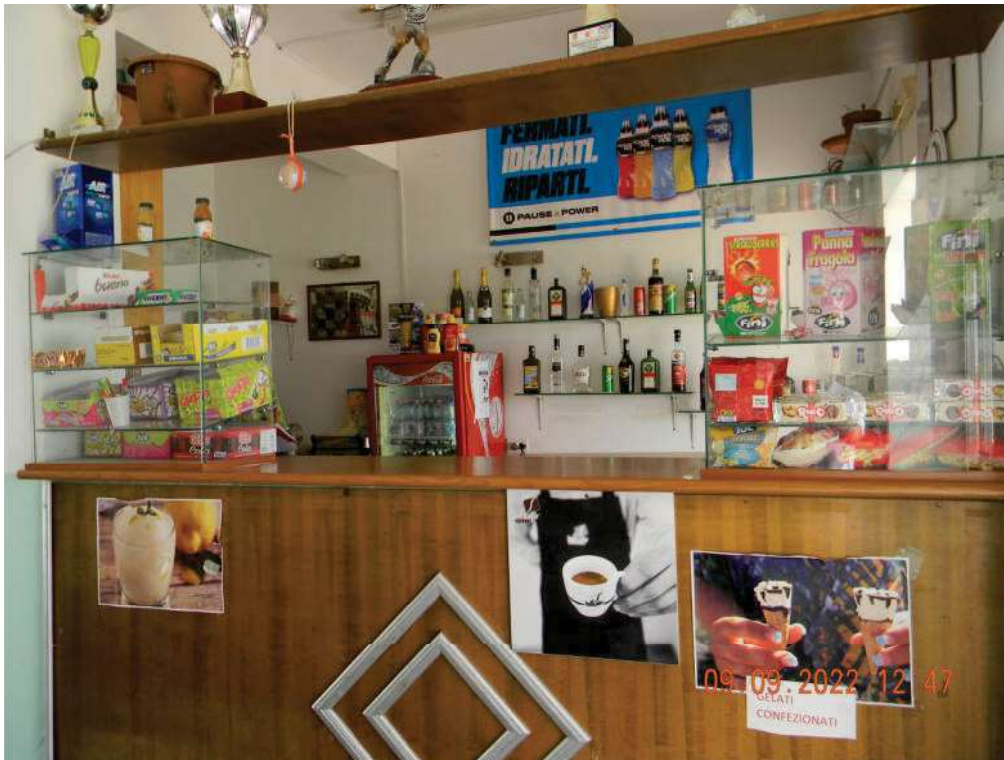
FOTO 19 - Zona bar (da eliminare ed adibire ad area di pronto soccorso).