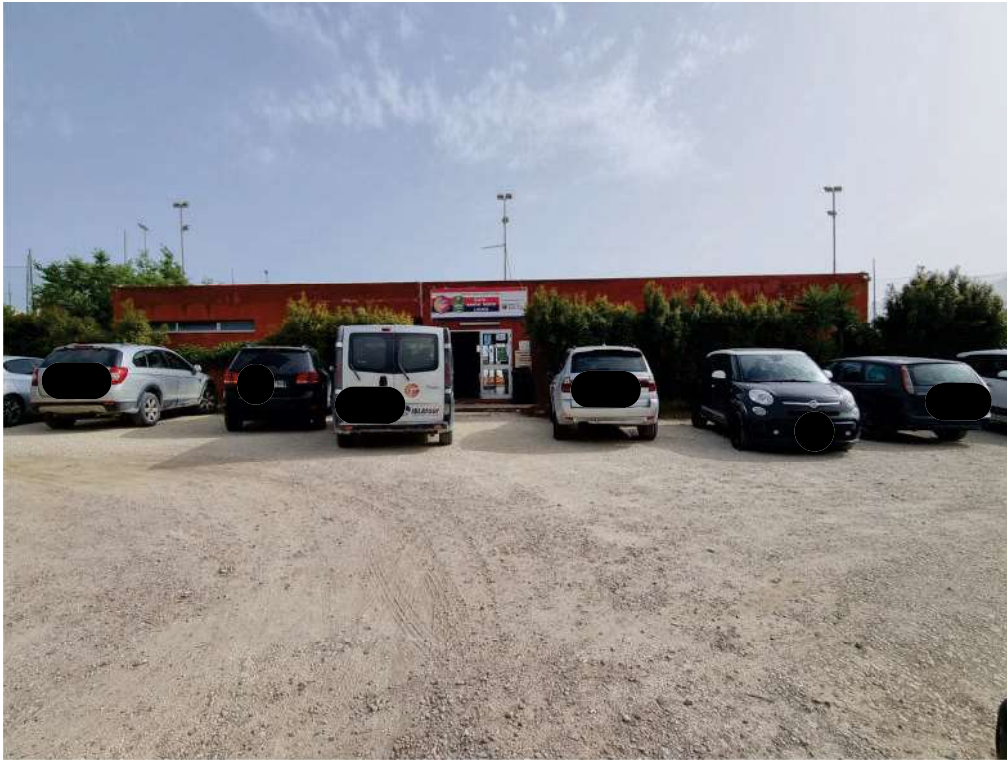
FOTO 03 - Area parcheggio e prospetto nord dell'edificio.