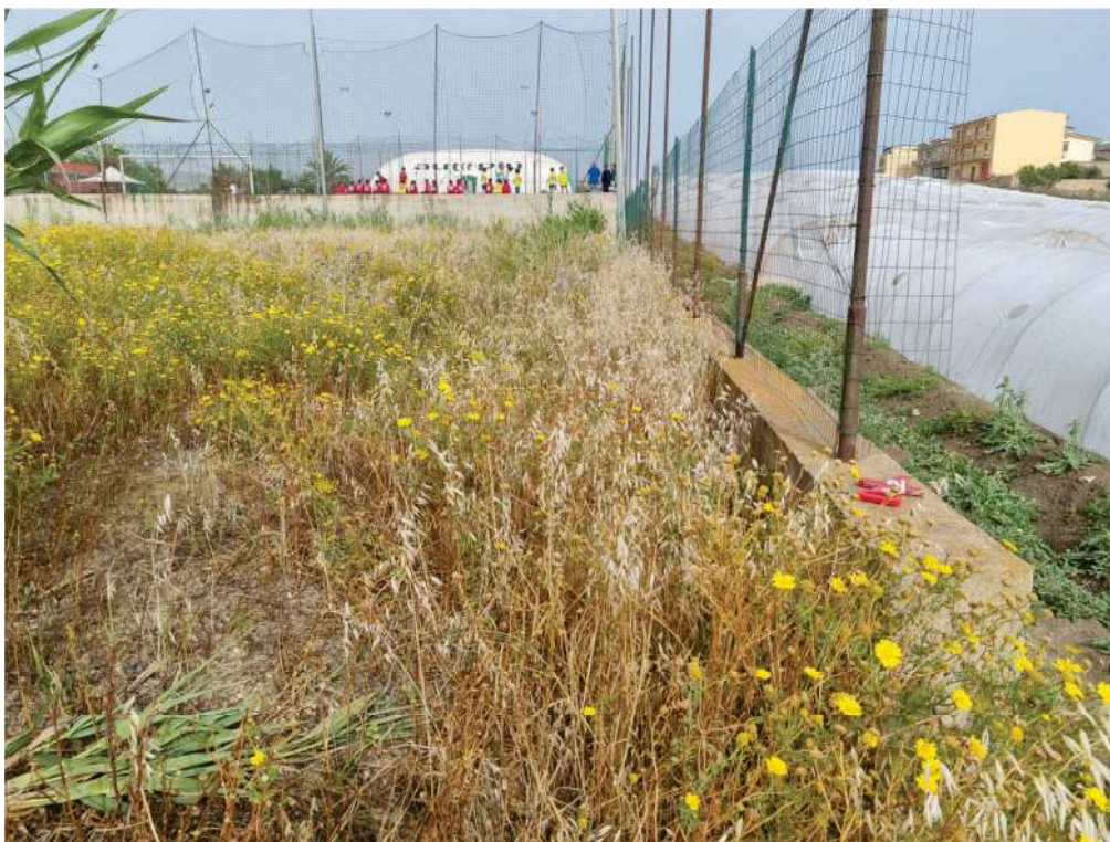
FOTO 30 - Muro di confine fra la particella 975 (a sinistra) e la particella 58.