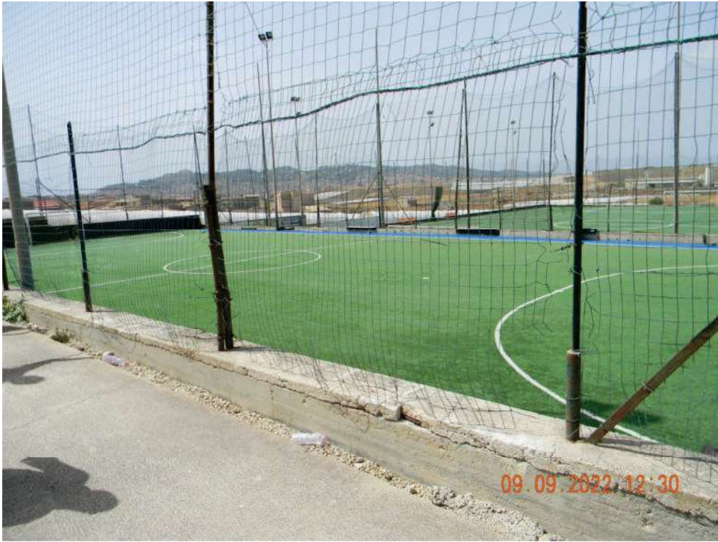
FOTO 09 - Campo di calcio a 5.