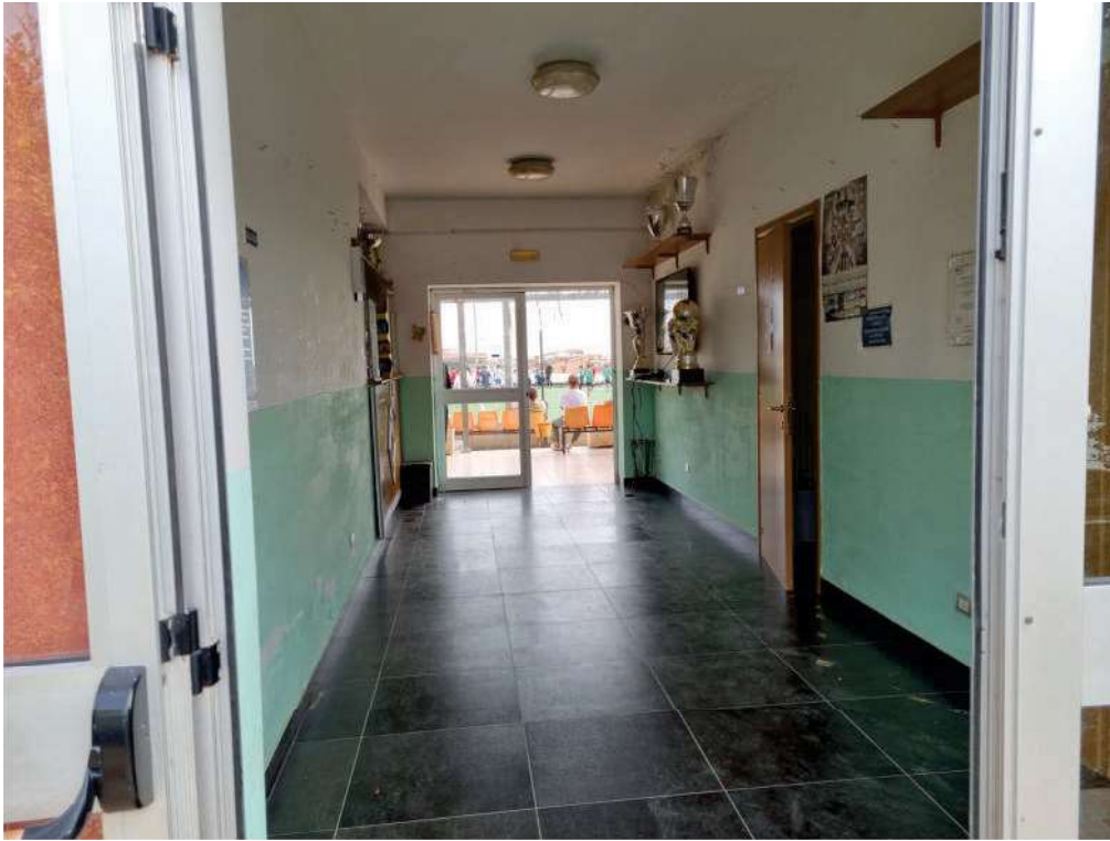
FOTO 15 - Corridoio centrale di ingresso dell'edificio.