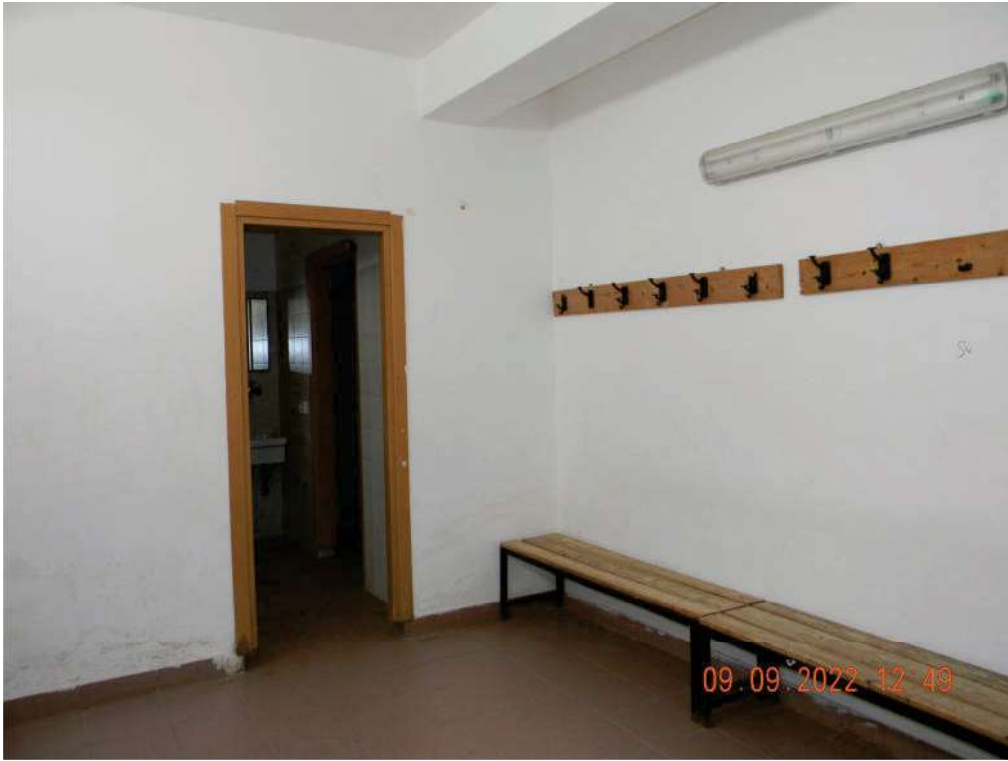
FOTO 23 - Spogliatoio.