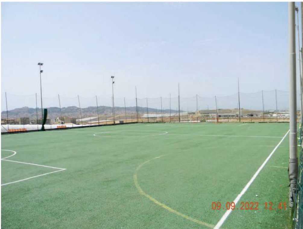
FOTO 08 - Campo di calcio a 7.