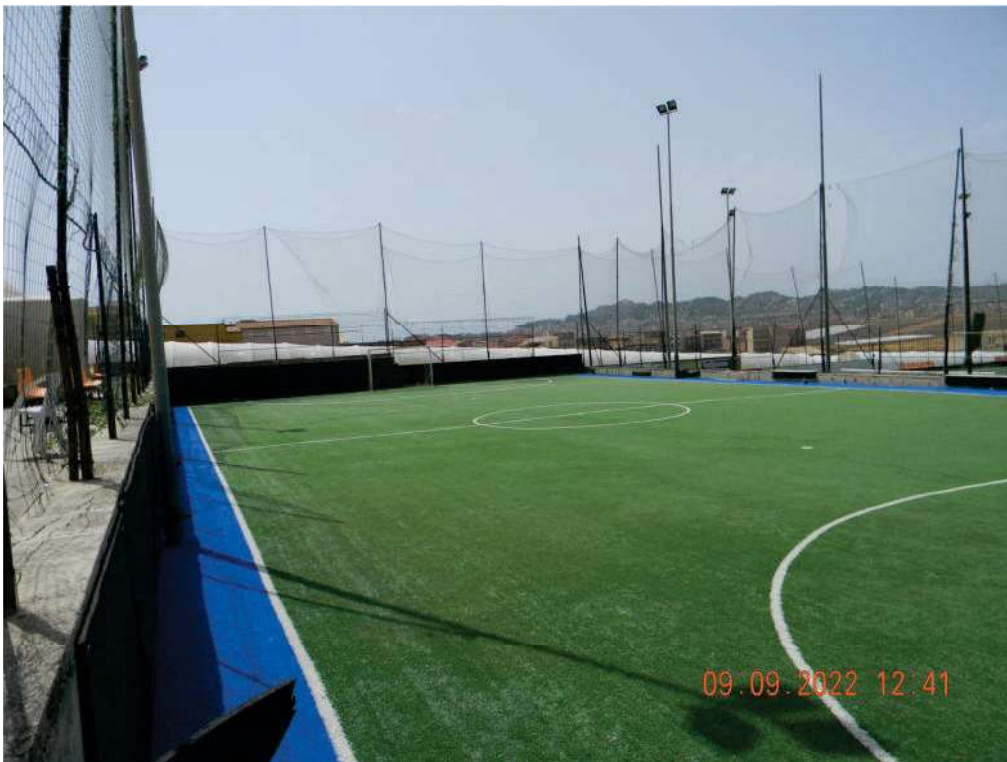
FOTO 10 - Campo di calcio a 5.