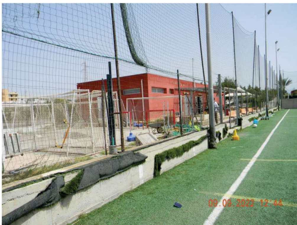
FOTO 06 - L'edificio visto da sud-ovest (precisamente dal campo di calcio a 7).