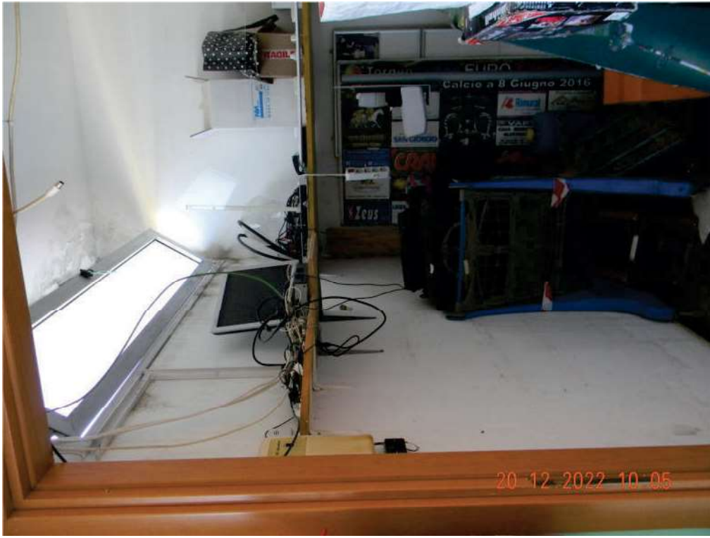
FOTO 17 - Ripostiglio (da trasformare in W.C. per persone diversamente abili).