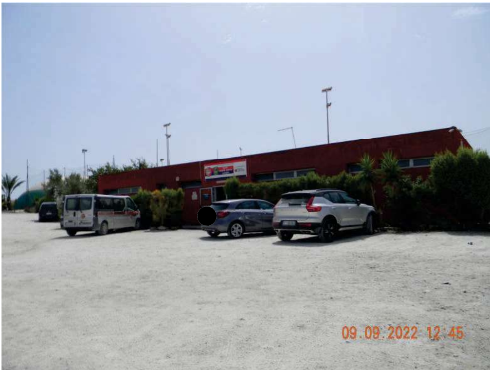
FOTO 02 - Vista dell'edificio da nord-ovest.