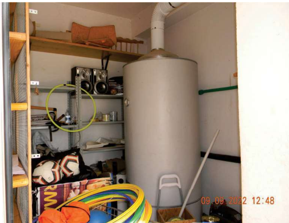
FOTO 20 - Locale tecnico (da trasformare in spogliatoio per gli istruttori).