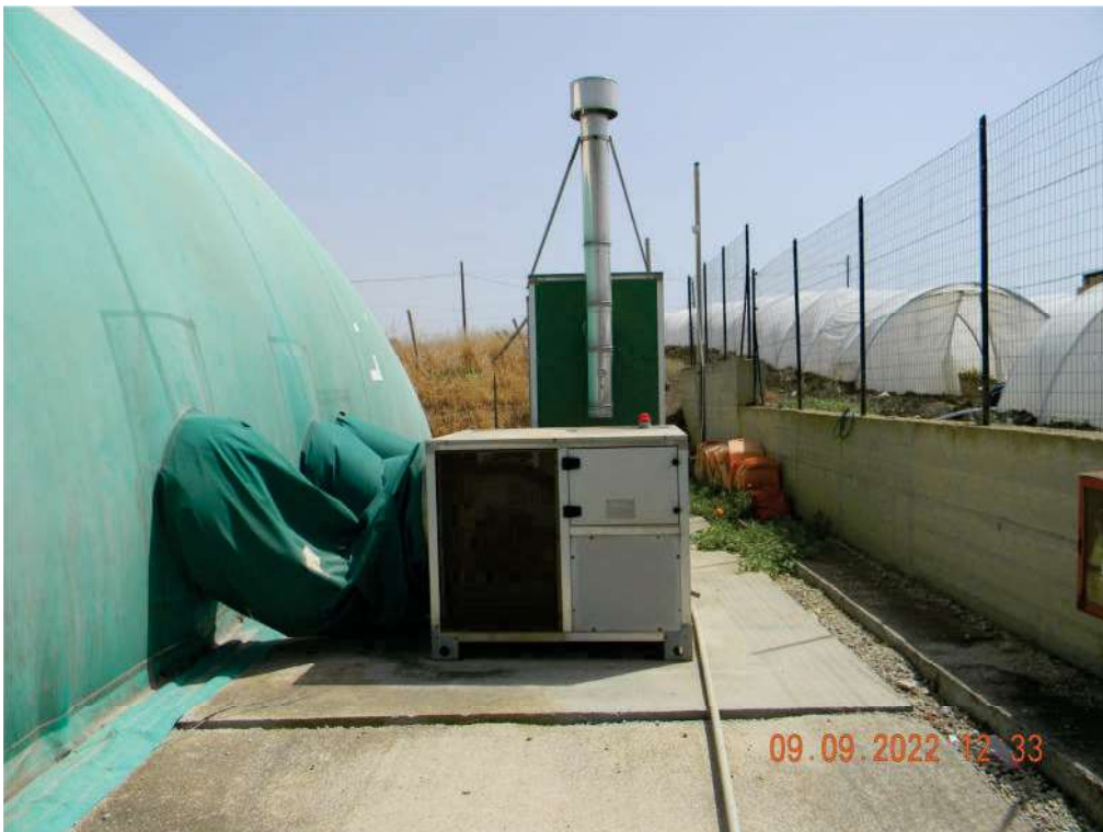
FOTO 14 - Generatore d'aria.