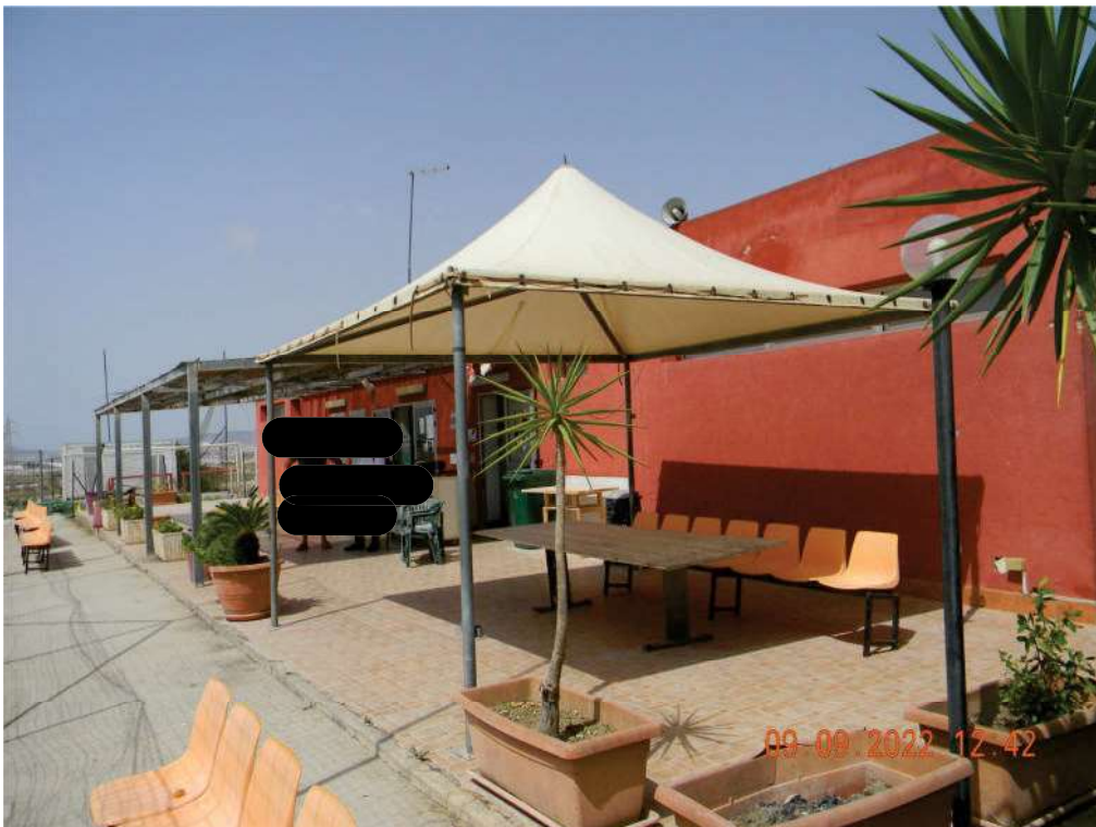
FOTO 04 - Prospetto sud con terrazza adiacente parzialmente coperta.