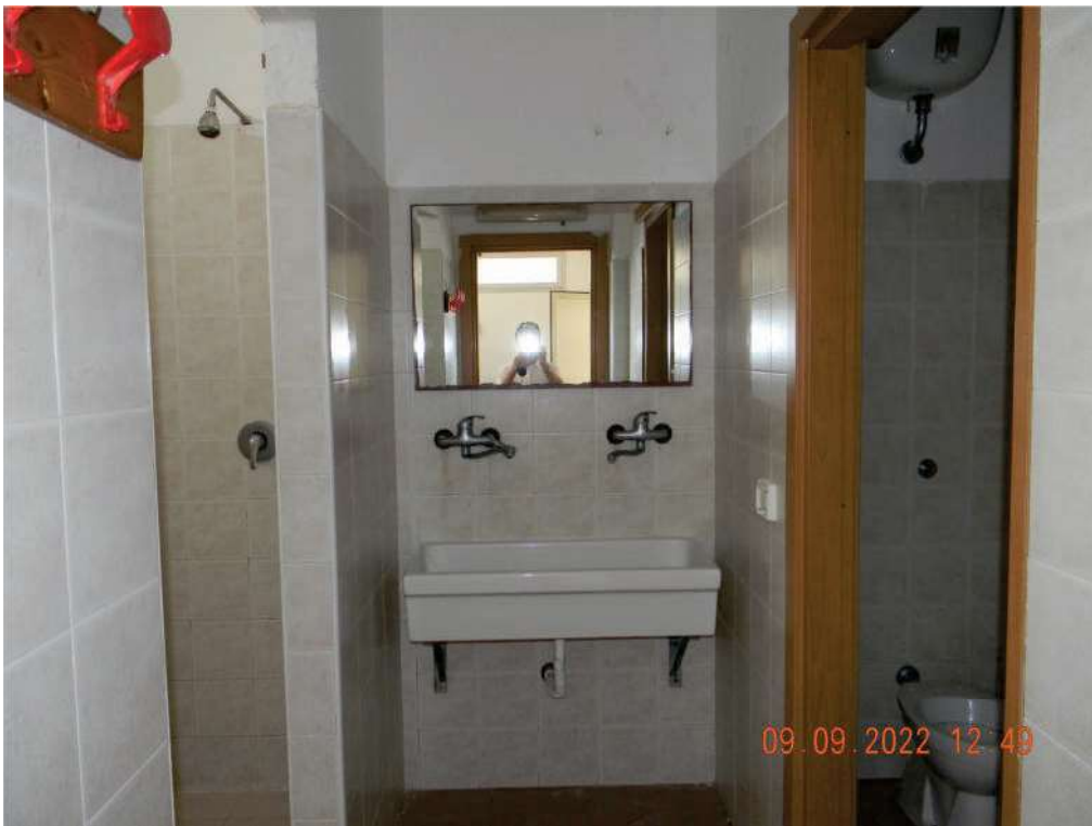
FOTO 28 - Antibagno.