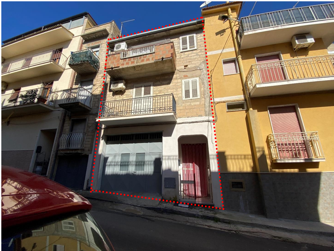
Figura 2. Foto prospetto su via Pasubio