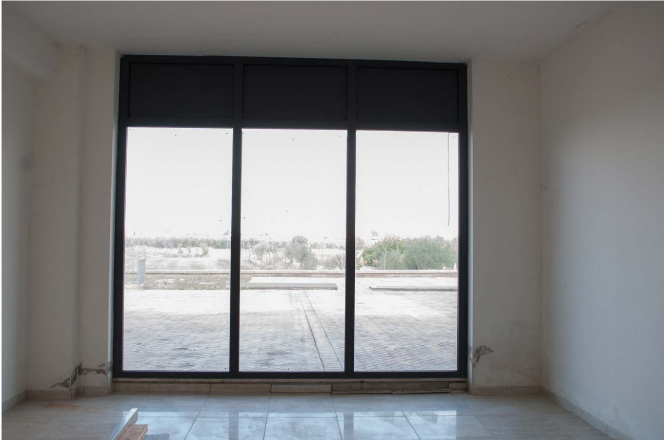
Foto n. 20, 21 -vista dei dettagli Bene n.1: l'infisso in alluminio verniciato a vetro singolo sul lato OVEST cortile comune