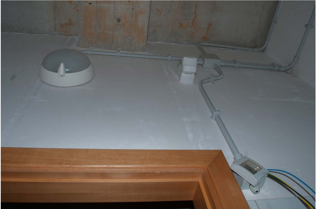
Foto n. 18 - vista dei dettagli Bene n.1: il WC con impianto elettrico e dispositivi di illuminazione in fase di costruzione