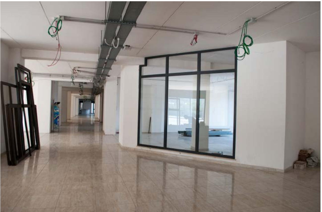
Foto n. 8 - vista dell'esterno Bene n.1 : sul lato NORD della galleria commerciale in primo piano la vetrina espositiva