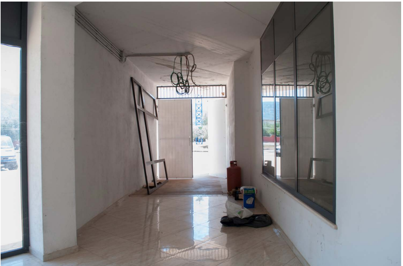
Foto n. 4 - vista degli spazi comuni del centro commerciale: l'ingresso che è attualmente ancora in fase di costruzione