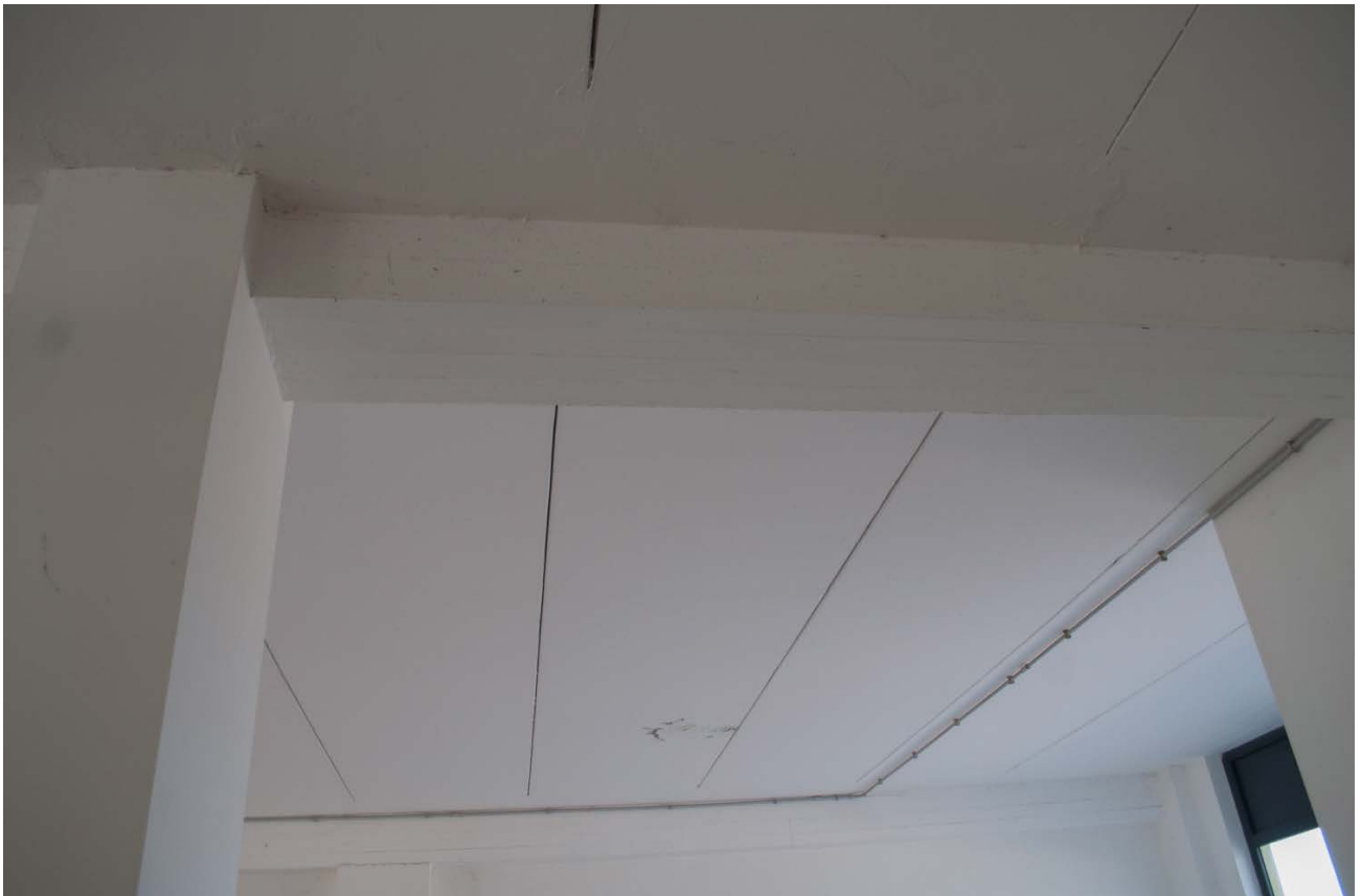
Foto n.19 - vista dei dettagli Bene n.1: il soffitto in assenza di controsoffittatura