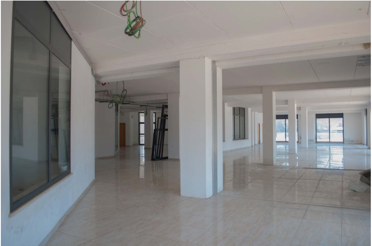
Foto n. 5, 6 - vista degli spazi comuni della la galleria del centro commerciale : si evidenzia che sono ancora in fase di costruzione in quanto non sono stati completati i lavori relativi alle controsoffittature, agli impianti e quelli relativi alle partizioni dei locali commerciali