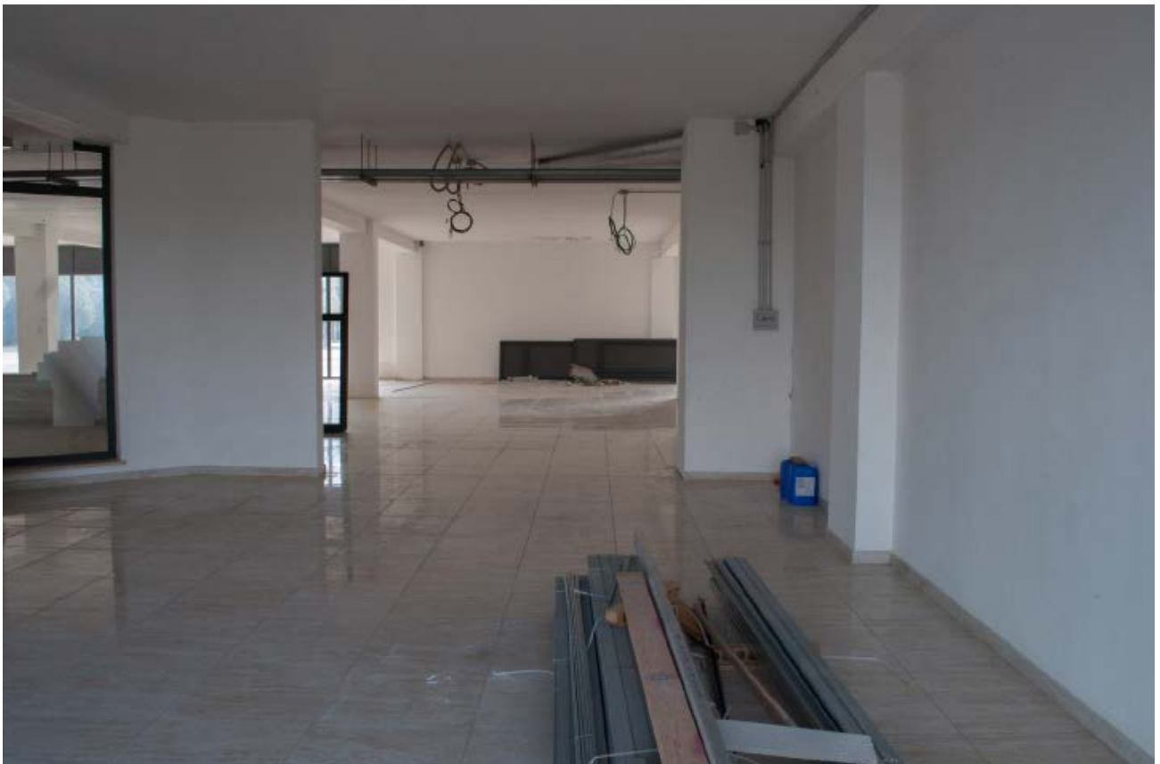
Foto n. 10 - vista dell'interno Bene n.1: lo spazio di vendita del locale commerciale dove si evidenzia l'assenza di partizione della vetrina-ingresso e che pertanto è aperto sulla galleria

Foto n. 9 - vista dell'esterno Bene n.1 : sul lato EST della galleria commerciale dove si evidenzia che la partizione a vetrina- ingresso non è stata ancora realizzata e che gli impianti relativi agli spazi comuni sono in fase di costruzione