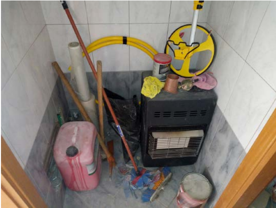
Foto n. 16 - vista dell'interno Bene n.1: il disimpegno del WC con pavimentazione e rivestimento in gres porcellanato colore grigio effetto marmo e bianco e grigio effetto marmo Foto n. 17 - vista dei dettagli Bene n.1: la ventola di areazione del WC