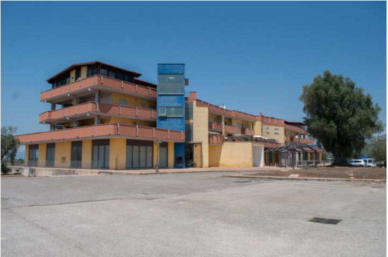
Foto n. 1 - vista dell'esterno del centro commerciale: sul lato EST di ingresso da via Capocroce con area verde ed il parcheggio.