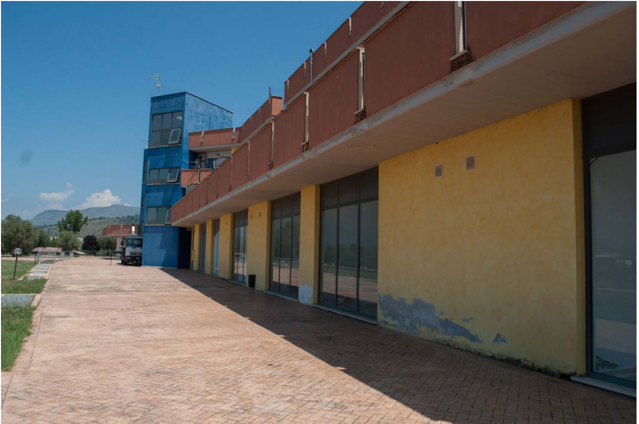
Foto n. 3 - vista dell'esterno del centro commerciale: il lato OVEST su lato di via Monte Polino con le vetrine affacciate su area cortilizia condominiale.