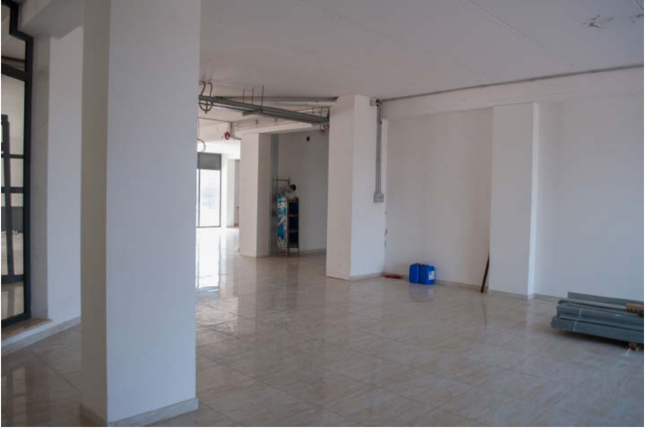
Foto n. 11 - vista dell'interno Bene n.1: lo spazio di vendita del locale commerciale