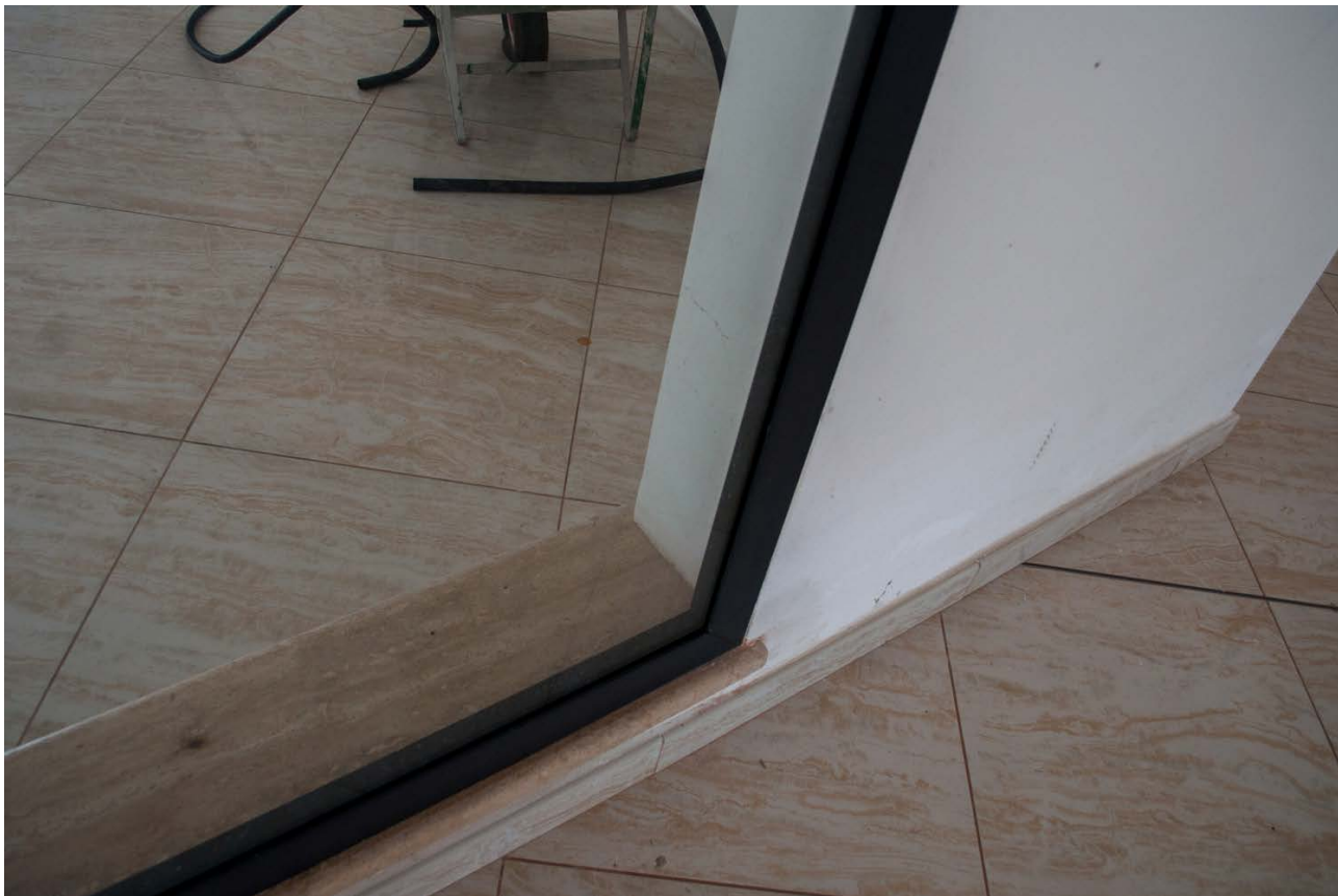
Foto n. 23 -vista dei dettagli Bene n.1: l'infisso vetrina espositiva sul lato EST galleria commerciale