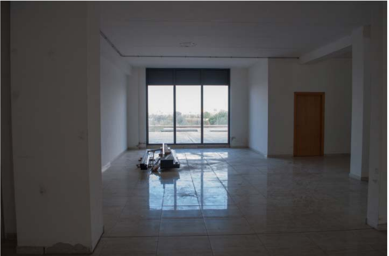
Foto n. 12 - vista dell'interno Bene n.1: lo spazio di vendita del locale commerciale aperto sulla galleria