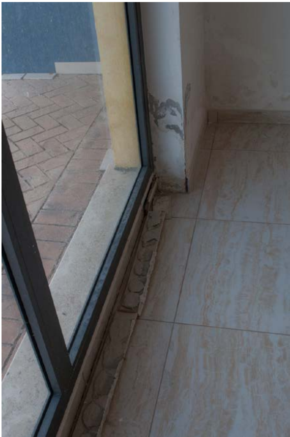
Foto n. 22 - vista dei dettagli Bene n.1: l'infisso vetrina espositiva sul lato EST galleria commerciale