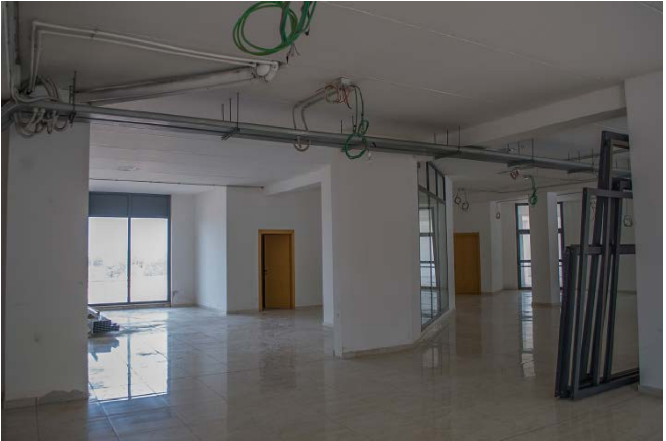
Foto n. 7 - vista dell'esterno Bene n.1 : sul lato EST della galleria commerciale dove si evidenzia che la partizione a vetrina- ingresso non è stata ancora realizzata e pertanto il locale attualmente è in fase di costruzione