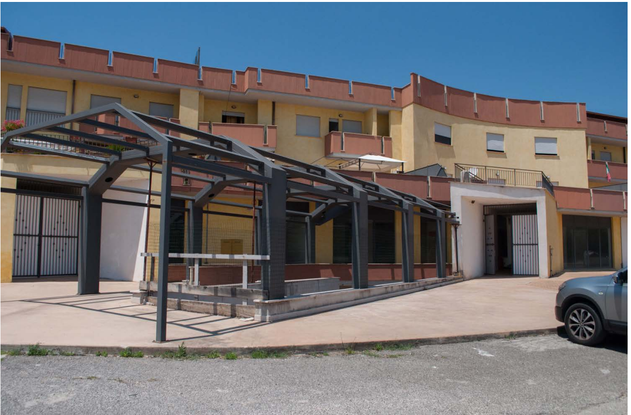
Foto n. 2 - vista dell'esterno del centro commerciale : gli ingressi sul lato EST da via Capocroce