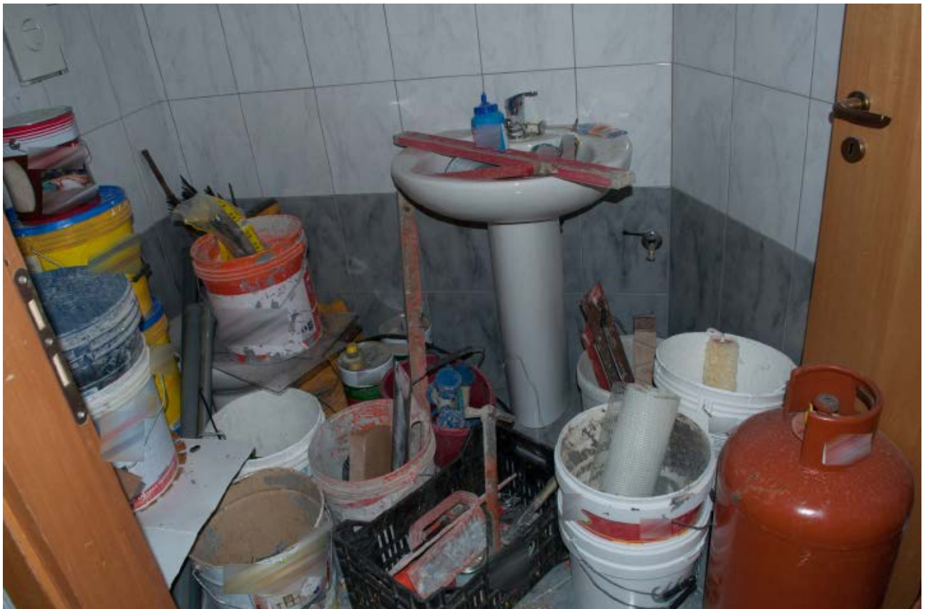
Foto n. 15 - vista dell'interno Bene n.1: il WC con lavabo e water