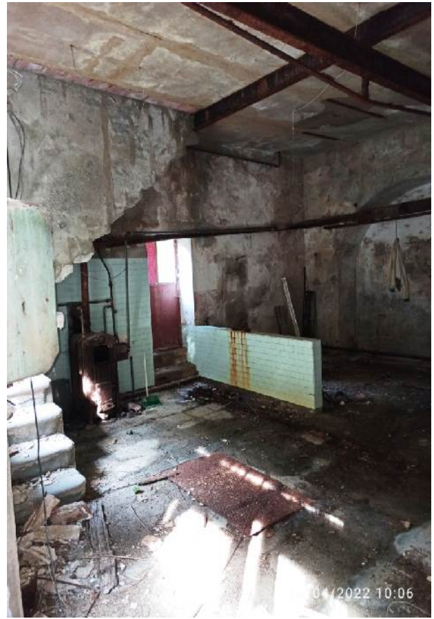
Foto 8-9+10 – fabbricato -fg,3-part,480 sub,500-501-502 - vista degli interni