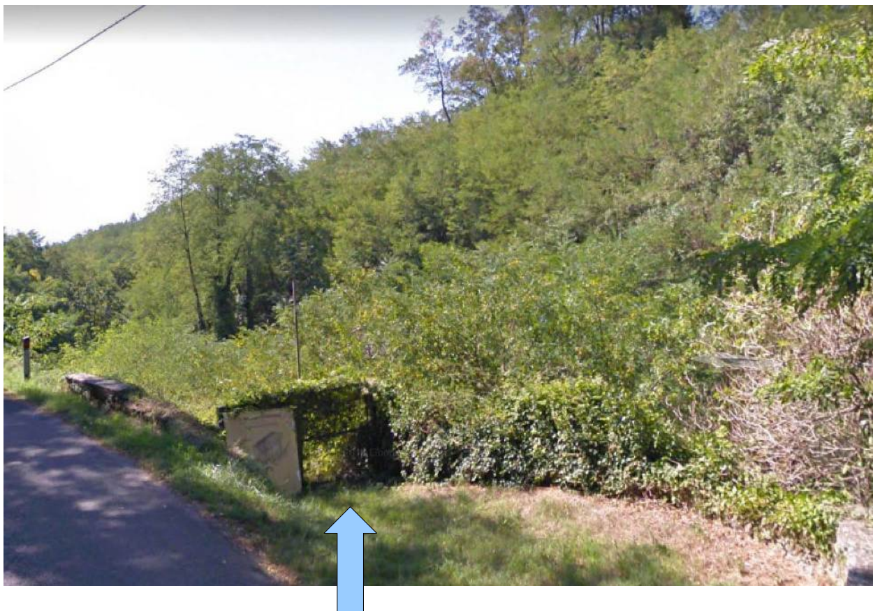
Foto 1 – accesso dalla strada S,Amato-la freccia indica il cancello