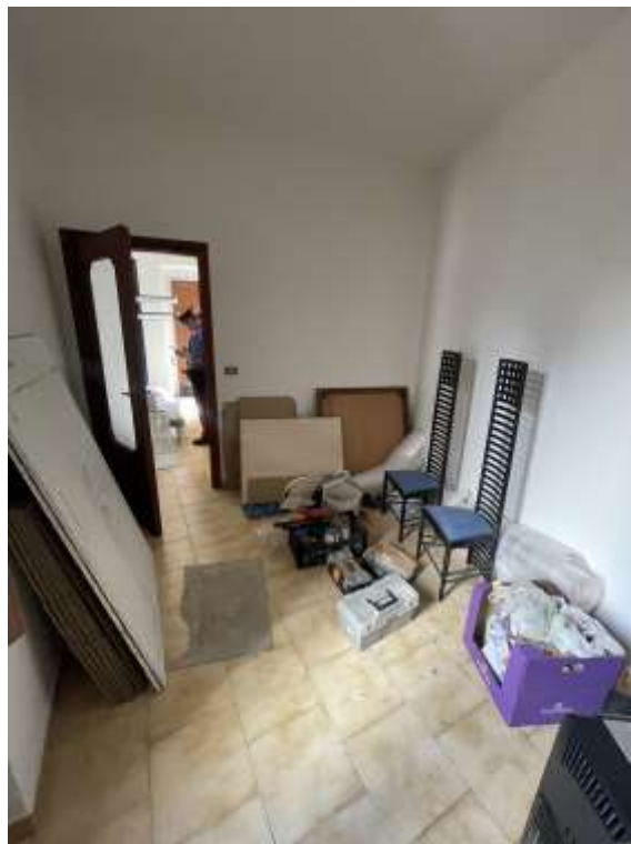
FOTO 11 - interni