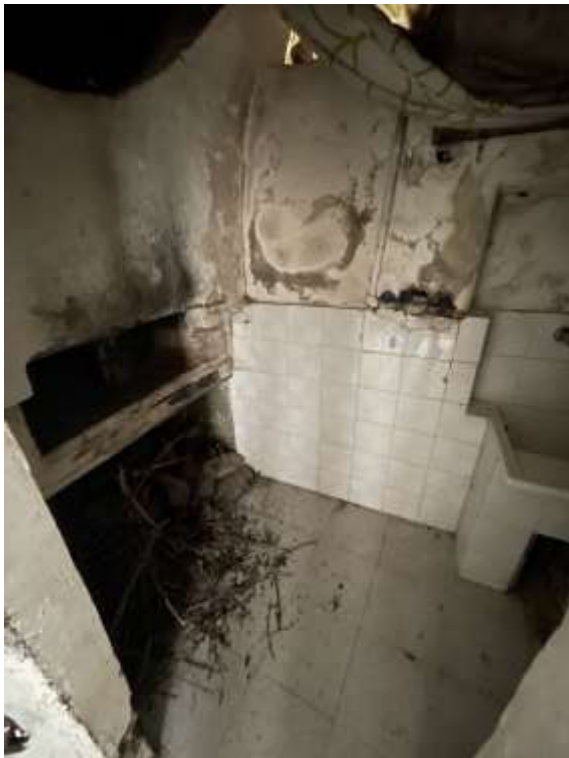
FOTO 08 - interni