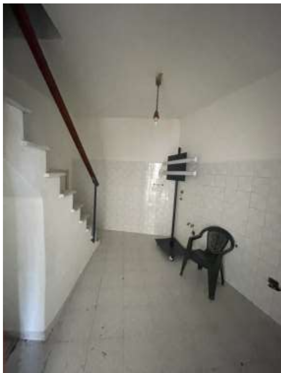
FOTO 12 - interni