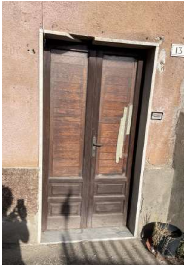
FOTO 03 - ingresso secondario