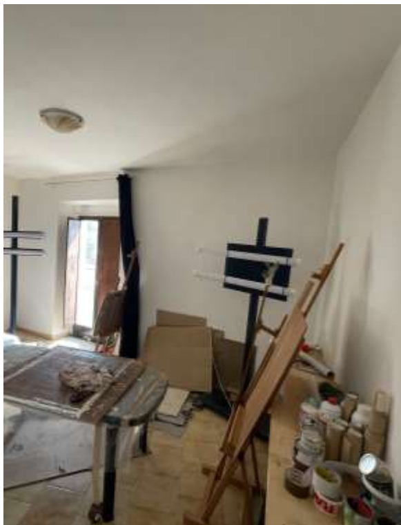
FOTO 10 - interni