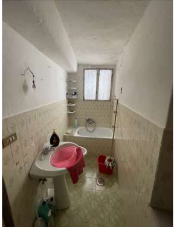
FOTO 07 - interni