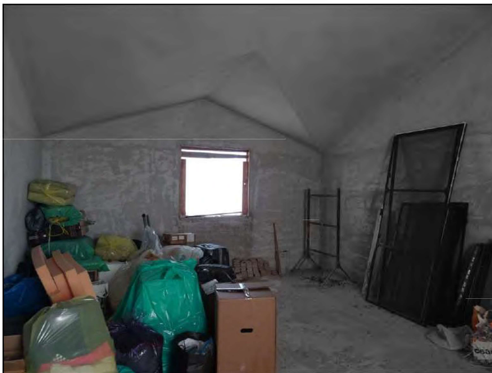
Vista locale di sgombero affaccio a nord-ovest.