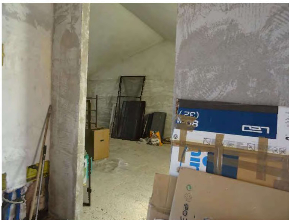
Vista ingresso al locale di sgomero.