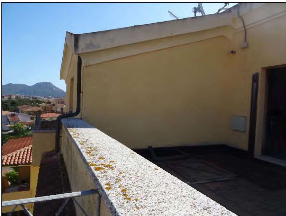
Vista lastrico solare nord -ovest.