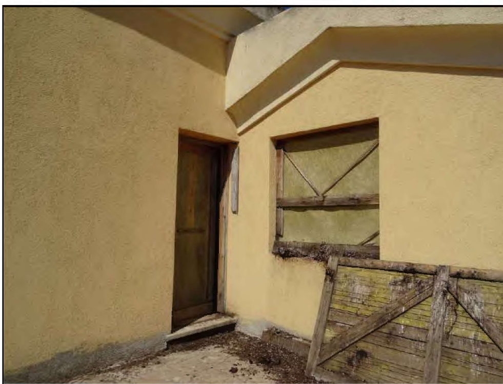
Vista affacci su lastrico solare lato sud-est.