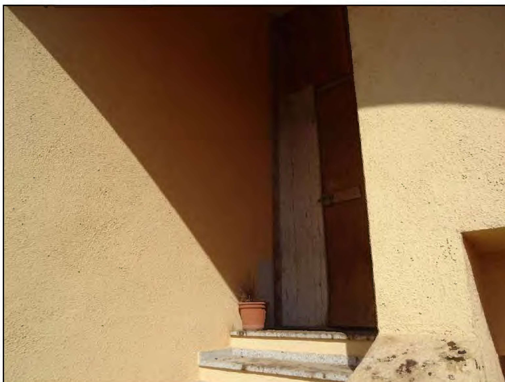
Vista accesso al pianerottolo d'accesso all'immobile in oggetto.