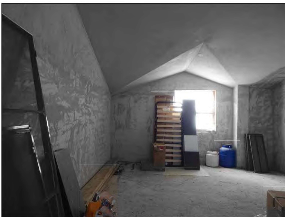
Vista locale di sgombero affaccio sul lastrico solare lato sud-est.