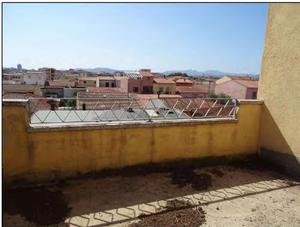
Vista su lastrico solare lato sud-est.