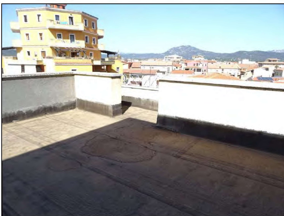
Vista lastrico solare lato nord -ovest.