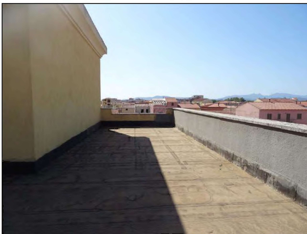
Vista lastrico solare lato ovest.