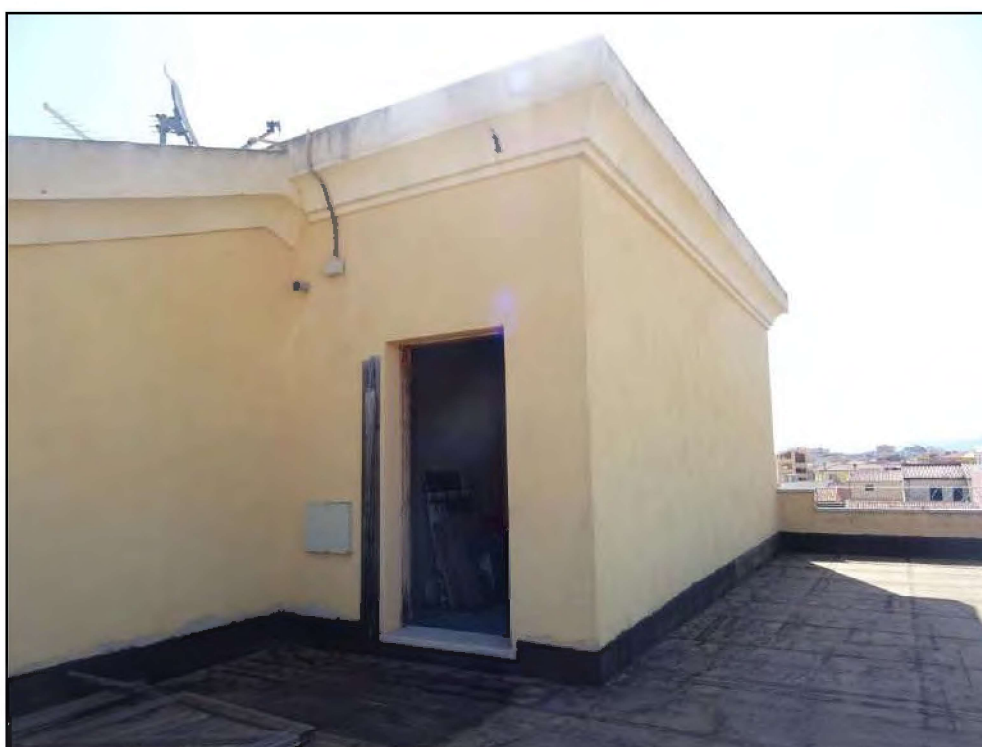
Vista uscita sul lastrico solare lato nord -ovest.