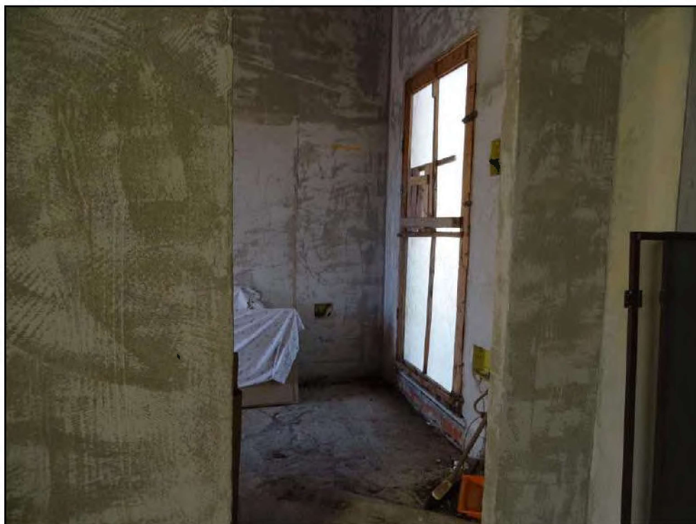
Vista accesso al lastrico solare lato ovest.