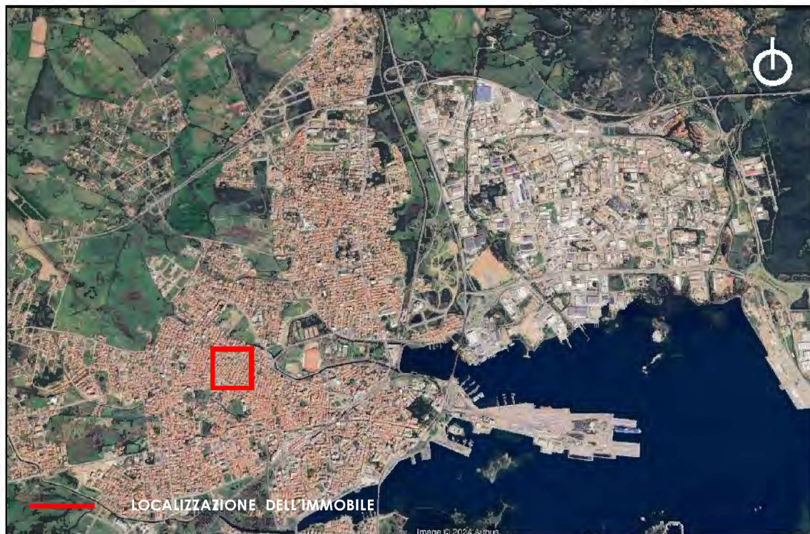
Aerofoto di Olbia con ubicazione dell'immobile oggetto di perizia.