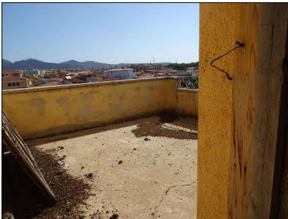
Vista lastrico solare lato sud-est.