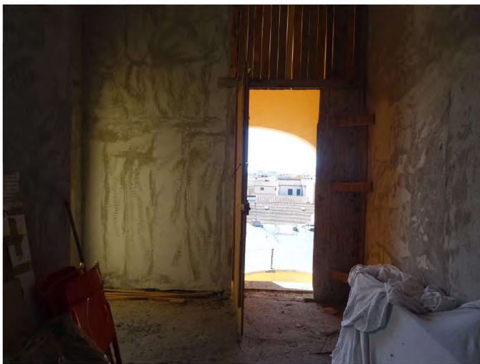
Vista accesso dal vano scale.