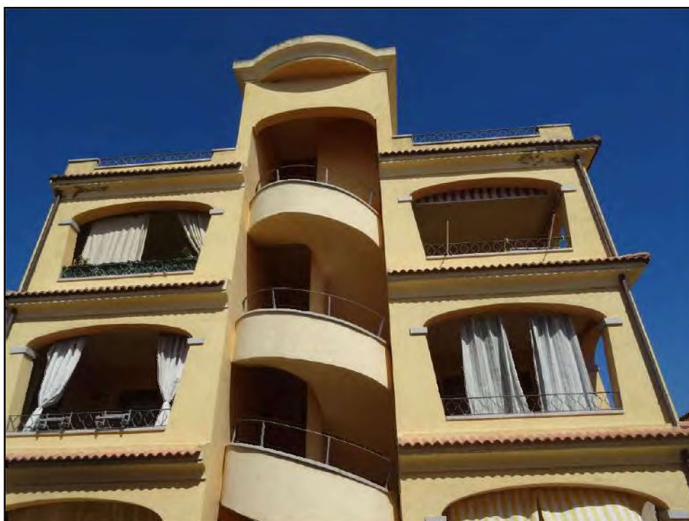
Facciata palazzina su via Cimarosa.