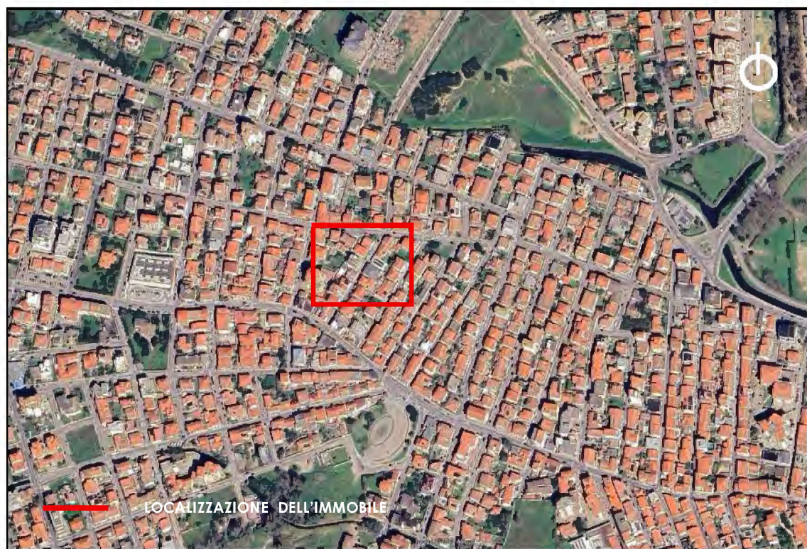
Aerofoto di Olbia con individuazione dell'immobile oggetto di perizia.