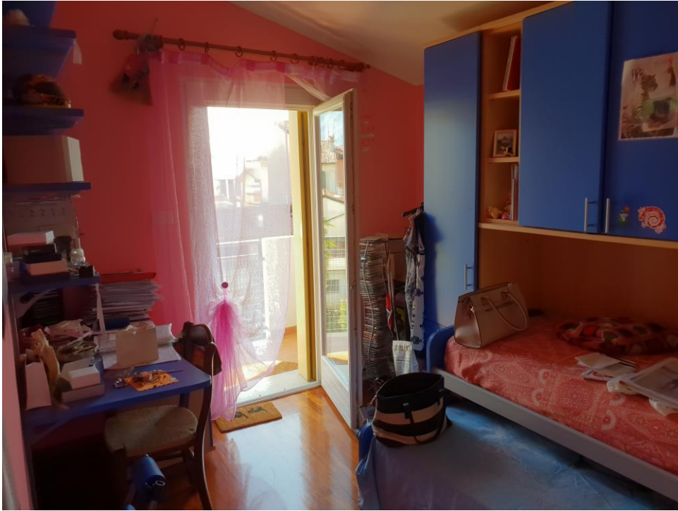
Foto n° 19 – vista camera a est con accesso al terrazzo a nord-est