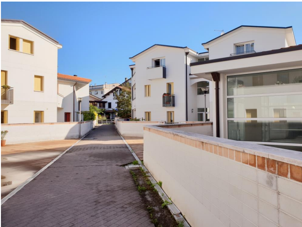
Foto n° 2 – vista accesso pedonale da sud, attraverso l'area comune