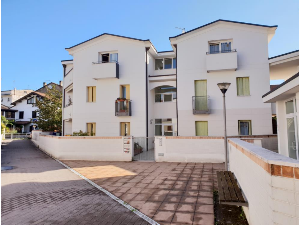
Foto n° 3 – vista da sud della porzione nord del Condominio “I Portici”