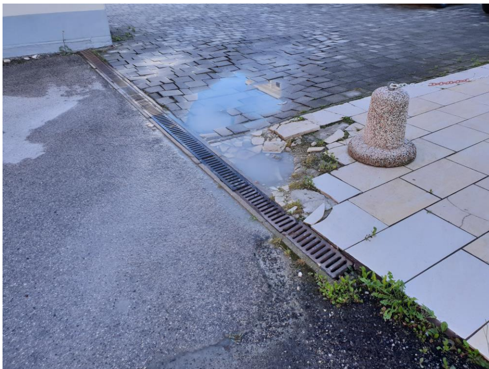
Foto n° 8 – particolare pavimentazione danneggiata nell'area esterna condominiale