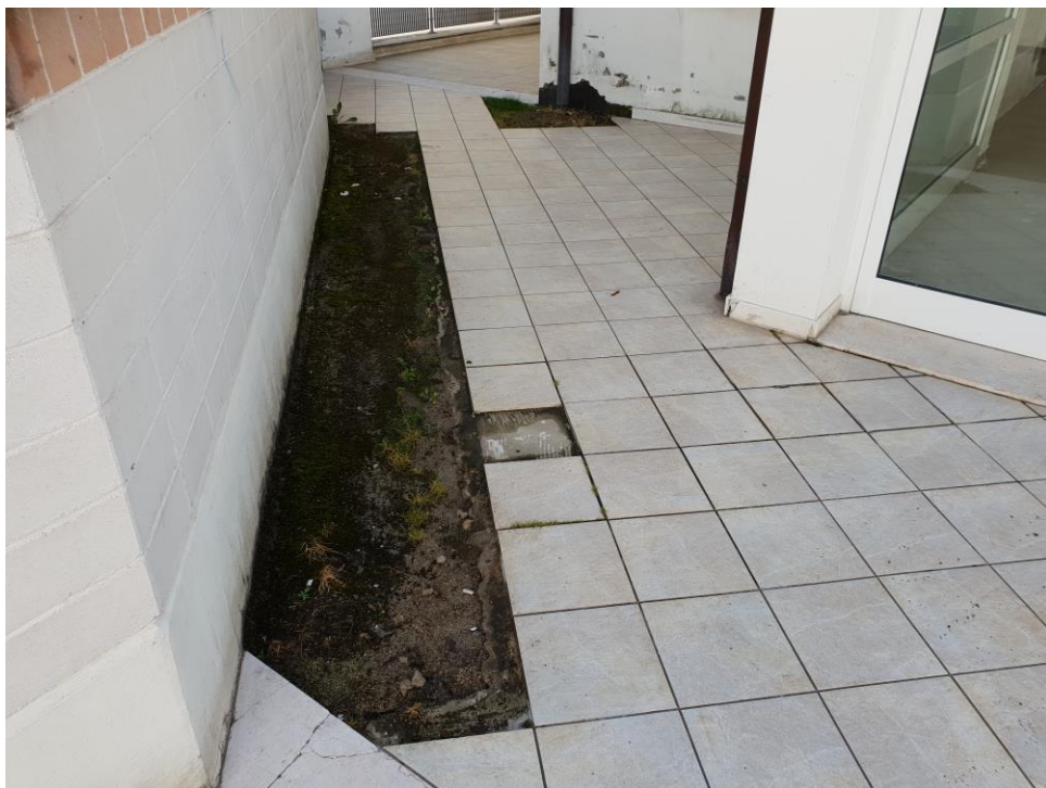
Foto n° 10 – particolare pavimentazione dell'area comune di accesso