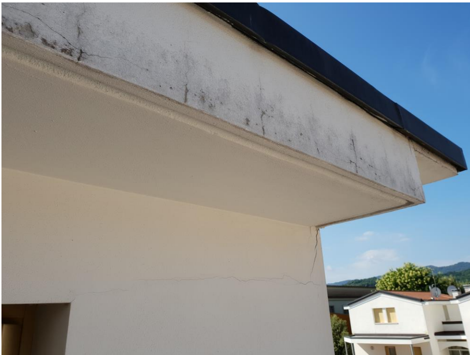
Foto n° 32 – particolare macchie, scrostamento e fessurazioni sull'intonaco