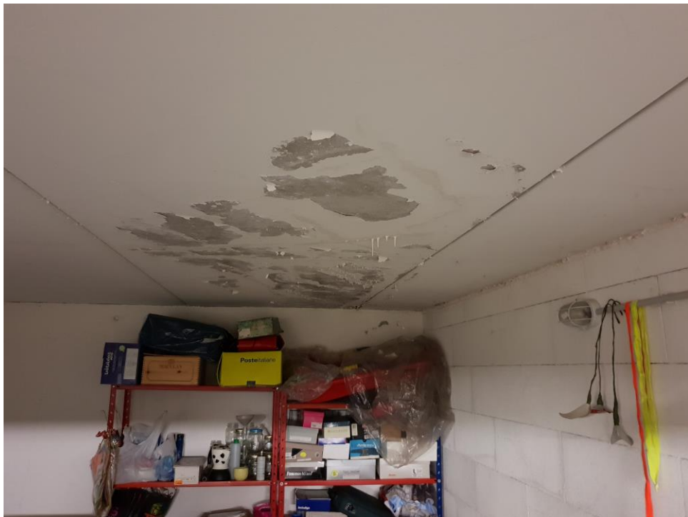
Foto n° 43 – particolare esfoliazione dell'intonaco a causa di infiltrazioni