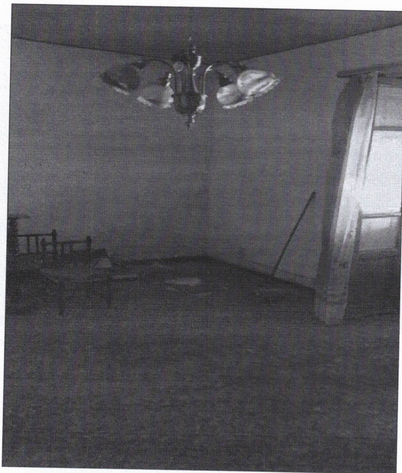
Foto 8: vano pranzo - appartamento p. T, via P. Novelli (lotto 24 sc. B) - Trapani.