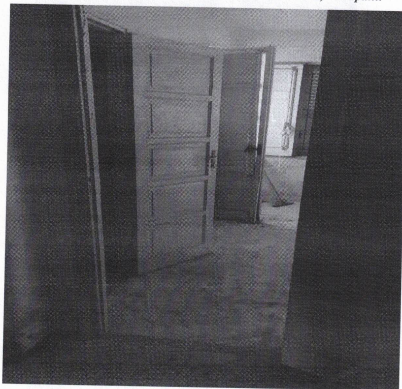
Foto 9: vano Cucina - appartamento p. T, via P. Novelli (lotto 24 sc. B) - Trapani.