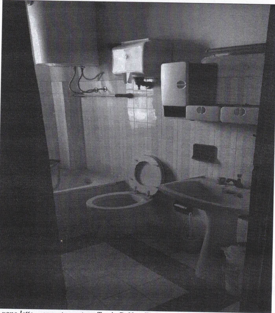
Foto 12: vano letto - appartamento p. T, via P. Novelli (lotto 24 sc. B) - Trapani