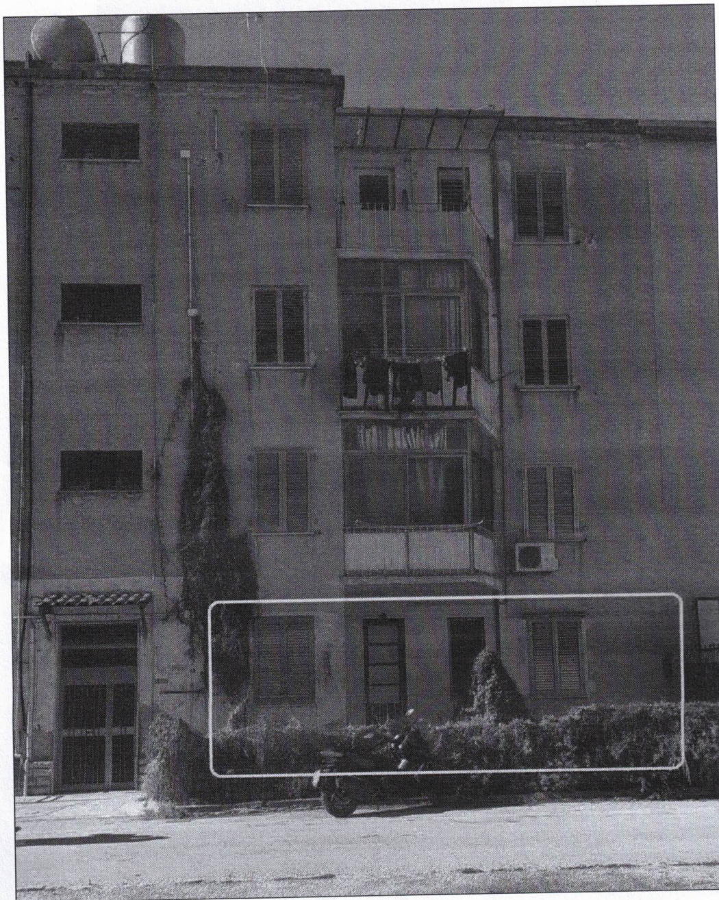
Foto 5: Panoramica prospetto principale - appartamento p.T, via P. Novelli (lotto 24 sc. B) - Trapani.