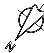
PLANIMETRIA STATO ATTUALE SCALA 1:200