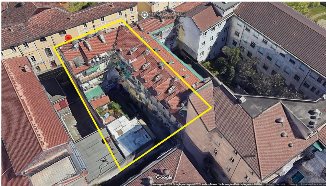
Toponomastica di zona 3D

Il condominio e le relative parti comuni, presentano sinteticamente le seguenti caratteristiche (Foto 1÷8), tipiche delle vecchie costruzioni risalenti ai primi decenni del secolo scorso: